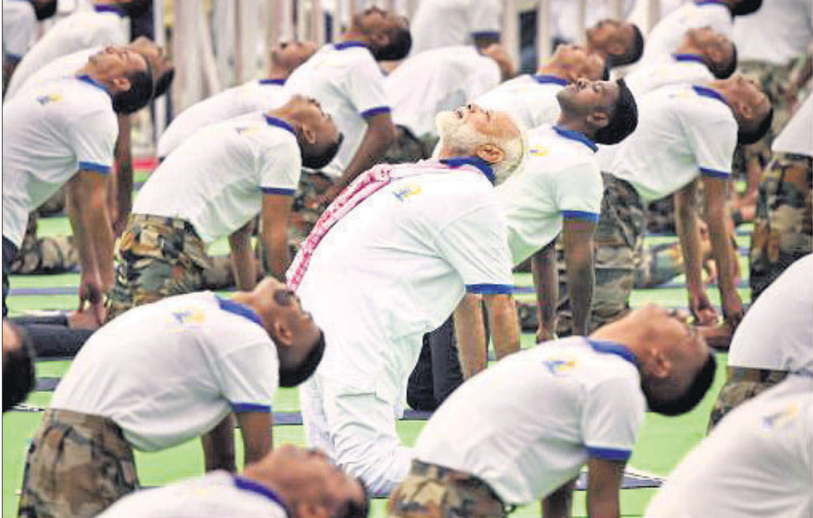
ରାଷ୍ଟ୍ର ପ୍ରଭାତ ତାରା ମେଦାନରେ ପ୍ରଧାନମନ୍ତ୍ରୀ ନରେନ୍ଦ୍ର ମୋଦି ଅନ୍ୟମାନଙ୍କ ସହ ଯୋଗ କରୁଛନ୍ତି ।