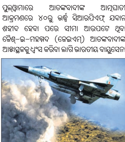
ଫେବୃୟାରୀ ୨୭ରେ ବାଲାକୋଟ୍‌ରେ ଏୟାରଷ୍ଟ୍ରିଲିଂ କୋଡ୍ ଓଡ଼ିଆ ଥିଲା । ଏଥିରେ ବାୟୁସେନାର ୧୨ଟି ଲଠୁଆ

ବିମାନ ମିରାଜ୨୦୦୦ ନିୟୋଜିତ ହୋଇଥିଲେ । ଗୋପନୀୟତା ରକ୍ଷା ଲାଗି ଉକ୍ତ କାର୍ଯ୍ୟାଳୟରେ ସାଙ୍କେତିକ ନାଁ 'ଅପରେଶନ୍ ବନ୍ଦର(ନାକ୍‌ଡ)' ରଖାଯାଇଥିଲା ବୋଲି ଜଣାପଡିଛି । ସାମରିକ କାର୍ଯ୍ୟାଳୟର ସମ୍ପର୍କରେ ପୂର୍ବରୁ ଯେପରି କୌଣସି ସୂଚନା ନ ମିଳିବ ସେଥିପାଇଁ ଏଭଳି ନାମକରଣ କରାଯାଇଥିଲା ବୋଲି ପ୍ରତିରକ୍ଷା ବିଭାଗର ଜଣେ ବରିଷ୍ଠ ଅଧିକାରୀ କହିଛନ୍ତି । ନାମକରଣ ପଛର ନିର୍ଦ୍ଦିଷ୍ଟ କାରଣ ସମ୍ପର୍କରେ ସବିଶେଷ ତଥ୍ୟ ନ ଦେଇ ସେ କହିଛନ୍ତି, ଭାରତୀୟ ସ୍ୱତନ୍ତ୍ର ସଂସ୍କୃତିରେ ବାନରମାନେ ସ୍ୱତନ୍ତ୍ର ସ୍ଥାନ ନେଇଛନ୍ତି । ରାମାୟଣରେ ହନୁମାନ ଭଗବାନ ରାଜ୍ୟ ପୁଷ୍ୟ ସହଯୋଗୀ ଥିଲେ ଓ ଲଙ୍କାରେ ପ୍ରବେଶ କରି ଏହାକୁ ଧ୍ୱଂସ କରିଦେଇଥିଲେ ବୋଲି ସେ କହିଛନ୍ତି । ୨୭ ତାରିଖ ରାତି ସାଢ଼େ ୩ଟାରେ ବାୟୁସେନା ପାଇଲଟ୍ ବାଲାକୋଟ୍‌ରେ ପ୍ରବେଶ କରିଥିଲେ । ସେମାନେ ମିରାଜ ମୁକ୍ତିବିମାନକୁ ୫ଟି ସ୍ତ୍ରାଲକ୍‌୨୦୦୦ ବୋମା ନିକ୍ଷେପ କରି ଆତଙ୍କବାଦୀଙ୍କ ଶିବିରକୁ ଧ୍ୱଂସ କରିଦେଇଥିଲେ ।