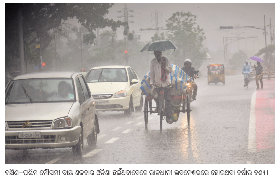
ବନ୍ଧିଶ-ପଶ୍ଚିମ ମୌସୁମୀ ବାୟୁ ଶୁକ୍ରବାର ଓଡ଼ିଶା ଛୁଇଁଥିବାବେଳେ ରାଜଧାନୀ ଭୁବନେଶ୍ୱରରେ ହୋଇଥିବା ବର୍ଷାର ଦୃଶ୍ୟ ।

ରାଜ୍ୟ ସଭା ନିର୍ବାଚନ ■ ବିଜେଡିରୁ ଅମର, ସମ୍ବିତ ■ ଭାଜପା ପ୍ରାର୍ଥୀ ହେଲେ ଅଶ୍ୱିନୀ ବୈଷ୍ଣବ ■ ପ୍ରଧାନମନ୍ତ୍ରୀଙ୍କ ଅନୁରୋଧ ରକ୍ଷା କଲେ ପୁଞ୍ଜ୍ୟମନ୍ତ୍ରୀ ତାଙ୍କ ସହ ନବୀନଙ୍କୁ ଭେଟାଭାଗରେ ପ୍ରମୁଖ ଭୂମିକା ନେଉଥିଲେ। ନିକଟରେ ସରିଥିବା ସାଧାରଣ ନିର୍ବାଚନ ପରେ ବିଜେଡି କେନ୍ଦ୍ର ସହ ଉତ୍ତମ ସମ୍ପର୍କ ରଖିବାକୁ ଚାହୁଁଥିବା ସ୍ପଷ୍ଟ ହୋଇଥିବା ସମୀକ୍ଷକମାନେ କହିଛନ୍ତି। ସେହିଭଳି ଦଳରେ