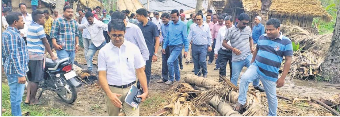
ସତ୍ୟବାଦୀ ବ୍ଲକ୍ କ୍ଷତିଗ୍ରସ୍ତ ଅଞ୍ଚଳ ବୁଲି ଦେଖୁଛନ୍ତି କେନ୍ଦ୍ରୀୟ ଟିମ୍ ।