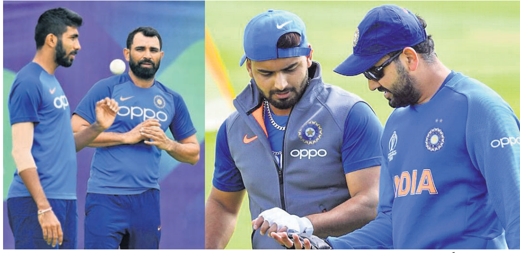
ଅଭ୍ୟାସ ସେସନ ଅବସରରେ ଯଶପ୍ରୀତ ବୁନୁରା ଓ ମହମ୍ମଦ ସାମି ଆଲୋଚନାରେ । ରିଷଭ ପଟ୍ଟ ଓ ରୋହିତ ଶର୍ମା ।

ଚଳିତ ବିଶ୍ୱକପର ଅନ୍ୟତମ ଫେଭୋରାଇଟ ଦଳ ଭାରତ ଚୂନିମେଣ୍ଟର ୨୮ତମ ମ୍ୟାଚରେ ଶନିବାର ଅପେକ୍ଷାକୃତ ଦୁର୍ବଳ ଆଫଗାନିସ୍ତାନକୁ ଭେଟିବା ଶ୍ଯାନୀୟ ରୋକ ବାଉଲ ଗ୍ରାଉଣ୍ଡରେ ଖେଳାଯିବାକୁ ଥିବା ଏହି ମ୍ୟାଚ ଏକତରଫା ହେବ ବୋଲି ଆଶା କରାଯାଉଛି ।