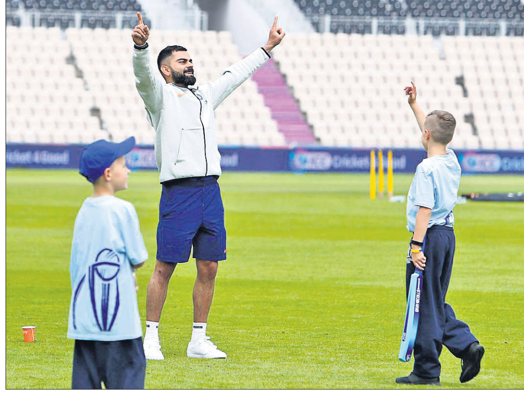
ସ୍କୁଲ ପିଲାଙ୍କ ସହ କ୍ରିକେଟ୍ ଖେଳୁଛନ୍ତି ଭାରତୀୟ ଅଧିନାୟକ ବିରାଟ କୋହଲି।