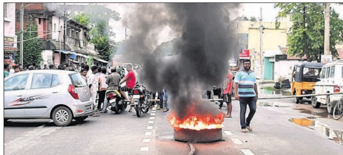
ବାୟାଦା ରୋଡ୍‌ରେ ଲୋକେ ଚାନ୍ଦିଆ ଚାନ୍ଦିଆ ଭାଙ୍ଗିବା ଦେଖିବାକୁ ମିଳିଛି।

୨୫୫ ଜଣ ପରୀକ୍ଷା ଦେଇଥିବା ବେଳେ ୨୫୫ ଜଣ ପାସ କରିଛନ୍ତି। ସେଥିରୁ ୧୫୫ ଜଣ ପ୍ରଥମଶ୍ରେଣୀରେ ୧୫୫, ଦ୍ଵିତୀୟ ଶ୍ରେଣୀରେ ୧୫୫, ତୃତୀୟ ଶ୍ରେଣୀରେ ୫୫୫ ଜଣ ପାସ କରିଛନ୍ତି।