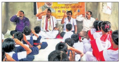
ଛାତ୍ରାଛାତ୍ରଙ୍କୁ ଯୋଗ ଶିକ୍ଷା ଦିଆଯାଉଛି।