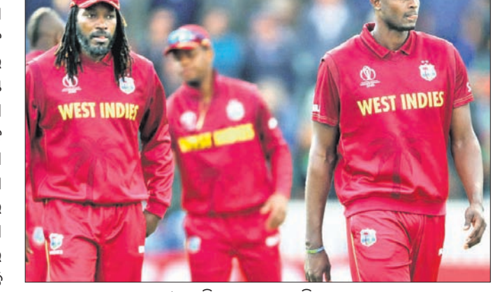
ଫ୍ରେଷ୍ଟଇଣ୍ଡିଜ ଦଳର ଖେଳାଳିମାନେ।

ଅପରପକ୍ଷରେ ନ୍ୟୁଜିଲାଣ୍ଡ ଏପର୍ଯ୍ୟନ୍ତ ଦମ୍ଭାବ ପ୍ରଦର୍ଶନ କରିଆସିଛି। ନ୍ୟୁଜିଲାଣ୍ଡର ଆମ୍‌ବିଷ୍ଟାଏ ଆକାଶକୁଆଁ ହୋଇଛି। ନ୍ୟୁଜିଲାଣ୍ଡ ଶ୍ରୀଲଙ୍କା, ବାଂଲାଦେଶ, ଆଫଗାନିସ୍ତାନ ଓ ଦକ୍ଷିଣ ଆଫ୍ରିକାକୁ ପରାସ୍ତ କରିଛି। ତେବେ ଭାରତ ବିପକ୍ଷ ମ୍ୟାଚ୍ ବର୍ଷା ଯୋଗୁ ବାତିଲ ହୋଇଥିଲା। ଏବେ ଏହି ଦଳ ପ୍ରକୃତ ପରାସ୍ତର ସମ୍ମୁଖୀନ ହେବ। ଫ୍ରେଷ୍ଟଇଣ୍ଡିଜ ସମେତ , ପାକିସ୍ତାନ, ଅଷ୍ଟ୍ରେଲିଆ ଓ ଇଂଲଣ୍ଡ ବିପକ୍ଷରେ ନ୍ୟୁଜିଲାଣ୍ଡ କଡ଼ା ସଂଗ୍ରହର ସମ୍ଭାବନା ରହିବ। ଗତ ମ୍ୟାଚ୍‌ରେ ଦକ୍ଷିଣ ଆଫ୍ରିକା ବିପକ୍ଷରେ ନ୍ୟୁଜିଲାଣ୍ଡ ଅଧିନାୟକ କେନ୍ ପ୍ରଦର୍ଶନ କରିଛନ୍ତି। ଶେଲଟନ କରେଜ, ଶାନ୍ତ ଗାନ୍ତ୍ରୀଏଲ ଓ ଓଶେନ ଥୋମାସଙ୍କୁ ପ୍ରଦର୍ଶନରେ ଭକ୍ତି ଆଣିବାକୁ ହେବ।