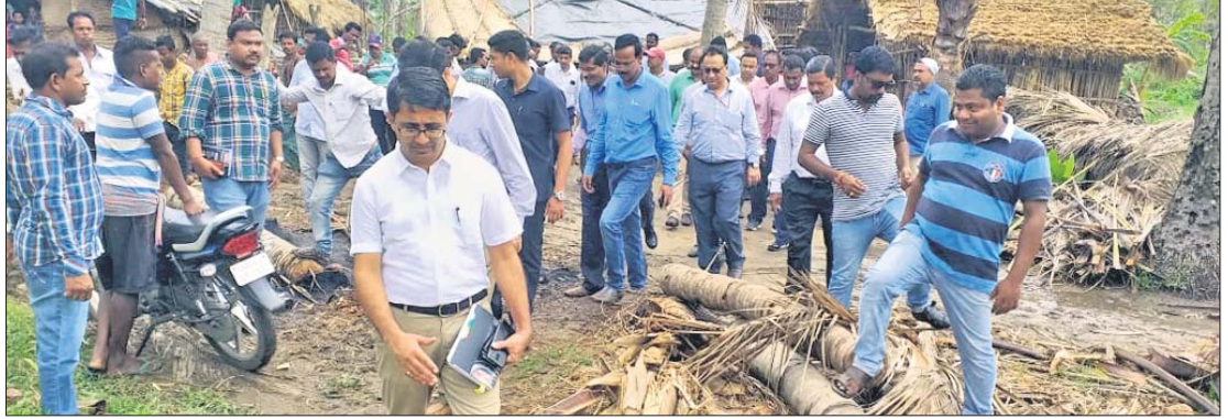
ସତ୍ୟବାଦୀ ବ୍ଲକ୍ କ୍ଷତିଗ୍ରସ୍ତ ଅଞ୍ଚଳ ବୁଲି ଦେଖିଛନ୍ତି କେନ୍ଦ୍ରୀୟ ଟିମ୍।

ପୁରୀ ଅଫିସ/ସାକ୍ଷୀଗୋପାଳ, ୨୧।୬(ଶି.ବନ୍ଧୁ.ଏ.) ବାତ୍ୟାରେ ସବୁଠୁ ଅଧିକ କ୍ଷତିଗ୍ରସ୍ତ ହୋଇଥିବା ପୁରୀ ଜିଲ୍ଲା ଗସ୍ତ କରିଛନ୍ତି କେନ୍ଦ୍ରୀୟ ଟିମ୍।