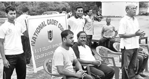
କେଏସପି କଲେଜରେ ଯୋଗ କାର୍ଯ୍ୟକ୍ରମ।