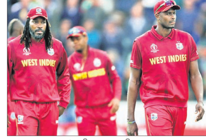
ଫ୍ରେଷ୍ଟଇଣ୍ଡିଜ ଦଳର ଖେଳାଳିମାନେ।

ବିଶ୍ୱକପରେ ଶନିବାର ଖେଳାଳିମାନଙ୍କୁ ଥିବା ବିପତ୍ତି ମ୍ୟାଚ୍ରେ ଫ୍ରେଷ୍ଟଇଣ୍ଡିଜ ପରସ୍ପରକୁ ଭେଟିବେ। ଚୁନାବଳରେ ଏହି ୨୯ତମ ମ୍ୟାଚ୍ରେ ଫ୍ରେଷ୍ଟଇଣ୍ଡିଜ ଫେଡରାଲର୍ ବିବେଚିତ ହେଉଛି। ଅନ୍ୟପକ୍ଷେ ଏହି ମ୍ୟାଚ୍ ଫ୍ରେଷ୍ଟଇଣ୍ଡିଜ ପାଇଁ କର ବା ମର ପରିସ୍ଥିତି ସୃଷ୍ଟି କରିଛି। ବିଶ୍ୱକପରେ ଫ୍ରେଷ୍ଟଇଣ୍ଡିଜ ତା'ର ପ୍ରଥମ ମ୍ୟାଚ୍ରେ ପାକିସ୍ତାନକୁ ୧ ଉଇକେଟରେ ପରାସ୍ତ କରି ଜବରଦସ୍ତ ଆରମ୍ଭ କରିଥିଲା। ତେବେ ଏହାପରଠାରୁ ଫ୍ରେଷ୍ଟଇଣ୍ଡିଜ ପ୍ରଦର୍ଶନରେ କ୍ରମାଗତ ଭାବେ ଅବନତି ହୋଇଛି। ଦଳ ବିଜୟରୁ ଅଭିଯାନ ଆରମ୍ଭ କରିବା ପରେ ଅଷ୍ଟ୍ରେଲିଆ, ଇଂଲଣ୍ଡ ଓ ବାଂଲାଦେଶଠାରୁ ପରାସ୍ତ ହୋଇ ୩ଟି ପରାଜୟ ବରଣ କରିଛି। ଦକ୍ଷିଣ ଆଫ୍ରିକା ବିପକ୍ଷ ମ୍ୟାଚ୍ ବର୍ଷା କାରଣରୁ ବାତିଲ ହେବା ପରେ ଫ୍ରେଷ୍ଟଇଣ୍ଡିଜ ଗୋଟିଏ ପଏଣ୍ଟ୍ ପାଇଥିଲା। ଏପର୍ଯ୍ୟନ୍ତ ଫ୍ରେଷ୍ଟଇଣ୍ଡିଜ ୫ଟି ମ୍ୟାଚ୍ ଖେଳି ଗୋଟିଏ ବିଜୟ, ୩ ପରାଜୟ ଓ ଗୋଟିଏ ବିନା ଫଳାଫଳ ସହ ୩ ପଏଣ୍ଟ୍ ପାଇ ତାଲିକାର ସପ୍ତମ ସ୍ଥାନରେ ରହିଛି। ଅପରପକ୍ଷରେ ନ୍ୟୁଜିଲାଣ୍ଡ ୫ଟି ମ୍ୟାଚ୍ ଖେଳି ୪ଟି ବିଜୟ ଓ ଗୋଟିଏ ବିନା ଫଳାଫଳ ସହ ୯ ପଏଣ୍ଟ୍ ପାଇ ଅଷ୍ଟ୍ରେଲିଆ ପଛରୁ ରହି ତାଲିକାର ତୃତୀୟ ସ୍ଥାନରେ ରହିଛି।