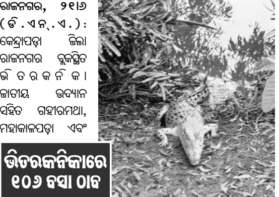
ରାଜନଗର, ୨୧.୬ (ଡି.ଏ.ଏ.ଏ.): କେନ୍ଦ୍ରାପଡ଼ା ଜିଲ୍ଲା ରାଜନଗର ବ୍ଲକ୍‌ରେ ରେକର୍ଡ କଲେ ବଉଳା କୁମ୍ଭୀର ।

ରାଜନଗର ବନାଞ୍ଚଳ ଠାଏ କରାଯାଇଥିବା ବଉଳା କୁମ୍ଭୀର ବସା । ଅଧୀନରେ ପ୍ରାୟ ୧୦୦ ବସା ରହିଛି । ରାଜନଗର ବନାଞ୍ଚଳରେ ବଉଳା କୁମ୍ଭୀରଙ୍କ ୧୦୬ ବସା ଚିହ୍ନଟ କରାଯାଇଛି । ଭିତରକନିକାରେ ପ୍ରାଥମିକରେ ପାଇଁ ବଉଳା କୁମ୍ଭୀରମାନେ ଶହେରୁ ଊର୍ଦ୍ଧ୍ୱ ବସାରେ ଅଣ୍ଟା ଦେଇ ରେକର୍ଡ ପୂର୍ଣ୍ଣ କରିଛନ୍ତି । କନିକା ରେଞ୍ଜ ଅଞ୍ଚଳରେ ୯୨ଟି କୁମ୍ଭୀର ବସା ଚିହ୍ନଟ ହୋଇଥିବାବେଳେ ରାଜନଗର ରେଞ୍ଜ ଅଞ୍ଚଳରେ ୧୦, ରହାରମଥା ରେଞ୍ଜ ଅଞ୍ଚଳରେ ୩ ଓ ମହାକାଳପଡ଼ା ରେଞ୍ଜ ଅଞ୍ଚଳରେ ଗୋଟିଏ କୁମ୍ଭୀର ବସା ଚିହ୍ନଟ କରାଯାଇଥିବା ବନବିଭାଗ ପୁସ୍ତକ ପ୍ରକାଶ । ତେବେ ଏହି ବସାଗୁଡ଼ିକ ଭିତରକନିକା ଫରେଷ୍ଟ ବ୍ଲକ୍ ଓ ଡାକ୍ତାମାଳ ଫରେଷ୍ଟ ବ୍ଲକ୍‌ରେ ରଖାଯାଇଥିବା ବେଳେ, ଶୁଆପୋର, ଚିତ୍ରାମଣିମହାନ୍ତି ଯୋର, ଭିତରକନିକା, ଡାକ୍ତାମାଳ ଓ ଯେମେତ ରାଜନଗର ଓ ମହାକାଳପଡ଼ା ରେଞ୍ଜ ଅଞ୍ଚଳରେ ଠାଏ କରାଯାଇଛି । ପୁରୀରୁ ଆସି, ପ୍ରତିବର୍ଷ ମେ ରୁ ଜୁଲାଇ ମାସ ମଧ୍ୟରେ ମା' ବଉଳା କୁମ୍ଭୀରମାନେ ବସା କରି ଅଣ୍ଟା ଦେବା ସହିତ ଅଣ୍ଟାରୁ ଛୁଆ ପୁଟାଇଥାନ୍ତି । ପ୍ରତ୍ୟେକ ମା' କୁମ୍ଭୀର ୪୦ ରୁ ୫୦ଟି ଅଣ୍ଟାଦେଇଥାନ୍ତି । ଅଣ୍ଟା ଦେବାର ୨୫ ଦିନ ମଧ୍ୟରେ ଅଣ୍ଟାରୁ ଛୁଆ ବାହାରିଥାଏ । ଏହି ସମୟରେ କୁମ୍ଭୀରଗୁଡ଼ିକ ଅତ୍ୟଧିକ ହିସ୍ତ ହୋଇ ଉଠାନ୍ତି । ଏଥିପାଇଁ ପ୍ରତିବର୍ଷ ମେ ୧୨ରୁ ଜୁଲାଇ ୩୧ ତାରିଖ ପର୍ଯ୍ୟନ୍ତ ପର୍ଯ୍ୟଟକଙ୍କ ପାଇଁ ଜାତୀୟ ଉଦ୍ୟାନ ବନ୍ଦ ରଖାଯାଇଥାଏ ।