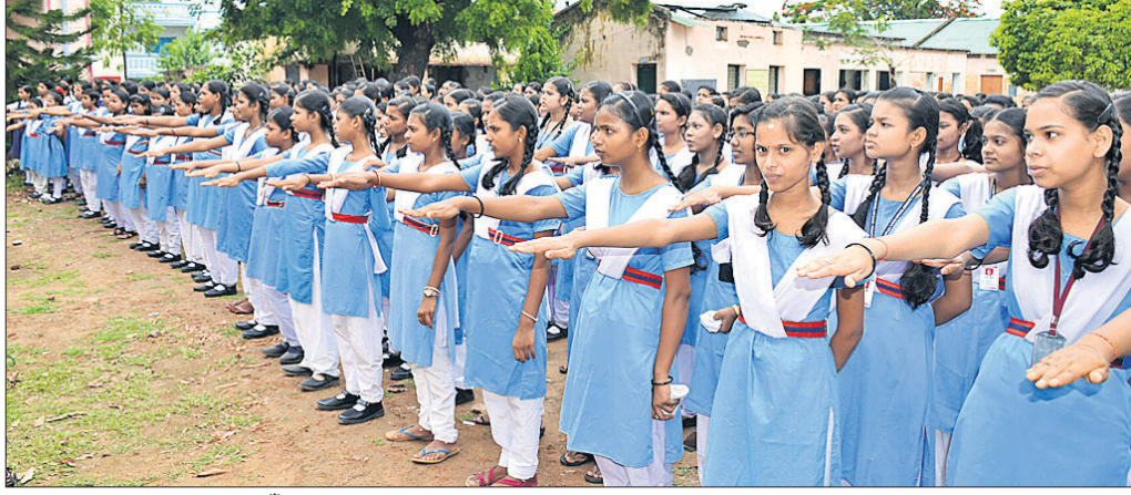
ପଲିଥିନ ମୁକ୍ତ ଗଞ୍ଜାମ ଜିଲା ପାଇଁ ଛାତ୍ରାଛାତ୍ରୀମାନେ ଶପଥ ନେଇଛନ୍ତି।