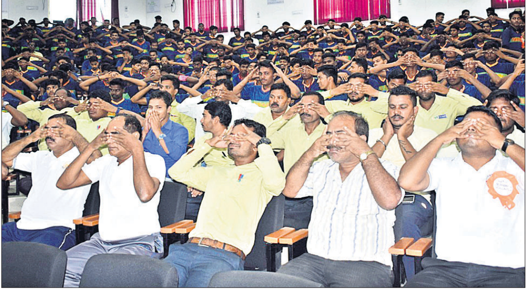
ଆଇଟିଆଇ ପରିସରରେ ଛାତ୍ରାଛାତ୍ରୀ ଓ କର୍ମଚାରୀ ଯୋଗାଭ୍ୟାସ କରୁଛନ୍ତି।