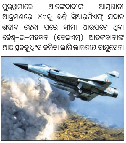
ଫେବୃୟାରୀ ୨୭ରେ ବାଲାକୋଟ୍‌ରେ ଏୟାରଷ୍ଟ୍ରିଲିକ୍‌ର କୋଡ୍ ଥିଲା । ଏଥିରେ ବାୟୁସେନାର ୧୨ଟି ଲକ୍ଷ୍ମୀ

ବିମାନ ମିରାଜ୨୦୦୦ ନିୟୋଜିତ ହୋଇଥିଲେ । ଗୋପନୀୟତା ରକ୍ଷା ଲାଗି ଉକ୍ତ କାର୍ଯ୍ୟାଳୟର ସାଙ୍କେତିକ ନାଁ 'ଅପରେଶନ୍ ବନ୍ଦର(ମାକ୍‌ଡ)' ରଖାଯାଇଥିଲା ବୋଲି ଜଣାପଡିଛି । ସାମରିକ କାର୍ଯ୍ୟାଳୟର ସମ୍ପର୍କରେ ପୂର୍ବରୁ ଯେପରି କୌଣସି ସୂଚନା ନ ମିଳିବ ସେଥିପାଇଁ ଏଭଳି ନାମକରଣ କରାଯାଇଥିଲା ବୋଲି ପ୍ରତିରକ୍ଷା ବିଭାଗର ଜଣେ ବରିଷ୍ଠ ଅଧିକାରୀ କହିଛନ୍ତି । ନାମକରଣ ପଛର ନିର୍ଦ୍ଦିଷ୍ଟ କାରଣ ସମ୍ପର୍କରେ ସବିଶେଷ ତଥ୍ୟ ନ ଦେଇ ସେ କହିଛନ୍ତି, ଭାରତୀୟ ମୁକ୍ତ ସଂସ୍କୃତିରେ ବାନରମାନେ ସ୍ୱତନ୍ତ୍ର ଗ୍ଳାନ ନେଇଛନ୍ତି । ରାମାୟଣରେ ହନୁମାନ ଭଗବାନ ରାଜ୍ୟ ପୁଷ୍ୟ ସହଯୋଗୀ ଥିଲେ ଓ ଲଙ୍କାରେ ପ୍ରବେଶ କରି ଏହାକୁ ଧ୍ୱଂସ କରିଦେଇଥିଲେ ବୋଲି ସେ କହିଛନ୍ତି । ୨୭ ତାରିଖ ରାତି ସାଢ଼େ ୩ଟାରେ ବାୟୁସେନା ପାଇଲଟ୍ ବାଲାକୋଟ୍‌ରେ ପ୍ରବେଶ କରିଥିଲେ । ସେମାନେ ମିରାଜ ମୁକ୍ତବିମାନକୁ ୫ଟି ସ୍ତ୍ରାଲକ୍‌୨୦୦୦ ବୋମା ନିକ୍ଷେପ କରି ଆତଙ୍କବାଦୀଙ୍କ ଶିବିରକୁ ଧ୍ୱଂସ କରିଦେଇଥିଲେ ।