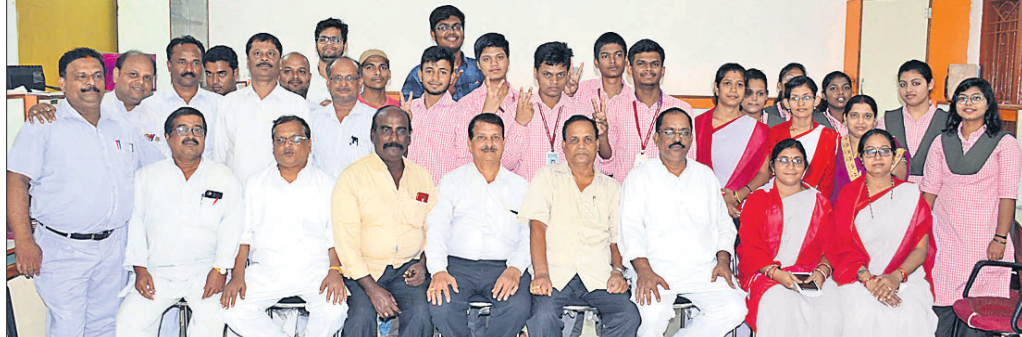
ଆଚାର୍ଯ୍ୟ ଆଚାର୍ଯ୍ୟଙ୍କ ଗହଣରେ ସଫଳ ଛାତ୍ରାଛାତ୍ରୀମାନେ।