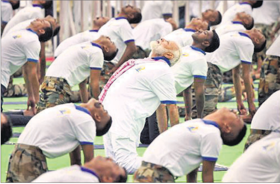
ରାଷ୍ଟ୍ର ପ୍ରଭାତ ତାରା ମୈଦାନରେ ପ୍ରଧାନମନ୍ତ୍ରୀ ନରେନ୍ଦ୍ର ମୋଡି ଅନ୍ୟମାନଙ୍କ ସହ ଯୋଗ କରୁଛନ୍ତି ।