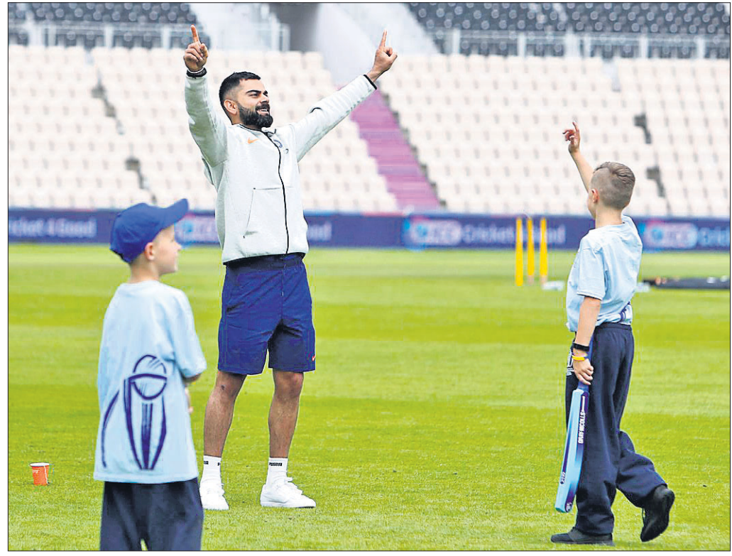
ସ୍କୁଲ ପିଲାଙ୍କ ସହ କ୍ରିକେଟ୍ ଖେଳୁଛନ୍ତି ଭାରତୀୟ ଅଧିନାୟକ ବିରାଟ କୋହଲି।

ସାଉଥାମପ୍ଟନ୍, ୨୧୧୭ ସ୍କୁଲ ଶିଳ୍ପିଙ୍କ ସ୍କୁଲର ୩୦ ଛାତ୍ରଛାତ୍ରୀଙ୍କୁ ଲାଗି ଗୁରୁବାର ଥିଲା ସ୍ୱତନ୍ତ୍ର ଦିନ। କାରଣ ଭାରତୀୟ କ୍ରିକେଟ୍ ଦଳର ଅଧିନାୟକ ତଥା ନଂ ୧ ଦିନିକିଆ ବ୍ୟାଟ୍ସମ୍ୟାନ ବିରାଟ କୋହଲି ସେମାନଙ୍କ ସହ ଖେଳିଥିଲେ। ଇଂଲଣ୍ଡ ଓ ଫ୍ରେଜ୍