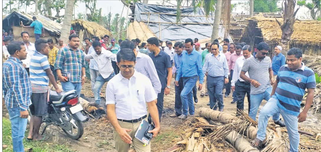
ସତ୍ୟବାଦୀ ବ୍ଲକର କ୍ଷତିଗ୍ରସ୍ତ ଅଞ୍ଚଳ ବୁଲି ଦେଖୁଛନ୍ତି କେନ୍ଦ୍ରୀୟ ଟିମ୍।