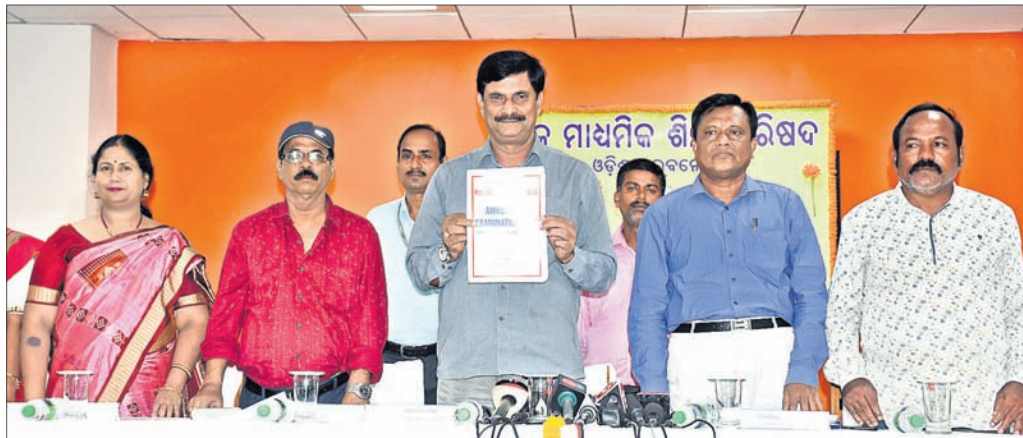
ପରାମର୍ଶାତ୍ମକ ପୁସ୍ତିକା ଉନ୍ମୋଚନ କରୁଛନ୍ତି ବିଦ୍ୟାଳୟ ଓ ଗଣଶିକ୍ଷା ବିଭାଗ ମନ୍ତ୍ରୀ ସମୀର ରଞ୍ଜନ ଦାଶ।