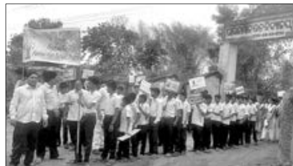
ଯୋଗ ଦିବସରେ ପାରଳମାନଙ୍କର ଶାନ୍ତିଯାତ୍ରାରେ ଶୋଭାଯାତ୍ରାରେ ବାହାରିଛନ୍ତି ।