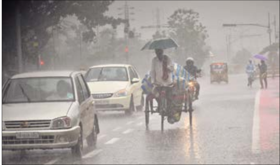
ଦକ୍ଷିଣ-ପଶ୍ଚିମ ମୌସୁମୀ ବାୟୁ ଶୁକ୍ରବାର ଓଡ଼ିଶା ଛୁଇଁଥିବାବେଳେ ରାଜଧାନୀ ଭୁବନେଶ୍ୱରରେ ହୋଇଥିବା ବର୍ଷାର ଦୃଶ୍ୟ ।

ତାଙ୍କ ସହ ନବୀନଙ୍କୁ ଭୋଟଦାତାରେ ପ୍ରମୁଖ ଭୂମିକା ନେଇଥିଲେ। ନିକଟରେ ସରିଥିବା ସାଧାରଣ ନିର୍ବାଚନ ପରେ ବିଜେଡି କେନ୍ଦ୍ର ସହ ଉତ୍ତମ ସମ୍ପର୍କ ରଖିବାକୁ ଚାହୁଁଥିବା ସ୍ପଷ୍ଟ ହୋଇଥିବା ସମାନ୍ତରାଳରେ କହିଛନ୍ତି। ସେହିଭଳି ଦଳରେ ପୃଷ୍ଠା-୪