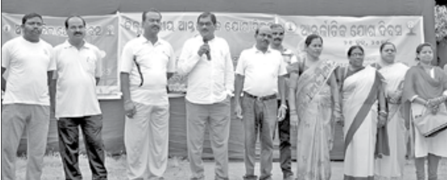
ସମ୍ବଲପୁର ଦୁର୍ଘାହାରୀ ଗାଉଁସ୍ ହାଲସ୍କୁଲରେ ଆୟୋଜିତ ଜିଲ୍ଲାପ୍ରସାର ଯୋଗ ଦିବସ ମହୋତ୍ସବରେ ଅତିଥିମାନେ ।