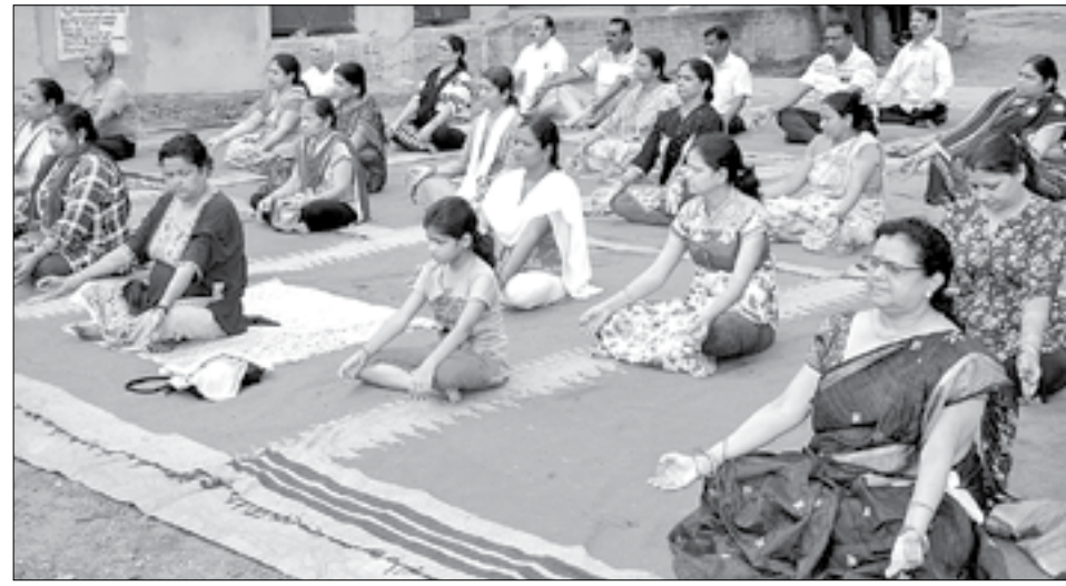
ସମ୍ବଲପୁର ଗୋବିନ୍ଦଚୋଲା ପଡ଼ିଆରେ ଯୋଗ ଶିବିର ।