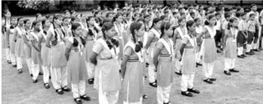
ସ୍କୁଲ ଖୋଲିଲା - ସମ୍ବଲପୁର ବୁଦ୍ଧାବନା ନୋଡାଲ ହାଇସ୍କୁଲ ପରିଆରେ ସ୍କୁଲ ଖୋଲିବା ପରେ ଛାତ୍ରାଛାତ୍ରୀ ପ୍ରାର୍ଥନା କରୁଛନ୍ତି ।