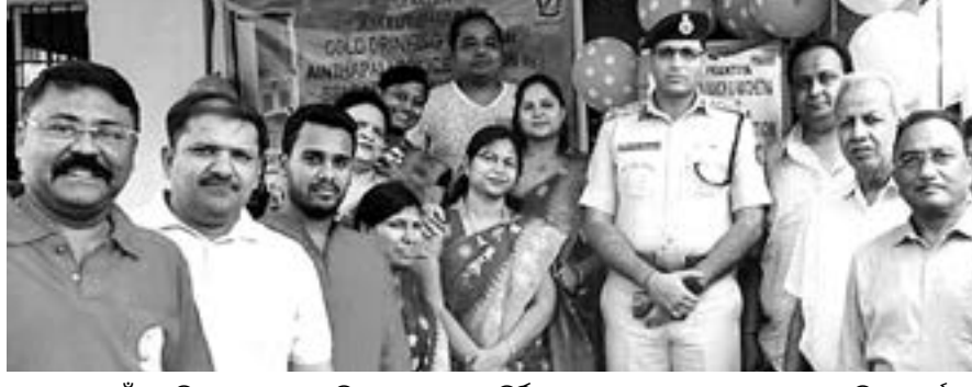
ସମ୍ବଲପୁର ଅଣ୍ଟାପାଲି ଥାନାରେ ମାରାତୀ ଯୁବା ମଞ୍ଚ ପକ୍ଷରୁ ନିର୍ମିତ ଅମୃତ ଧାରା ଉଦ୍‌ଘାଟନ ଉତ୍ସବରେ ଅତିଥି ଓ କର୍ମକର୍ତ୍ତା ।