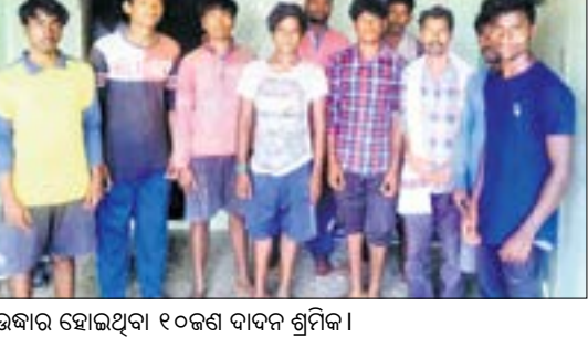
ଉଦ୍ଧାର ହୋଇଥିବା ୧୦ଜଣ ଦାଦନ ଶ୍ରମିକ ।