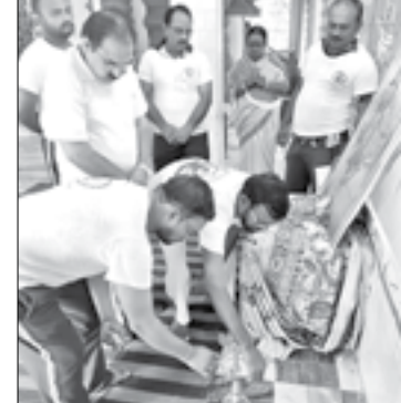
ସମ୍ବଲପୁର ରାମ ମନ୍ଦିରରେ ଯୋଗ ଦିବସ ।