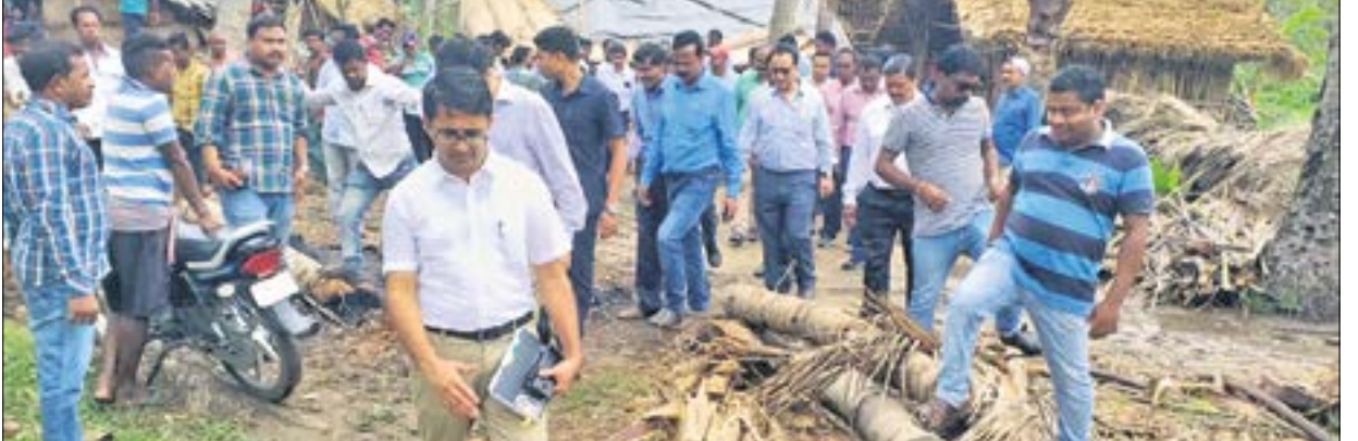
ସତ୍ୟବାଦୀ ଭୁବନେଶ୍ୱର କ୍ଷତିଗ୍ରସ୍ତ ଅଞ୍ଚଳ ବୁଲି ବ୍ୟକ୍ତିଗତ କେନ୍ଦ୍ରୀୟ ଟିମ୍।

ବାଟ୍ୟାରେ ସବୁଠୁ ଅଧିକ କ୍ଷତିଗ୍ରସ୍ତ ହୋଇଥିବା ପୁରୀ ଜିଲ୍ଲା ଗସ୍ତ କରିଛନ୍ତି କେନ୍ଦ୍ରୀୟ ଟିମ୍। ସୁରାଷ୍ଟ୍ର ମନ୍ତ୍ରାଳୟର ଅତିରିକ୍ତ ସଚିବ ଭବେ ଉତ୍ତର ଭାରତୀୟ ପ୍ରଶାସନିକ ସେବା(ଆଇଏଏସ୍‌ଏସ୍) ଏବଂ ଓଡ଼ିଶା ପ୍ରଶାସନିକ ସେବା(ଓଏଏସ୍‌ଏସ୍‌ଏସ୍) ଅଧିକାରୀ ଅନ୍ତର୍ଭୁକ୍ତ।