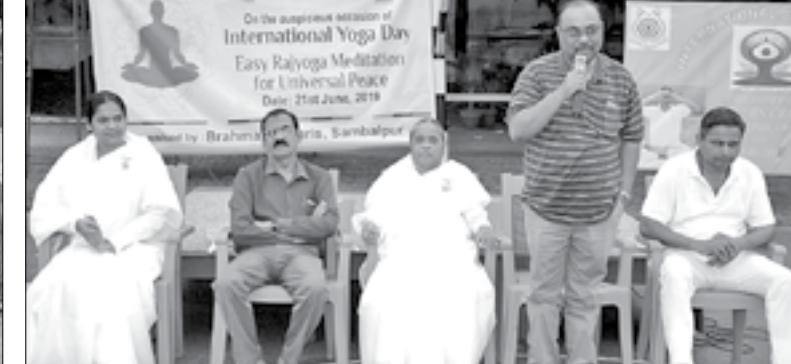
ସମ୍ବଲପୁର ସିଆରପିଏଫ୍ ପରିସରରେ ଆୟୋଜିତ ଯୋଗ ଦିବସରେ ଅତିଥିମାନେ ।