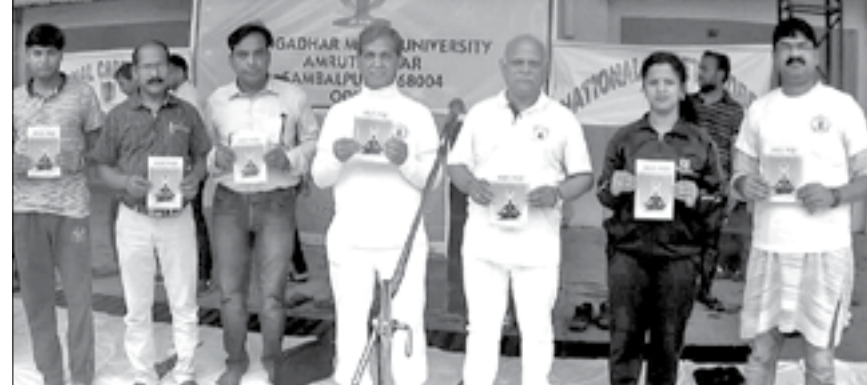
ଗଙ୍ଗାଧର ମେହେର ବିଶ୍ୱବିଦ୍ୟାଳୟ ପରିସରରେ ଅତିଥି ଓ କର୍ମଚାରୀ ଯୋଗ ସଂପର୍କିତ ପୁସ୍ତକ ଶୁଭାରମ୍ଭ କରୁଛନ୍ତି ।