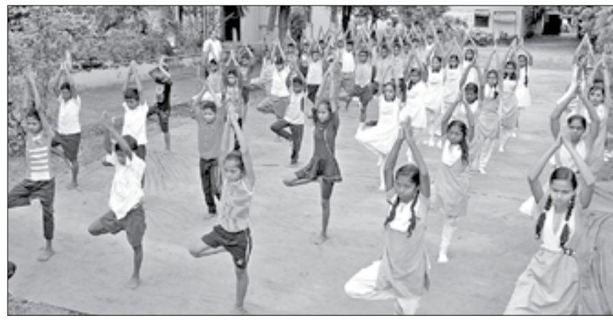
ସମ୍ବଲପୁର ଦୁର୍ଘାହାରୀ ଗାଉଁସ୍ ହାଲସ୍କୁଲରେ ଆୟୋଜିତ ଜିଲ୍ଲାପ୍ରସାର ଯୋଗ ଦିବସରେ ଛାତ୍ରାଛାତ୍ରୀମାନେ ।