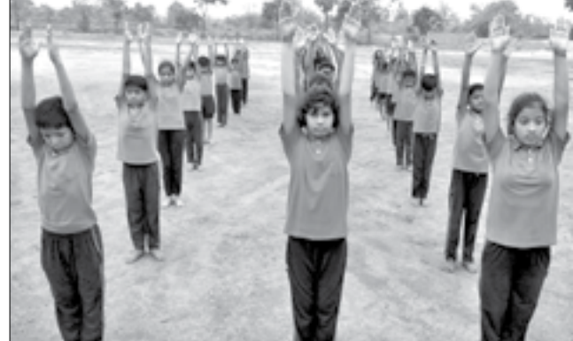
ପତିଆବାହାଲସ୍କୁଲ ପଦ୍ମନାଭ ପଦ୍ମିନୀ ସ୍କୁଲ ପରିସରରେ ଛାତ୍ରାଛାତ୍ରୀ ଯୋଗ କରୁଛନ୍ତି ।