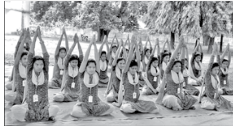
ନାକଟିଦେଉଳ ସ୍ୱାତନ୍ତ୍ର କଲେଜରେ ଛାତ୍ରାଛାତ୍ରୀମାନେ ଯୋଗାଭ୍ୟାସ କରୁଛନ୍ତି ।