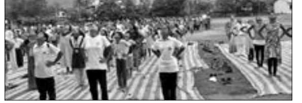
ବିଶ୍ୱ ଯୋଗ ଦିବସ ଅବସରରେ ଦେବଗଡ଼ଠାରେ ଯୋଗାଭ୍ୟାସ କରାଯାଇଛି ।