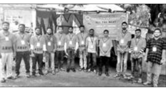
ସହାୟତା କେନ୍ଦ୍ରରେ ଏବିଭିପି ସଦସ୍ୟ ।

ସମ୍ବଲପୁର ବିଶ୍ୱବିଦ୍ୟାଳୟ (ଏସ୍‌ୟୁ) ସ୍ନାତକୋତ୍ତର ପ୍ରବେଶିକା ପରୀକ୍ଷା ଚାଲିଛି । ଏହାକୁ ଦୃଷ୍ଟିରେ ରଖି ଅଧିକ ଭାରତୀୟ ବିଦ୍ୟାର୍ଥୀ ପରିଷଦ (ଏବିଭିପି) ପକ୍ଷରୁ ସହାୟତା କେନ୍ଦ୍ର ଖୋଲା ଯାଇଛି । ପ୍ରଥମ ଦିନ ପ୍ରବେଶିକା ପରୀକ୍ଷାରେ ନୂତନ ବିଜ୍ଞାନ, ଗୃହ ବିଜ୍ଞାନ ଓ ଗଣିତ ପରୀକ୍ଷା ଥିଲା । ଛାତ୍ରାଛାତ୍ରୀଙ୍କ ବିଭିନ୍ନ ସମସ୍ୟାର ସମାଧାନ ପାଇଁ ଏବିଭିପି କର୍ମକର୍ତ୍ତା କାର୍ଯ୍ୟ କରିଥିଲେ । ଶ୍ୟାମସୁନ୍ଦର