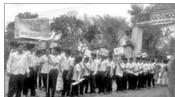
ଯୋଗ ଦିବସରେ ପାରଳମାନରେ ଛାତ୍ରାଛାତ୍ରୀମାନେ ଶୋଭାଯାତ୍ରାରେ ବାହାରିଛନ୍ତି ।