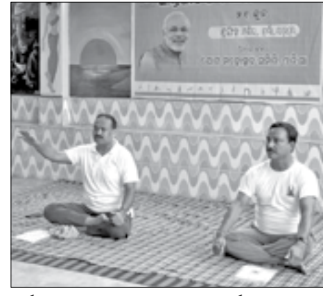
ବୁର୍ଲା ଦୁର୍ଘାହାରୀ ମନ୍ଦିର ପ୍ରାଙ୍ଗଣରେ ଯୋଗ କାର୍ଯ୍ୟକ୍ରମ ।