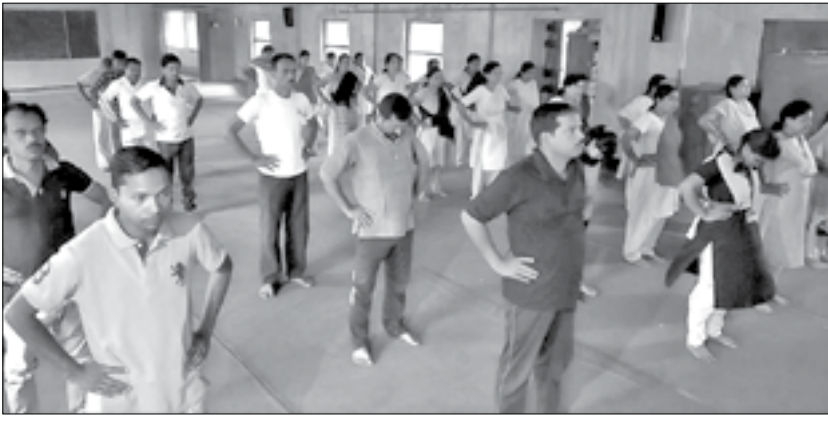
କୁଟିଆସ୍ଥିତ ସରସ୍ୱତୀ ଶିଶୁ ବିଦ୍ୟାଳୟ ପରିସରରେ ବିଦ୍ୟା ମନ୍ଦିର ଯୋଗାଭ୍ୟାସ ଚାଲିଛି ।