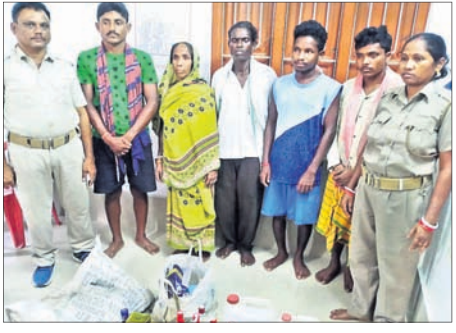
ଅବକାରୀ ବିଭାଗ ଚଢ଼ାଉରେ ଗିରଫ ଅଭିଯୁକ୍ତମାନେ।