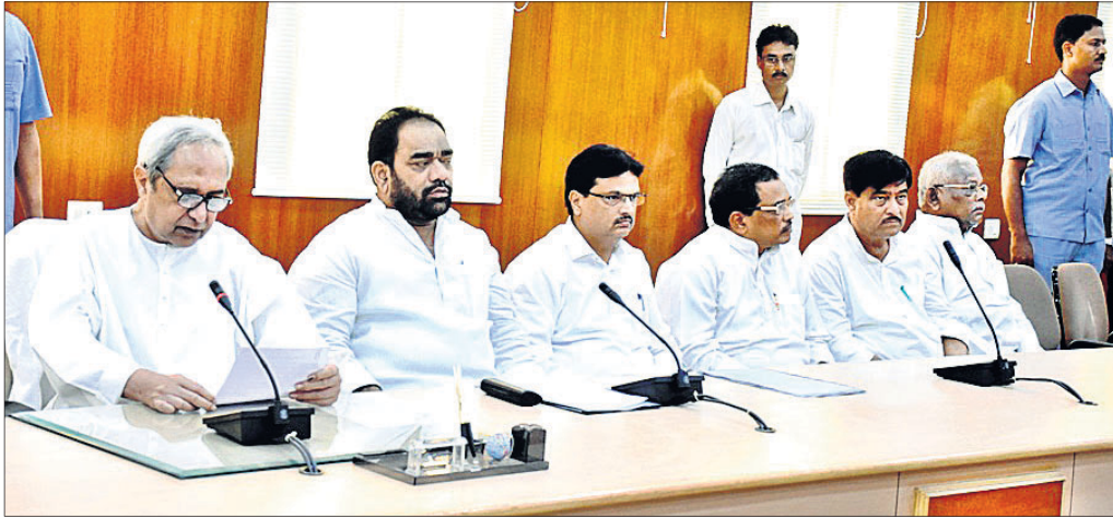
ମୁଖ୍ୟମନ୍ତ୍ରୀ ନବୀନ ପଟ୍ଟନାୟକଙ୍କ ଅଧିବେଶନରେ ବିଜେଡି ବିଧାୟକ ଦଳ ବୈଠକ।