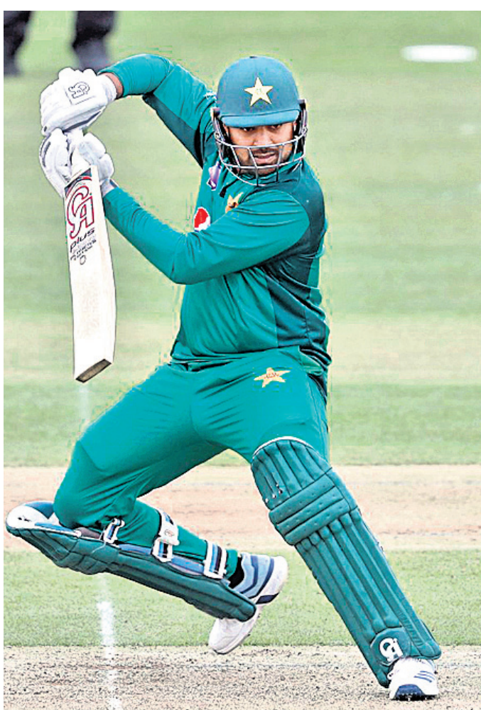
ବିଷୟରକ ଅର୍ଦ୍ଧଶତକୀୟ ଇନିଂସ୍ ଅବସରରେ ପାକିସ୍ତାନର ହାରିସ ସୋହେଲ ।

ଲଣ୍ଡନ, ୨୩:୨(ପି.ଟି.) ବିଶ୍ୱକର୍ମ ୩୦ତମ ମ୍ୟାଚ୍‌ରେ ଦକ୍ଷିଣ ଆଫ୍ରିକା ବିପକ୍ଷରେ ଚମ୍ପି ପାକିସ୍ତାନ ପ୍ରଥମେ ବ୍ୟାଟିଂ କରିବାକୁ ନିଷ୍ପତ୍ତି ନେଇ ନିର୍ଦ୍ଧାରିତ ୫୦ ଓଭରରେ ୭ ଉଇକେଟ୍ ହରାଇ ୩୦୮ ରନ୍‌ର ଚ୍ୟାଲେଞ୍ଜିଂ ଷ୍ଟୋର ହାସଲ କରିଥିଲା। ଘୁନାୟ ଐତିହାସିକ ଲର୍ଡ୍ ଗ୍ରାଉଣ୍ଡରେ ଉଦ୍‌ବିବାର ଖେଳାଯାଇଥିବା ଏହି ମ୍ୟାଚ୍‌କୁ ପ୍ରତ୍ୟାବର୍ତ୍ତନ କରିଥିବା ମିତଲ ଅର୍ଡର ବ୍ୟାଟ୍‌ମ୍ୟାନ ହାରିସ ସୋହେଲ ଜବରଦସ୍ତ ବ୍ୟାଟିଂର ନମୁନା ପ୍ରଦର୍ଶନ କରିଥିଲେ। ମାତ୍ର ୫୯ଟି ବଲର ସମ୍ମୁଖୀନ ହୋଇ ସୋହେଲ ୯ ଟୋକା ଓ ୩ ଛକା ସହ ଦୁଇ ୮୯ ରନ ସଂଗ୍ରହ କରି ଦଳକୁ ବୃହତ୍ ଷ୍ଟୋର ପ୍ରଦାନ କରିଥିଲେ। ଦୁର୍ନିମେଷର ପ୍ରଥମ ମ୍ୟାଚ ଖେଳି ୩୦ ବର୍ଷୀୟ ସୋହେଲ ଚତୁର୍ଥ ଉଇକେଟରେ ବାବର ଆଜମଙ୍କ ସହ ୮୦ ବଲରୁ ୬୯ ରନ ସଂଗ୍ରହ କରିଥିଲେ। ସେହିପରି ପଞ୍ଚମ ଉଇକେଟରେ ଲମାଦ ଓସିମଙ୍କ ସହ ସୋହେଲ ୪୦ ବଲରୁ ୭୧ ରନ ସଂଗ୍ରହ କରିଥିଲେ। ଅତିମା ୧୦ ଓଭରରେ ପାକିସ୍ତାନ ୯୧ ରନ ସଂଗ୍ରହ କରିଥିଲା ଓ ଏଥିରେ ସୋହେଲଙ୍କ ଭୂମିକା ଗୁରୁତ୍ୱପୂର୍ଣ୍ଣ ଥିଲା। ଖରାଦ ପର୍ଯ୍ୟନ୍ତ ଦେଇ ଗତି କରୁଥିବା ଅଭିଜ୍ଞ ଯୋଏବ ମଲିକଙ୍କ ଘ୍ନାନରେ ସୋହେଲଙ୍କୁ ଅତିମ ଏକାଦଶରେ ସାମିଲ କରାଯାଇଥିଲା। ସୋହେଲ ମଧ୍ୟ ଏହାର ଯଥାର୍ଥତା ପ୍ରତିପାଦନ କରିଥିଲେ। ଦୁଇ ଓପନର ଲମାଦ ଉଲ୍ ହକ ଓ