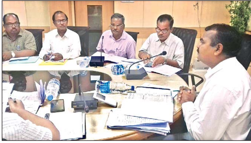
ବୈଠକରେ ଅତିରିକ୍ତ ଜିଲାପାଳ ଏବଂ ଅନ୍ୟମାନେ ଉପସ୍ଥିତ ଅଛନ୍ତି।