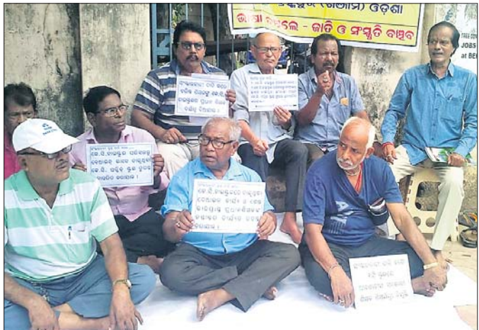
ଜିଲ୍ଲା ଶିକ୍ଷାଧିକାରୀଙ୍କ କାର୍ଯ୍ୟାଳୟ ଆଗରେ ସଂଘରାଜ୍ୟର ଧାରଣା ।

ଗୋଷ୍ଠୀଗାନ୍ଧୀଆର୍ଯ୍ୟ ପୁରାତନ କେସି ହାଇସ୍କୁଲ ପରିସରରେ ଚାଲିଥିବା ବେଆଇନ ଇଂଲିଶ୍ ମାଧ୍ୟମ ସ୍କୁଲକୁ ଉଚ୍ଚେଦ ନେଇ ପୁଣି ତାତ୍ତ୍ୱ ବିରୋଧ ହୋଇଛି । ଯୋଗ୍ୟରା ଏହାର ପ୍ରତିବାଦରେ ସାମାଜିକ ସଂଗଠନ ସଂଘରାଜ୍ୟ ପକ୍ଷରୁ ପୁଣି ଧାରଣା ଦିଆଯାଇଥିଲା । କେସି ହାଇସ୍କୁଲ ଭଳି ବହୁପୁରାତନ ତଥା ସରକାରୀ ଅନୁଦାନପ୍ରାପ୍ତ ହାଇସ୍କୁଲରେ ଦୀର୍ଘ ମାସ ଧରି ବେସରକାରୀ ଇଂଲିଶ୍ ମାଧ୍ୟମ ସ୍କୁଲ ପରିଚାଳିତ ହେଉଛି । ଏନେଇ ବହୁବାର ଅଭିଯୋଗ ସତ୍ତ୍ୱେ କାର୍ଯ୍ୟାନୁଷ୍ଠାନ ନେବାରେ ଶିକ୍ଷାବିଭାଗ ଅବହେଳା କରୁଥିବା ସେମାନେ ଅଭିଯୋଗ କରିବା ସହ ଜିଲ୍ଲା ଶିକ୍ଷାଧିକାରୀଙ୍କ କାର୍ଯ୍ୟାଳୟ ଆଗରେ ଧାରଣା ଦେଇଥିଲେ । କେସି ହାଇସ୍କୁଲ ପରିସରରେ ଚାଲିଥିବା ଘରୋଇ ଇଂଲିଶ୍ ସ୍କୁଲର ଏବଂ ଉପିଏ ନିଧି ଜିଲ୍ଲା ଶିକ୍ଷାଧିକାରୀଙ୍କ କାର୍ଯ୍ୟାଳୟ ପକ୍ଷରୁ କୁହାଯାଉଛି । ଏହାସତ୍ତ୍ୱେ ଉଚ୍ଚ ଘରୋଇ ଇଂଲିଶ୍ ମିଡିଆ ସ୍କୁଲ ଏକ ସରକାରୀ ଅନୁଦାନ ପ୍ରାପ୍ତ ହାଇସ୍କୁଲ ପରିସରରେ ଦୀର୍ଘ ମାସ ଧରି ପରିଚାଳିତ ହେଉଛି । ଏହାକୁ ତୁରନ୍ତ ଅନ୍ୟତ୍ର ସ୍ଥାନାନ୍ତର କରିବା