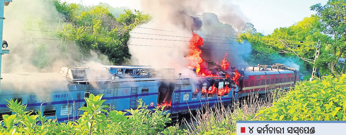
ବିଦ୍ୟୁତ୍ ମରାମତି ଇଞ୍ଜିନ ସହ ଧକ୍କା ପରେ ସମଲେଶ୍ୱରୀ ଏକ୍ସପ୍ରେସ୍ରେ ନିଆଁ ଲାଗିଥିବା ନିଆଁ ।