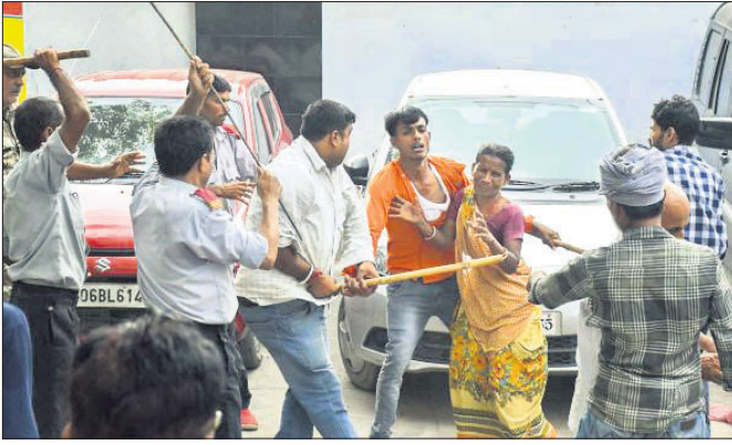
ବିହାରର ମୁକାବରପୁରରେ ମହିଷ କ୍ରରେ ପ୍ରାଣ ହରାଇଥିବା ଏକ ଶିଶୁର ମା' ବିକ୍ଷୋଭ କରୁଥିବାବେଳେ ତାଙ୍କୁ ମାଡ଼ ମାଡ଼ୁଛନ୍ତି ପୁରଣା କର୍ମୀ।

ପ୍ରାଥମିକତା ଦେଇଆସିବୁ। ଦୁର୍ଗତି ବିରୋଧରେ ଆମର ଲଢ଼େଇ ଜାରି ରହିଛି। ଦୋଷୀଙ୍କୁ କେବଳ ଅଦାଲତ ହିଁ ଦଣ୍ଡ ଦେବ ବୋଲି ମୋଦି ଏହି ଅବସରରେ କହିଛନ୍ତି। କଂଗ୍ରେସ ସମାଲୋଚନା ଛାଡ଼ି ଗଠନମୂଳକଭାବେ ଦେଶ ବିକାଶ କଥା ଚିନ୍ତା କରିବା ଉଚିତ ବୋଲି ସେ ପ୍ରକାଶ କରିଛନ୍ତି। କଂଗ୍ରେସ ନେତା ଅଧୀର ରାଞ୍ଜନଙ୍କ ମନ୍ତବ୍ୟକୁ ନେଇ ମୋଦି କହିଥିଲେ ଯେ, ଆଇନର ଶାସନ ମୋ ସରକାରରେ ଚାଲିଛି। କେହି ଦୁର୍ଗତି କଲେ, ଅଦାଲତ ସେମାନଙ୍କୁ ଦଣ୍ଡିତ କରିବ। ସରକାର ଲୋକଙ୍କ ସହ ରହି ଗଣତନ୍ତ୍ର ଧାରା ବଜାୟ ରଖି ବିକାଶ କ୍ଷେତ୍ରକୁ ପ୍ରଗତି କରିବ ଓ ଏଥିଲାଗି ସମସ୍ତଙ୍କ ସହଯୋଗର ଆବଶ୍ୟକତା ରହିଛି ମୋଦି ଲୋକ ସଭାରେ କହିଛନ୍ତି।