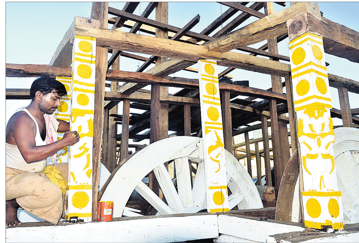
ଜଣେ ଚିତ୍ରକର ସେବକ ରଥରେ ନୂଆଁସ ରୁକକୁ ଚିତ୍ର କରୁଛନ୍ତି ।

୨୫.୬.୧୯ ତାରିଖ ଏତିହ୍ୟ ପୃଷ୍ଠାରୁ..., ଲେଖାରେ ଅନିଚ୍ଛାକୃତ ଭାବରେ ୧୪୬୭ ମସିହା ପରିବର୍ତ୍ତେ ୧୪୬୩ ରହିଯାଇଛି । ପ୍ରାଚୀନ ଓଡ଼ିଶା କେବେ କଲିଙ୍ଗ ସାମ୍ରାଜ୍ୟ, କେବେ ଓଡ୍ର ସାମ୍ରାଜ୍ୟ ଓ କେବେ ଉତ୍କଳ ସାମ୍ରାଜ୍ୟ ଭାବରେ ପରିଚିତ ଥିଲା । ପରିବର୍ତ୍ତନଶୀଳ ସାମ୍ରାଜ୍ୟଗୁଡ଼ିକର ନାମ ନ ଦେଇ ସହଜ ଅବବୋଧ ପାଇଁ ବର୍ତ୍ତମାନ ପରିଚିତ ଓଡ଼ିଶା ନାମକୁ ବ୍ୟବହାର କରାଯାଇଛି ।