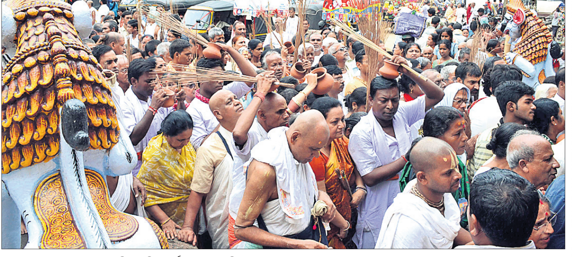
ମଠର ସନ୍ଧ୍ୟାସାମାନଙ୍କ ଦ୍ୱାରା ଗୁଣ୍ଡିଚା ମନ୍ଦିର ମାର୍ଗନା କରାଯାଉଛି ।