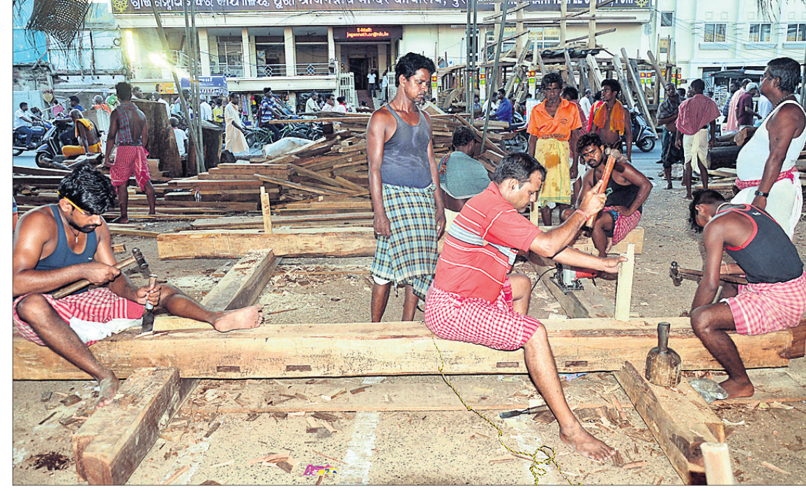
ରଥଖଳାରେ ତୃତୀୟ ପର୍ଯ୍ୟାୟ ଭୂଇଁ ଖଣ୍ଡା ପାଇଁ ପ୍ରସ୍ତୁତି ଚାଲିଛି ।