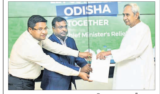
ସାପୋର୍କା ପାଲୋନ୍କା ଗ୍ରୁପ ପକ୍ଷରୁ ଫନୀ ପ୍ରବାବିତକ ସହାୟତା ପାଇଁ ୫୧ ଲକ୍ଷ ଟଙ୍କା ପ୍ରଦାନ କରାଯାଇଛି।

ସୂଚନାକୁ ଜଣାପଡିଛି ଯେ, ଆଷ୍ଟ୍ରିଗୁଆ ସରକାରଙ୍କ ଦ୍ୱାରା ପକାତକ ଭାରତୀୟ ହାରା ବ୍ୟବସାୟୀଙ୍କ ନାଗରିକତ୍ୱ ରଦ୍ଦ କରିବା ପ୍ରକ୍ରିୟାକୁ ଭାରତ ଅପେକ୍ଷା କରିଛି। ଏହାପରେ ହିଁ ଭାରତ ପକ୍ଷରୁ ଔପଚାରିକ ଭାବେ ପ୍ରତ୍ୟର୍ପଣ ପ୍ରକ୍ରିୟା ଆରମ୍ଭ କରାଯିବ।