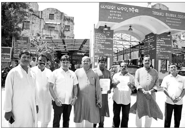
ଏନ୍‌ଏଚ୍‌ଆରସିର ନିକଟକୁ ଅଭିଯୋଗ କରିବାକୁ ଆସିଥିବା ଭାଜପା ନେତାମାନେ ।