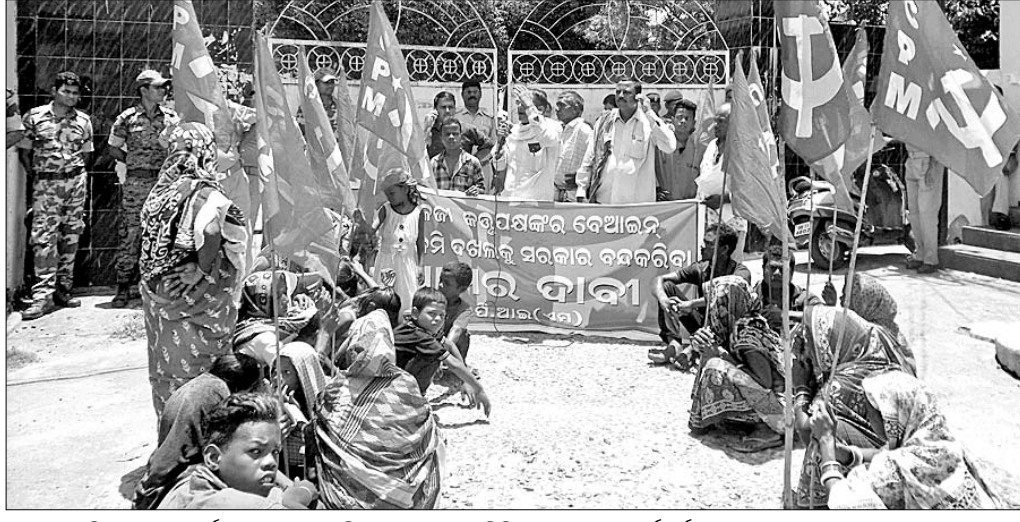
ବାଙ୍କୀ ଉପଜିଲ୍ଲାପାଳଙ୍କ କାର୍ଯ୍ୟାଳୟ ଆଗରେ ବିକ୍ଷୋଭ କରୁଥିବା ସିପିଆଇ (ଏମ୍)ର କର୍ମଚାରୀ ।