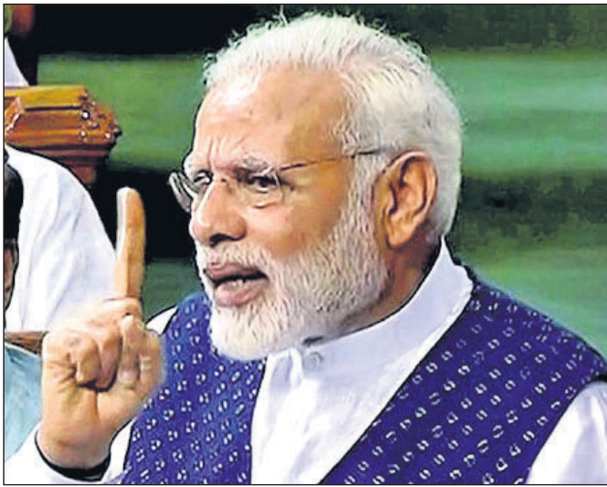
ଲୋକ ସଭାରେ ପ୍ରଧାନମନ୍ତ୍ରୀ ନରେନ୍ଦ୍ର ମୋଦି।

ସମ୍ପ୍ରଦାୟ ଗଣତନ୍ତ୍ର ଶବ୍ଦକୁ ଦଳିମକତି ଦିଆଗଲା। ଏନେଇ କାହାରି ମତାମତ ନିଆଗଲା ନାହିଁ। ଲୋକ ସଭା ନିର୍ବାଚନ ପରେ ୧୩୦ କୋଟି ଲୋକଙ୍କ ରାୟ ଗଣତନ୍ତ୍ରସଫଳରେ ଆସିଥିଲା। ଶେଷରେ ଗଣତନ୍ତ୍ର ଏକଛତ୍ରବାଦୀ ମାନସିକତା ଉପରେ ବିକଳ ଲାଭ କଲା। ଗୃହରେ ଅଟକ ବିହାରୀ ବାଜପେୟୀ, ନରସିଂହ ରାଓ କିମ୍ବା ମନମୋହନ ସିଂଙ୍କ ଭଳି ବରିଷ୍ଠ ନେତାଙ୍କ କାର୍ଯ୍ୟ ସଫଳତା ବିଷୟରେ କଂଗ୍ରେସ ନେତାଙ୍କ ମୁହଁରୁ ପଦେ କଥା କେବେ ଶୁଣିବାକୁ ମିଳୁ ନ ଥିବା ମୋଦି କହିଛନ୍ତି। ଗୃହରେ ରାଷ୍ଟ୍ରପତି ରାମନାଥ କୋବିନ୍ଦଙ୍କ ଅଭିଭାଷଣ ଉପରେ ମତରଖି ମୋଦି ଏଭଳି କଂଗ୍ରେସକୁ କରୁ ସମାଲୋଚନା କରି କହିଛନ୍ତି। ଆମେ ବିକାଶକୁ ଆମେ