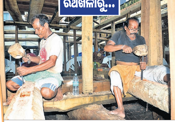
ରଥ ପାଇଁ ଚଉଦ ନାହାକା କାଠ ତିଆରି କରାଯାଉଛି ।