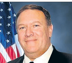
ସ୍ଥାନ ପାଇବ। ଜାପାନର ଓସାକାରେ ଆସନ୍ତା ୨୮-୨୯ରେ ହେବାକୁ ଥିବା ଜି-୨୦ ସମ୍ମିଳନୀରେ ପ୍ରଧାନମନ୍ତ୍ରୀ ନରେନ୍ଦ୍ର ମୋଦି ଓ ଆମେରିକା ରାଷ୍ଟ୍ରପତି ଡୋନାଲ୍ଡ ଟ୍ରମ୍ପଙ୍କ ମଧ୍ୟରେ ସାକ୍ଷାତ୍ ପୂର୍ବରୁ ପମ୍ପିଓଙ୍କ ଏହି ଗସ୍ତକୁ ଗୁରୁତ୍ୱ ଦିଆଯାଇଛି। ପମ୍ପିଓ ବୁଧବାର ମୋଦି ଓ ଜୟଶଙ୍କରଙ୍କ ସହ ମଧ୍ୟାହ୍ନ ଭୋଜନ କରିବେ।

ରୁଷିଆ ସହ ପ୍ରତିରକ୍ଷା ସମ୍ପର୍କକୁ ନୂଆଦିଲ୍ଲୀ ଏଡ଼ାଇ ଦେଇପାରିବ ନାହିଁ ବୋଲି ଭାରତ ଗସ୍ତରେ ଆସିଥିବା ଆମେରିକା ପରରାଷ୍ଟ୍ର ସଚିବ ମାଇକ ପମ୍ପିଓ ମଙ୍ଗଳବାର କହିଛନ୍ତି। ସାଧାରଣ ନିର୍ବାଚନ ପରେ ଏହା ହେଉଛି ଭାରତକୁ କୌଣସି ଦେଶର ନେତାଙ୍କ ପ୍ରଥମ ଉଚ୍ଚସ୍ତରୀୟ ଗସ୍ତ। ପମ୍ପିଓ ବୁଧବାର ବହୁବିଧାପାର ମନ୍ତ୍ରୀ ଏସ୍. ଜୟଶଙ୍କରଙ୍କ ସହ ବିଭିନ୍ନ ପ୍ରସଙ୍ଗରେ ଦ୍ୱିପାର୍ଶିକ ଆଲୋଚନା କରିବେ। ରୁଷିଆକୁ ଭାରତ ଏସ୍-୪୦୦ କ୍ଷେପଣାସ୍ତ୍ର ଜିଣିବା, ଆତଙ୍କବାଦ, ଏସ୍-୧୧ ଭିନା, ବାଣିଜ୍ୟ ଏବଂ ଆମେରିକାର କଟକଣା ପରେ ଭାରତରୁ ଟେକ୍ କିଣିବାରେ ହେଉଥିବା ଅସୁବିଧା ଆଦି ପ୍ରସଙ୍ଗ ଆଲୋଚନାରେ