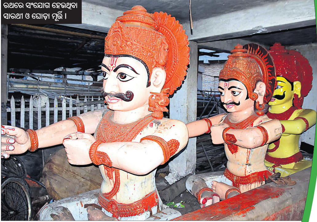
ରଥରେ ସଂଯୋଗ ହେଉଥିବା ସାରଥୀ ଓ ଘୋଡ଼ା ମୂର୍ତ୍ତି ।