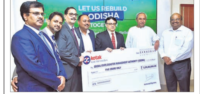
କୋଟାକ ମହିନ୍ଦ୍ରା ବ୍ୟାଙ୍କ ପକ୍ଷରୁ ଫନୀ ପ୍ରବାବିତକ ସହାୟତା ଲାଗି ୫ କୋଟି ଟଙ୍କାର ଆର୍ଥିକ ସହାୟତା ପ୍ରଦାନ କରାଯାଇଛି।