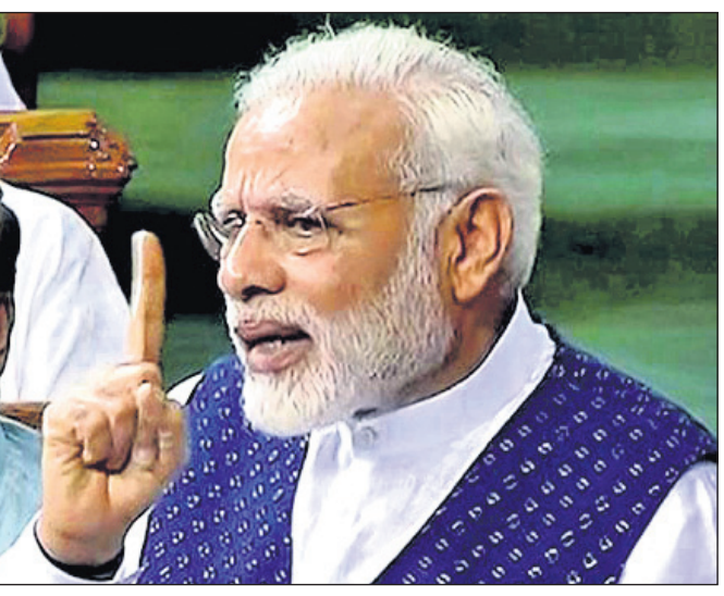
ଲୋକ ସଭାରେ ପ୍ରଧାନମନ୍ତ୍ରୀ ନରେନ୍ଦ୍ର ମୋଦି।

ସମ୍ବିଧାନରୁ ଗଣତନ୍ତ୍ର ଶବ୍ଦକୁ ଦଳିମକତି ଦିଆଗଲା। ଏନେଇ କାହାରି ମତାମତ ପରେ ୧୯୭୦ କୋଟି ଲୋକଙ୍କ ରାୟ ଗଣତନ୍ତ୍ରସଫଳରେ ଆସିଥିଲା। ଗଣତନ୍ତ୍ର ଏକଚକ୍ରବାଦୀ ମାନସିକତା ଉପରେ ବିକଳ ଲାଭ କଲା। ଗୃହରେ ଅଟଳ ବିହାରୀ ବାଜପେୟୀ, ନରସିଂହ ରାଓ କିମ୍ବା ମନମୋହନ ସିଂଙ୍କ ଭଳି ବରିଷ୍ଠ ନେତାଙ୍କ କାର୍ଯ୍ୟ ସଫଳତା ବିଷୟରେ କଂଗ୍ରେସ ନେତାଙ୍କ ମୁହଁରୁ ପଦେ କଥା କେତେ ଶୁଣିବାକୁ ମିଳୁ ନ ଥିବା ମୋଦି କହିଛନ୍ତି। ଗୃହରେ ରାଷ୍ଟ୍ରପତି ରାମନାଥ କୋବିନ୍ଦଙ୍କ ଅଭିଭାଷଣ ଉପରେ ମତରଖି ମୋଦି ଏଭଳି କଂଗ୍ରେସକୁ କରୁ ସମାଲୋଚନା କରି କହିଛନ୍ତି। ଆମେ ବିକାଶକୁ ଆମେ