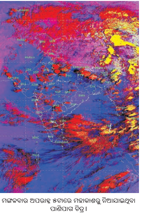
ମଙ୍ଗଳବାର ଅପରାହ୍ନ ୫ଟାରେ ମହାକାଶରୁ ନିଆଯାଇଥିବା ପାଣିପାଗ ଚିତ୍ର।