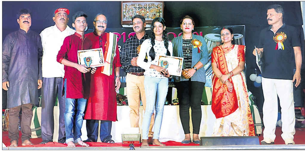
କୃତୀ ପ୍ରତିଯୋଗୀଙ୍କୁ ଅତିଥିମାନେ ସମର୍ଥନ କରୁଛନ୍ତି।