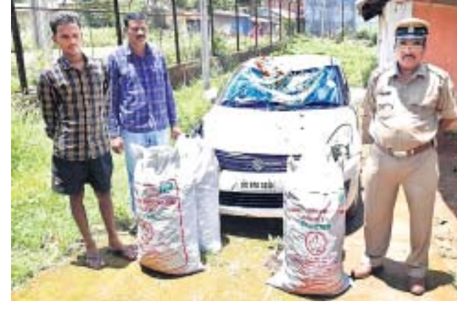
ଜବତ ଗଞ୍ଜେଇ ଓ କାର୍ ଏବଂ ଗିରଫ ଅଭିଯୁକ୍ତମାନେ ।