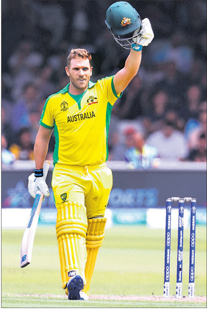
ମ୍ୟାଚ୍ ଅଫ୍ ଦି ମ୍ୟାଚ୍ ଆରୋନ୍ ଫିଞ୍ଚ।

୨୮୬ରନ ବ୍ୟାଲେଊଟ୍ ଟାର୍ଗେଟର ପିଛା କରି ଇଂଲଣ୍ଡ ୫୩ ରନରେ ୪ ରନରେ ହରାଇ ପ୍ରାରମ୍ଭିକ ବ୍ୟାଟିଂ ବିପର୍ଯ୍ୟୟର ସମ୍ମୁଖୀନ ହୋଇଥିଲା। ମିଡଲଅର୍ଡର ବ୍ୟାଟ୍ସମ୍ୟାନ ବେନ୍ ଷ୍ଟୋକ୍ସ ଏକା ଲଢେଇ କରିଥିଲେ। ସେ ୧୧୫ଟି ବଲର ସମ୍ମୁଖୀନ ହୋଇ ୮ ଚୋକା ଓ ୨ ଛକା ସହ ୮୯ ରନ କରି ମିଡଲ ଷ୍ଟ୍ରକ୍ ବାଡା କ୍ଲିନ୍ ବୋଲ୍ଡ ହୋଇଥିଲେ। ବାକି ସବୁ ବ୍ୟାଟ୍ସମ୍ୟାନ ବିଫଳ ହୋଇଥିଲେ। ଦଳ ନିୟମିତ ବ୍ୟବଧାନରେ ଉଇକେଟ ହରାଇଥିଲା। ଦଳ ତରଫରୁ ଅନ୍ୟମାନଙ୍କ ମଧ୍ୟରେ ଜନା ବେୟାରସ୍ତୋ ୨୭, କ୍ରିସ୍ ଓକ୍ସି ୨୬, ଉଇକେଟକିପର ବ୍ୟାଟ୍ସମ୍ୟାନ ବ୍ୟାଟିଂ କରି ଅଷ୍ଟ୍ରେଲିଆ ୬ ରନରେ ହରାଇ ୨୮୫ ରନ ସଂଗ୍ରହ କରିଥିଲା। ଜବାବରେ ଇଂଲଣ୍ଡ ୪୪.୪ ଓଭରରେ ୨୨୧ ରନ କରି ଅଲଆଉଟ ହୋଇ