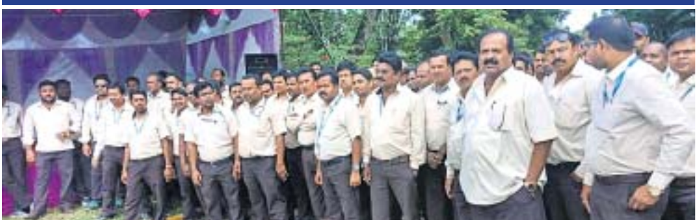
ଅନଶନରେ ସାମିଲ ହୋଇଥିବା କର୍ମଚାରୀ ।