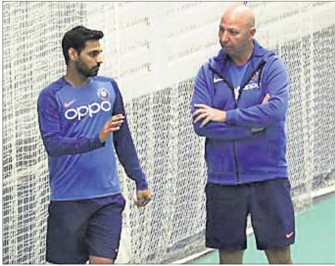
ଫିଲ୍ଡ ଓ ପ୍ୟାଟ୍ରିକ୍ ଫରହାନ୍ଙ୍କ ସହ ଭୁବନେଶ୍ୱର କୁମାର।

ଚଳିତ ଆଇସିସି ବିଶ୍ୱକପର ଏକ ମ୍ୟାଚରେ ଭାରତୀୟ ଦଳ ଗୁରୁବାର ଭୁବନେଶ୍ୱର ବିଶ୍ୱ ଚାମ୍ପିୟନ ଫ୍ରେଣ୍ଡ୍‌ସ୍‌ସ୍ ଲେଡିସ୍‌କୁ ଯାଉଛି। ତେବେ ଏହି ଗୁରୁତ୍ୱପୂର୍ଣ୍ଣ ମ୍ୟାଚ ପୂର୍ବରୁ ବିରାଟ କୋହଲିଙ୍କ ନେତୃତ୍ୱାଧୀନ ଭାରତ ପାଇଁ ଏକ ଖୁସି ଖବର ଆସିଛି। ଦଳର ପ୍ରମୁଖ ଖିଲାରୀ ବୋଲର ଭୁବନେଶ୍ୱର କୁମାର (ଭୁବି) ଆନ୍ତର୍ଜାତୀୟ ସମୟରେ ପୁନର୍ବାର ମଙ୍ଗଳବାର ନେତୃତ୍ୱ ସେପକ୍ଷରେ ଯୋଗ ଦେଇଛନ୍ତି। ଗତ ୧୬ରେ ପାକିସ୍ତାନ ବିପକ୍ଷ ହାଇଦରାବାଦରେ ମ୍ୟାଚ୍ ଅବସରରେ ବୋଲି କରୁଥିବାବେଳେ ଭୁବି ଆନ୍ତର୍ଜାତୀୟ ପାଇଥିଲେ। ଫଳରେ ସେହି ମ୍ୟାଚରେ ମାତ୍ର ୨.୪ ଓଭର ବୋଲି କରି ସେ ପଢ଼ିଆ ଛାଡ଼ିଥିଲେ। ତାଙ୍କ ବଦଳ ଖେଳାଳି ଭାବେ ମହମ୍ମଦ ସାନି ଆଫଗାନିସ୍ତାନ ବିପକ୍ଷ ପରବର୍ତ୍ତୀ ମ୍ୟାଚରେ ରୁଡ଼ାନ୍ଦ୍ର ଏକାଦଶରେ ଘ୍ରାନ ପାଇଥିବାବେଳେ ହ୍ୟାଟ୍ରିକ୍ ଉଲ୍‌କେଟ୍ ଅଭିଆର କରି ବିରଳ କ୍ଷେତ୍ରରେ ଘ୍ରାନ ଡେନିଫର ହରମସୋ ଗୋଲ ଦେଇ ମ୍ୟାଚକୁ ସମାପନ କରିଥିଲେ। ଆମେରିକାକୁ ୧୫ତମ ମିନିଟ୍ରେ ମିଳିଥିବା ଫିଫା ସେନାକୁ ଗୋଟିଏ ଘଣ୍ଟାରେ ପରାସ୍ତ କରିଥିଲେ। ଅନ୍ୟପକ୍ଷରେ ଗୋଲକିପର ହେଡ଼ଭିଗ୍ କିଶୋରୀ ବନହାର ସେଇ ଯୋଗୁଁ ସ୍ୱିଡେନ ୧-୦ ଗୋଲରେ ୫ମ ର୍ୟାଙ୍କଧାରୀ କାନାଡାକୁ ହରାଇ ଦେଇଛି। ଦଳ ପାଇଁ ଶ୍ରେଣୀ ବାଲ୍ କ୍ୟାପ୍ଟେନ୍ ସିଦ୍ଧାନ୍ତ ଗୋଲ ଖୋଜି କରିଥିଲେ। କ୍ୱାର୍ଟର ଫାଇନାଲରେ ଆମେରିକା ଓ ସ୍ୱିଡେନ ଯଥାକ୍ରମେ ଆୟୋଜକ ଫ୍ରାନ୍ସ ଓ ଜର୍ମାନୀ ସହ ଖେଳିବ।