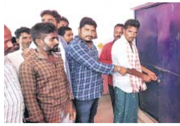
ସ୍କୁଲ ଶ୍ରେଣୀଗୁହରେ ତାଲା ପକାଇଲେ ଅଭିଭାବକ ।

ଶିକ୍ଷୟିତ୍ରୀ ଶିକ୍ଷକ ଠିକ୍ ସମୟରେ ବିଦ୍ୟାଳୟକୁ ଆସୁନାହାନ୍ତି । ଛାତ୍ରାଛାତ୍ରୀଙ୍କୁ ଭଲ ଭାବେ ପାଠ ପଢ଼ାଯାଉ ନାହିଁ । ଅଭିଭାବକମାନେ ଏକଲି ଅଭିଯୋଗ ଆଣି ମଙ୍ଗଳବାର ବନ୍ଧୁଗାଁ ରୁକ୍ମ ଆଲମଶା ଭକ ପ୍ରାଥମିକ ବିଦ୍ୟାଳୟରେ ତାଲା ପକାଇଛନ୍ତି । ବନ୍ଧୁଗାଁ ଜିଲ୍ଲା ପରିଷଦ ସଭା ସଭାପତି ସାହୁଙ୍କ ନେତୃତ୍ୱରେ ସେମାନେ ପୂର୍ବାହ୍ନରେ ମୁଖ୍ୟମନ୍ତ୍ରୀଙ୍କ ସମେତ ସମସ୍ତ ଶ୍ରେଣୀଗୁହରେ ତାଲା ପକାଇ ପ୍ରତିବାଦ ଜଣାଇବା ସହ ଶିକ୍ଷୟିତ୍ରୀ ଶିକ୍ଷକଙ୍କ ବଦଳି ଦାବି କରିଛନ୍ତି । ଆଲମଶା ଭକ ପ୍ରାଥମିକ