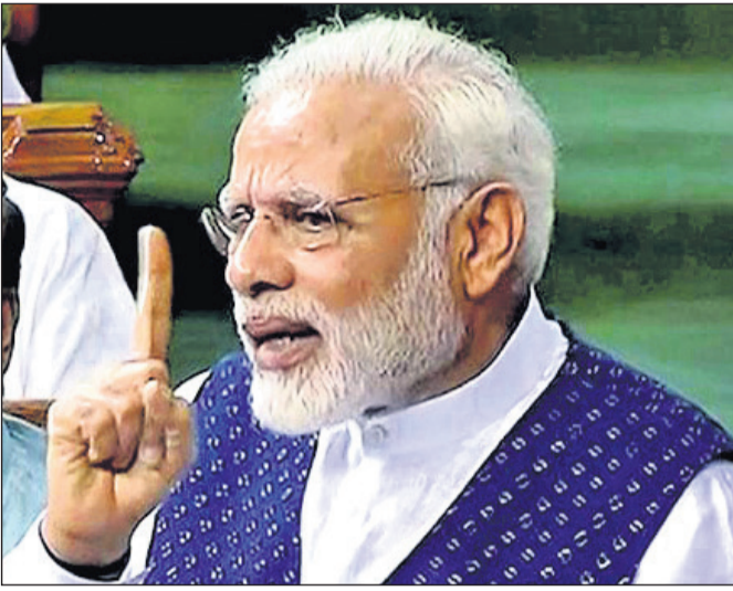
ଲୋକ ସଭାରେ ପ୍ରଧାନମନ୍ତ୍ରୀ ନରେନ୍ଦ୍ର ମୋଦି।

ସମ୍ପାଦନା ଗଣତନ୍ତ୍ର ଶବ୍ଦକୁ ଦଳିମକତି ଦିଆଗଲା। ଏନେଇ କାହାରି ମତାମତ ନିଆଗଲା ନାହିଁ। ଲୋକ ସଭା ନିର୍ବାଚନ ପରେ ୧୩୦ କୋଟି ଲୋକଙ୍କ ରାୟ ଗଣତନ୍ତ୍ରସଫଳରେ ଆସିଥିଲା। ଶେଷରେ ଗଣତନ୍ତ୍ର ଏକଚକ୍ରବାଦୀ ମାନସିକତା ଉପରେ ବିକଳ ଲାଭ କଲା। ଗୃହରେ ଅଟକ ବିହାରୀ ବାଜପେୟୀ, ନରସିଂହ ରାଓ କିମ୍ବା ମନମୋହନ ସିଂଙ୍କ ଭଳି ବରିଷ୍ଠ ନେତାଙ୍କ କାର୍ଯ୍ୟ ସଫଳତା ବିଷୟରେ କଂଗ୍ରେସ ନେତାଙ୍କ ମୁହଁକୁ ପଦେ କଥା କେବେ ଶୁଣିବାକୁ ମିଳୁ ନ ଥିବା ମୋଦି କହିଛନ୍ତି। ଗୃହରେ ରାଷ୍ଟ୍ରପତି ରାମନାଥ କୋବିନ୍ଦଙ୍କ ଅଭିଭାଷଣ ଉପରେ ମତରଖି ମୋଦି ଏଭଳି କଂଗ୍ରେସକୁ କରୁ ସମାଲୋଚନା କରି କହିଛନ୍ତି। ଭାରତର ବିକାଶକୁ ଆମେ