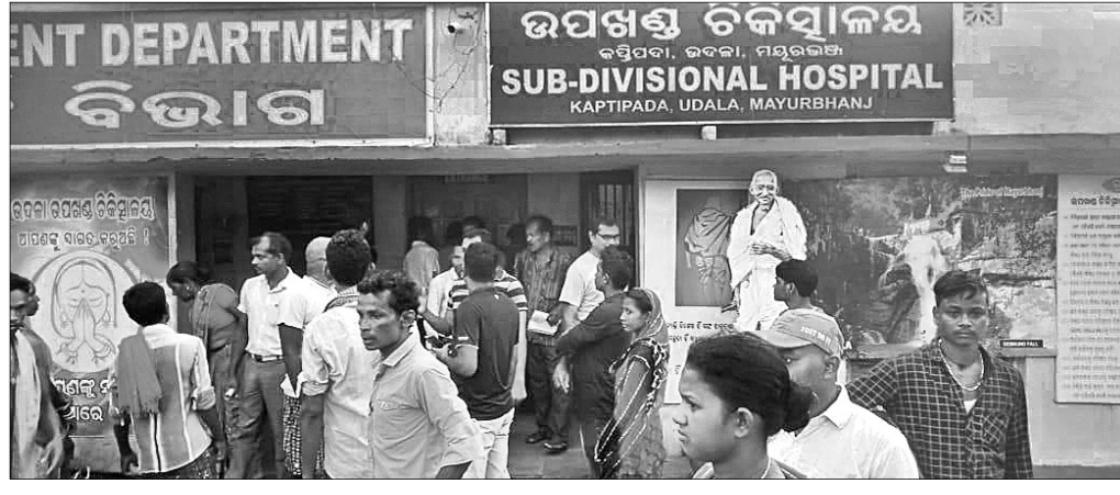
ଡାକ୍ତରଖାନା ସମ୍ମୁଖରେ ରୋଗୀଙ୍କ ସମ୍ପର୍କୀୟ ହୋହଲ୍ଲା କରୁଛନ୍ତି।