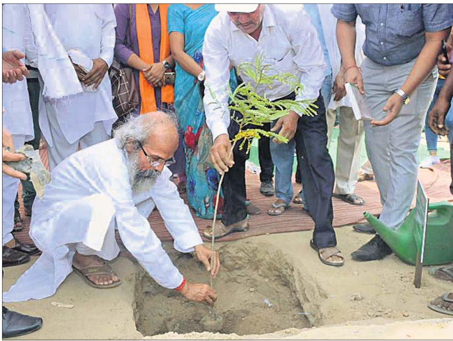
ସବୁ ଭାରତ ଅଭିଯାନ ଅବସରରେ କେନ୍ଦ୍ର ଏମ୍‌ଏସ୍‌ଏମ୍‌ଏ ମନ୍ତ୍ରୀ ପ୍ରତାପ ଚନ୍ଦ୍ର ଷଡ଼ଙ୍ଗା ଦିଲ୍ଲୀର କୁଚବଗଡ଼ ଗ୍ରାମରେ ରୁପ୍ତାବାର ଏକ ଗାଆଁ ରୋପଣ କରୁଛନ୍ତି। ଖଦି ଓ ଗ୍ରାମୋଦ୍ୟୋଗ ନିଗମ (କେଭିଆଇସି) ପକ୍ଷରୁ ଏହି କାର୍ଯ୍ୟକ୍ରମ ଆୟୋଜନ କରାଯାଇଥିଲା।