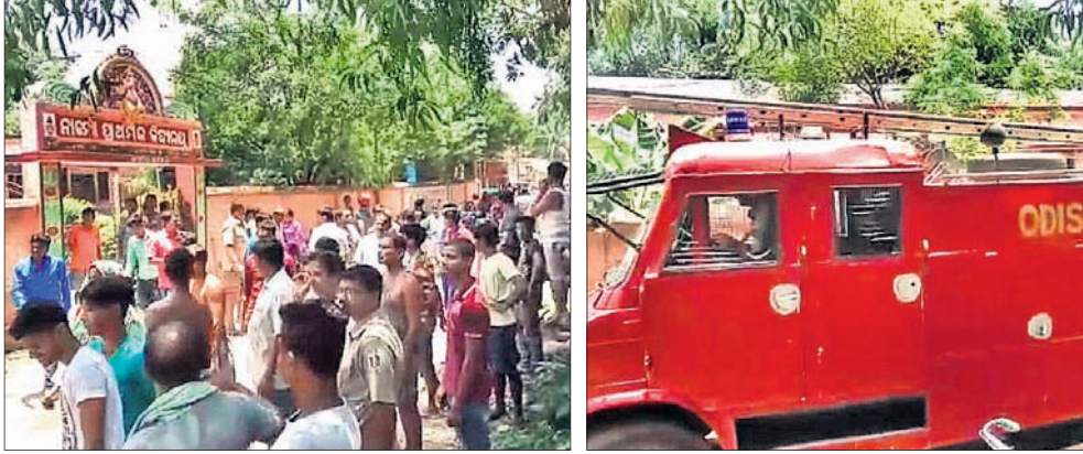
ସ୍କୁଲ ଆଗରେ ଜମା ହୋଇଥିବା ଅଭିଭାବକ ଓ ଗ୍ରାମବାସୀ ଏକ ଘଟଣାସ୍ଥଳରେ ପହଞ୍ଚିଥିବା ଦମକଳ।

ପରିବାର ଲୋକେ ବାଲେଶ୍ୱର ରେଳ ଷ୍ଟେଶନରୁ ଚାଲୁ ଧରି ପୋଲିସ ଜିମା ଦେଇଥିଲେ। ପରେ ପୋଲିସ୍ ଆଇଁ ଭିତ୍ତିରେ ରୁକ୍ତ ହୋଇଥିବା ମାମଲା (ନଂ. ୩୭୯/୨୦୧୭)ର ବିଚାର କୋର୍ଟରେ କରାଯାଇଥିଲା। ୧୫ ଜଣ ସାକ୍ଷ୍ୟପ୍ରମାଣ ଓ ୨୦ ଦସ୍ତାବିଜ ଅନୁଯାୟୀ ବିଚାରପତି ପୋଲିସ ଏ ନେଇ ଏକ ମାମଲା (ନଂ. ୮୯/୧୭-୧୮) ରୁକ୍ତ କରି ତଦନ୍ତ କରୁଥିଲା। ୪ଦିନ ପରେ ଅଭିଯୁକ୍ତ ବାପୁନ ଏହି ନାବାଳିକାଙ୍କୁ ବାହାରକୁ ନେଇଯିବା ମକଦ୍ଦମା ପରିଚାଳନା କରୁଥିଲେ।