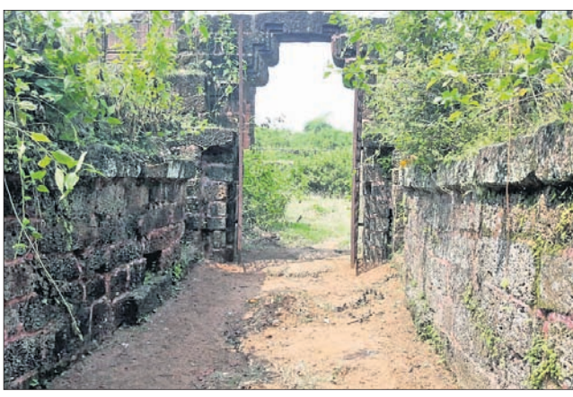
ରାଇବଣିଆ ଦୁର୍ଗ ଦ୍ୱାରର ଅବଶେଷ।