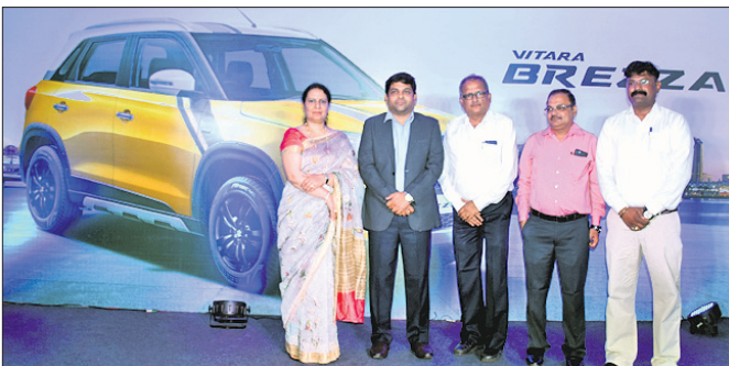
ଭୁବନେଶ୍ୱର, ୨୬-୬ (ବୁଧବେଳା)

ମାରୁତି ସୁଜୁକି ଇଣ୍ଡିଆ ଲିମିଟେଡ଼ ପକ୍ଷରୁ ଏହାର ଲୋକପ୍ରିୟ ଏସ୍‌ୟୁଭି ମଡେଲ 'ଭିଟାରା ବ୍ରିଜା'ର ସମୂହ ଡେଲିଭରି ପ୍ରଦାନ କରାଯାଇଛି।