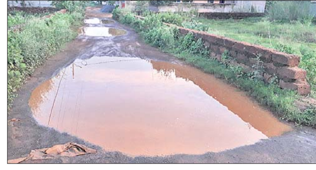
ରାସ୍ତାରେ ପାଣି ଜମିରହିଛି।