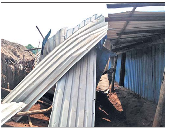
ବିଦ୍ୟାଳୟର ଛପର ଉଡ଼ିଯାଇଛି।

୨୦୧୬ ନଗରୀ ଅପରୂପ ଘଟଣାପରେ ନଗରୀର ବିକାଶ କ୍ଷେତ୍ରରେ ସରକାରୀ ବହୁ ଯୋଜନା ପ୍ରଣୟନ କରିଛନ୍ତି। କୁଟାଳ ଜନଜାତିକ ସ୍ୱାସ୍ଥ୍ୟ, ଶିକ୍ଷା, ପାନୀୟଜଳ, ଗମନାଗମନ ଉପରେ ରୁଚୁଛନ୍ତି। ଦିଆଯିବା ସହ ଚାଲିଚଳୁଥିବା ପରିବର୍ତ୍ତନ ପାଇଁ ମଧ୍ୟ ରୁଚୁଛନ୍ତି। କିନ୍ତୁ ନଗରୀ ଅପହସ୍ତ ରୁଚୁଣୀ ଓ ରୁହିଆଶାଳ ଗ୍ରାମରେ ଅଦ୍ୟାବଧି ରାସ୍ତା ସଂଯୋଗକରଣ ହୋଇ ପାରି ନାହିଁ। ଏହି ୨ ଗ୍ରାମର ବିକାଶ କେବଳ କାର୍ଯ୍ୟ କଲମରେ ରହିଛି। ସରକାରୀ ଯୋଜନା ବିକୃତ ପକ୍ୱାଦର, ବିଭୁସ୍ୱାସ୍ଥ୍ୟ ଯୋଜନା, ସ୍କୁଲଗୃହ ନିର୍ବାଣ, ସ୍ୱାସ୍ଥ୍ୟସେବା ପରି ବିଭିନ୍ନ ସରକାରୀ ଯୋଜନା ଗ୍ରାମରେ କାର୍ଯ୍ୟକାରୀ ହୋଇପାରି ନ ଥିବା ସ୍ଥାନୀୟ ଅଞ୍ଚଳବାସୀ କହିଛନ୍ତି। ରୁହିଆଶାଳ ଗ୍ରାମରେ ଶିକ୍ଷା ବ୍ୟବସ୍ଥାରେ ସୁଧାର ଆଣିବା ପାଇଁ ଟାଣା ଝୁଲି ଓ ରୁଚୁଣୀ ଗ୍ରାମରେ ଖଣି ନିଗମ ପକ୍ଷରୁ ୨ଟି ଶ୍ରେଣୀଗୃହ ନିର୍ବାଣ କରାଯାଇଛି। ଏଥିରେ ଗ୍ରାମର କୋମଳମତି ପିଲାଙ୍କୁ ଆହେୟର ସଂସ୍ଥା ପକ୍ଷରୁ ଶିକ୍ଷକ ନିଯୁକ୍ତି