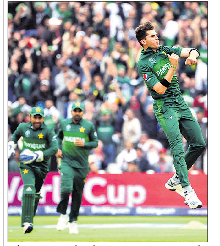
କର୍ମିହାନରେ ବୁଧବାର ନ୍ୟୁଜିଲ୍ୟାଣ୍ଡ ବିପକ୍ଷ ମ୍ୟାଚ୍‌ରେ ଉଇକେଟ୍ ହାସଲ ପରେ ଖୁସି ମନାଉଛନ୍ତି ପାକିସ୍ତାନ ବୁଟ ବୋଲର ଶାହିନ ଆଫ୍ରିଦୀ।