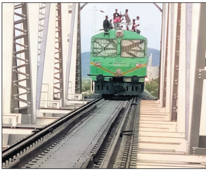
ହୋଇପାରି ନ ଥିଲା। ସେହି ସମୟରେ ପ୍ରକଳ ପାଇଁ ଠିକା ନେଇଥିବା କମ୍ପାନୀ ଜମି ଅଧିଗ୍ରହଣ ସମସ୍ୟା ପାଇଁ କାର୍ଯ୍ୟ ବିଳମ୍ବ ଯୋଗୁ ପ୍ରକଳ କାର୍ଯ୍ୟ ୨୦୦୭ରୁ ଆରମ୍ଭ ହେବାକୁ ଥିଲାବେଳେ ଏହା

ଚଣ୍ଡିଖୋଳ, ୨୬୬୬(ଡି.ଏନ୍.ଏ.)- ବଡ଼ଚଣା ବୁକ୍ ଅନ୍ତର୍ଗତ ବାରିମୁଳ ଗ୍ରାମରେ ବୁଧବାର ଜଣେ ଯୁବକଙ୍କର ଅଂଶୁଧାତରେ ମୃତ୍ୟୁ ହୋଇଥିବା ଅଭିଯୋଗ ହୋଇଛି।