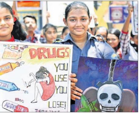
ଅନ୍ତର୍ଜାତୀୟ ନିଶା ନିବାରଣ ଦିବସ ସଚେତନତା କାର୍ଯ୍ୟକ୍ରମରେ ଭୁବନେଶ୍ୱର କେନ୍ଦ୍ରୀୟ ବିଦ୍ୟାଳୟ - ୧୨ ପିଲାମାନେ।

ଅନ୍ତର୍ଜାତୀୟ ନିଶା ନିବାରଣ ଦିବସ ସଚେତନତା କାର୍ଯ୍ୟକ୍ରମରେ ଭୁବନେଶ୍ୱର କେନ୍ଦ୍ରୀୟ ବିଦ୍ୟାଳୟ - ୧୨ ପିଲାମାନେ। ଝରପୁରୁଡ଼ାର ସଂସ୍କୃତ ବେହେରାଙ୍କ ସମର୍ଥକ କରାଯାଇଥିଲା।