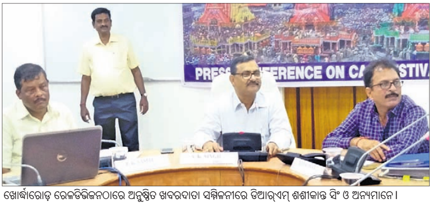
ଖୋର୍ଦ୍ଧାରୋଡ଼ ରେଳଡିଭିଜନରେ ଅନୁଷ୍ଠିତ ଖବରଦାତା ସମ୍ମିଳନୀରେ ଡିଆରଏମ୍ ଶଶୀକାନ୍ତ ସିଂ ଓ ଅନ୍ୟମାନେ।

କଟକ, ୨୬୬୬(ଡି.ଏନ.ଏ.) ବିଶ୍ୱପ୍ରସିଦ୍ଧ ରଥଯାତ୍ରାରେ ରେଳଯାତ୍ରୀଙ୍କ ପାଇଁ ରେଳପଥ ପକ୍ଷରୁ ବ୍ୟାପକ ଆୟୋଜନ କରାଯାଇଛି।