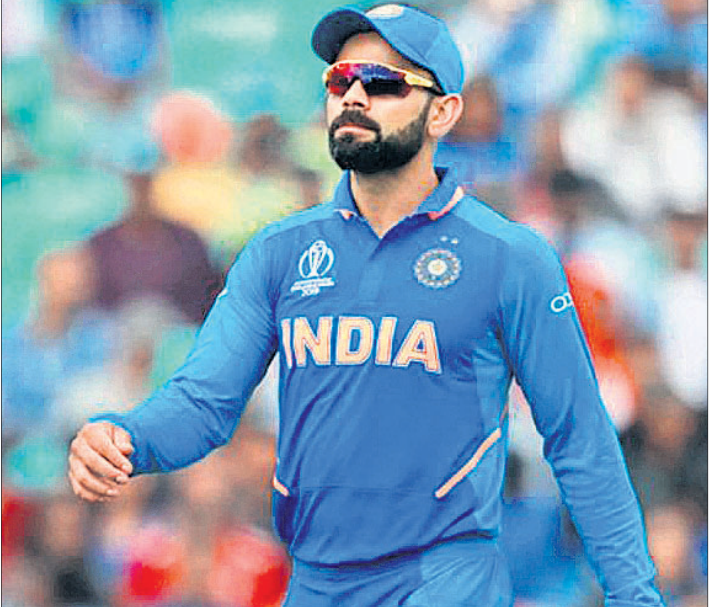
କୋହଲି ଚଳିତ ବିଶ୍ୱକପ୍ରେ ଭଲ ଫର୍ମରେ ଅଛନ୍ତି। ଅଷ୍ଟ୍ରେଲିଆ ବିପକ୍ଷରେ ୮୨, ପାକିସ୍ତାନ ବିପକ୍ଷରେ ୬୭ ଓ ଆଫଗାନିସ୍ତାନ ବିପକ୍ଷରେ ୬୭ ରନ୍ ଇନିଂସ ଖେଳିଛନ୍ତି। ଏଣୁ ଫ୍ରେଣ୍ଡ୍‌ଲି ବିପକ୍ଷ ମ୍ୟାଚ୍‌ରେ ଦର୍ଶକଙ୍କ ନଜର ତାଙ୍କ ଉପରେ ରହିବ।

ମାଷ୍ଟ୍ରେସର, ୨୬୬୬ ଭାରତୀୟ ଅଧିନାୟକ ବିରାଟ କୋହଲିଙ୍କ ନିକଟରେ ଏକ ବିଶ୍ୱରେକର୍ଡର ଅଧିକାରୀ ହେବାର ସୁଯୋଗ ରହିଛି। ଫ୍ରେଣ୍ଡ୍‌ଲି ବିପକ୍ଷରେ ଖେଳାଯିବାକୁ ଥିବା ମ୍ୟାଚ୍‌ରେ ସେ ତୁଟ୍ଟତମ ବ୍ୟାଟ୍‌ମ୍ୟାନ ଭାବେ ଅନ୍ତର୍ଜାତୀୟ କ୍ରିକେଟରେ ୨୦ ହଜାର ରନ୍ ପୂରଣ କରିପାରନ୍ତି। ଏହି ମାଇଲଷ୍ଟୋନ୍ ସ୍ପର୍ଶ କରିବା ଲାଗି ତାଙ୍କୁ ଆଉ ୩୭ ରନ୍ ଦରକାର। କୋହଲି ଏବେ ପର୍ଯ୍ୟନ୍ତ ସମସ୍ତ ଫର୍ମାଟ୍‌ରେ ମୋଟ ୧୯,୯୭୩ ରନ୍ କରିସାରିଛନ୍ତି। ଆଉ ୩୭ ରନ୍ କଲେ ସତ୍ୟ ଚେନ୍ନାଇର (୩୪,୩୫୬) ଓ ରାହୁଲ ଦ୍ରାବିଡ (୨୪,୨୦୮)ଙ୍କ ପରେ ତୃତୀୟ ଭାରତୀୟ ଭାବେ ସେ ଅନ୍ତର୍ଜାତୀୟ କ୍ରିକେଟରେ ୨୦ ହଜାର ରନ୍ ପୂରଣ କରିବେ। ସତ୍ୟ ଓ ବ୍ରାଏନ ଲାଭା ୪୫୩ଟି ଇନିଂସ୍‌ରେ ୨୦ ହଜାର ରନ୍ ପୂରଣ କରିଥିଲେ। ଅନ୍ୟପକ୍ଷରେ କୋହଲି ଏପର୍ଯ୍ୟନ୍ତ ୧୩୧ ଟେଷ୍ଟ, ୨୨୩ ଦିନିଆ ଓ ୬୨୭୦ ମ୍ୟାଚ୍‌ରୁ ମିଶାଇ ମୋଟ ୪୧୬୮ଟି ଇନିଂସ୍ ଖେଳିଛନ୍ତି।