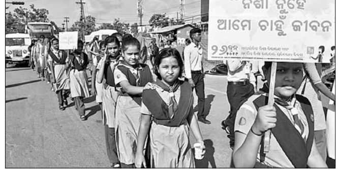
ନିଶା ନିବାରଣ ନେଇ ବାହାରିଥିବା ଶୋଭାଯାତ୍ରା।