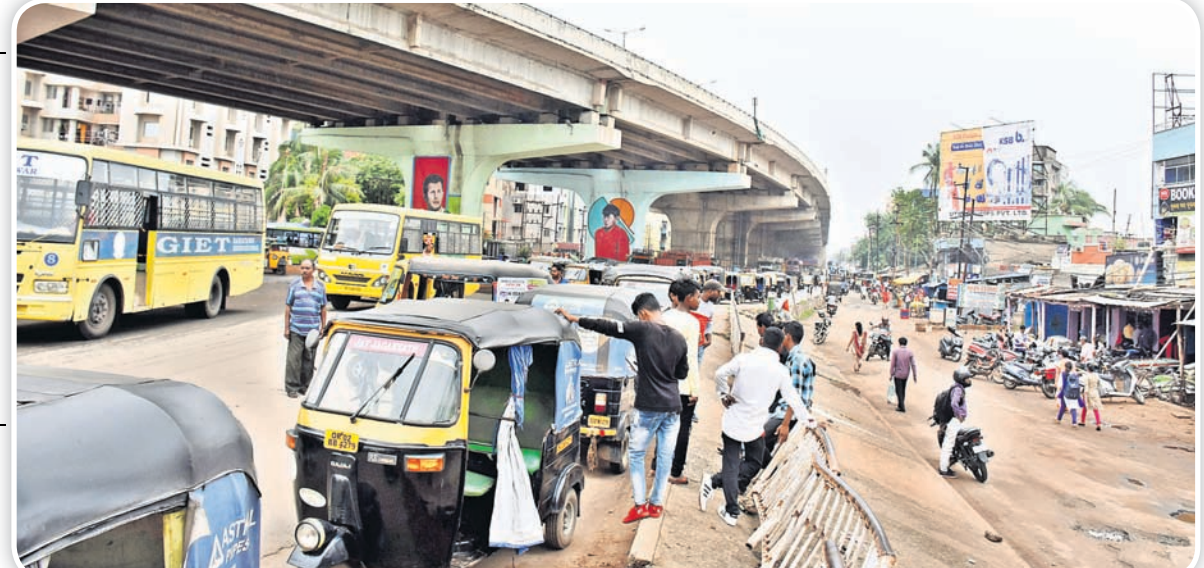
ରସୁଲଗଡ଼ ଗୋଲେଇ ଛକ ରାସ୍ତା ଉପରେ ଅଟକି ରହୁଛି ଅଗୋ ବିକ୍ରୀ