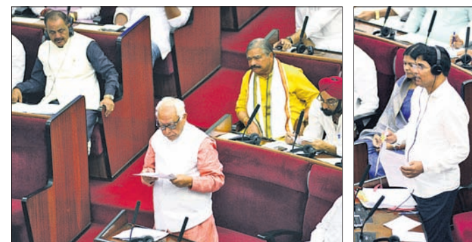
କାଳିଆ ଯୋଜନାକୁ ନେଇ ବିରୋଧୀଙ୍କ ପ୍ରଶ୍ନର ଉତ୍ତର ଦେଉଛନ୍ତି କୃଷିମନ୍ତ୍ରୀ ଅରୁଣ ସାହୁ ।