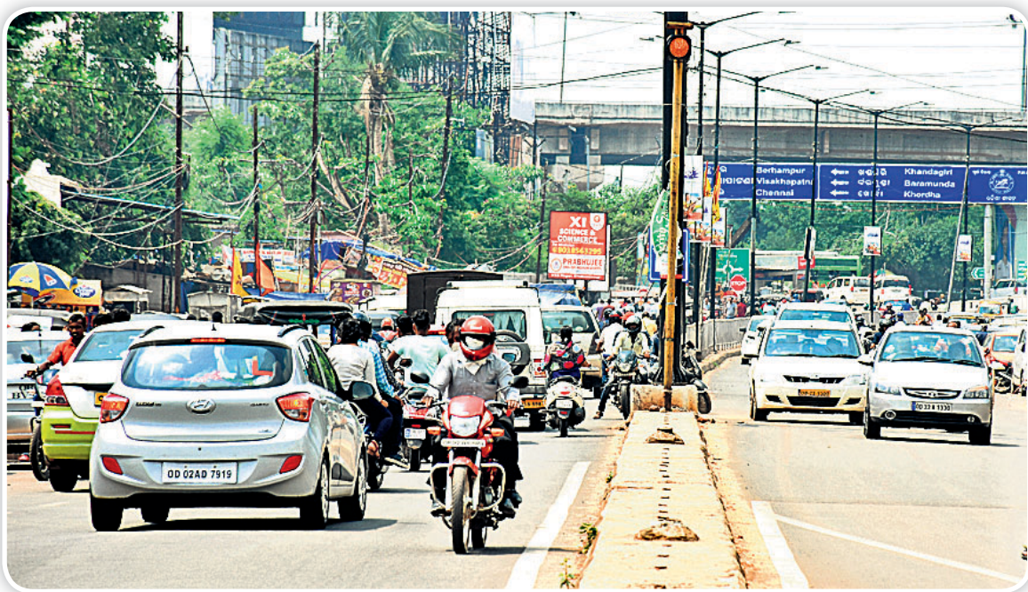
ରସୁଲଗଡ଼କୁ ଏସ୍ପାନ୍ନେଟ୍ ଓ ନ ପର୍ଯ୍ୟନ୍ତ ରାସ୍ତାରେ ଗ୍ରାଫିକ୍ ନିୟମ ଉଲ୍ଲଙ୍ଘନର କିଛି ଦୃଶ୍ୟ