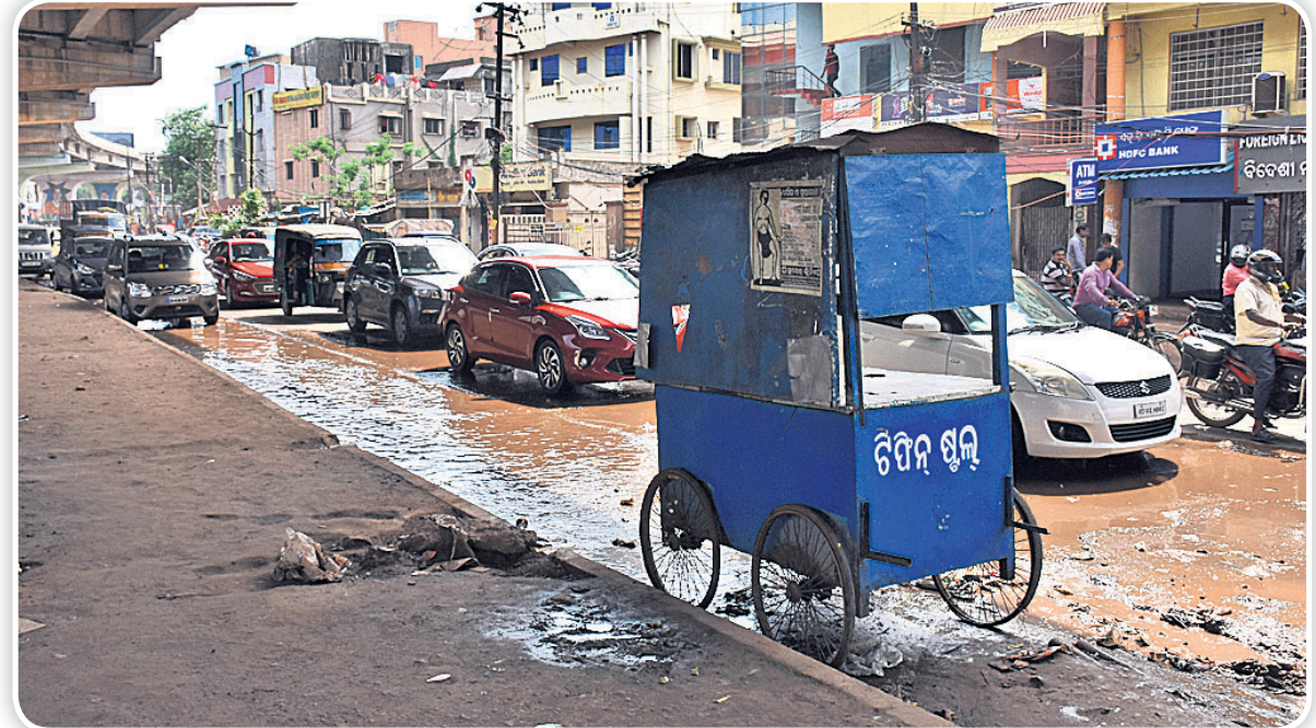
ରସୁଲଗଡ଼ ଛକ ନିକଟ ରାସ୍ତା ଉପରେ ରହିଥିବା ଚିପିନ୍ ଷ୍ଟଲ