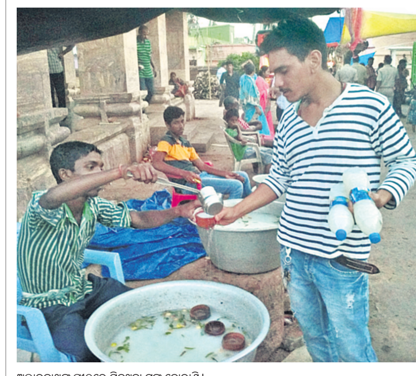
ଅଲାରନାଥଙ୍କ ପୀଠରେ ମିଳୁଥିବା ଚକ ତୋରାଣି ।