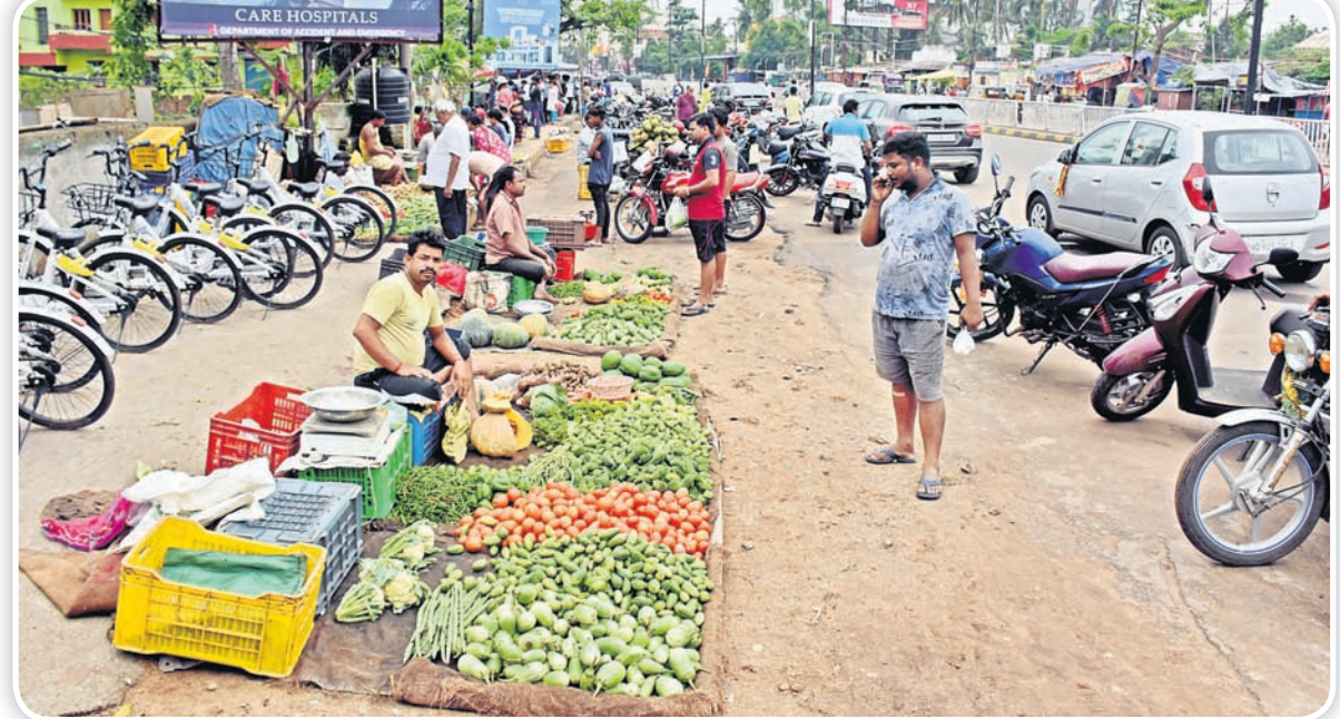
ରସୁଲଗଡ଼ ଛକ ନିକଟ ରାସ୍ତା କଡ଼ରେ ପରିବା ପସରା ଓ ରାସ୍ତା ଜାମ୍