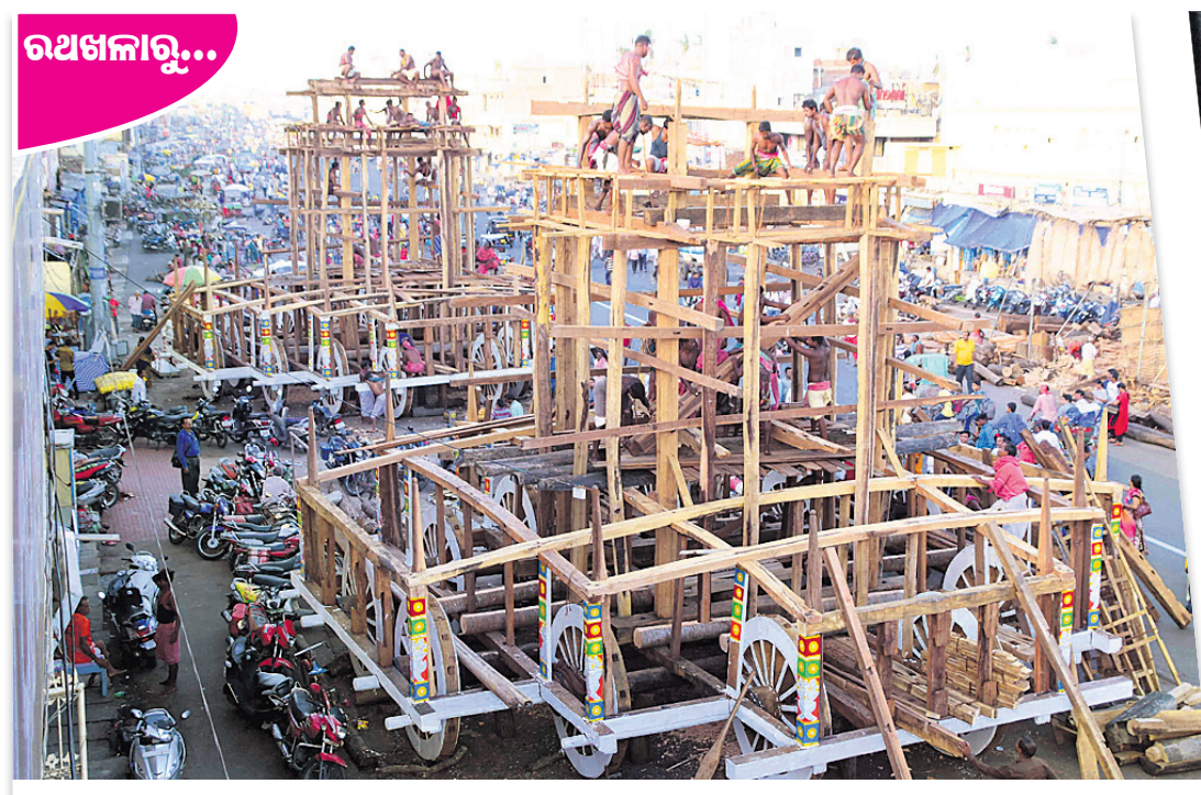
ରଥ ଉପରକୁ ଛ' କାଠ ଉଠାଯାଇଛି ।