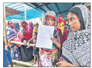
କୃଷ୍ଣାହାରୀ, ୨୬୬୭ (ପି.ଟି.)

ଆସାମ ସରକାରଙ୍କ ପକ୍ଷରୁ କୁଧିଆରୀ କାଟାୟ ନାଗରିକ ପଞ୍ଜିକା (ଏନ୍‌ଆର୍‌ସି) ପ୍ରକାଶ ପାଇଛି। ଏଥିରୁ ଆଉ ଲକ୍ଷାଧିକ ଲୋକ ବାଦ୍ ପଡ଼ିଛନ୍ତି। ଗତବର୍ଷ ଜୁଲାଇ ୩୦ରେ ପ୍ରକାଶିତ ଏନ୍‌ଆର୍‌ସି ଟିଠାରୁ ଆସାମର ୪୦ ଲକ୍ଷ ଲୋକଙ୍କୁ ବାଦ୍ ଦିଆଯାଇଥିବାବେଳେ ଏହାକୁ ନେଇ ବିବାଦ ଉଠିଥିଲା। ସୁପ୍ରିମକୋର୍ଟଙ୍କ ଡିକ୍ୱାଏନାସରେ ସମାଧାନ କରାଯାଇ ଏବେ ଅତିରିକ୍ତ ଭାବେ ଆହୁରି ୧୦୨,୪୬୭ ଜଣଙ୍କୁ ଅଯୋଗ୍ୟ ଘୋଷଣା କରାଯାଇଛି। ଆସାମର ଏନ୍‌ଆର୍‌ସି ସଂଯୋଜକଙ୍କ ପକ୍ଷରୁ କାରି ଏକ ବିକୃତିରେ କୁହାଯାଇଛି ଯେ, ୨୦୧୮ ଜୁଲାଇ ୩୦ରେ ପ୍ରକାଶିତ ଟିଠା ତାଲିକାରେ ସ୍ଥାନିତ ବ୍ୟକ୍ତିଙ୍କ ମଧ୍ୟରୁ ୧,୦୨,୪୬୭ ଜଣଙ୍କୁ ବିଭିନ୍ନ କାରଣରୁ ଅଯୋଗ୍ୟ ଘୋଷଣା କରାଯାଇଛି। ଲୋକାଳ ରେକର୍ଡ୍‌ସ୍‌ ଅଫ୍‌ ସିଟିଜେନ୍‌ ରେକର୍ଡ୍‌ସ୍‌ (ଏଲ୍‌ଆର୍‌ସିଆର୍‌)ଙ୍କ ପକ୍ଷରୁ ଚାଲିଥିବା ଯାଞ୍ଚ ପ୍ରକ୍ରିୟାରେ ଏମାନଙ୍କୁ ଚିହ୍ନଟ କରାଯାଇଛି। ଆସାମରେ ବେଆଇନ ଭାବେ ବସବାସ କରୁଥିବା ପ୍ରବାସୀଙ୍କୁ ଚିହ୍ନଟ କରିବା ପାଇଁ ୧୯୫୧ ପରେ ପ୍ରଥମଥର ପାଇଁ ତାଲିକା ପ୍ରସ୍ତୁତ କରାଯାଇଛି। ସୁପ୍ରିମକୋର୍ଟଙ୍କ ଡିକ୍ୱାଏନାସରେ ଏହି କାର୍ଯ୍ୟ କରାଯାଇଛି। ଏହାର ଚୁଡ଼ାନ୍ତ ତାଲିକା ଜୁଲାଇ ୩୧ରେ ପ୍ରକାଶ ପାଇବ। କେଉଁମାନଙ୍କୁ କାହିଁକି ବାଦ୍ ଦିଆଯାଇଛି ସେସମ୍ପର୍କିତ ତଥ୍ୟ ଏନ୍‌ଆର୍‌ସି ଫ୍ରେଣ୍ଡ୍‌ସ୍‌ଓଫ୍‌ସ୍‌ ଉପଲକ୍ଷ୍ୟ କରାଯାଇଛି ଏବଂ ସମ୍ପୂର୍ଣ୍ଣ ବ୍ୟକ୍ତିଙ୍କୁ ପତ୍ର ଜରିଆରେ ଅବଗତ କରାଯିବ। ବାଦ୍ ପଡ଼ିଥିବା ବ୍ୟକ୍ତି ଏଥିରେ ଅନ୍ତର୍ଭୁକ୍ତ ହେବା ପାଇଁ ନିଜ ଦାବି ଜଣାଇପାରିବେ। ଜୁଲାଇ ୫ରୁ ଏହା ଆରମ୍ଭ ହେବ। ପ୍ରକାଶ ଯେ, ୩.୨୯ କୋଟି ଲୋକ ଏନ୍‌ଆର୍‌ସିରେ ସାମିଲ ପାଇଁ ଆବେଦନ କରିଥିବାବେଳେ ୨.୯ କୋଟି ଯୋଗ୍ୟ ବିବେଚିତ ହୋଇଛନ୍ତି।