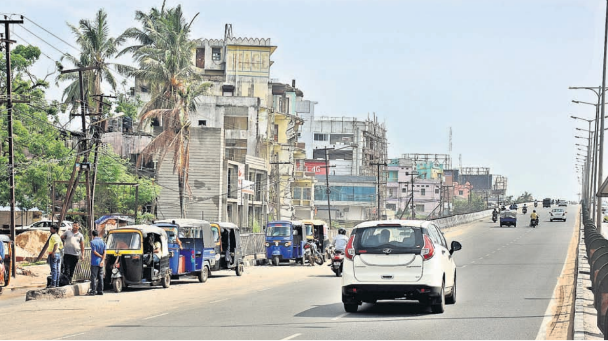
ପଳାଶୁଣୀ ପଟୁ ରସୁଲଗଡ଼ ପ୍ୟୁଏଉର ଆରମ୍ଭ ସ୍ଥଳରେ ଛିଡ଼ା ହୋଇ ରହିଥିବା ଅଗୋ ବିକ୍ରୀ