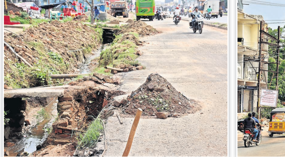
ପଳାଶୁଣୀ ମୁଖ୍ୟରାସ୍ତା କଡ଼ରେ ଗଦା ହୋଇରହିଛି ନର୍ଦ୍ଦମା ମାଟି