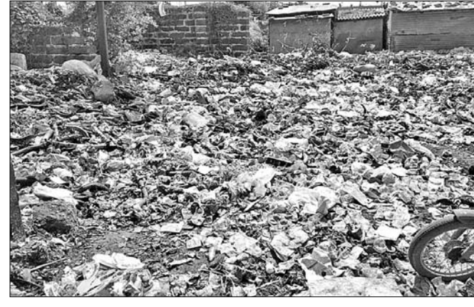
ବାରଙ୍ଗ ଷ୍ଟେଶନ ବଜାରରେ ଗଦା ହୋଇଥିବା ପଲିଥିନ ଆବର୍ଜନା।

ଅଲୋକର ୨୦୧୮ରେ ସରକାର ପଲିଥିନ ବ୍ୟବହାର ଉପରେ ସମ୍ପୂର୍ଣ୍ଣ ରୋକ ଲଗାଇଥିଲେ। ହେଲେ ବାରଙ୍ଗ ଓ ଏହାର ଆଖପାଖ ଅଞ୍ଚଳରେ ଥିବା ଦୋକାନରେ ବ୍ୟବହାର ଓ ବିକ୍ରି ହେଉଥିବା ଦେଖିବାକୁ ମିଳିଛି। ଏନେଇ ସରକାରଙ୍କ ପକ୍ଷରୁ କୌଣସି ପଦକ୍ଷେପ ଗ୍ରହଣ କରାଯାଇ ନାହିଁ। କଟକ ଓ ଭୁବନେଶ୍ୱର ମଧ୍ୟରେ ବାରଙ୍ଗ ହୋଇଥିଲେ ମଧ୍ୟ ଏହି ଅଞ୍ଚଳ ପୁନିସିପାଲିଟିରେ ଯାଉ ନାହିଁ। ଫଳରେ ସବୁ ସ୍ଥାନରେ ବୁଡ଼ୁଥିବା ପଲିଥିନ ଗଦା ହୋଇଥିବା କୋଣେ ଅଜିଆ ଭଠାଇବା ପାଇଁ ବୋକାଳି ବ୍ୟବସ୍ଥା ନାହିଁ। ଅନ୍ୟପକ୍ଷରେ ସରକାର ବିଭିନ୍ନ କାର୍ଯ୍ୟକ୍ରମ ଓ ବିଜ୍ଞାପନ ଦ୍ୱାରା ଜନସାଧାରଣଙ୍କୁ ସଚେତନ କରାଉଛନ୍ତି। ଏହା ସହ ବିଭିନ୍ନ ସଙ୍ଗଠନ ସ୍ୱତନ୍ତ୍ର ଭାବେ କାର୍ଯ୍ୟକ୍ରମ କରି ସଚେତନ କରାଉଥିଲେ ମଧ୍ୟ ତାହାର ସୁଫଳ ମିଳୁନି। ଏପରି କି ଗାନ୍ଧି ଜମିରେ ପଲିଥିନ ପତ୍ରବା ଦ୍ୱାରା ମାଟିରେ ନ ମିଶିବା ଫଳରେ ଦାଗଜମି ନଷ୍ଟ ହେଉଛି। ବିଭିନ୍ନ ସମୟରେ ଖାଦ୍ୟ ପଲିଥିନରେ ନେଇ ଲୋକମାନେ ବାହାରେ ଫୋପାଡ଼ିବା ଦ୍ୱାରା ତାକୁ ଗୋରୁ ଖାଇ ମୃତ୍ୟୁବରଣ କରୁଥିବା ଚର୍ଚ୍ଚା ହେଉଛି। ଅପରପକ୍ଷେ