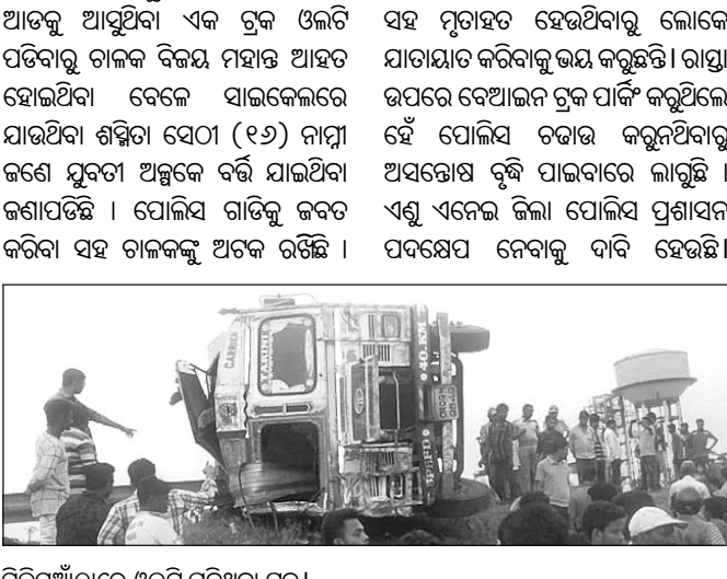
ସିଲିଭୁଆଁଠାରେ ଓଲଟି ପଡ଼ିଥିବା ଟ୍ରକ୍।

ସବୁବେଳେ ବେପରୁଆ ଗାଡି ଚାଳନା ଏବଂ ଆନା ଅତ୍ୟନ୍ତ ସିଲିଭୁଆଁ ନିକଟରେ ଏକ ଟ୍ରକ୍ ଗଡିରେ କେନ୍ଦୁଝର ଆଡ଼କୁ ଆସୁଥିବା ଏକ ଟ୍ରକ୍ ଓଲଟି ପଡିବାରୁ ଗାଳକ ବିକ୍ରୟ ମହାନ୍ତ ଆହତ ହୋଇଥିବା ବେଳେ ସାଇକେଲରେ ଯାଉଥିବା ଶମ୍ଭରା ସେଠା (୧୨୭) ନାମ୍ନା ଜଣେ ମୁକ୍ତ ଅଳ୍ପବୟସ୍କ ବର୍ତ୍ତୀ ଯାଇଥିବା ଜଣାପଡିଛି। ପୋଲିସ୍ ଗାଡିକୁ ଜବତ କରିବା ସହ ଚାଳକଙ୍କୁ ଅଟକ ରଖିଛି। ସବୁବେଳେ ବେପରୁଆ ଗାଡି ଚାଳନା ଓ ସାପ୍ର ଗଡିରେ ଗାଡି ଚାଳନା ଯୋଗୁଁ ଉକ୍ତ ଅଞ୍ଚଳରେ ବହୁ ଦୁର୍ଘଟଣା ଘଟିବା ସହ ମୃତ୍ୟୁ ହେଉଥିବାରୁ ଲୋକେ ଯାତାଯାତ କରିବାକୁ ଭୟ କରୁଛନ୍ତି। ରାସ୍ତା ଉପରେ ବେଆଇନ ଟ୍ରକ୍ ପାର୍କିଂ କରୁଥିଲେ ହେଁ ପୋଲିସ୍ ଚରାକ କରୁନଥିବାରୁ ଅସନ୍ତୋଷ ବୃଦ୍ଧି ପାଇବାରେ ଲାଗୁଛି। ଏଣୁ ଏନେଇ ଜିଲ୍ଲା ପୋଲିସ୍ ପ୍ରଶାସନ ପଦକ୍ଷେପ ନେବାକୁ ଦାବି ହେଉଛି।