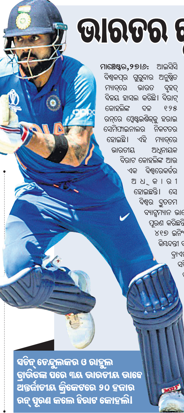
ସଚିନ୍ ଟେଣ୍ଡୁଲକାର ଓ ରାହୁଲ ଦ୍ରାଭିଡ଼ଙ୍କ ପରେ ୩ୟ ଭାରତୀୟ ଭାବେ ଅନ୍ତର୍ଜାତୀୟ କ୍ରିକେଟରେ ୨୦ ହଜାର ରନ୍ ପୂରଣ କଲେ ବିରାଟ କୋହଲି।