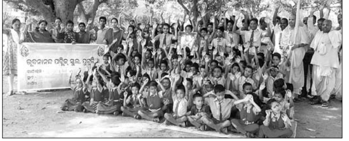
ଭୁବନାନନ୍ଦ ପବ୍ଲିକ୍ ସ୍କୁଲର ପ୍ରତିଷ୍ଠା ଦିବସରେ ଛାତ୍ରଛାତ୍ରୀ ଓ ଅନୁମାପନେ।