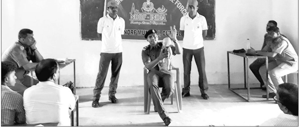
ଶିବିରରେ ପ୍ରଶିକ୍ଷଣ ଦିଆଯାଇଛି।