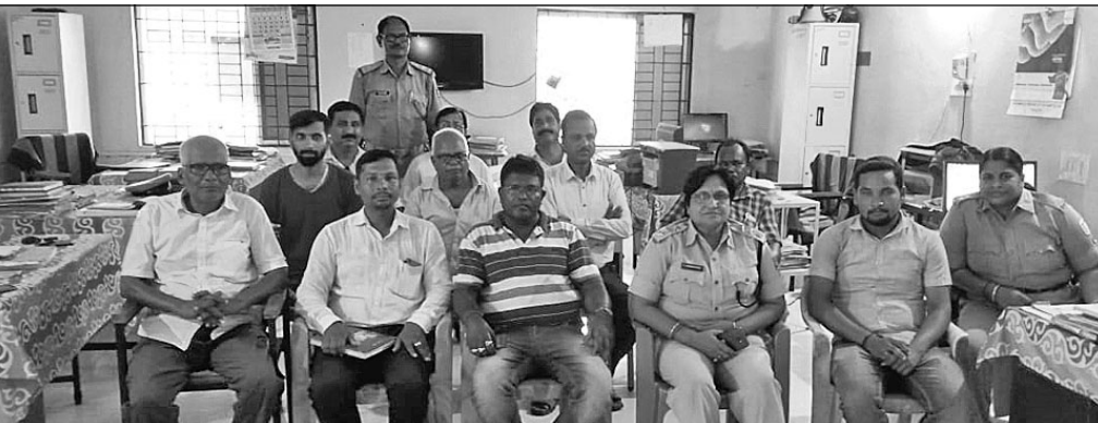
ବିଦ୍ୟୁତ୍ ବିଭାଗ ଅଧିକାରୀଙ୍କ ସହ ବିକାଶ ମଞ୍ଚର ଆଲୋଚନା