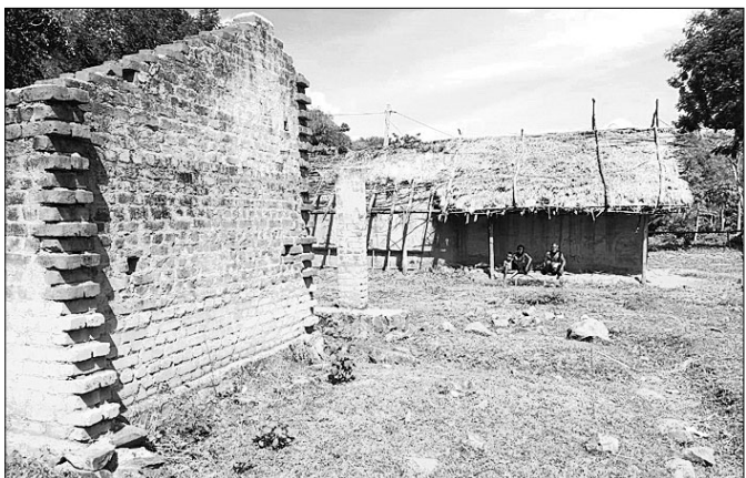
ଲଜ୍ଜା ଘର ଆଗରେ ଏକ ପରିବାର।

ସଂଗଠନକୁ ୨୭୬ ପରିବାରର ଗୃହ ନିର୍ମାଣ ନିର୍ଦ୍ଦେଶ ରହିଛି। ୨୦୧୭ ମସିହାକୁ ଅଧ୍ୟାବଧି ମାତ୍ର ୩୦ ପ୍ରତିଶତ