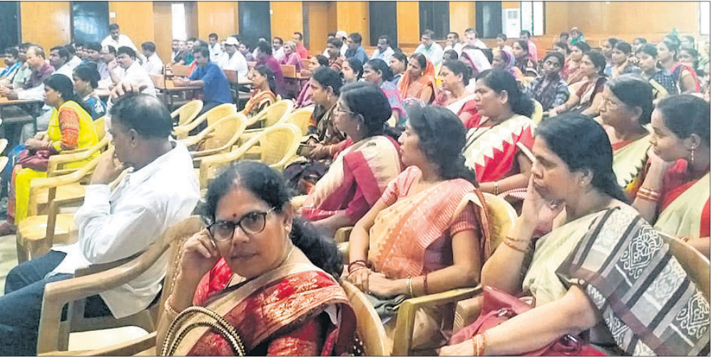
କ୍ୟାପିଟାଲ ହାଇସ୍କୁଲରେ ଶୁକ୍ରବାର ଅନୁଷ୍ଠିତ ଶିକ୍ଷକ-ଅଭିଭାବକ ବୈଠକ।