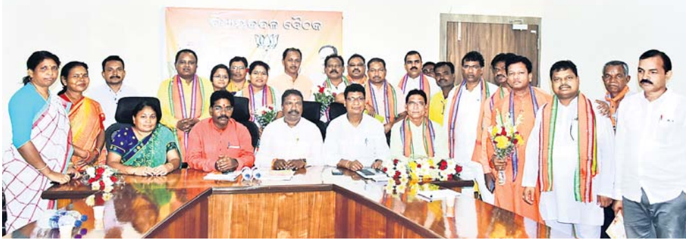
ଭାବପା ରାଜ୍ୟ କାର୍ଯ୍ୟକ୍ରମରେ ୧୧ ଅନୁସୂଚିତ ଜାତି ବିଧାୟକଙ୍କ ସମ୍ପର୍କିତ କରାଯାଇଛି ।