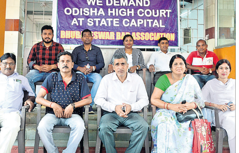
ଓଡ଼ିଶା ହାଇକୋର୍ଟକୁ ଭୁବନେଶ୍ୱର ସ୍ଥାନାନ୍ତର ଦାବିରେ ଭୁବନେଶ୍ୱର ବାର ଆସୋସିଏଶନ ପକ୍ଷରୁ ଶୁକ୍ରବାର କୋର୍ଟ ପରିସରରେ ଧାରଣା ଦିଆଯାଇଛି।