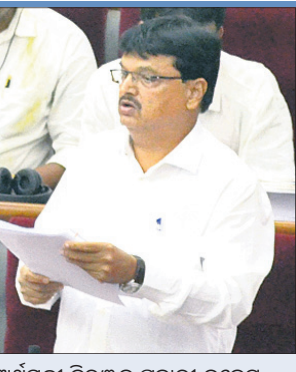
ଅର୍ଥମନ୍ତ୍ରୀ ନିରଞ୍ଜନ ପୂଜାରୀ ବଜେଟ୍ ଉପସ୍ଥାପନ କରୁଛନ୍ତି ।