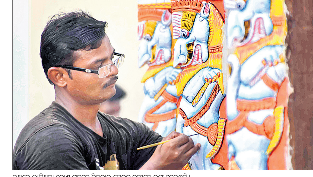
ରଥରେ ଲାଗିଥିବା କୋଣ ଗୁଳରେ ତିବ୍ରକାର ସେବକ ବୁଢ଼ାରେ ରଙ୍ଗ ଦେଉଛନ୍ତି ।