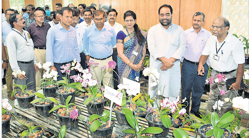
ଲୋକାର୍ପଣ ଅବସରରେ ଅଜିତାରିୟମ୍କୁ ବୁଲି ଦେଖୁଛନ୍ତି ଜଙ୍ଗଲ ଓ ପରିବେଶ ମନ୍ତ୍ରୀ ଏବଂ ଅନ୍ୟମାନେ।

ଆଞ୍ଚଳିକ ଉଦ୍ଭିଦ ସମ୍ପଦ କେନ୍ଦ୍ର (ଆର୍ପିଆରସି)ର ବନାନିକାଳ ଗାଉଁଟନରେ ଶୁକ୍ରବାର ଅଜିତାରିୟମ୍ ଲୋକାର୍ପିତ ହୋଇଯାଇଛି। ଜଙ୍ଗଲ ଓ ପରିବେଶ ମନ୍ତ୍ରୀ ବିକ୍ରମ କେଶରୀ ଆରମ୍ଭ ଏହାକୁ ଲୋକାର୍ପିତ କରି କହିଛନ୍ତି ଯେ, ଉଦ୍ଭିଦ ସଂରକ୍ଷଣ ଓ ଗବେଷଣା ହେଉଛି ଆଞ୍ଚଳିକ ଉଦ୍ଭିଦ ସମ୍ପଦ କେନ୍ଦ୍ରର ମୁଖ୍ୟ ଉଦ୍ଦେଶ୍ୟ। ଓଡ଼ିଶାର ଅନନ୍ୟ ଉଦ୍ଭିଦ ସମ୍ପଦର ସଂରକ୍ଷଣ ଦିଗରେ ଏହା ନିରବଚ୍ଛିନ୍ନ ଭାବରେ ସ୍ୱତନ୍ତ୍ର ଗୁରୁତ୍ୱ ଦେଇଆସୁଛି। ରାଜ୍ୟର ବନ୍ୟ ଅଜିତ୍ ସଂରକ୍ଷଣ ଓ ବ୍ୟବହାର ବିଧିବଦ୍ଧ ଏବଂ ସଂଗ୍ରହଣ ସହ ବ୍ୟବସାୟିକ ଗୁରୁତ୍ୱ ଦେବା ହାଇବ୍ରିଡ୍ ଅଜିତ୍ ଉପରେ ଗବେଷଣା ଏହି ଅନୁଷ୍ଠାନର ସ୍ୱତନ୍ତ୍ର କାର୍ଯ୍ୟକ୍ରମ। ଆମ ରାଜ୍ୟର ଜଙ୍ଗଲ ବିଶେଷ କରି ଶିମିଳିପାଳ, ମହେନ୍ଦ୍ରଗିରି, ସିଂହରାଜୁ, ମାଲ୍ୟଗିରି ଓ କେଉଁଠି ଜଙ୍ଗଲରେ ୧୪୮ ପ୍ରକାରର ଅଜିତ୍ ଦୃଶ୍ୟଗୋଚର ହୋଇଥାଏ। ଆଞ୍ଚଳିକ ଉଦ୍ଭିଦ ସମ୍ପଦ କେନ୍ଦ୍ରରେ ୧୩ଟି ବନ୍ୟ ଅଜିତ୍ ଓ ୨୧୭ ହାଇବ୍ରିଡ୍ ଅଜିତ୍ ରହିଛି। ଆଞ୍ଚଳିକ ଉଦ୍ଭିଦ