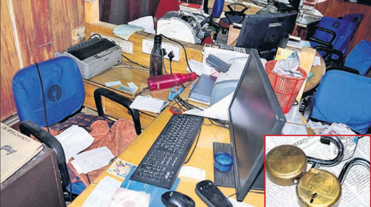
କଟକ ଅଫିସ, ୨୮୬

ମଙ୍ଗଳାବାର ଥାନା ଠାରୁ ମାତ୍ର ୫୦୦ ମିଟର ଦୂର ଗୋପାଳସାହି ଅଞ୍ଚଳରେ ଥିବା ଭାରତୀୟ ଷ୍ଟେଟ୍‌ବ୍ୟାଙ୍କରୁ ଚୋରି ଉଦ୍ୟମ ହୋଇଥିବା ଶୁକ୍ରବାର ଅଭିଯୋଗ ହୋଇଛି। ଗୁରୁବାର ବିଳମ୍ବିତ ରାତିରେ ଚୋରମାନେ ବ୍ୟାଙ୍କର ଗ୍ରାମ୍ ତାଡ଼ିଥିଲେ। ଏହାପରେ ସେଠାରେ ଥିବା କର୍ମଚାରୀ ତାଲା ଭାଙ୍ଗି ଭିତରକୁ ପଶିଥିଲେ। ବ୍ୟାଙ୍କର ଲକର ରୁମ୍ ଭାଙ୍ଗିବାକୁ ଉଦ୍ୟମ କରୁଥିବାବେଳେ ସେଠାରେ ଲାଗିଥିବା ସାଇରନ ହଠାତ୍ ବାଜି ଉଠିବାରୁ ସେମାନେ ପଳାଇ ଯାଇଥିଲେ। ଏ ନେଇ ବ୍ୟାଙ୍କ ମ୍ୟାନେଜର ଅଭିଯୋଗ କରିବା ପରେ ପୋଲିସ୍ ଓ ସାଇଟିଂସିଂ ବିନ୍ସ ଘଟଣାସ୍ଥଳରେ ପହଞ୍ଚି ତଦନ୍ତ କରିଛନ୍ତି। ଏହି ଘଟଣାରେ ବ୍ୟାଙ୍କ କର୍ତ୍ତୃପକ୍ଷ ସେଠାରେ ଲାଗିଥିବା ସିସିଡିଭି ଯାଞ୍ଚ କରିବାକୁ ପୂରା ଘଟଣା ସମ୍ପର୍କରେ ଜଣାପଡ଼ିଥିଲା। ୪ ଟୁର୍କିସ ପ୍ରଥମେ ଗ୍ରାମ୍ ତାଡ଼ିବା ପରେ କର୍ମଚାରୀ ତାଲା ଭାଙ୍ଗି ରାତିପ୍ରାୟ ସାଢ଼େ ୨ଟାରେ ବ୍ୟାଙ୍କ ଭିତରକୁ ପଶିଥିଲେ।