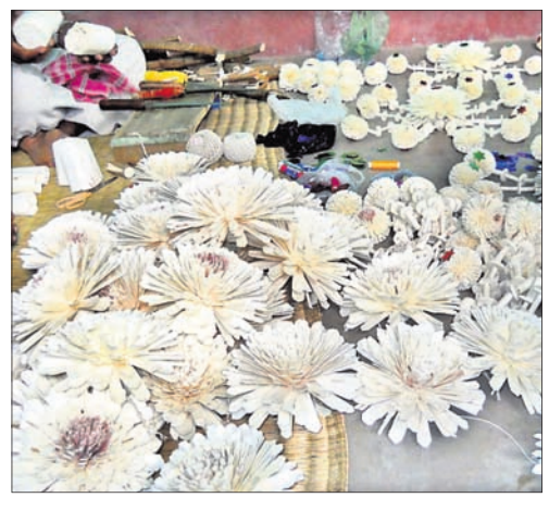
ଖୋର୍ଦ୍ଧା ଅଫିସ, ୨୮.୬