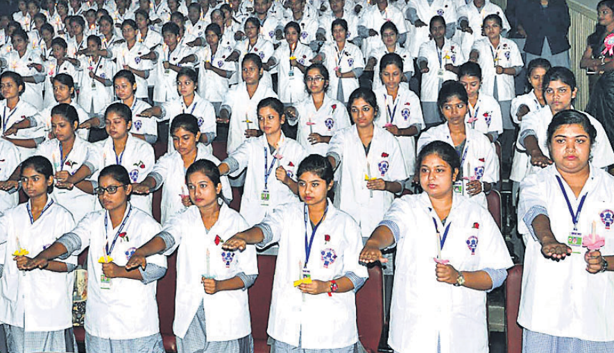
କଟକ ଜିଲା ଡ୍ରିପ୍ ସ୍କୁଲ ଆଞ୍ଚଳିକ ଅଫ ନର୍ସିଂ ଛାତ୍ରୀମାନେ ଶୁକ୍ରବାର ବୃତ୍ତିଗତ ଶପଥ ପାଠ ନେଉଛନ୍ତି।