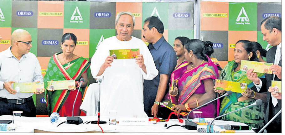
ପୁରୀ ଅଫିସ, ୨୮.୬