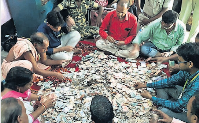
ମନ୍ଦିର ହୁଣ୍ଡି ଗଣତି ଚାଲିଛି।