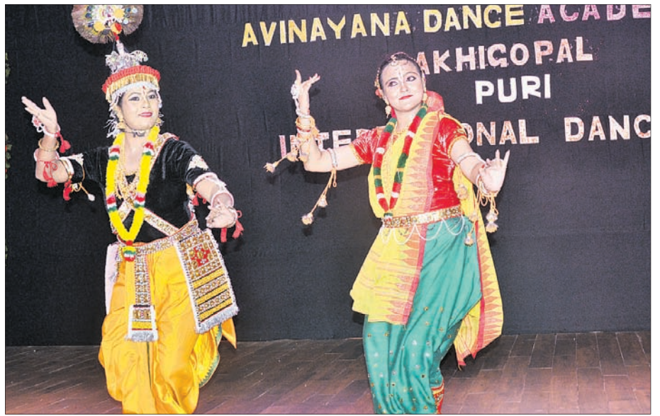
ଅଭିନୟନ ବ୍ୟାଦ୍ ଏକାଡେମୀ ଦ୍ୱାରା ପୁରୀ ସଂସ୍କୃତ ଭବନରେ ଶୁକ୍ରବାର ଅନୁଷ୍ଠିତ ଅନ୍ତର୍ଜାତୀୟ ବ୍ୟାଦ୍ ଭବନରେ ଶିଳ୍ପୀମାନେ ମଣିପୁରୀ ନୃତ୍ୟ ପରିବେଷଣ କରୁଛନ୍ତି।

ବ୍ୟାଙ୍କ ପରିସରରେ ବିକ୍ଷିପ୍ତ ଭାବେ ପଡ଼ିଥିବା ଆସବାବପତ୍ର। ଚୁର୍ଚ୍ଚିତମାନେ ଭାଙ୍ଗିଥିବା ତାଲା (ଇନସେଟ)। ପକାଇ ଯାଇଥିଲେ। ଶୁକ୍ରବାର ପୂର୍ବାହ୍ନ ୯ଟାରେ ବ୍ୟାଙ୍କରେ କାର୍ଯ୍ୟରତ ଜଣେ ଚୋରମାନେ ଖୋଲାଖୋଲି କରି କାଗଜପତ୍ର ପୁରୁଷାକର୍ମୀ ବ୍ୟାଙ୍କରେ ପହଞ୍ଚିବା ପରେ ଗ୍ରାମ୍ ତଡ଼ାଯାଇଥିବାବେଳେ ଓ ତାଲା ଭଙ୍ଗା ଯାଇଥିବା ଦେଖିବାକୁ ପାଇଥିଲେ। ଏ ନେଇ ସେ ଜଣାଇବାକୁ ବ୍ୟାଙ୍କ କର୍ତ୍ତୃପକ୍ଷ ଘଟଣାସ୍ଥଳରେ ପହଞ୍ଚିଥିଲେ। ବ୍ୟାଙ୍କ ଭିତରେ ଥିବା କାଗଜପତ୍ର ତଳେ ପଡ଼ିଥିଲା। ପରେ ବ୍ୟାଙ୍କ କର୍ତ୍ତୃପକ୍ଷ ସେଠାରେ ଲାଗିଥିବା ସିସିଡିଭି ଯାଞ୍ଚ କରିବାକୁ ପୂରା ଘଟଣା ସମ୍ପର୍କରେ ଜଣାପଡ଼ିଥିଲା। ୪ ଟୁର୍କିସ ପ୍ରଥମେ ଗ୍ରାମ୍ ତାଡ଼ିବା ପରେ କର୍ମଚାରୀ ତାଲା ଭାଙ୍ଗି ରାତିପ୍ରାୟ ସାଢ଼େ ୨ଟାରେ ବ୍ୟାଙ୍କ ଭିତରକୁ ପଶିଥିଲେ।