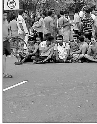
କାତୀୟ ରାଜପଥରେ ମୃତଦେହ ରଖି ଉତ୍ତମକ୍ରମେ ଗ୍ରାମବାସୀ ରାସ୍ତାବରୋଧ କରିଛନ୍ତି ।