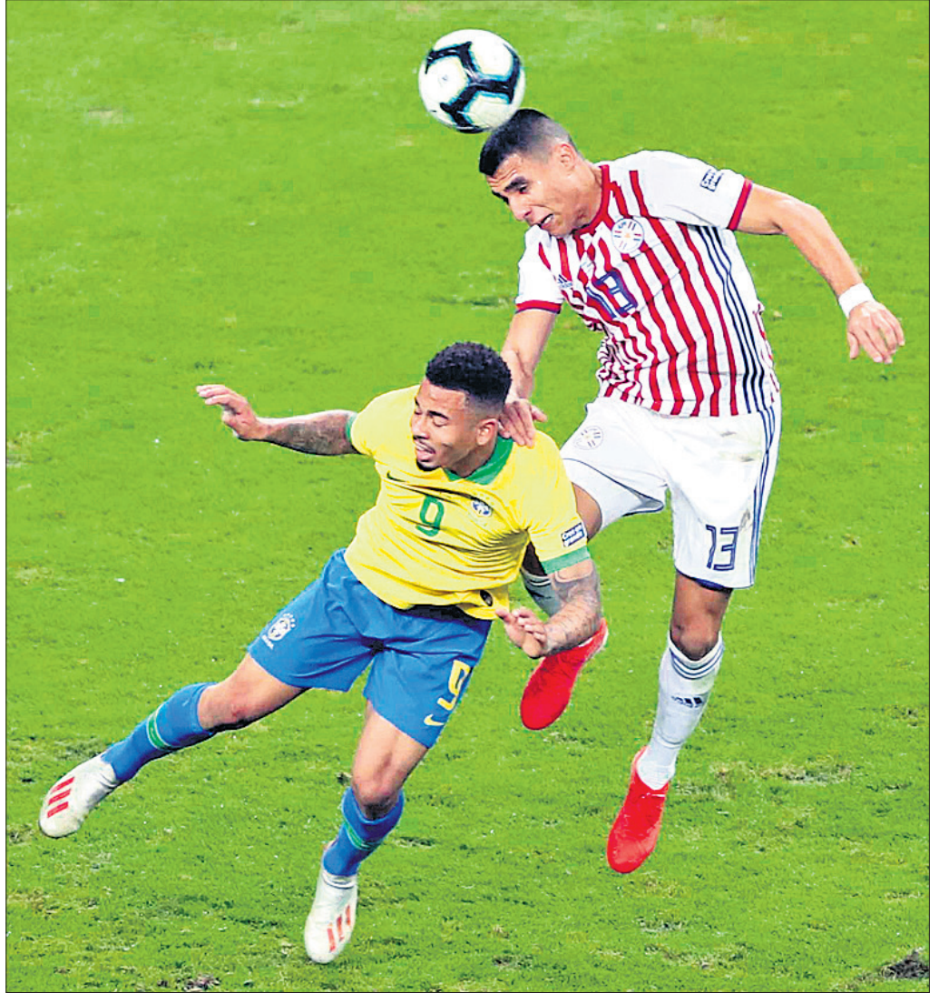
କୋପା ଆମେରିକା ପୁରୁବଳ: ବ୍ରାଜିଲ ଓ ପାରାଗୁଏ ମଧ୍ୟରେ ଅନୁଷ୍ଠିତ ମ୍ୟାଚ୍ରେ ଏକ ସଂଘର୍ଷପୂର୍ଣ୍ଣ ମୁହୂର୍ତ୍ତ।

ମିସ୍ କରିଥିଲେ। ପାରାଗୁଏ ପକ୍ଷରୁ ଆଲମିରନ, ଭାଲଡେକ ଓ ଆର. ରୋଜାସ ଗୋଲ ଦେଇଥିବାବେଳେ ଦୁଇ ଚାରକା ଖେଳାଳି ଗୁସ୍ତାଭୋ ଗୋମେଜ ଓ ଆଲବର୍ଟୋ ଗୋଷ୍ଟାଲୋକ ମିସ୍ କରିଥିଲେ। ପାରାଗୁଏର ଗୋମେଜଙ୍କ ଉଦ୍ୟମକୁ ବ୍ରାଜିଲ ଗୋଲକିପର ଆଲିସନ ବେକାର କରି ଦେଇଥିଲେ। ତାଙ୍କ ପରେ ଗତ ମ୍ୟାଚ୍ରେ ପେନାଲ୍ଟି ହାତଛଡ଼ା କରିଥିବା ଗାବ୍ରିଏଲ ଜିସସ ବ୍ରାଜିଲ ଲାଗି ବିଜୟ ସୁତକ ଗୋଲ ଦେଇଥିଲେ। ବ୍ରାଜିଲ ଗଣମାଧ୍ୟମ ଏହି ମ୍ୟାଚ୍ ଖବର ଛାପିଲା ବେଳେ ୨୦୧୧ରେ ଆର୍ଜେଣ୍ଟିନା ଏବଂ ଏହାର ୪ ବର୍ଷ ପରେ ଚିଲିରେ ଯନ୍ତ୍ରଣାବାଦକ ସ୍ମୃତିକୁ ମନେ ପକାଇଛନ୍ତି। ପାରାଗୁଏ କିପରି ରକ୍ଷଣାତ୍ମକ ଖେଳ ଖର୍ଚ୍ଚ କିଏ ଲଗେଇବେ କିପାଟ୍ ହାସଲ କରିଥିଲା ତାହାକୁ ସେମାନେ ଉଲ୍ଲେଖ କରିବାକୁ ଭୁଲି ନାହାନ୍ତି। ଏଥର କିନ୍ତୁ ଗୋଲକିପର ଆଲିସନଙ୍କ ତମ୍ବୁର ଗୋଲ ରକ୍ଷଣା ଯୋଗୁ ବ୍ରାଜିଲ କିପାଟ୍ ହାସଲ କରିଛି। ଆର୍ଜେଣ୍ଟିନା ଓ ଭେନେସୁଏଲା ମଧ୍ୟରେ ବିତୀୟ କ୍ୱାର୍ଟର ଫାଇନାଲ ଅନୁଷ୍ଠିତ ହେବ। ଏହାର ବିଜେତାକୁ ବ୍ରାଜିଲ ସେମିଫାଇନାଲରେ ଭେଟିବ।