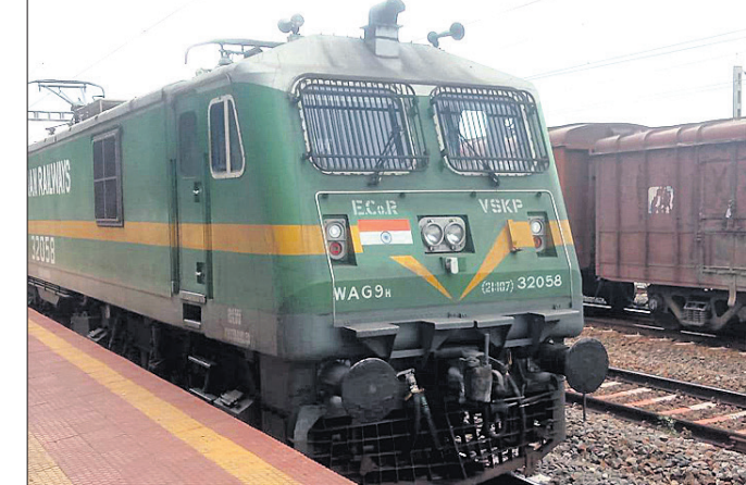
ଭୋର ସାଡ଼େ ୫ଟାରେ ଜୟପୁର ଷ୍ଟେସନରେ ପହଞ୍ଚିଥିବା ସମଲେଶ୍ୱରୀ ଟ୍ରେନ୍ ଦିନ ଏକ ଇଞ୍ଜିନ ଯାଇ ଟ୍ରେନ୍କୁ ଆଣିଥିଲା।

ଜଗନ୍ନାଥ-ହାୱଡ଼ା ସମଲେଶ୍ୱରୀ ଟ୍ରେନ୍ ଯାନ୍ତ୍ରିକ ତ୍ରୁଟି ପାଇଁ ଶୁକ୍ରବାର କୋରାପୁଟ ଜିଲ୍ଲା କୋଟପାଡ଼ ରୋଡ଼-ଜୟପୁର ଷ୍ଟେସନ ମଧ୍ୟରେ ୬ ଘଣ୍ଟା ଅଟକି ରହିଛି।