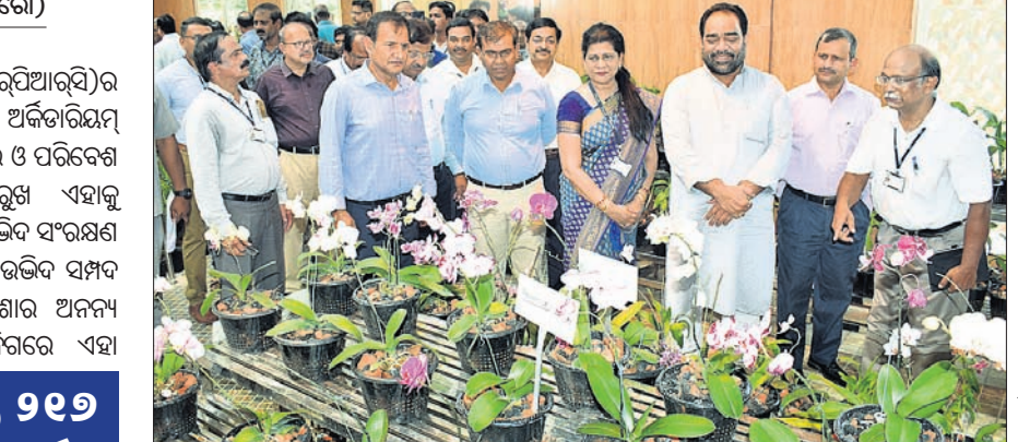
ଲୋକାର୍ପଣ ଅବସରରେ ଅର୍ଜିତାରିୟମ୍ ବୁଲି ଦେଖୁଥିବା ଜଣକ ଓ ପରିବେଶ ମନ୍ତ୍ରୀ ଏବଂ ଅନ୍ୟମାନେ।

ଆଞ୍ଚଳିକ ଉଦ୍‌ବେଗ ସମ୍ମେଳନ (ଆରପିଆରସି)ର ବଚାନିକାଲ୍ ଗାଉଁସନରେ ଶୁକ୍ରବାର ଅର୍ଜିତାରିୟମ୍ ଲୋକାର୍ପିତ ହୋଇଯାଇଛି।