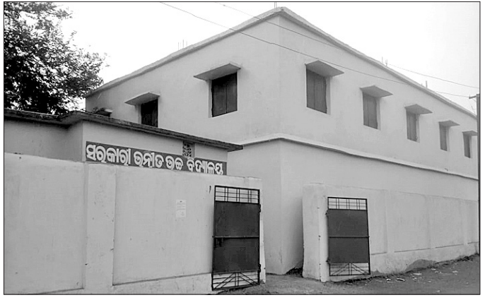
କାଲୋପଲ୍ଲା ଅପଗ୍ରେଡ଼ ହାଇସ୍କୁଲ ।

କଳାହାଣ୍ଡି ଜିଲ୍ଲା କୁନାଗଡ଼ ବ୍ଲକ୍‌ରେ ଶିକ୍ଷା ଦ୍ୟବସ୍ଥା ଦିନକୁ ଦିନ ଭୃଷ୍ଟିବଦ୍ଧରେ ଲାଗିଛି। କେଉଁଠି ଶ୍ରେଣୀ କୋଠିର ଅଭାବ ଥିବାବେଳେ ଆଉ କେଉଁଠି ଶିକ୍ଷକ ଅଭାବ ଦେଖିବାକୁ ମିଳୁଛି। ବର୍ଷ ପରେ ବର୍ଷ ବିତିଯାଇଥିଲେ ମଧ୍ୟ ଏହାର ସମାଧାନ ହୋଇ ପାରୁନାହିଁ। ଏଥିପାଇଁ ଛାତ୍ରଛାତ୍ରୀଙ୍କ ପାଠପଢ଼ାରେ ବ୍ୟାଘତ ସୃଷ୍ଟି ହେଉଥିବା ଦେଖିବାକୁ ମିଳିଛି।