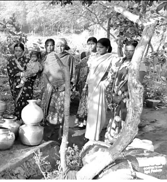
ପାଇବୁ ବିଭାଗର ପାଇଁ କେସିବି ମେଣ୍ଟିନରେ କାମ କରାଯାଇଛି ।