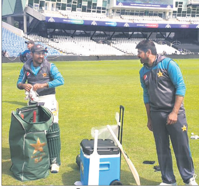
ପାକିସ୍ତାନ ଦଳର ଅଭ୍ୟାସ।

ଚଳିତ ବିଶ୍ୱକପ୍ରେ ଦଳଗତ ପ୍ରତ୍ୟାବର୍ତ୍ତନ କରିଥିବା ପାକିସ୍ତାନ ଶନିବାର ଖେଳାଳିଙ୍କୁ ଥିବା ପ୍ରଥମ ମ୍ୟାଚ୍ରେ ଅପେକ୍ଷାକୃତ ଦୁର୍ବଳ ଆଫଗାନିସ୍ତାନକୁ ଭେଟିବ। ଆରମ୍ଭରୁ ଗତି ପରାଜୟ ଓ ଗୋଟିଏ ବିନା ଫଳାଫଳ ସହ ପାକିସ୍ତାନ ଲିଭି ପର୍ଯ୍ୟାୟକୁ ବାଦ୍ ପଡ଼ିବା ସମ୍ଭାବନା ସୃଷ୍ଟି ହୋଇଥିଲା। ତେବେ ପରେ ପାକିସ୍ତାନ ଜବରଦସ୍ତ ପ୍ରଦର୍ଶନ କରି ପ୍ରତ୍ୟାବର୍ତ୍ତନ କରିବା ସହ ଦକ୍ଷିଣ ଆଫ୍ରିକା ଓ ନ୍ୟୁଜିଲାଣ୍ଡ ଭଳି ଦଳକୁ ହରାଇ ସେମିଫାଇନାଲ ଆଶା ଉଜ୍ଜ୍ୱଳ ଭାବେ ପରାସ୍ତ ହେବା ପରେ ୧୯୯୨ ଚାମ୍ପିୟନ ପାକିସ୍ତାନର ସେମି ଆଶାକୁ ଜୀବନ ମିଳିଛି। ପାକିସ୍ତାନ ଏପର୍ଯ୍ୟନ୍ତ ୭ଟି ମ୍ୟାଚ୍ ଖେଳି ଗତି ଲେଖାଏ ବିଜୟ ଓ ପରାଜୟ ଏବଂ ଗୋଟିଏ ବିନା ଫଳାଫଳ ସହ ୬ ପଏଣ୍ଟ ପାଇ ଚାଲିକାର ୫ର୍ଥ ସ୍ଥାନରେ ରହିଛି। ଅନ୍ୟପକ୍ଷେ ଆଫଗାନିସ୍ତାନ ୭ଟି ମ୍ୟାଚ୍ ଖେଳି ସବୁଥରେ ପରାସ୍ତ ହୋଇ ବିନା ପଏଣ୍ଟ ସହ ଚାଲିକାର ୯ଶମ ତଥା ଅଧିକ ସ୍ଥାନରେ ରହି ଚୁନାମେଣ୍ଟ ବାଦ୍ ପଡ଼ିଛି। ତେଣୁ ଆଫଗାନିସ୍ତାନ ଅପେକ୍ଷା ପାକିସ୍ତାନ ପାଇଁ ଏହି ମ୍ୟାଚ୍ ଅଧିକ ଗୁରୁତ୍ୱପୂର୍ଣ୍ଣ ନୁହେଁ।