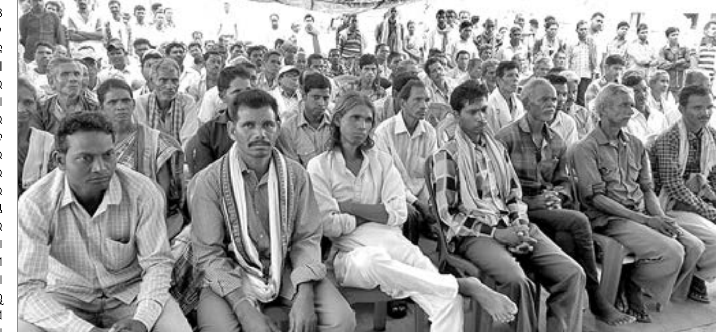
ବାଲିଶଙ୍କରା ତହସିଲ କାର୍ଯ୍ୟାଳୟ ପ୍ରାଙ୍ଗଣରେ ଜଙ୍ଗଲ ଜମି ଜନଶୁଣାଣି ଶିବିର ।