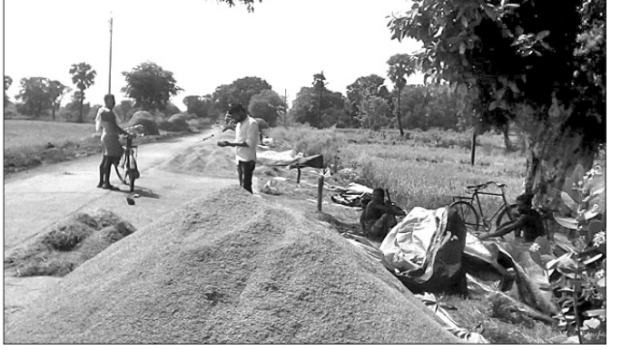
ଚାଷୀମାନେ ରାସ୍ତାରେ ଧାନ ଶୁଖାଉଛନ୍ତି ।