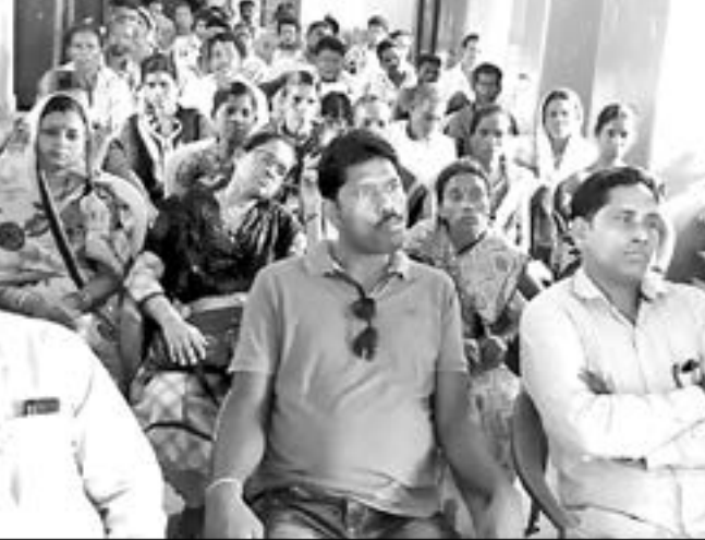
ବଡ଼ଗାଁର ସଭାରେ ଉପସ୍ଥିତ ଅଭିଭାବକ ।