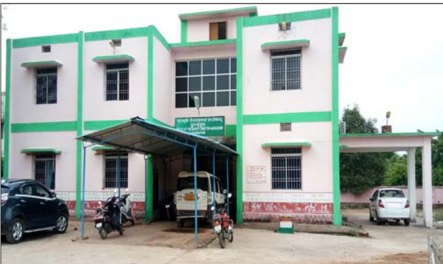
ସୁବର୍ଣ୍ଣପୁର କୃଷି ଉପନିର୍ଦ୍ଦେଶକ କାର୍ଯ୍ୟାଳୟ ।

ସୁବର୍ଣ୍ଣପୁର ଜିଲ୍ଲାରେ ୮୯ କୃଷି ଅଧିକାରୀ ଓ କର୍ମଚାରୀ ପଦବୀ ଖାଲି ପଡିଛି। ମୋଟ ୧୭୮ ପଦବୀରୁ ୮୯ ଖାଲିଥିବାରୁ ସମସ୍ୟା ସୃଷ୍ଟି ହୋଇଛି।