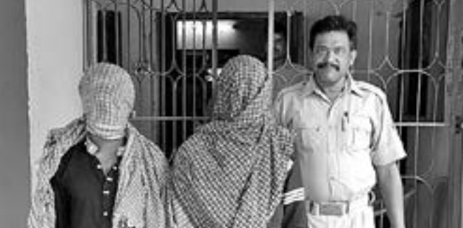
ପୋଲିସ ଅଧିକାରୀ ଜଣକ ରିପର୍ଟ ଦୁଇ ଯୁବକଙ୍କୁ ଗଣମାଧ୍ୟମ ଆଗରେ ପ୍ରଦର୍ଶନ କରୁଛନ୍ତି।

ରୁ୍ୟଶନ ପଡିବାକୁ ଯାଇ ଅପହରଣର ଶିକାର ହୋଇଥିବା ସେକ୍ଟର ୬ ଅଞ୍ଚଳର ନାବାଳିକା(୧୫)କୁ ସେକ୍ଟର-୬ ଯୋଗିୟ ଉଦ୍ଧାର କରିଛି। ଅନ୍ୟପକ୍ଷେ ଘଟଣାରେ ସମ୍ପୃକ୍ତ ସେକ୍ଟର ୬ରୁ ଏବଂ ମୁମତାଜ ଓଲକ୍ଷ ପୋଲିସ ଗିରଫ କରି ଶୁକ୍ରବାର କୋର୍ଟ ଚାଲାଣ କରିଛି। ମିଳିଥିବା ସୂଚନା ମୁତାବକ, ଗତ ୨୫ରେ ନାବାଳିକା ଜଣଙ୍କୁ ତାଳ ବାପା ଅଭିରାମପାଲୀରେ ସମ୍ପା ସାତେ ୫୫ରେ ଛାଡି ଆସିଥିଲେ। ହେଲେ ଅପହରଣକାରୀ ସେକ୍ସ ଏବଂ ୬ତମରେ ଗଣଗା ଯୁବକ ନାବାଳିକାକୁ ଆପହରଣ କରି ନେଇଥିବା ପରିବାର ଲୋକଙ୍କୁ ଖବର ମିଳିଥିଲା। ଏନେଇ ନାବାଳିକାଙ୍କ ବାପା ଶୋଭାଖୋଲି କରିଥିଲେ। ହେଲେ କୌଣସି ପଦ୍ଧା ପାଇ ନ ଥିଲେ। ଏନେଇ ସେ ସେକ୍ଟର ୬ ଆନେଇ ଅଭିଯୋଗ କରିଥିଲେ। ପୋଲିସ ଅଭିଯୋଗକୁ ଭିତ୍ତି କରି ଏକ ମାମଲା(ନଂ.୬୭/୨୦୧୯) ରୁକୁ କରି ଶୁକ୍ରବାର କୋର୍ଟ ଚାଲାଣ କରିଛି। ମିଳିଥିବା ସୂଚନା ମୁତାବକ, ଗତ ୨୫ରେ ନାବାଳିକା ଜଣଙ୍କୁ ତାଳ ବାପା ଅଭିରାମପାଲୀରେ ସମ୍ପା ସାତେ ୫୫ରେ ଛାଡି ଆସିଥିଲେ। ହେଲେ ଅପହରଣକାରୀ ସେକ୍ସ ଏବଂ ୬ତମରେ ଗଣଗା ଯୁବକ ନାବାଳିକାକୁ ଆପହରଣ କରି ନେଇଥିବା ପରିବାର ଲୋକଙ୍କୁ ଖବର ମିଳିଥିଲା। ଏନେଇ ନାବାଳିକାଙ୍କ ବାପା ଶୋଭାଖୋଲି କରିଥିଲେ। ହେଲେ କୌଣସି ପଦ୍ଧା ପାଇ ନ ଥିଲେ। ଏନେଇ ସେ ସେକ୍ଟର ୬ ଆନେଇ ଅଭିଯୋଗ କରିଥିଲେ। ପୋଲିସ ଅଭିଯୋଗକୁ ଭିତ୍ତି କରି ଏକ ମାମଲା(ନଂ.୬୭/୨୦୧୯) ରୁକୁ କରି ଶୁକ୍ରବାର କୋର୍ଟ ଚାଲାଣ କରିଛି। ମିଳିଥିବା ସୂଚନା ମୁତାବକ, ଗତ ୨୫ରେ ନାବାଳିକା ଜଣଙ୍କୁ ତାଳ ବାପା ଅଭିରାମପାଲୀରେ ସମ୍ପା ସାତେ ୫୫ରେ ଛାଡି ଆସିଥିଲେ। ହେଲେ ଅପହରଣକାରୀ ସେକ୍ସ ଏବଂ ୬ତମରେ ଗଣଗା ଯୁବକ ନାବାଳିକାକୁ ଆପହରଣ କରି ନେଇଥିବା ପରିବାର ଲୋକଙ୍କୁ ଖବର ମିଳିଥିଲା। ଏନେଇ ନାବାଳିକାଙ୍କ ବାପା ଶୋଭାଖୋଲି କରିଥିଲେ। ହେଲେ କୌଣସି ପଦ୍ଧା ପାଇ ନ ଥିଲେ। ଏନେଇ ସେ ସେକ୍ଟର ୬ ଆନେଇ ଅଭିଯୋଗ କରିଥିଲେ। ପୋଲିସ ଅଭିଯୋଗକୁ ଭିତ୍ତି କରି ଏକ ମାମଲା(ନଂ.୬୭/୨୦୧୯) ରୁକୁ କରି ଶୁକ୍ରବାର କୋର୍ଟ ଚାଲାଣ କରିଛି।