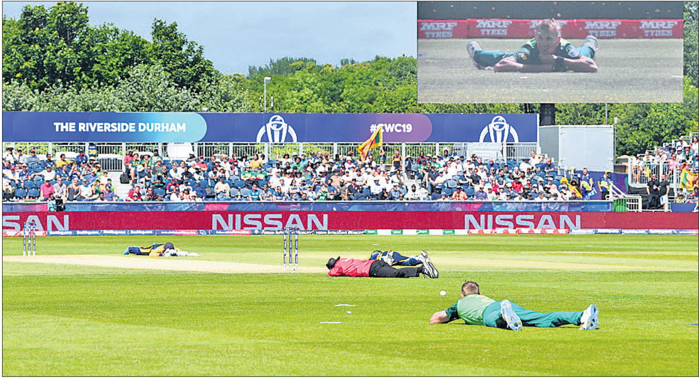
ଶ୍ରୀଲଙ୍କା-ଦକ୍ଷିଣ ଆଫ୍ରିକା ମ୍ୟାଚ୍ ଅବସରରେ ମହୁମାଛି ଆକ୍ରମଣରୁ ରକ୍ଷା ପାଇବା ପାଇଁ ଅଣ୍ଡର ଓ ଖେଳାଳିମାନେ ପଡ଼ିଆରେ ଶୋଇ ରହିଛନ୍ତି।

ସେମିଫାଇନାଲରେ ପ୍ରବେଶ କରୁ ବୋଲି ଭାରତୀୟ ଦଳ କବାପି ଚାହୁଁ ନାହିଁ। ସେମାନଙ୍କୁ ବାଂଲାଦେଶ ଓ ଶ୍ରୀଲଙ୍କା ବିପକ୍ଷରେ ମ୍ୟାଚ୍ ଖେଳିବାର ଅଛି। ଆଫଗାନିସ୍ତାନ ବିପକ୍ଷରେ ଭାରତ କେଉଁ ଭଳି ଖେଳିଥିଲା, ତାହା ସତ୍ତ୍ୱେ ଜଣା ବୋଲି ବସିର୍ ଏକ ସାକ୍ଷାତକାର ଅବସରରେ କହିଛନ୍ତି। ଅପରାଜେୟ ଭାରତୀୟ ଦଳ ଏପର୍ଯ୍ୟନ୍ତ ସେମିଫାଇନାଲରେ ସ୍ଥାନ ପାଇନାହିଁ। ୬ ମ୍ୟାଚ୍ରେ ୧୧ ପଏଣ୍ଟ୍ ହାସଲ କରିଛି। ବାଂଲାଦେଶ ଓ ଶ୍ରୀଲଙ୍କା ପୂର୍ବରୁ ବିରାଟ କୋହଲିଙ୍କ ଦଳ ରବିବାର ଇଂଲଣ୍ଡକୁ ଭେଟିବ। ସେ ଆହୁରି କହିଛନ୍ତି, ଭାରତ ଏପରି ଖେଳି ଯେଉଁଠି କୌଣସି ଦଳକୁ ଜଣାପଡ଼ିବ ନାହିଁ। ୧୯୯୨ ବିଶ୍ୱକପ୍ରେ ନ୍ୟୁଜିଲାଣ୍ଡ ପାକିସ୍ତାନ ବ୍ୟାଟ୍ସମ୍ୟାନ ବସିର୍ ଅଲି ଏହି ପୂର୍ବତନ କ୍ରିକେଟର ୧୯୯୩ରୁ ୧୯୯୬ ମଧ୍ୟରେ ୧୯ ଟେଷ୍ଟ ଓ ୫୦ ଅନ୍ତର୍ଜାତୀୟ ଦିନିକିଆ ମ୍ୟାଚ୍ ଖେଳିଥିଲେ। ପାକିସ୍ତାନ