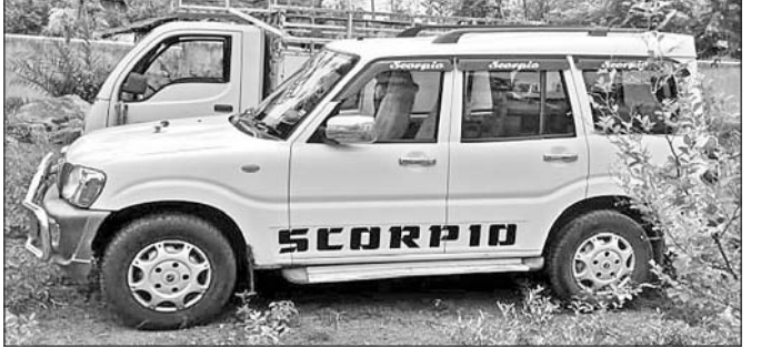
ଜବତ ହୋଇଥିବା ଅପହରଣରେ ବ୍ୟବହୃତ ଅଭିଯୁକ୍ତ ଟିମର୍ଙ୍କ କୁମ୍ଭୀର ଝୁର୍ପିଓ ।

କମିଶ୍ନର ଉଦ୍ଦେଶ୍ୟରେ ଦୁଇଭାଇଙ୍କୁ ଅପହରଣ ଓ ନିଯୁକ୍ତ ମାଡ଼ ଘଟଣାରେ ଗିରଫ ହୋଇ ଜେଲ ଯାଇଥିବା ଜମି ମାଫିଆ ଟିମର୍ ଓ ଉପ ଶ୍ରୀକାନ୍ତ କୁମ୍ଭୀରଙ୍କ ଝୁର୍ପିଓ (୭୫୧୭-୯୦୨୮)କୁ ଜବତ ହୋଇଛି।