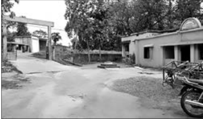
ବ୍ରାହ୍ମଣୀଚରଣ ଥାନା ଅନ୍ତର୍ଗତ କଲୁଙ୍ଗା ଲକ୍ଷ୍ମୀଧନ ଅଞ୍ଚଳରୁ ଲୁଟ୍ ହୋଇଥିବା କ୍ୟାସିୟରଙ୍କୁ ଏକ ପିସ୍ତୁଲ ଦେଖାଇ ଭୟଭୀତ କରି ଗାଈଣ ୯୭ ହଜାର ୮୧୭ ଟଙ୍କା ଲୁଟ୍ କରି ନେଇଯାଇଥିଲେ । ଏ ନେଇ ଲକ୍ଷ୍ମୀଧନ ଆସିଥିଲେ । କ୍ୟାସିୟରଙ୍କୁ ଏକ ପିସ୍ତୁଲ ଦେଖାଇ ଭୟଭୀତ କରି ଗାଈଣ ୯୭ ହଜାର ୮୧୭ ଟଙ୍କା ଲୁଟ୍ କରି

ବ୍ରାହ୍ମଣୀଚରଣ ଥାନା ଅନ୍ତର୍ଗତ କଲୁଙ୍ଗା ଲକ୍ଷ୍ମୀଧନ ପୂର୍ବୀକ୍ ୧୦ଟା ୧୦ରେ ଲୁଟ୍ ହୋଇଛି । ଲକ୍ଷ୍ମୀଧନ ସତ୍ୟବାମୀ ବେହେରାଙ୍କୁ ମାରଣାସ୍ତ୍ର ଦେଖାଇ ଭୟଭୀତ କରି ପ୍ରାୟ ଲକ୍ଷ୍ମୀଧନ ଟଙ୍କା ଲୁଟ୍ ହୋଇଥିବା ବ୍ରାହ୍ମଣୀଚରଣ ଥାନାରେ ଲିଖିତ ଅଭିଯୋଗ ହୋଇଛି । ପୋଲିସ୍ ସୂଚନାକୁ ଯାଞ୍ଚା ପ୍ରତ୍ୟେକ ଦିନ ଭଲ ଲକ୍ଷ୍ମୀଧନ କ୍ୟାସିୟର ସତ୍ୟବାମୀ ବେହେରା ଲକରୁ ୩, ୯୭, ୮୧୭ ଟଙ୍କା ନେଇ କ୍ୟାସିୟରଙ୍କୁ ଆସୁଥିଲେ । ଠିକ ସେହି ସମୟରେ କଳା ରୁମାଲ ବନ୍ଧା ଗାଈଣ ନେଇଯାଇଥିଲେ । ଏ ନେଇ ଲକ୍ଷ୍ମୀଧନ ଆସିଥିଲେ । କ୍ୟାସିୟରଙ୍କୁ ଏକ ପିସ୍ତୁଲ ଦେଖାଇ ଭୟଭୀତ କରି ଗାଈଣ ୯୭ ହଜାର ୮୧୭ ଟଙ୍କା ଲୁଟ୍ କରି