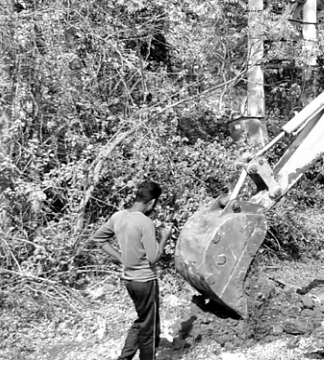
ପାଇବୁ ବିଭାଗର ପାଇଁ କେସିବି ମେଣ୍ଟିନରେ କାମ କରାଯାଇଛି ।