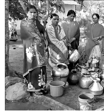
ପାଣି ପାଇଁ ମହିଳାମାନେ ଅପେକ୍ଷା କରିଛନ୍ତି (ବାମ) । ପାଇବୁ ବିଭାଗର ପାଇଁ କେସିବି ମେଣ୍ଟିନରେ କାମ କରାଯାଇଛି ।

କଳାହାଣ୍ଡି ଅବକାରୀ ବିଭାଗର ଚଢ଼ାଉ ୧୨ ଲିଟର ରକ୍ଷା ମଦ ଜବତ, ୨ କୋର୍ଟ ଚାଲାଣ