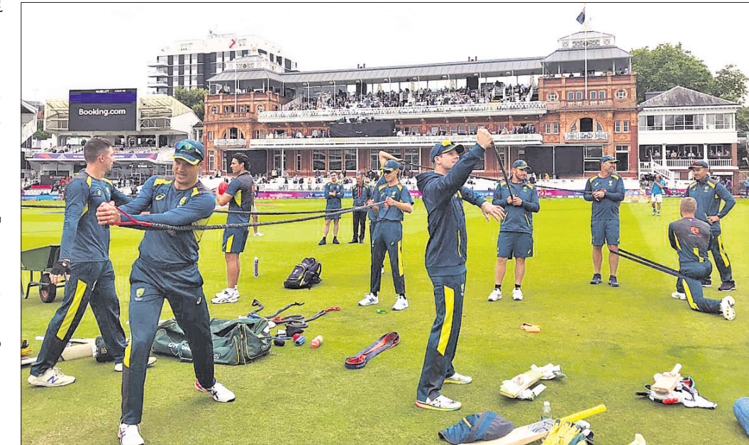
ନେଟ୍ ସେସନରେ ଅଷ୍ଟ୍ରେଲିଆ ଦଳର ଶାରୀରିକ ଅଭ୍ୟାସ।

ହୋଇଥିଲା। ୭ଟି ବିଶ୍ୱକପ୍ରେ ନ୍ୟୁଜିଲାଣ୍ଡ ଏଥି ସହିତ ଥରେ ମାତ୍ର ବିଜୟ ହେବାର ସୁଯୋଗ ପାଇଥିଲା। ରେକର୍ଡ୍ ଓ ଫର୍ମ ଉଭୟ ଦୃଷ୍ଟିକୋଣରୁ ଦେଖିବାକୁ ଗଲେ ଅଷ୍ଟ୍ରେଲିଆ ଫେଡରାଲଟ ବିବେଚିତ ହେଉଛି। ଗତ ମ୍ୟାଚ୍ରେ ଅଷ୍ଟ୍ରେଲିଆ ୬୪ ରନରେ ଇଂଲଣ୍ଡକୁ ପରାସ୍ତ କରିଥିଲା। ଅଧିନାୟକ ଆରୋନ ଫିଞ୍ଚ୍ ଓ ଡେଭିଡ୍ ଓଡ଼ିଆଙ୍କୁ ନେଇ ଅଷ୍ଟ୍ରେଲିଆ