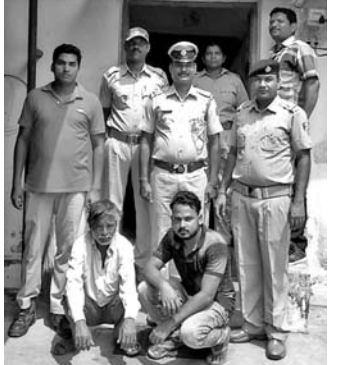
କୁନାଗଡ଼ ଅବକାରୀ ବିଭାଗର ଚଢ଼ାଉ ୧୨ ଲିଟର ରକ୍ଷା ମଦ ଜବତ, ୨ କୋର୍ଟ ଚାଲାଣ

କଳାହାଣ୍ଡି ଅବକାରୀ ବିଭାଗର ଚଢ଼ାଉ ୧୨ ଲିଟର ରକ୍ଷା ମଦ ଜବତ, ୨ କୋର୍ଟ ଚାଲାଣ