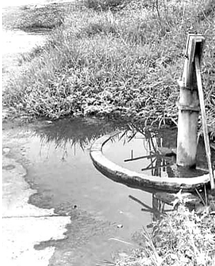
ଦୂଷିତ ପାଣିରେ ବୁଡି ରହିଥିବା ନଳକୂପ ଚାରିପାଖରେ।

ଉଚ୍ଚ ବିଦ୍ୟାଳୟ ନିକଟରେ ଥିବା ଉଚ୍ଚ ଏକ ନଳକୂପର ଚାରିପାଖରେ ଠିକ୍ ଭାବରେ ହୋଇନାହିଁ। ପୁନଶ୍ଚ ନିଷ୍କାସନ ପୂର୍ବରୁ ନ ଥିବାରୁ ନଳକୂପର ପାଣି ସେହିଭାବରେ ହିଁ ଜମା ହୋଇ ରହିଛି।