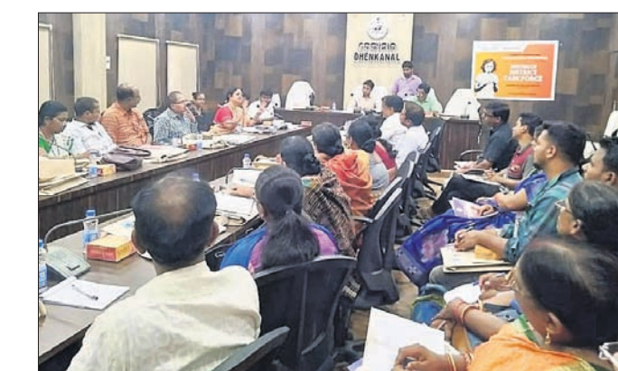
ବୈଠକରେ ଉପସ୍ଥିତ ପ୍ରଶାସନିକ ଅଧିକାରୀମାନେ।