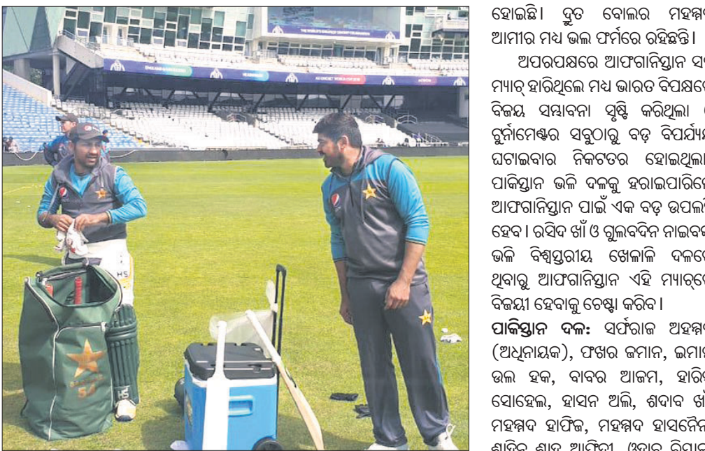
ପାକିସ୍ତାନ ଦଳର ଅଭ୍ୟାସ ।

ଲିଟ୍, ୨୮୬ (ପି.ଟି.) ଚଳିତ ବିଶ୍ୱକପରେ ଦମ୍ଭାବ ପ୍ରତ୍ୟାବର୍ତ୍ତନ କରିଥିବା ପାକିସ୍ତାନ ଶନିବାର ଖେଳାଳିଙ୍କୁ ଥିବା ପ୍ରଥମ ମ୍ୟାଚ୍‌ରେ ଅପେକ୍ଷାକୃତ ଦୁର୍ବଳ ଆଫଗାନିସ୍ତାନକୁ ଭେଟିବେ ।