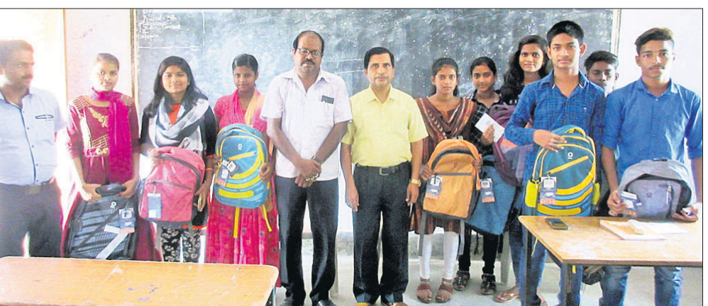
ଅତିଥିକ ଗଣଗରେ ପୁରସ୍କୃତ ହୋଇଥିବା ମେଧାବୀ ଛାତ୍ରାଛାତ୍ରୀ।