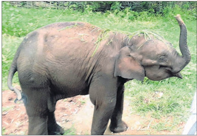
ଅସୁସ୍ଥ ହାତୀ ଶାବକ।

ଦେଶାନ୍ତର ଜିଲ୍ଲା ହିସୋଳ ରେଞ୍ଜର ଅଧିକାରୀ ଥାନା ଅଧୀନ କନ୍ଧରା ସଂରକ୍ଷିତ ଜଙ୍ଗଲରେ ଗୋଠକୁ ଅଲଗା ହୋଇଯାଇଥିବା ହାତୀ ଶାବକର ସ୍ଵାସ୍ଥ୍ୟାବସ୍ଥାକୁ ନେଇ ଚିକ୍ତାରେ ପଡ଼ିଛି ବନ ବିଭାଗ। ବାରମ୍ବାର ଉଦ୍ୟମ ସତ୍ତ୍ୱେ ହାତୀ ଛୁଆ ଜଙ୍ଗଲକୁ ଯାଉନାହିଁ। ଅନ୍ୟପଟେ ପାଟିରେ ଘା' ହୋଇଯାଇଥିବା ସେ ଖାଦ୍ୟ ହଜମ କରିପାରୁନାହିଁ। ତା'ର ସ୍ଵାସ୍ଥ୍ୟାବସ୍ଥା ଦିନେଦିନ ଲାଗିଛି। ଜୁନ ୨୭ରେ ଶିମିଳିପାଳକୁ ଆସିଥିବା ବିଶେଷଜ୍ଞ ଦଳ ହାତୀ ଛୁଆର ସ୍ଵାସ୍ଥ୍ୟ ପରୀକ୍ଷା କରିଥିଲେ। ତଥାପି ଏହାର ସ୍ଵାସ୍ଥ୍ୟାବସ୍ଥାରେ ଉନ୍ନତି ହେଉନାହିଁ। କପିଳାସ ଚିଡ଼ିଆଖାନା ପରିସରରେ ପାଟିରେ ଘା ହୋଇଥିବା ସେଠାରେ ୪ ହାତୀ ରହିଥିବାବେଳେ ସେଠାରେ ସଂଖ୍ୟା ବୃଦ୍ଧି କରିବା କାଠିକର ପାଠ ଦେଇ ବିଭାଗୀୟ ଅଧିକାରୀ କହିଛନ୍ତି। ମା' ପଲରେ ନିଶ୍ଚିତ ଭାବେ ଶାବକକୁ କେଉଁଠାରେ ରଖାଯିବ ସେ ନେଇ