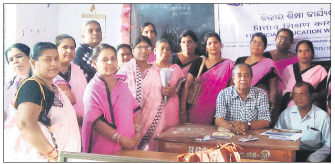
ଦେଶାନ୍ତର ଅଧିକ, ୨୮।୬:

ଦେଶାନ୍ତର ସହର ଗୋପାଳସାଗର ଲୁକ୍ଷ୍ମର ଅଧୀନରେ କାର୍ଯ୍ୟକ୍ରମ ଶିକ୍ଷୟିତ୍ରୀଙ୍କ ପାଇଁ 'ସେବି' ପକ୍ଷରୁ ଏକ ଆର୍ଥିକ କର୍ମଶାଳା ଗୁମାସ୍ତା ବାପୁଜୀ ଉଚ୍ଚ ପ୍ରାଥମିକ ବିଦ୍ୟାଳୟରେ ଅନୁଷ୍ଠିତ ହୋଇଯାଇଛି। ଗୋପାଳସାଗର ଶିକ୍ଷା ସମ୍ବଳର ୩୦ଜଣ ଶିକ୍ଷୟିତ୍ରୀ ଏଥିରେ ଯୋଗଦେଇଥିଲେ। ସଂଯୋଜକ ବିଷ୍ଣୁ ଚରଣ ମଲିକଙ୍କ ଅଧିକାରରେ