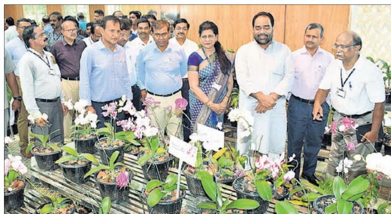
ଲୋକାର୍ପଣ ଅବସରରେ ଅର୍ଜିତାରିୟମ୍କୁ ବୁଲି ଦେଖୁଛନ୍ତି ଜଣକ ଓ ପରିବେଶ ମନ୍ତ୍ରୀ ଏବଂ ଅନ୍ୟମାନେ।

ଆଞ୍ଚଳିକ ଉଦ୍‌ବେଗ କେନ୍ଦ୍ର (ଆରପିଆରସି)ର ବଚାନିକାଳ ଗାଡେନରେ ଶୁକ୍ରବାର ଅର୍ଜିତାରିୟମ୍ ଲୋକାର୍ପିତ ହୋଇଯାଇଛି।