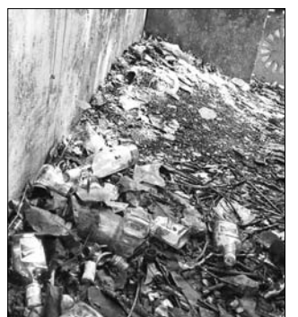
ବିଦ୍ୟାଳୟ ପରିସରରେ ମଦ ବୋତଲ।

ଜଗତ୍ସିଂହପୁର ଜିଲ୍ଲାର ଏକ ପ୍ରମୁଖ ଶିକ୍ଷାନୁଷ୍ଠାନ ଭାବରେ ପରିଚିତ ତିର୍ତ୍ତୋଳ ବୁକ ଜଗନ୍ନାଥପୁର ପଞ୍ଚାୟତ ତିରଣ ଉଚ୍ଚ ବିଦ୍ୟାଳୟ ପରିସରରେ ଏବେ ମଦ୍ୟପକ୍ଷ ଆଞ୍ଜା ଜମା ହେବାକୁ ଦେଖାଯାଇଛି। ବିଦ୍ୟାଳୟ ଛୁଟି ପରେ ମଦ୍ୟପକ୍ଷ ଆଞ୍ଜା ପରିସରରେ ଖିଚିକମାଉଛନ୍ତି। ଏଥିସହ ମଦ ପିଇ ବୋତଲ ପକାଇ ଚାଲିଯାଉଛନ୍ତି। ପ୍ରକାଶ ଯେ, ୧୯୫୦ରେ ଘାପିତ ଏହି ବିଦ୍ୟାଳୟର ବେଶ୍ ସୁନାମ ରହିଛି। ଅଧିକ ଏବେ ବିଦ୍ୟାଳୟର ଶୈକ୍ଷକ ପରିବେଶ ନଷ୍ଟ ହେବାରେ ଲାଗିଛି। ବିଦ୍ୟାଳୟ ପୂଷ୍ପା ପ୍ରବେଶ ପଥର ତାହାଣ ପାର୍ଶ୍ୱରେ ବହୁ ମଦ ବୋତଲ ଜମାହୋଇ ପଡ଼ିଛି। ବିଦ୍ୟାଳୟ କର୍ତ୍ତୃପକ୍ଷ ଏହାର କୌଣସି ପ୍ରତିକାର କରିପାରୁନାହାନ୍ତି। ଅଧିକାଂଶ ଯୁବକମାନଙ୍କ ଏଭଳି କାର୍ଯ୍ୟ ବିଦ୍ୟାଳୟ ପରିବେଶ ଖରାପ କରିବା ସହ ଛାତ୍ରାଛାତ୍ରୀଙ୍କ ଉପରେ କୁପ୍ରଭାବ ପକାଉଛି। ତେଣୁ ବିଦ୍ୟାଳୟ ପରିସରକୁ ମଦ୍ୟପକ୍ଷ ପ୍ରବେଶ ବନ୍ଦ କରିବା ସହ ଏଥିପ୍ରତି ଦୃଢ଼ କାର୍ଯ୍ୟାନୁଷ୍ଠାନ ଗ୍ରହଣ କରିବାର ଆବଶ୍ୟକତା ରହିଛି। ଏ ସମ୍ପର୍କରେ ବିଦ୍ୟାଳୟର ପ୍ରଧାନ ଶିକ୍ଷକ