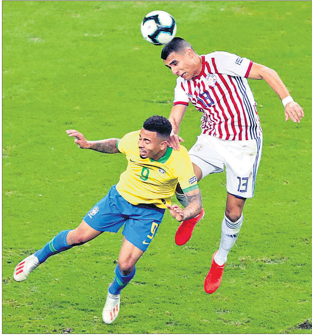
କୋପା ଆମେରିକା ପୁରସ୍କାର: ବ୍ରାଜିଲ ଓ ପାରାଗୁଏ ମଧ୍ୟରେ ଅନୁଷ୍ଠିତ ମ୍ୟାଚର ଏକ ସଂଘର୍ଷପୂର୍ଣ୍ଣ ମୁହୂର୍ତ୍ତ ।

ଲିଗ୍ ପର୍ଯ୍ୟାୟରେ ବ୍ରାଜିଲ ଗ୍ରୁପ୍ 'ଏ'ରେ ବଲିଜିଆକୁ ୩-୦ ଗୋଲରେ ହରାଇ ଅଭିଯାନ ଆରମ୍ଭ କରିଥିବାବେଳେ ଭେନେଜୁଏଲା ବିପକ୍ଷ ମ୍ୟାଚକୁ ଗୋଲଶୂନ୍ୟ ଡ୍ର ରଖିଥିଲା । ତୃତୀୟ ମ୍ୟାଚରେ ପେରୁକୁ ୫-୦ ଗୋଲରେ ହରାଇ ଗ୍ରୁପ୍ରେ ୬ ପଏଣ୍ଟ ସହ ଶୀର୍ଷସ୍ଥାନ ହାସଲ କରିଥିଲା । ଦୁଇ ସେମିଫାଇନାଲ ଯଥାକ୍ରମେ ଜୁଲାଇ ୨ ଓ ୩ରେ ଅନୁଷ୍ଠିତ ହେବ । ଫାଇନାଲ ଜୁଲାଇ ୭ରେ ଖେଳାଯିବ ।