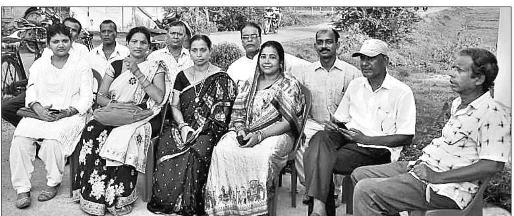
ଧାରଣାରେ ବସିଥିବା ଆଞ୍ଚଳିକ ସୁରକ୍ଷା ସମିତିର କର୍ମଚାରୀ।

କୁଜଙ୍ଗ, ୨୮.୬.୧୯ (ସ.ପ୍ର.): କୁଜଙ୍ଗ ବ୍ଲକ ଭୂତମୁଣ୍ଡାଈ ପଞ୍ଚାୟତ ନିକଟବର୍ତ୍ତୀ ଜାତୀୟ ରାଜପଥ ପାର୍ଶ୍ୱରେ ପାରାଦୀପ ବନ୍ଦର କର୍ତ୍ତୃପକ୍ଷଙ୍କ ପକ୍ଷରୁ ନିର୍ମାଣ ହେବାକୁ ଥିବା ଟ୍ରକ ଟର୍ମିନାଲକୁ ବିରୋଧ କରି ଆଞ୍ଚଳିକ ସୁରକ୍ଷା ସମିତି ପକ୍ଷରୁ ଶୁକ୍ରବାର ଧାରଣା ଦିଆଯାଇଛି। ଏହି ଟର୍ମିନାଲ ନିର୍ମାଣ ପାଇଁ ଶୁକ୍ରବାର ଶିଳାନ୍ୟାସ ହେବାର ଥିବାବେଳେ ଧାରଣା ଯୋଗୁ ତାହା ବାତିଲ କରାଯାଇଥିବା କୁହାଯାଇଛି। ଏହି ଘ୍ନାନରେ ସୁପର ସ୍ୱେଚ୍ଛାଶିଳ୍ପି ହରିହରାଜ ନିର୍ମାଣ ପାଇଁ ଆଞ୍ଚଳିକ ସୁରକ୍ଷା ସମିତି ପକ୍ଷରୁ ଦୀର୍ଘଦିନ ଧରି ଦାବି ହୋଇଆସୁଛି। ମାତ୍ର ଏଥିପ୍ରତି ଦୃଷ୍ଟି