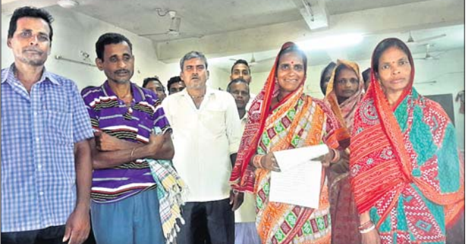
ଆନାରେ ଅଭିଯୋଗ କରିଥିବା ମୁଣ୍ଡାଝରି ଗ୍ରାମବାସୀ ।

ସେମାନଙ୍କର ଗୃହପାଳିତ ପଶୁମାନେ ଚରାଚୁଲ୍ଲା କରିଥାନ୍ତି । ତେବେ କିଛିମାସ ହେବ ଅନ୍ୟ ଏକ ଗ୍ରାମ ସିନ୍ଧୁରିଆର କିଛି ଅସରକ୍ଷ ଲୋକେ ମୁଣ୍ଡାଝରି ଗ୍ରାମ ନିକଟସ୍ଥ ଗୋଟର ଜମି ଓ ରାସ୍ତାକୁ