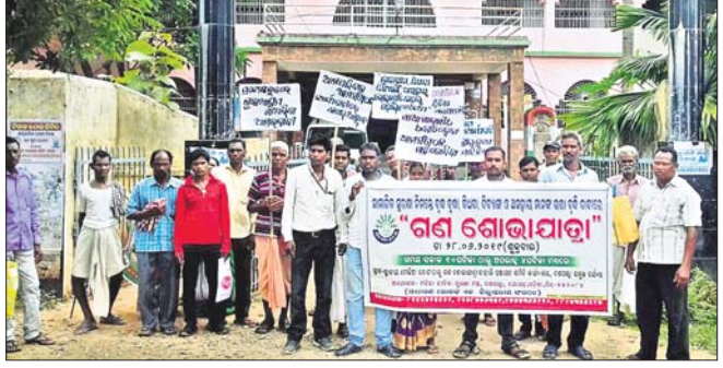
ରୁକ୍ମିଣୀ ଅଞ୍ଚଳରୁ ଯାତ୍ରାରେ ମହିଳା ଜୀବିକା ସୁରକ୍ଷା ମଞ୍ଚର ସଦସ୍ୟମାନେ

ଦଶପଲ୍ଲୀ ମହିଳା ଜୀବିକା ସୁରକ୍ଷା ମଞ୍ଚ ପକ୍ଷରୁ ବିଭିନ୍ନ ଦାବି ନେଇ ଶୁକ୍ରବାର ଏକ ଶୋଭାଯାତ୍ରା କରାଯାଇଛି । ଏଥିସହ ପୁଞ୍ଜିମାମୁଖୀ ଉଦ୍ଦେଶ୍ୟରେ ୫ ଦିନ ଦାବି ସମ୍ପର୍କିତ ଏକ ଦାବିପତ୍ର ବିତ୍ତିଓଳୁ ପ୍ରଦାନ କରାଯାଇଛି । ମଞ୍ଚର ଦାବି ମୁତାବକ ପଡୋଶୀ ରାଜ୍ୟ କେନ୍ଦ୍ରରେ ୧୨ ଶହ ଟଙ୍କା ଭରା ପ୍ରଦାନ କରାଯାଉ ଥିବା ବେଳେ ତେଲେଜାନାରେ ୩ ହଜାର ଓ ଦିଲ୍ଲୀରେ ୨ ହଜାର ଟଙ୍କା ଭରା ପ୍ରଦାନ କରାଯାଉଛି । ଏହା ଚଳୁକାଳରେ ଓଡ଼ିଶାରେ ବୃଦ୍ଧାବୃଦ୍ଧ, ବିଧବା, ବିଦ୍ୟାଳ ଓ ଅସହାୟମାନଙ୍କୁ ଅଣଦେଖା ସଦୃଶ ମାତ୍ର ୫ ଶହ ଟଙ୍କା ପ୍ରଦାନ କରାଯାଉଛି । ଏହାକୁ ବୃଦ୍ଧି କରାଯାଇ ପ୍ରତ୍ୟେକ ଭରାଧାରୀଙ୍କୁ ମାସିକ ୩ ହଜାର ଟଙ୍କା ପ୍ରଦାନ କରିବା, ପ୍ରତ୍ୟେକ ହିତାଧିକାରୀଙ୍କୁ ବ୍ୟାଙ୍କ ଜମାଖାତା