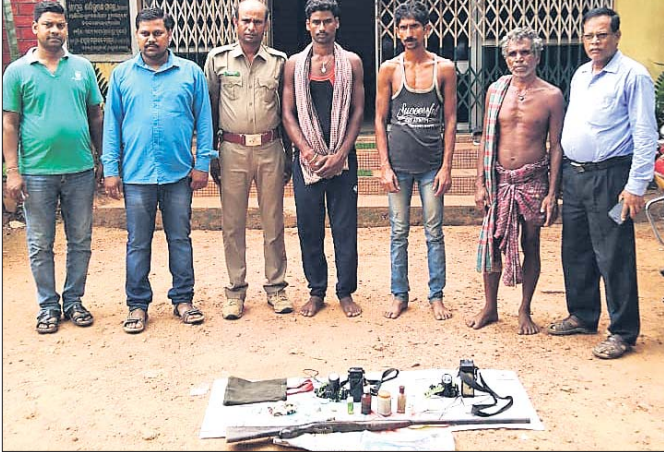
ଗିରଫ ୩ ଶିକାରୀ ଓ ଜବତ ବନ୍ଧୁକ