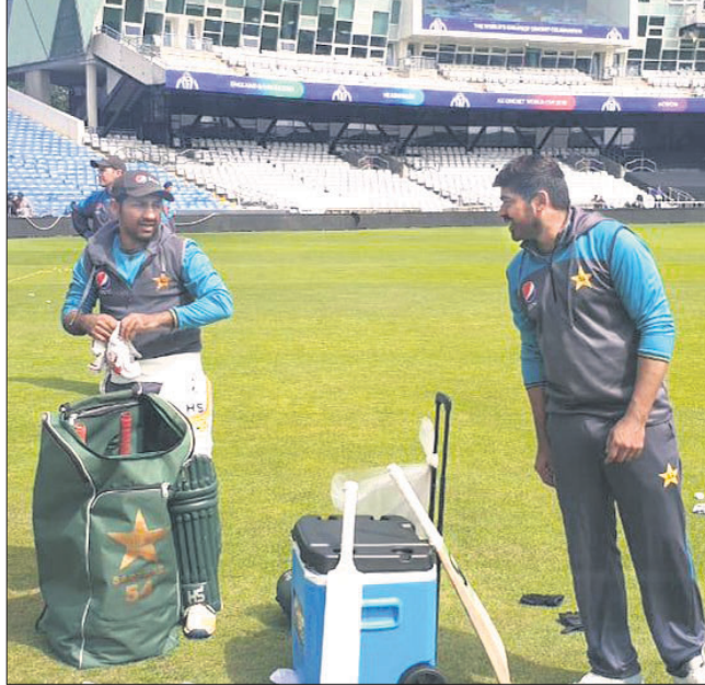
ପାକିସ୍ତାନ ଦଳର ଅଭ୍ୟାସ ।

ଚଳିତ ବିଶ୍ୱକପ୍ରେ ଦମ୍ଭାପୂର୍ଣ୍ଣ ପ୍ରତ୍ୟାବର୍ତ୍ତନ କରିଥିବା ପାକିସ୍ତାନ ଶନିବାର ଖେଳାଳିଙ୍କୁ ଥିବା ପ୍ରଥମ ମ୍ୟାଚରେ ଅପେକ୍ଷାକୃତ ଦୁର୍ବଳ ଆଫଗାନିସ୍ତାନକୁ ଭେଟିବ । ଆରମ୍ଭରୁ ଫଳାଫଳ ସହ ପାକିସ୍ତାନ ଲିଗ୍ ପର୍ଯ୍ୟାୟକୁ ବାଦ୍ ପଡ଼ିବା ସମ୍ଭାବନା ସୃଷ୍ଟି ହୋଇଥିଲା । ତେବେ ପରେ ପାକିସ୍ତାନ ଜବରଦସ୍ତ ପ୍ରଦର୍ଶନ କରି ପ୍ରତ୍ୟାବର୍ତ୍ତନ କରିବା ସହ ଦକ୍ଷିଣ ଆଫ୍ରିକା ଓ ନ୍ୟୁଜିଲାଣ୍ଡ ଭଳି ଦଳକୁ ହରାଇ ସେମିଫାଇନାଲ ଆଶା ଉଜ୍ଜୀବିତ ରଖିଛି । ପୁଣି ଲକ୍ଷ୍ମଣ ଦୁଇଟି ମ୍ୟାଚରେ ଅପ୍ରତ୍ୟାଶିତ ଭାବେ ପରାସ୍ତ ହେବା ପରେ ୧୯୯୨ ଚାମ୍ପିୟନ୍ ପାକିସ୍ତାନର ସେମି ଆଶାକୁ ଜୀବନ ମିଳିଛି । ପାକିସ୍ତାନ ଏପର୍ଯ୍ୟନ୍ତ ୭ଟି ମ୍ୟାଚ ଖେଳି ୩ଟି ଲକ୍ଷ୍ୟ ବିଜୟ ଓ ପରାଜୟ ଏବଂ ଗୋଟିଏ ଦିନା ଫଳାଫଳ ସହ ୬ ପଏଣ୍ଟ ପାଇ ଚାଳିକାର ସ୍ୱପ୍ନ ସ୍ଥାନରେ ରହିଛି । ଅନ୍ୟପକ୍ଷେ ଆଫଗାନିସ୍ତାନ ୭ଟି ମ୍ୟାଚ ଖେଳି ସବୁଥିରେ ପରାସ୍ତ ହୋଇ ଦିନା ପଏଣ୍ଟ ସହ ଚାଳିକାର ଦଶମ ତଥା ଅତିମ ସ୍ଥାନରେ ରହି ଚୁନାବଳୀକୁ ବାଦ୍ ପଡ଼ିଛି । ତେଣୁ ଆଫଗାନିସ୍ତାନ ଅପେକ୍ଷା ପାକିସ୍ତାନ ପାଇଁ ଏହି ମ୍ୟାଚ୍ ଅଧିକ ଗୁରୁତ୍ୱପୂର୍ଣ୍ଣ କରୁଛି । ଗତ ନ୍ୟୁଜିଲାଣ୍ଡ ବିପକ୍ଷ ମ୍ୟାଚରେ