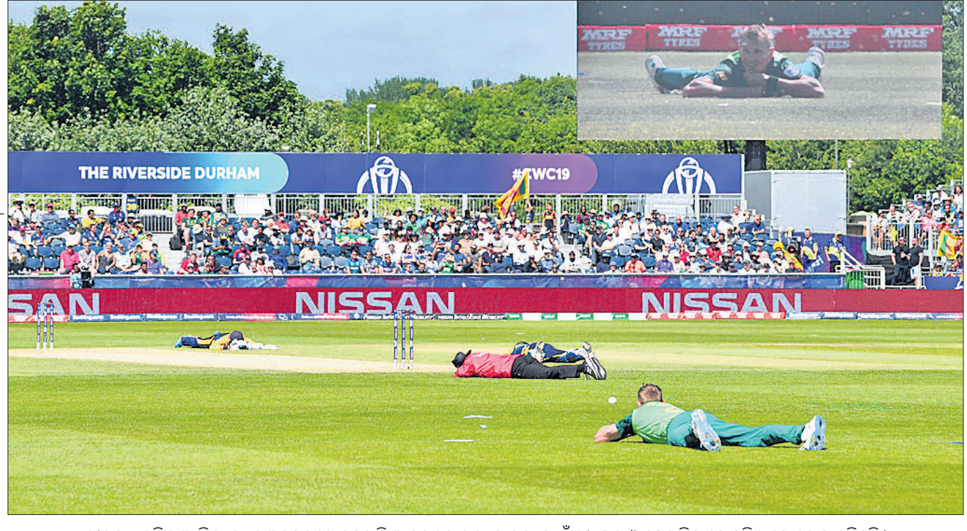
ଶ୍ରୀଲଙ୍କା-ଦକ୍ଷିଣ ଆଫ୍ରିକା ମ୍ୟାଚ୍ ଅବସରରେ ମହୁମାଛି ଆକ୍ରମଣରୁ ରକ୍ଷା ପାଇବା ପାଇଁ ଅମ୍ପାୟର ଓ ଖେଳାଳିମାନେ ପଡ଼ିଆରେ ଶୋଇ ରହିଛନ୍ତି।