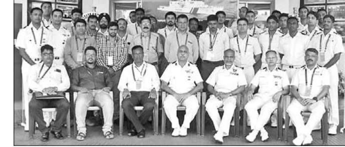
କର୍ମଶାଳାରେ କୋଷ୍ଟଗାର୍ତ୍ତ ବରିଷ୍ଠ ଅଧିକାରୀ ଓ ଅନ୍ୟମାନେ।