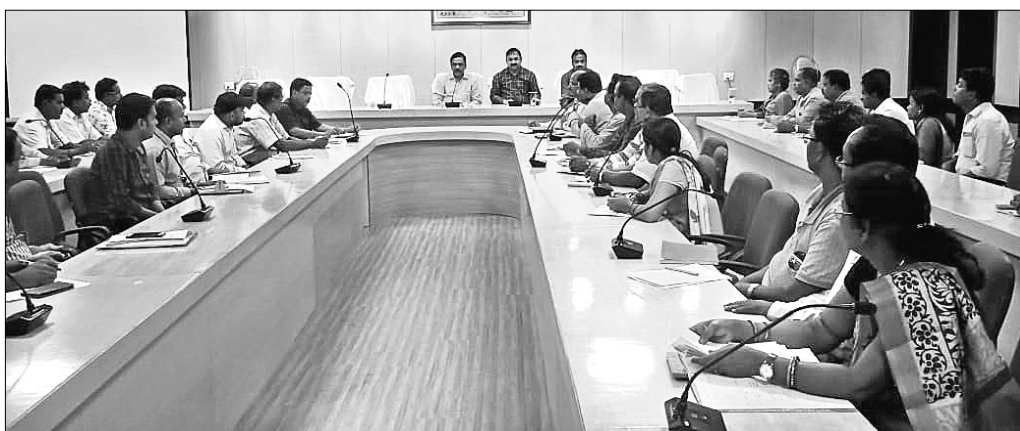
ବୈଠକରେ ଉପସ୍ଥିତ ଜିଲ୍ଲାପାଳ, ଅନ୍ୟ ଅଧିକାରୀ ଓ କର୍ମଚାରୀମାନେ।