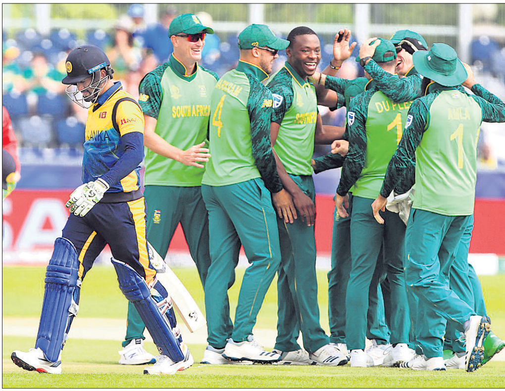
ଉଇକେଟ୍ ହାସଲ ପରେ ଦକ୍ଷିଣ ଆଫ୍ରିକାର କାରିଗୋ ରାବାଡ଼ାଙ୍କୁ ସାଥୀ ଖେଳାଳିଙ୍କ ବସେଇ।

ବ୍ୟବଧାନରେ ଉଇକେଟ୍ ପତନ ହୋଇଥିଲା। କୁଶଳ ମଧ୍ୟ ୩୦ ରନ କରି ପ୍ରିଟୋରିୟସ୍ ଦ୍ୱାରା କ୍ରିଜ୍ ବୋଲ୍ଡ ହୋଇଥିଲେ। କୁଶଳ ମେଣ୍ଡିସ୍ ୨୩ ରନ କରିଥିବା ବେଳେ କ୍ରିସ୍ ମୋରିସ୍ କ୍ୟାଚ୍ ବେଲ ପ୍ରିଟୋରିୟସ୍ ଦ୍ୱାରା ଶିକାର ହୋଇଥିଲେ। ଅଭିଜ୍ଞ ଅଲାରଉଟର ଅଞ୍ଜେଲୋ ମାଥୁସ୍ ୧୧, ଜାବନ ମେଣ୍ଡିସ୍ ୧୮ କରି ମୋରିସ୍ ଦ୍ୱାରା ଆଉଟ ହୋଇଥିଲେ। ୨୪ ରନ କରି ଧନଞ୍ଜୟ ତ୍ରିପାଠୀ କେପି ଭୁମିନିକ ଦ୍ୱାରା କ୍ରିଜ୍ ବୋଲ୍ଡ ହୋଇଥିଲେ। ଥିଆରା ପେରେରା ୨୧ ରନ କରି ଅଭିଜ୍ଞ ଫେଲ୍ଡ୍ ଲୁକ୍ସେମ୍ବର୍ଗ ଦ୍ୱାରା ଆଉଟ ହେବା ପରେ ଲୁକ୍ସେମ୍ବର୍ଗ ୧୭ ରନ କରି ରାବାଡ଼ାଙ୍କ ଦ୍ୱାରା କର୍ ଅଊ ବୋଲ୍ଡ ହୋଇଥିଲେ। ଲସିଥ ମାଲିଙ୍ଗା ୪ ରନ କରିଥିବା ବେଳେ ଡୁପ୍ଲେସି କ୍ୟାଚ୍ ବେଲ ମୋରିସ୍ ଦ୍ୱାରା ଶିକାର ହୋଇଥିଲେ। ସୁରଜା ଲାକମ୍ ୫ ରନ କରି ଅପରାଜିତ ରହିଥିଲେ। ପୁଣି ଥରେ ଶ୍ରୀଲଙ୍କାର ବ୍ୟାଟିଂ ଦୁର୍ବଳତା ପଦାରେ ପଡ଼ିଛି। ବୋଲିଂରେ ଦକ୍ଷିଣ ଆଫ୍ରିକା ତରଫରୁ ପ୍ରିଟୋରିୟସ୍ ଓ ମୋରିସ୍ ୩ଟି ଲେଖାଏ, ରାବାଡ଼ା ୨, ଫେଲ୍ଡ୍ ଲୁକ୍ସେମ୍ବର୍ଗ ଓ ଭୁମିନି ଗୋଟିଏ ଲେଖାଏ ରନରେ ଅଭିଆର କରିଥିଲେ। ସଂକ୍ଷିପ୍ତ ସୋର ଶ୍ରୀଲଙ୍କା ୪୯.୩ ଓଭରରେ ୨୦୩/ ଅଲଆଉଟ୍ (କୁଶଳ ପେରେରା- ୩୦, ଅଭିଷା- ୩୦, ଧନଞ୍ଜୟ- ୨୪, କୁଶଳ ମେଣ୍ଡିସ୍- ୨୩, ଥିଆରା ପେରେରା- ୨୧, ମୋରିସ୍- ୩/୪୬, ପ୍ରିଟୋରିୟସ୍- ୩/୨୫, ରାବାଡ଼ା- ୨/୩୬)। ଦକ୍ଷିଣ ଆଫ୍ରିକା ୩୭.୨ ଓଭରରେ ୨୦୬/୧ (ଡୁପ୍ଲେସି- ୯୬, ଅମଲ- ୮୦, ଡିକକ- ୧୫, ମାଲିଙ୍ଗା- ୧/୪୬)।