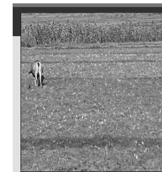
ଚାଷ ଜମିରେ ବୋହୁ ଚରୁଛନ୍ତି।

ନାଉରୀ ବ୍ଲକରେ ସାଧାରଣତଃ ବର୍ଷା ଉପରେ ନିର୍ଭର କରି ଚାଷୀ ଧାନ ଚାଷ କରିଥାନ୍ତି। ତଳିତବର୍ଷ ଏ ପର୍ଯ୍ୟନ୍ତ ଆଶାକରୁପ ବର୍ଷା ହୋଇନାହିଁ। ତେଣୁ ସ୍ୱଳ୍ପ ବୃଷ୍ଟି ଯୋଗୁ ଚାଷ କାର୍ଯ୍ୟରେ ବାଧା ଉପସ୍ଥିତ ଥିବା ଦେଖାଦେଇଛି। ଆଷାଢ଼ ମାସ ଅଧା ହୋଇଥିଲେ ମଧ୍ୟ ଚାଷ ପାଇଁ ଜମିରେ ଆବଶ୍ୟକ ପାଣି ହୋଇନାହିଁ। ଏହି ବ୍ଲକର ଚାଷୀମାନେ ପୂଷ୍ପାତଃ ମୌସୁମୀ ବର୍ଷା ଉପରେ ନିର୍ଭର କରି ଚାଷ କରୁଥିବାରୁ ଅଧିକ ବର୍ଷା ହେଲେ ବନ୍ୟା ଓ ସ୍ୱଳ୍ପ ବୃଷ୍ଟି ହେଲେ ମରୁଡ଼ିର ସମ୍ମୁଖୀନ ହେଉଛନ୍ତି। କଳେବରନ ସୁବିଧା ନ ଥିବାରୁ ଚାଷୀମାନେ ବ୍ୟାପକ ମାତ୍ରାରେ କ୍ଷତିଗ୍ରସ୍ତ ହେଉଛନ୍ତି। ବ୍ଲକରେ ମୋଟ ୯ ହଜାର ୭୫ ହେକ୍ଟର ଚାଷ ଉପଯୋଗୀ ଜମି ଥିବାବେଳେ ମାତ୍ର ୨୫ ପ୍ରତିଶତ ଜମିରେ ଜଳସେଚନ ସୁବିଧା ରହିଛି। ବ୍ଲକର ୧୬ ପଞ୍ଚାୟତ ପଞ୍ଚାୟତ ମଧ୍ୟରୁ ତିରୁଣା, ତାବର, ତେରିକି, ଓଷକଣା, କୋରୁଆ, କାମୁଗାଁ, ବାଂଶ