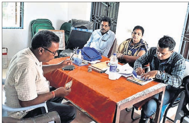
ଗ୍ରାମପଞ୍ଚାୟତର ମାସିକ ବୈଠକରେ ଉପସ୍ଥିତ ଜନପ୍ରତିନିଧି ଓ ଅଧିକାରୀ।

ଯାଜପୁର ଜିଲା କୋରେଇ ବୁକ ମୂଳାପାଳ ଗ୍ରାମପଞ୍ଚାୟତର ମାସିକ ବୈଠକ ଅନୁଷ୍ଠିତ ହୋଇଯାଇଛି। ଏଥିରେ ପଞ୍ଚାୟତର ବିଭିନ୍ନ ଉନ୍ନୟନମୂଳକ କାର୍ଯ୍ୟ ଉପରେ ଆଲୋଚନା ହୋଇଥିଲା। ଏହାସହ ବାଟ୍ୟା ଫନୀକୁ ପ୍ରାୟ ଦୁଇମାସ ପୂରିବାକୁ ଯାଉଥିଲେ ହେଁ ଆସିଥିବା ଗୋଷାଦ୍ୟ ବନ୍ଧନ ହୋଇ ନ ଥିବାରୁ ବୈଠକରେ