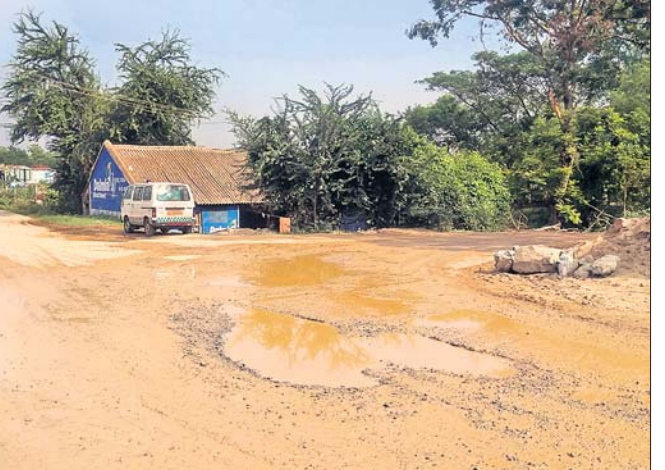
ରାସ୍ତାରେ ସୃଷ୍ଟି ହୋଇଥିବା ଖାଲଖାମା ।

ବାଲିଘାଟରୁ ବାଲିତାଳାଣ ହୋଇଥାଏ । ଏହି ଭାରିଯାନଗୁଡ଼ିକ ଯୋଗୁ ରାସ୍ତା ଲିକ୍ ହୋଇ ଜମା ହେବା ସହ ରାସ୍ତା ଉପରୁ ମାଟି ଧୋଇ ହୋଇଯାଉଛି । ସୂଚନାଯୋଗ୍ୟ, କୈଲୋ-ପଥରଚକଡ଼ା ମୁଖ୍ୟ ପୂର୍ଣ୍ଣରାସ୍ତାର ଗଢ଼ପସାହି ନିକଟସ୍ଥ ରାସ୍ତା ଉପରେ ପ୍ରତ୍ୟହ ଶତାଧିକ ହାଲଖା, ଭାରିଯାନ, ଟ୍ରାକ୍ଟର ଯୋଗେ ପଥରଚକଡ଼ା ମହାନଦୀ