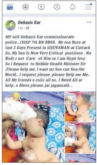
ବାପା ଓ ଡାକ୍ତରଙ୍କ ସହିତ ଆଲୋଚନା କରିଥିଲେ। ଶିଶୁଙ୍କ ଚିକିତ୍ସା ବାବଦୀୟ ସମସ୍ତ ଖର୍ଚ୍ଚ ସରକାର ବହନ କରିବେ ବୋଲି ଏମପି ପ୍ରତିଶ୍ରୁତି ଦେଇଥିଲେ।

ପୁରୀ ଚର୍ଚ୍ଚାର ପରିସରକୁ ଆସିଛି କଟକ ଶିଶୁଭବନ। ୨୯ନ ତଳେ ଜନ୍ମ ହୋଇଥିବା ଏକ ନବଜାତ ଶିଶୁପୁତ୍ରଙ୍କ ଚିକିତ୍ସାରେ ଅବହେଳା କରାଯାଇଥିଲା। ତାହା, କର୍ମଚାରୀଙ୍କୁ ଯେତେ ଗୁସାରି କଲେ ମଧ୍ୟ କେହି କିଛି ଶୁଣି ନ ଥିଲେ। ଶେଷରେ ଶିଶୁଙ୍କ ବାପା ଅପହାୟ ହୋଇ ନିଜ ଫେସ୍‌ବୁକ ଫାଇଲିଙ୍ଗରେ ନିଜ ଚିନ୍ତାଧାରାରେ ଶିଶୁଭବନର ଚିକିତ୍ସା ବ୍ୟବସ୍ଥା ଉପରେ ଲେଖିଥିଲେ। ଏହାପରେ ଉଚ୍ଚ ପୋଷ୍ଟିଟି ସୋସିଆଲ ମିଡ଼ିଆରେ ଶୁକ୍ରବାର ରାତିରୁ ଭାଇରାଲ ହୋଇଥିଲା। ସରକାର ଓ ପ୍ରଶାସନ ତରଫରୁ ହେଉ ଉପରେ ଉଚ୍ଚ ପୋଷ୍ଟିଟି ପାଇବା ପରେ କେନ୍ଦ୍ରାପଡ଼ା ଏମପି ଅନୁଭବ ମହାନ୍ତି ଶନିବାର ଶିଶୁଭବନରେ ପହଞ୍ଚିଥିଲେ। ଚିକିତ୍ସିତ ହେଉଥିବା ଶିଶୁଙ୍କୁ ଆଇସିୟୁରେ ଦେଖିବା ସହିତ ତାଙ୍କ ମା',