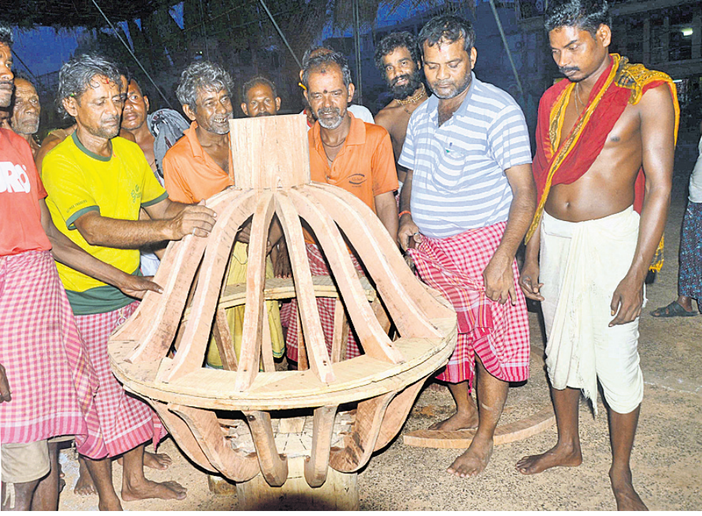
ରଥଖଳରେ ରଥର କଳସା ନିର୍ମାଣ କରାଯାଉଛି।

ରହିଛି। ଏହି ଫଣା ଦ୍ୱାରା ସେ ପୃଥିବୀକୁ ଚେକି ଧରିଛନ୍ତି। ଅତଳ ମହାମେରୁ ପ୍ରବଳ ପରାକ୍ରମୀ ଶ୍ରୀବଳଭଦ୍ରଙ୍କ ଚାଳଧିକ ରଥରେ ଚାଣିନେବା ପାଇଁ ଏହି ବାପୁଜୀ ହିଁ ନିଜର ସେବା ସମର୍ପଣ କରିଥାନ୍ତି। ସେ ଭଗବାନ ବଳଭଦ୍ରଙ୍କର ପରମ ଭକ୍ତ। ସେହିପରି ଦେବୀ ସୁଭଦ୍ରାଙ୍କ ଦର୍ପଦଳନ ରଥ ଦଉଡ଼ିର ନାମ ସ୍ୱର୍ଣ୍ଣଚୂଡ଼ା ନାମକ ନାଗ। କରାଜନନୀ ଯୋଗମାୟା ପରଂବ୍ରହ୍ମ ସ୍ୱରୂପିଣୀ ମା' ସୁଭଦ୍ରାଙ୍କୁ ଓ କୋଟିପୁର୍ଣ୍ଣ ସମପ୍ରଭ ଶ୍ରୀସୁଦର୍ଶନଙ୍କୁ ରଥରେ ବସାଇ ଚାଣିବା ନିମନ୍ତେ ପରମ ଶକ୍ତିଶାଳୀ ସ୍ୱର୍ଣ୍ଣଚୂଡ଼ା ଦଉଡ଼ି ରୂପରେ ଅବତୀର୍ଣ୍ଣ ହୋଇଥାନ୍ତି। ଭକ୍ତମାନେ ଏହି ସୁଦୀର୍ଘ ସ୍ୱର୍ଣ୍ଣଚୂଡ଼ା ନାମକ ନାଗକୁ ଧରି ରଥ ଚାଣିଥାନ୍ତି। ମା'ଙ୍କର କରୁଣା ଲାଭ କରିବା ପାଇଁ ଏହି ଯାତ୍ରାକୁ ସ୍ୱର୍ଣ୍ଣଚୂଡ଼ା ଅପେକ୍ଷା କରି ରହିଥାନ୍ତି। ଶ୍ରୀଜଗନ୍ନାଥ ମହାପ୍ରଭୁଙ୍କ ନିହିତୋଷ ରଥର ରକ୍ତ ଭାବରେ ଅବତୀର୍ଣ୍ଣ ହୋଇଥାନ୍ତି ଶଙ୍ଖଚୂଡ଼ା ନାମ ନାଗୁଣୀ। ଏହି ଶଙ୍ଖଚୂଡ଼ା ପ୍ରସିଦ୍ଧ ଅଧିକାରୀ (ଅନନ୍ତ, ବାପୁଜୀ, ପଦ୍ମ, ମହାପଦ୍ମ, ତକ୍ଷକ, ଜୁଲାର, କର୍କଟ ଓ ଶଙ୍ଖଚୂଡ଼ା) ମଧ୍ୟରୁ ଅନ୍ୟତମ। ଏହି ନାଗୁଣୀ ଅମିତ ପରାକ୍ରମଶାଳୀ ଓ ଜ୍ୟୋତିର୍ମୟୀ। ନିଜର ପ୍ରତ୍ୟକ୍ଷ ଶକ୍ତି ବଳରେ ସେ ସାତଗୋଟି ପର୍ବତର ଶକ୍ତି ବହନ କରିଥିବା ଅଖିଳ ବ୍ରହ୍ମାଣ୍ଡନାଥ ଶ୍ରୀଜଗନ୍ନାଥ ମହାପ୍ରଭୁଙ୍କ ରଥକୁ ଚାଣିନେବାର ମାଧ୍ୟମ ହୋଇଥାନ୍ତି। ଏହିପରି ଭାବେ ମହାପ୍ରଭୁଙ୍କ ଅତ୍ୟନ୍ତ ପ୍ରିୟ ଶ୍ରୀଗୁଣ୍ଡିଚା ଯାତ୍ରାରେ ନିଜର ସେବା ସମର୍ପଣ ଭାବ ପୋଷଣ କରି ଏହି ନାଗ ନାଗୁଣୀମାନେ ନିଜକୁ ଧନ୍ୟ ମଣିଥାନ୍ତି। ଭକ୍ତଗଣ ଏହି ଭକ୍ତିମତି ନାଗୁଣୀର ସହାୟତାରେ ମହାପ୍ରଭୁଙ୍କ ରଥକୁ ଅନାୟାସରେ ଆଗକୁ ଆଗକୁ ଚାଣି ନେଇଥାନ୍ତି।