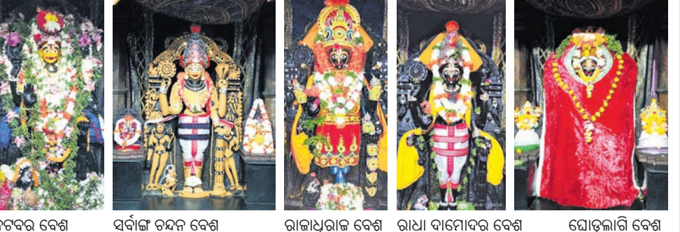
ନଟବର ବେଶ, ସର୍ବାଙ୍ଗ ଚନ୍ଦନ ବେଶ, ରାଜାଧିରାଜ ବେଶ, ରାଧା ଦାମୋଦର ବେଶ, ଘୋଡ଼ଲାଗି ବେଶ

ବ୍ରହ୍ମଚରି, ୨୯.୬(ଡି.ଏନ୍.ଏ.) ଦେବ ସ୍ନାନ ପୂର୍ଣ୍ଣମୀରେ ଶ୍ରୀଜୀଉମାନେ ମହାପ୍ରଭୁ ପରେ ଅଶ୍ୱସର ପିଛରେ ରୂପ ସେବା ପାଇଛନ୍ତି। ଏପଟେ ମହାପ୍ରଭୁ ଅଲାଭନାଥଙ୍କ ନିକଟରେ ଚାଲିଛି ଅଶ୍ୱସର ଦର୍ଶନ। ଶନିବାର ଥିଲା ଖଲିଲାଗି ଏକାଦଶୀ। ଏହି ଅବସରରେ ମହାପ୍ରଭୁଙ୍କ ଖଲିଲାଗି କରାଯାଇଥିବା ସମୟରେ ଅଲାଭନାଥଙ୍କ ନଟବର ବେଶ ଅନୁଷ୍ଠିତ ହୋଇଥିଲା। ଏହି ନଟବର ବେଶ ଏକ ସ୍ୱତନ୍ତ୍ର ବେଶ। ଅଶ୍ୱସର ଦର୍ଶନ ସମୟରେ ପଡୁଥିବା ଏହି ଖଲିଲାଗି ଏକାଦଶୀ ଦିନ ଶ୍ରୀଜୀଉଙ୍କ ନଟବର ବେଶ ଅନୁଷ୍ଠିତ ହୋଇଥାଏ। ଶନିବାର ଭୋର ୪ଟାରୁ ମନ୍ଦିର ଦ୍ୱାର ଖୋଲାଯାଇ ୪ଟା ୧୫ରେ ମଙ୍ଗଳ ଆଳତୀ, ୪ଟା ୩୦ରେ ଅବକାଶ, ୫ଟାରେ ମହାପ୍ରଭୁଙ୍କୁ ନଟବର ବେଶ କରାଯାଇ ଚନ୍ଦନ ତୁଳସୀ ଲାଗି କରାଯାଇଥିଲା। ୫ଟା ୩୦ରେ ବଳଭଦ୍ର ଧୂପ ଓ ସକାଳ ୬ଟାରେ ସର୍ବସାଧାରଣ