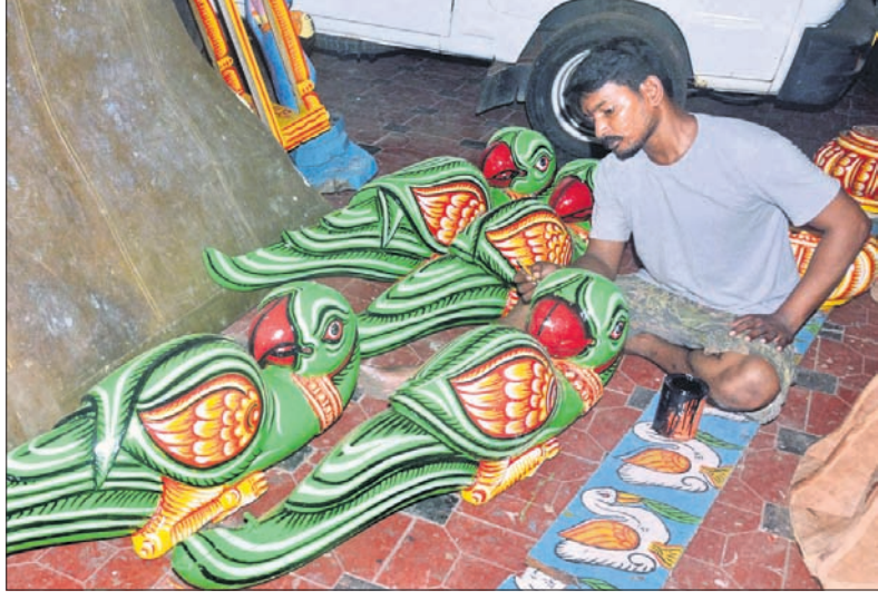
ରଥରେ ଲାଗିବାକୁ ଥିବା ଓଲଟ ଶୁଆକୁ ରଙ୍ଗ କରାଯାଉଛି।