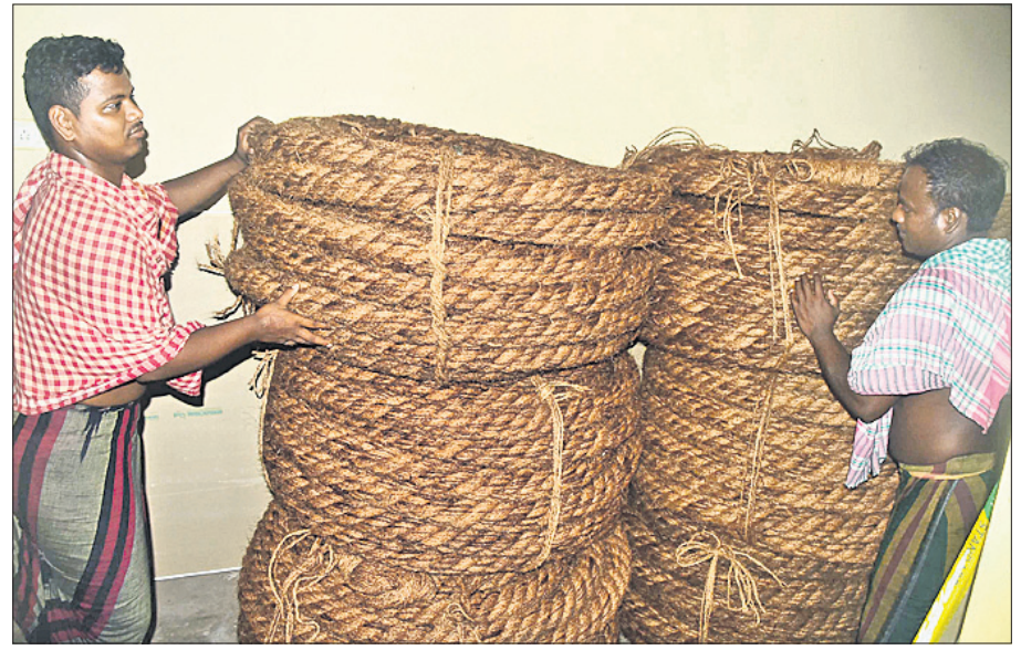
ପୁରୀ ଅଫିସ, ୨୯.୬