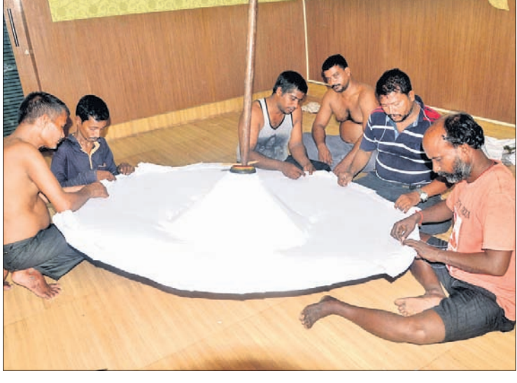
ମହାପ୍ରଭୁଙ୍କ ଧନା ଛତି ତିଆରି କରୁଛନ୍ତି ଦରଳି ସେବକ।