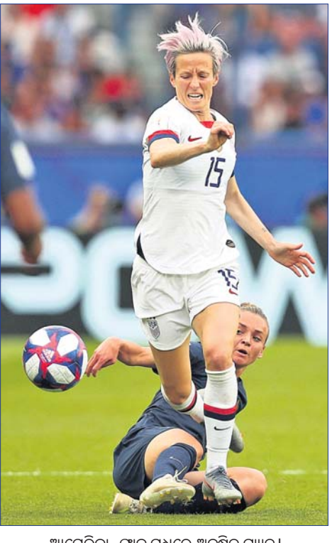
ଆମେରିକା-ପ୍ରାନ୍ତ ମଧ୍ୟରେ ଅନୁଷ୍ଠିତ ମ୍ୟାଚ।

ମେଗନ ରାପିନୋକ୍ ଡବଲ ଗୋଲ ବଳେ ଡିଫେଣ୍ଡିଂ ଚାମ୍ପିୟନ ଆମେରିକା ୨-୧ ଗୋଲରେ ପ୍ରାନ୍ତକୁ ହରାଇ ଦେଇଛି।