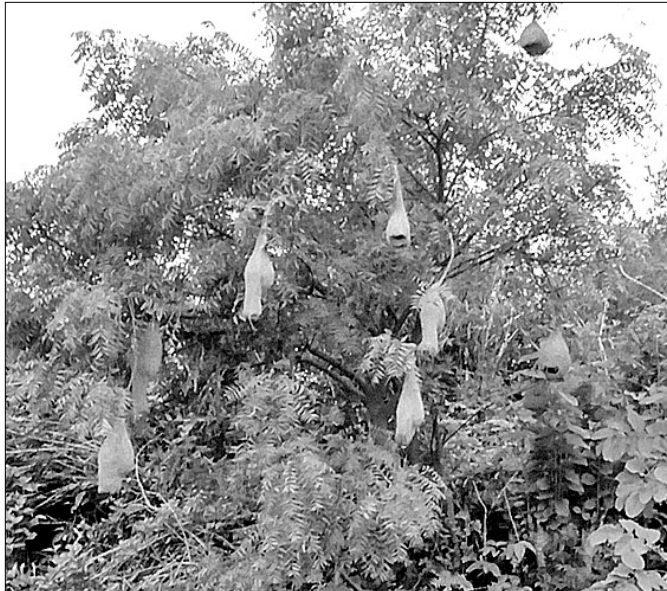
ବର୍ଷା ଭୟ: ତିରିଆ ବୁଲୁ ଥାନାରେ ଭେଟିଆ କଞ୍ଚଳ ନିକଟରେ ବାଲ ବଢ଼େଇ ବ୍ୟା ତିଆରି କରୁଛନ୍ତି।

ଉପରେ ଖବର ପୋକସ ଦେଇଛି। ପ୍ରତି ସପ୍ତାହରେ ପୋଲିସ ବସ୍ତୁକୁ ଯାଇ ଲୋକଙ୍କୁ ଏନେଇ ବୁଝାଇବା। ଯଦି କେହି ଅଜଣା ବ୍ୟକ୍ତି ବସ୍ତୁରେ ଘର ଭଡ଼ା ନେଇ ରହୁଛନ୍ତି ବା କାହା ଉପରେ ସମ୍ବେଦ ହେଉଛି ତୁରନ୍ତ ଥାନାକୁ ଜଣାଇବାକୁ କୁହାଯିବ। ଅନେକ ସମୟରେ ଅପରାଧୀମାନେ ଅପରାଧ ଯତ୍ନରେ ପରେ ନିଜ ଗ୍ରାମକୁ ପଳାଇ ଯାଉଛନ୍ତି। ଗାଁରେ କିଛି ଦିନ ରହିବା ପରେ ପୁଣି କୁବନେଶ୍ୱରକୁ ଆସି ଅନ୍ୟ ବସ୍ତୁରେ ରହି ଅପରାଧ ଯତ୍ନରେ ଯାହାଫଳରେ ପୋଲିସ ସେମାନଙ୍କୁ ଚିହ୍ନଟ କରିବାରେ ଯଥେଷ୍ଟ ସମସ୍ୟା ହେଉଛି। ତେଣୁ ଏଭଳି ଅପରାଧୀଙ୍କୁ କିଭଳି ଚିହ୍ନଟ କରାଯିବ ସେନେଇ ମଧ୍ୟ ବିଠିକରେ ଆଲୋଚନା ହୋଇଥିଲା। ଏହାସହ ଥାନାରେ ପଡ଼ି ରହିଥିବା ମାମଲାକୁ ତୁରନ୍ତ ଶେଷ କରିବାକୁ ପୋଲିସ କମିଶନର ମହାନ୍ତି ଥାନା ଅଧିକାରୀ ଓ କୋର୍ଟ ଏସିଏକୁ ନିର୍ଦ୍ଦେଶ ଦେଇଛନ୍ତି। ବିଶେଷ କରି ଷ୍ଟେଶନାଲ ଷ୍ଟାଫ୍ ଓ କ୍ୟୁଏଚ୍କୁ ଆହୁରି ସକ୍ରିୟ ରହିବା ସହ ବସ୍ତୁକୁ ଦେପାରି ଓ ନିଷା ମାପିଆକୁ ସାତାଡ଼ କରିବା ପାଇଁ ସେ ପରାମର୍ଶ ଦେଇଛନ୍ତି।