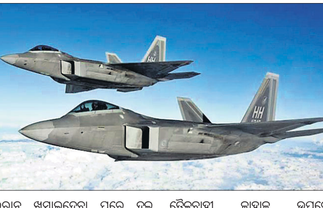
ଇରାନ ଖସାଇଦେବା ପରେ ଦୁଇ ଦେଶ ମଧ୍ୟରେ ଉଡ଼େଜନା ବୃଦ୍ଧି ହୋଇଥିବା ଆକ୍ରମଣ ପାଇଁ ଫ୍ଲାଣ୍ଟିନ ପାଇଛି। ପାରସ୍ୟ ଉପସାଗରରେ ଡେଇଜନାଙ୍କୁ ଦାୟୀ କରିଥିଲା।