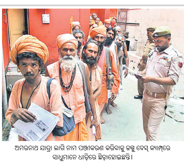
ଅମରନାଥ ଯାତ୍ରା ଲାଗି ନାମ ପଞ୍ଜୀକରଣ କରିବାକୁ ଜମ୍ମୁ ବେସ୍ କ୍ୟାମ୍ପରେ ସାଧୁମାନେ ଧାଡ଼ିରେ ଛିଡ଼ାହୋଇଛନ୍ତି।