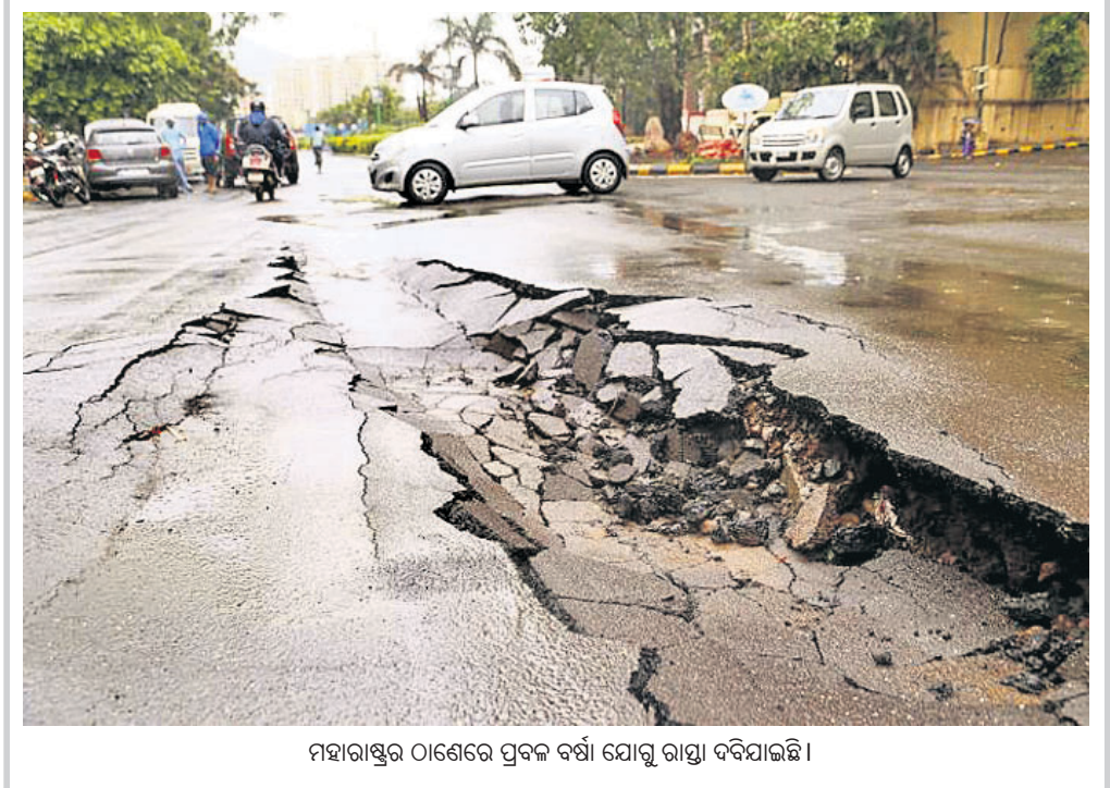
ମହାରାଷ୍ଟ୍ରର ଠାଣେରେ ପ୍ରବଳ ବର୍ଷା ଯୋଗୁ ରାସ୍ତା ଦବିଯାଇଛି।