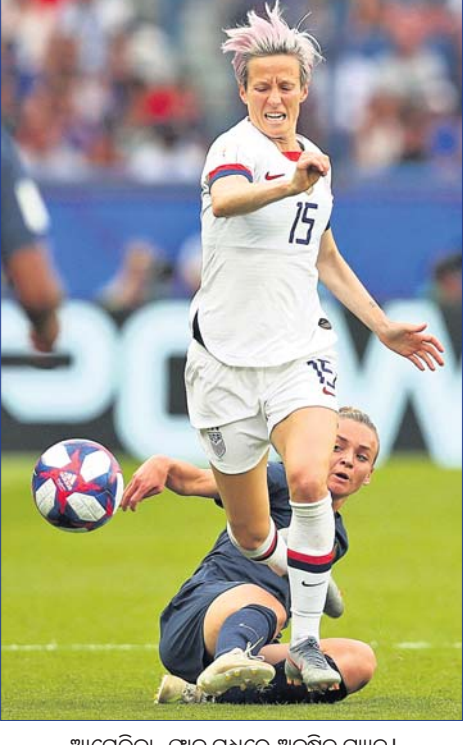
ଆମେରିକା-ପ୍ରାନ୍ତ ମଧ୍ୟରେ ଅନୁଷ୍ଠିତ ମ୍ୟାଚ୍।

ମେଗନ ରାପିନୋଙ୍କ ଡବଲ ଗୋଲ ବଳରେ ଡିଫେଣ୍ଡିଂ ଗାମ୍ପିୟନ ଆମେରିକା ୨-୧ ଗୋଲରେ ପ୍ରାନ୍ତକୁ ହରାଇ ଦେଇଛି।