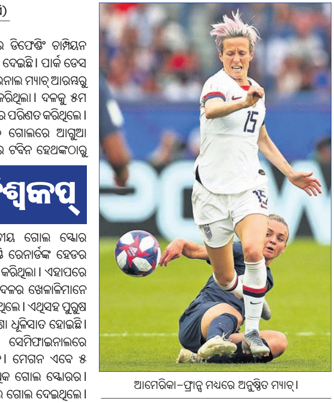
ଆମେରିକା-ପ୍ରାନ୍ତ ମଧ୍ୟରେ ଅନୁଷ୍ଠିତ ମ୍ୟାଚ୍।

ମେଗନ ରାପିନୋଙ୍କ ଡବଲ ଗୋଲ ବଳରେ ଡିଫେଣ୍ଡିଂ ଚାମ୍ପିୟନ ଆମେରିକା ୨-୧ ଗୋଲରେ ପ୍ରାନ୍ତକୁ ହରାଇ ଦେଇଛି।