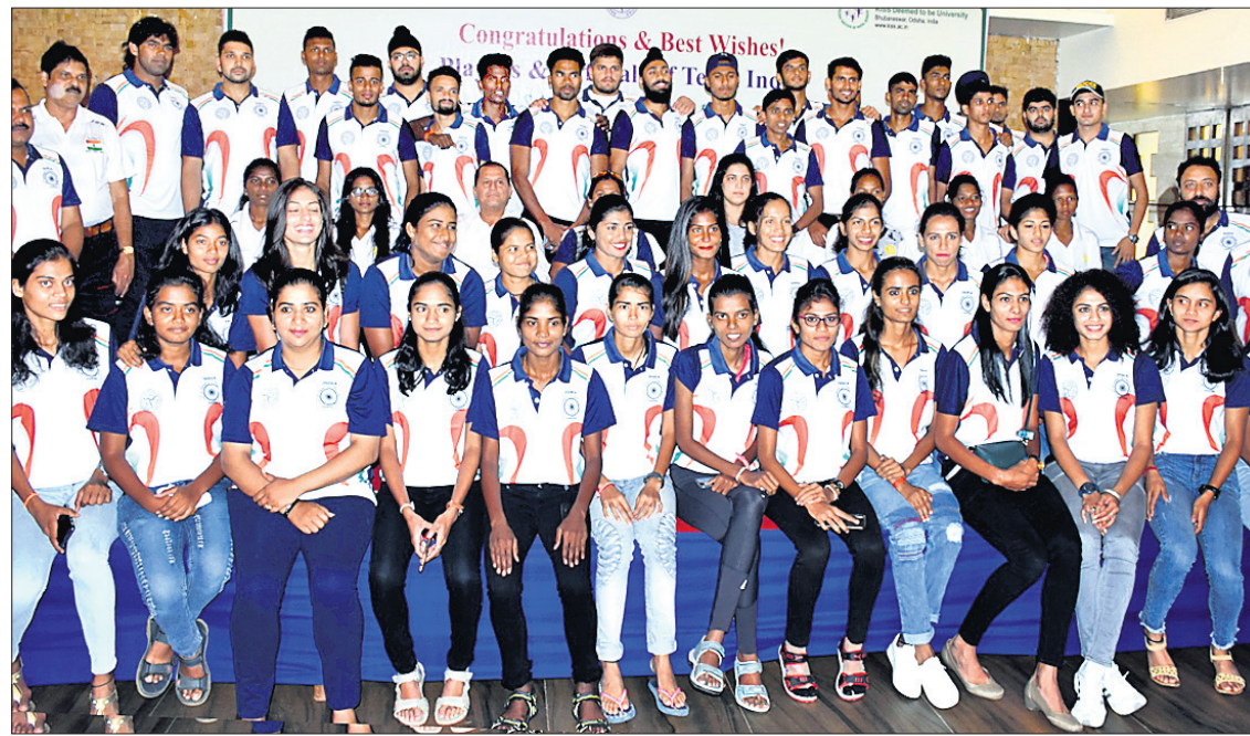
ଖାଲ୍ଡି ଯୁନିଭର୍ସିଟି ଗେମ୍ ପାଇଁ ମନୋନୀତ ଭାରତୀୟ ବିଶ୍ୱବିଦ୍ୟାଳୟ ଦଳ।

ଶନିବାର ଏଠାରେ ଆୟୋଜିତ ଏକ ଖବରଦାତା ସମ୍ମିଳନୀରେ କିରୀ ଓ କିରୀ ପ୍ରତିଷ୍ଠା ତଥା ଏମ୍ପି ଅନୁଷ୍ଠିତ ସାମାଜିକ ସୂଚନା ଦେଇଛନ୍ତି।