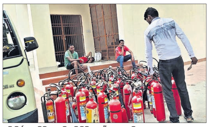
ଅଗ୍ନି ନିର୍ବାପକ ସିଲିଣ୍ଡରଗୁଡ଼ିକ ରିଫିଲିଂ ପାଇଁ ପଠାଯାଇଛି।