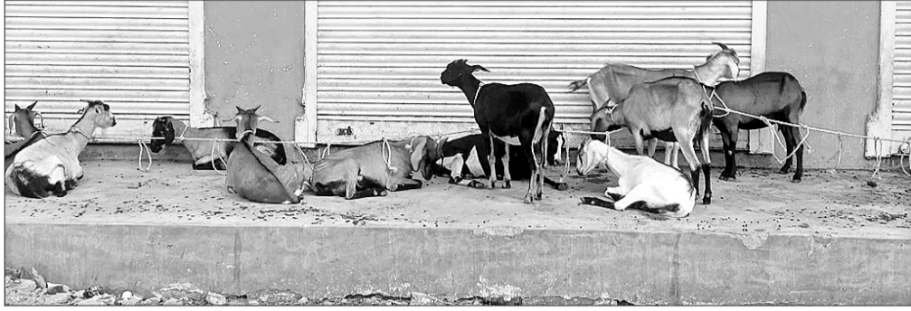
ବସ୍ତୁଶାଣ୍ଡରେ ଛେଳି ବନ୍ଧା ଯାଇଛି ।