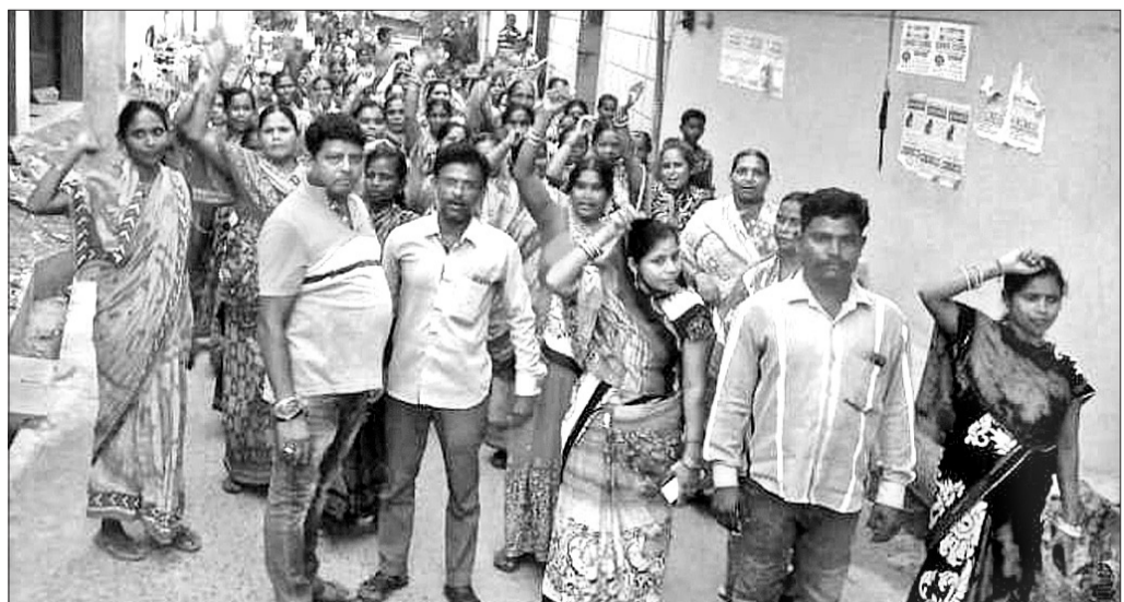
ମହିଳାଙ୍କ ମଦ ବିରୋଧୀ ଶୋଭାଯାତ୍ରା ଚାଲିଛି ।

ଗ୍ରାମର ଗଲକନ୍ଦି ବୁଲି ମଦ ବିରୋଧରେ ସେମାନେ ସଚେତନତା ସୃଷ୍ଟି କରିଥିଲେ ।