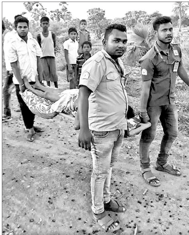
ଆୟୁଲାନ୍ସ କର୍ମଚାରୀ ଆହତଙ୍କୁ ଷ୍ଟେସନରେ ଆଣୁଛନ୍ତି ।

ବରଗଡ଼ ଜିଲାର ଉପତ୍ୟକା ଅଞ୍ଚଳରେ ଖୁବ୍ ଖରାପ ହୋଇଛି। ଖରାପ ହେତୁ ଖୁବ୍ ଖରାପ ହୋଇଛି।