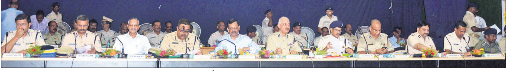
ପୁରୀ ପୌର ସଂସଦରେ ଅନୁଷ୍ଠିତ ବୈଠକରେ ମଧ୍ୟାହ୍ନ ପୋଲିସ ଉପାଧିକାରୀଙ୍କୁ କାର୍ଯ୍ୟକ୍ରମ ବାବଦରେ ସମୀକ୍ଷା କରାଯାଇଛି।

ଜିଲ୍ଲା ମୁଖ୍ୟଅଧିକାରୀଙ୍କ ସମ୍ମୁଖରେ ମନ୍ତ୍ରୀମାନଙ୍କୁ କାର୍ଯ୍ୟକ୍ରମ ବାବଦରେ ସମୀକ୍ଷା କରାଯାଇଛି।