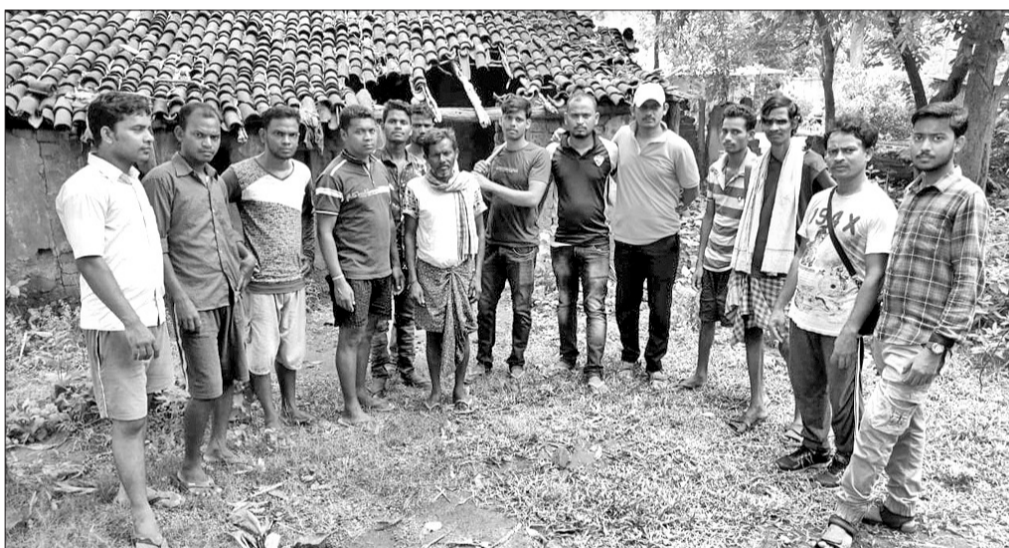
ମ୍ୟାଲେରିଆ ସଚେତନତା ଓ ସ୍ୱଚ୍ଛତା କାର୍ଯ୍ୟକ୍ରମରେ ଶିକ୍ଷକ ପ୍ରଶିକ୍ଷକ ଓ ଛାତ୍ରମାନେ।

ସେବଗଡ଼, ୩୦.୬ (ଡ଼. ସନ. ଏ): ସେବଗଡ଼ ଡ଼ି. କୋ. ଓ ପ୍ରଶିକ୍ଷଣ ପ୍ରତିଷ୍ଠାନ(ଡ଼ାସଡ଼)ର ପୁରୀ ଶାଖାରେ ମ୍ୟାଲେରିଆ ସଚେତନତା ଓ ସ୍ୱଚ୍ଛତା କାର୍ଯ୍ୟକ୍ରମ ଅନୁଷ୍ଠିତ ହୋଇଥିଲା।