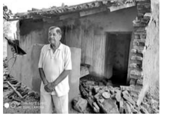
କିର୍ତ୍ତିରା, ୩୦.୬ (ଡ଼. ସନ. ଏ.): କିର୍ତ୍ତିରା ନକ୍ସାପାଳିରେ ହାତୀ ଉପହ୍ରମ ହୋଇଥିଲା।

ଝାଉଁସପୁରୁଆ କିର୍ତ୍ତିରା ନକ୍ସାପାଳିରେ ହାତୀ ଉପହ୍ରମ ହୋଇଥିଲା।