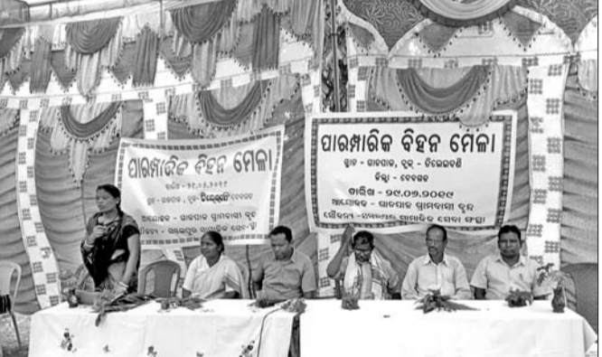
ଦେଶୀ ବିହନ ମେଳା କାର୍ଯ୍ୟକ୍ରମରେ ଉପସ୍ଥିତ ଅଧିକାରୀ।

ସେବଗଡ଼ ଡ଼ି. କୋ. ଓ ପ୍ରଶିକ୍ଷଣ ପ୍ରତିଷ୍ଠାନ(ଡ଼ାସଡ଼)ର ପୁରୀ ଶାଖାରେ ପାରମ୍ପରିକ ଦେଶୀ ବିହନ ମେଳା ଅନୁଷ୍ଠିତ ହୋଇଥିଲା।