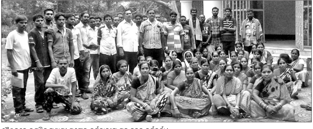
ବୈଠକରେ ଉପସ୍ଥିତ ଅସ୍ଥାୟୀ ସଫେଇ କର୍ମଚାରୀଙ୍କୁ ପ୍ରଶ୍ନାବଳୀ ବଣ୍ଟନ କରାଯାଇଛି।

ପୁରୀ, ୩୦.୬ (ଡ଼. ସନ. ଏ): ପୁରୀ ସଫେଇ କର୍ମଚାରୀଙ୍କ ବୈଠକ ଅନୁଷ୍ଠିତ ହୋଇଥିଲା।