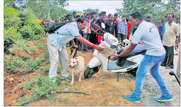
ଘଟଣାସ୍ଥଳରେ ସହାନା କୁକୁର ଓ ସାଉଁଟିଙ୍ଗି ଚିମ୍ପା।

ଗଞ୍ଜାମ, ୩୦/୬(ଡି.ଏନ.ଏ.) ଗଞ୍ଜାମ ଜିଲ୍ଲା ରକ୍ଷା ଆନା ବିଭାଗର ଗ୍ରାମ୍ୟ ପଶୁପକ୍ଷୀ ସାହକାର ପୋଷଣା ନିକଟ ଗ୍ରାମ୍ୟ କଡ଼ୁରୁ ରବିବାର ପୋଲିସ୍ ଏକ ମୃତଦେହ ଉଦ୍ଧାର କରିଛି।