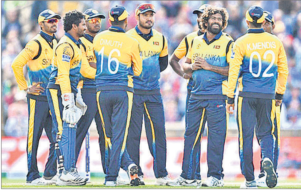
ଶ୍ରୀଲଙ୍କା କ୍ରିକେଟ୍ ଦଳର ଖେଳାଳିମାନେ ।

ଚଳିତ ଆଇସିସି ବିଶ୍ୱକପରେ ଗାଣିତିକ ଦୃଷ୍ଟିକୋଣରୁ ଦେଖିବାକୁ ଗଲେ ଶ୍ରୀଲଙ୍କାର ସେମିଫାଇନାଲ ଆଶା ଏବେ ମଧ୍ୟ ଉଜ୍ଜୀବିତ ରହିଛି । ସୋମବାର ଶ୍ରୀଲଙ୍କା ତା'ର ପରବର୍ତ୍ତୀ ମ୍ୟାଚ୍‌ରେ ସେମି ଫାଇନାଲ୍‌ରେ ପ୍ରତିଯୋଗିତା ଶେଷ କରାଯିବ । ଶ୍ରୀଲଙ୍କା ଚଳିତ ବିଶ୍ୱକପରେ ଦୁର୍ନିମେଶର ଶାନ୍ତ ପାଏ ମ୍ୟାଚ୍‌ରେ ଏହି ଦୁଇ ଦଳ ମୁହାଁମୁହିଁ ହେବେ । ଫେସ୍‌ଲାଇଣ୍ଡ ସେମି ଫାଇନାଲ୍‌ରେ ବାମ ପ୍ରତିଯୋଗିତାକୁ ଶ୍ରୀଲଙ୍କା ପାଇଁ ଅଧିକ ସୁଯୋଗ ବହନ କରୁଛି । ସେମି ଆଶା ଉଜ୍ଜୀବିତ ରଖିବାକୁ ହେଲେ ଶ୍ରୀଲଙ୍କାକୁ ଏହି ମ୍ୟାଚ୍‌ ଜିତିବା ଅପରିହାର୍ଯ୍ୟ ହୋଇ ପଡ଼ିଛି । ଫଳରେ ଶ୍ରୀଲଙ୍କା କର ବା ମର ପରିସ୍ଥିତିର ସମ୍ମୁଖୀନ ହୋଇଛି । ଇଂଲଣ୍ଡକୁ ୨୦ ରନରେ ପରାସ୍ତ କରିବା ପରେ ଅଷ୍ଟ୍ରେଲି ପ୍ରଦର୍ଶନ କରିଆସୁଥିବା ଶ୍ରୀଲଙ୍କାକୁ ବଳ ନିଶ୍ଚିତ । ତେବେ ଏହାର ପରବର୍ତ୍ତୀ ମ୍ୟାଚ୍‌ରେ କିନ୍ତୁ ଦକ୍ଷିଣ ଆଫ୍ରିକାଠାରୁ ପରାସ୍ତ ହୋଇଥିଲା । ଫଳରେ ଶ୍ରୀଲଙ୍କା ସେମିଫାଇନାଲ ଆଶାକୁ ଶୁଭ ଧ୍ୟା ଲାଗିଥିଲା ।