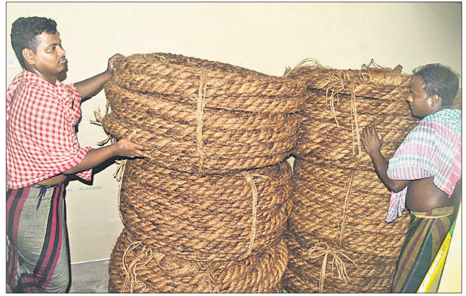
ପୁରୀ ଅଫିସ, ୩୦.୬

ପ୍ରସିଦ୍ଧ ରଥଯାତ୍ରା ପାଇଁ ରଥ ନିର୍ମାଣ ଶେଷ ପର୍ଯ୍ୟାୟରେ ପହଞ୍ଚିଛି। ଆଉ ୩ଦିନ ପରେ ବଡ଼ଦାଣ୍ଡରେ ଚଢ଼ିବ ତିନିରଥ। ଅଗଣିତ ଭକ୍ତ ରଥାଭିଳାଷୀଙ୍କୁ ସାହଯ୍ୟ କରିବାକୁ ଉଦ୍ଦିଷ୍ଟ ନାମକ ଗଣିକା ଗୋଟିଏ ଗୋଟିଏ ନାଗ ଓ ନାଗୁଣୀ। ସର୍ବମୁଖ୍ୟ ଭୂମିକା ଗଣିକା ଗୋଟିଏ ଗୋଟିଏ ନାଗ ଓ ନାଗୁଣୀ। ସର୍ବମୁଖ୍ୟ ଭୂମିକା ଗଣିକା ଗୋଟିଏ ଗୋଟିଏ ନାଗ ଓ ନାଗୁଣୀ। ସର୍ବମୁଖ୍ୟ ଭୂମିକା ଗଣିକା ଗୋଟିଏ ଗୋଟିଏ ନାଗ ଓ ନାଗୁଣୀ।