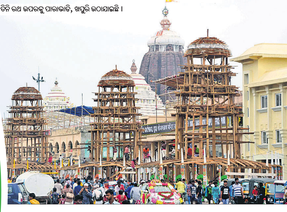
ତିନି ରଥ ଉପରକୁ ପାରାଭାଡ଼ି, ଖପୁରି ଉଠାଯାଇଛି ।

ରହିଛି। ଏହି ଫଣା ଦ୍ଵାରା ସେ ପୃଥିବୀକୁ ଚେକି ଧରିଛନ୍ତି। ଅତଳ ମହାମେଠୁ ପ୍ରବଳ ପରାକ୍ରମୀ ଶ୍ରୀବଳଭଦ୍ରଙ୍କୁ ଚାଳଧିକ ରଥରେ ଗଣିକା ପାଇଁ ଏହି ବାପୁଜୀ ହିଁ ନିଜର ସେବା ସମର୍ପଣ କରିଥାନ୍ତି। ସେ ଭଗବାନ ବଳଭଦ୍ରଙ୍କର ପରମ ଭକ୍ତ। ସେହିପରି ଦେବୀ ସୁଭଦ୍ରାଙ୍କୁ ବର୍ଦ୍ଧନର ରଥ ଦଉଡ଼ିର ନାମ ସ୍ଵର୍ଣ୍ଣଚୂଡ଼ା ନାମକ ନାମ। ଜଗଜନନୀ ଯୋଗମାୟା ପରଂବ୍ରହ୍ମ ସ୍ଵରୂପିଣୀ ମା' ସୁଭଦ୍ରାଙ୍କୁ ଓ କୋଟିସୂର୍ଯ୍ୟ ସମପ୍ରଭ ଶ୍ରୀସୁଦର୍ଶନଙ୍କୁ ରଥରେ ବସାଇ ଗଣିକା ନିମନ୍ତେ ପରମ ଶକ୍ତିଶାଳୀ ସ୍ଵର୍ଣ୍ଣଚୂଡ଼ା ଦଉଡ଼ି ରୂପରେ ଅବତୀର୍ଣ୍ଣ ହୋଇଥାନ୍ତି। ଭକ୍ତମାନେ ଏହି ସୁଦୀର୍ଘ ସ୍ଵର୍ଣ୍ଣଚୂଡ଼ା ନାମକ ନାଗକୁ ଧରି ରଥ ଗଣିଥାନ୍ତି। ମା'ଙ୍କର କରୁଣା ଲାଭ କରିବା ପାଇଁ ଏହି ଯାତ୍ରାକୁ ସ୍ଵର୍ଣ୍ଣଚୂଡ଼ା ଅପେକ୍ଷା କରି ରହିଥାନ୍ତି। ଶ୍ରୀଜଗନ୍ନାଥ ମହାପ୍ରଭୁଙ୍କୁ ନିହିତୋଷ ରଥର ରକ୍ତ ଭାବରେ ଅବତୀର୍ଣ୍ଣ ହୋଇଥାନ୍ତି ଶଙ୍ଖଚୂଡ଼ା ନାମ ନାଗୁଣୀ। ଏହି ଶଙ୍ଖଚୂଡ଼ା ପ୍ରସିଦ୍ଧ ଅଷ୍ଟନାଗ (ଅନନ୍ତ, ବାପୁଜୀ, ପଦ୍ମ, ମହାପଦ୍ମ, ଚକ୍ର, କୁଳାର, କର୍କଟ ଓ ଶଙ୍ଖଚୂଡ଼ା) ମଧ୍ୟରୁ ଅନ୍ୟତମ। ଏହି ନାଗୁଣୀ ଅମିତ ପରାକ୍ରମଶାଳୀ ଓ ଜ୍ୟୋତିର୍ମୟୀ। ନିଜର ପ୍ରଚକ୍ତ ଶକ୍ତି ବଳରେ ସେ ସାତଗୋଟି ପର୍ବତର ଶକ୍ତି ବନ୍ଦନ କରିଥିବା ଅଖିଳ ବ୍ରହ୍ମାଣ୍ଡନାଥ ଶ୍ରୀଜଗନ୍ନାଥ ମହାପ୍ରଭୁଙ୍କ ରଥକୁ ଗଣିକାଦେବୀ ମାଧ୍ୟମ ହୋଇଥାନ୍ତି। ଏହିପରି ଭାବେ ମହାପ୍ରଭୁଙ୍କ ଅତ୍ୟନ୍ତ ପ୍ରିୟ ଶ୍ରୀଗୁଣ୍ଡିଚା ଯାତ୍ରାରେ ନିଜର ସେବା ସମର୍ପଣ ଭାବ ପୋଷଣ କରି ଏହି ନାଗ ନାଗୁଣୀମାନେ ନିଜକୁ ଧନ୍ୟ ମଣିଥାନ୍ତି। ଭକ୍ତଗଣ ଏହି ଭକ୍ତିମତି ନାଗୁଣୀର ସହାୟତାରେ ମହାପ୍ରଭୁଙ୍କ ରଥକୁ ଅନାୟାସରେ ଆଗକୁ ଆଗକୁ ଗଣି ନେଇଥାନ୍ତି।