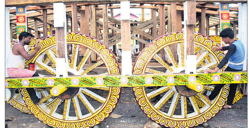
ନିହିତୋଷ ରଥ ଚକକୁ ଚିତ୍ରକାରମାନେ ଚିତ୍ରିତ କରୁଛନ୍ତି ।