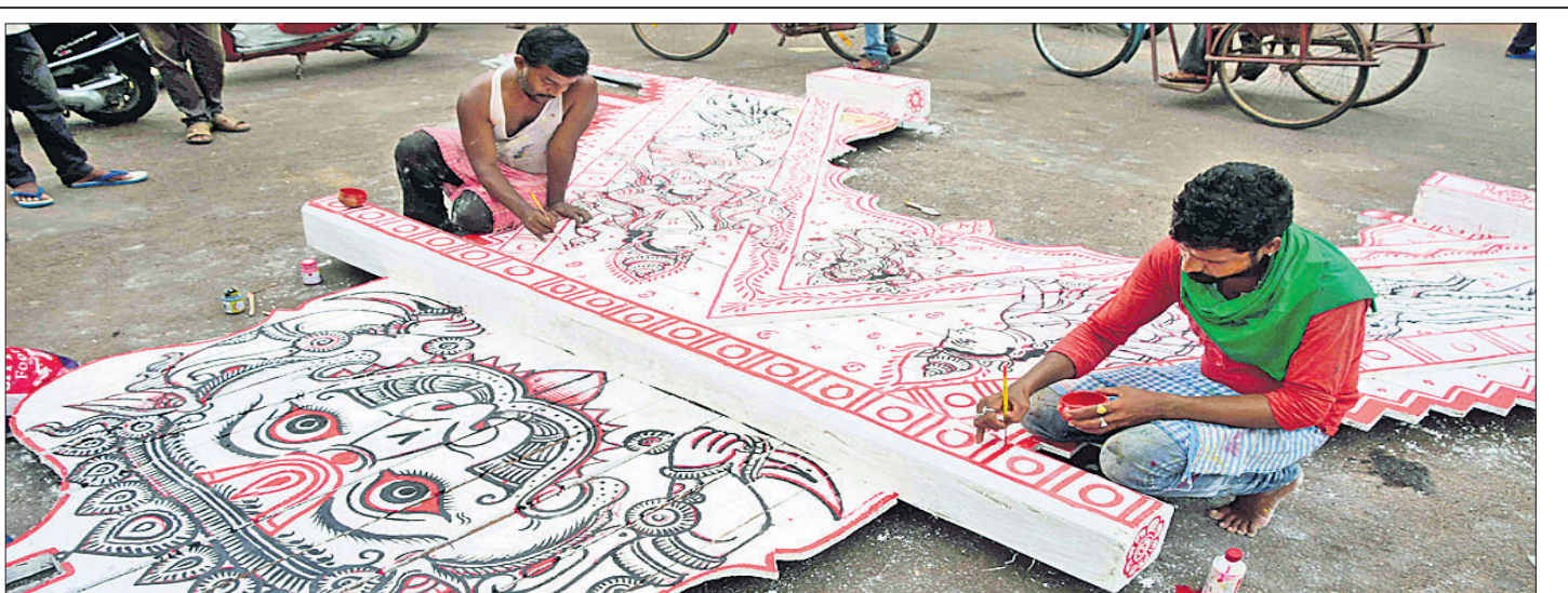
ପୁଆରବେଳା ରଙ୍ଗକାମ ଚାଲିଛି ।