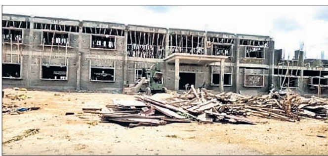
ନିର୍ମାଣାଧୀନ ଆଦର୍ଶ ବିଦ୍ୟାଳୟ କ୍ୟାମ୍ପସ।

ଅନୁଗୋଳ ଜିଲା ଛେଡ଼ିପଦା ବ୍ଲକ ରେଖୁଲୋଳ ପଞ୍ଚାୟତ ଗୋପୀନାଥପୁର ଗ୍ରାମଠାରେ ଚଳିତ ବର୍ଷ ନୂତନ କରି ଆଦର୍ଶ ବିଦ୍ୟାଳୟରେ ଶିକ୍ଷାଦାନ ପାଇଁ ପ୍ରସ୍ତୁତିକାରୀ ପରାକ୍ଷା ହୋଇଥିଲା। ପ୍ରଥମ କରି କେବଳ ଷଷ୍ଠ ଶ୍ରେଣୀରେ ପାଠପଢ଼ା ଆରମ୍ଭ ହୋଇଥିବାବେଳେ ଫୋଟ ୮୧ ଜଣ ଏଥିରେ ନାମ ଲେଖାଯାଇଛି। ଛେଡ଼ି ପଦା ଆରମ୍ଭ ହୋଇପାରିଥିଲେ ମଧ୍ୟ ଏ ପର୍ଯ୍ୟନ୍ତ ଆଦର୍ଶ ବିଦ୍ୟାଳୟର କ୍ୟାମ୍ପସ ନିର୍ମାଣ କାମ ଶେଷ ହୋଇପାରିନାହିଁ। ଫଳରେ ଛାତ୍ରଛାତ୍ରୀମାନେ ଛେଡ଼ିପଦା ସରକାରୀ ହାଇସ୍କୁଲକୁ ଯାଇ ପାଠ ପଢ଼ୁଛନ୍ତି। ଆଦର୍ଶ ପିଲାଙ୍କ ପାଇଁ ସରକାରୀ ସ୍କୁଲରେ ନାହିଁ ଗୋଟିଏ ଶ୍ରେଣୀଗୁହ ଯୋଗାଯାଇଛି। ଏଥିପାଇଁ ଗୋଟିଏ ଘରେ ୮୧ ଛାତ୍ରଛାତ୍ରୀ ସହ ପାଠ ପଢ଼ିବାରେ