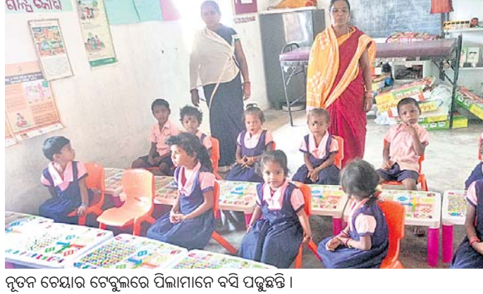
ନୂତନ ଚେନ୍ଦ୍ର ଚେନ୍ଦ୍ରଲେ ପିଲାମାନେ ବସି ପଢୁଛନ୍ତି ।