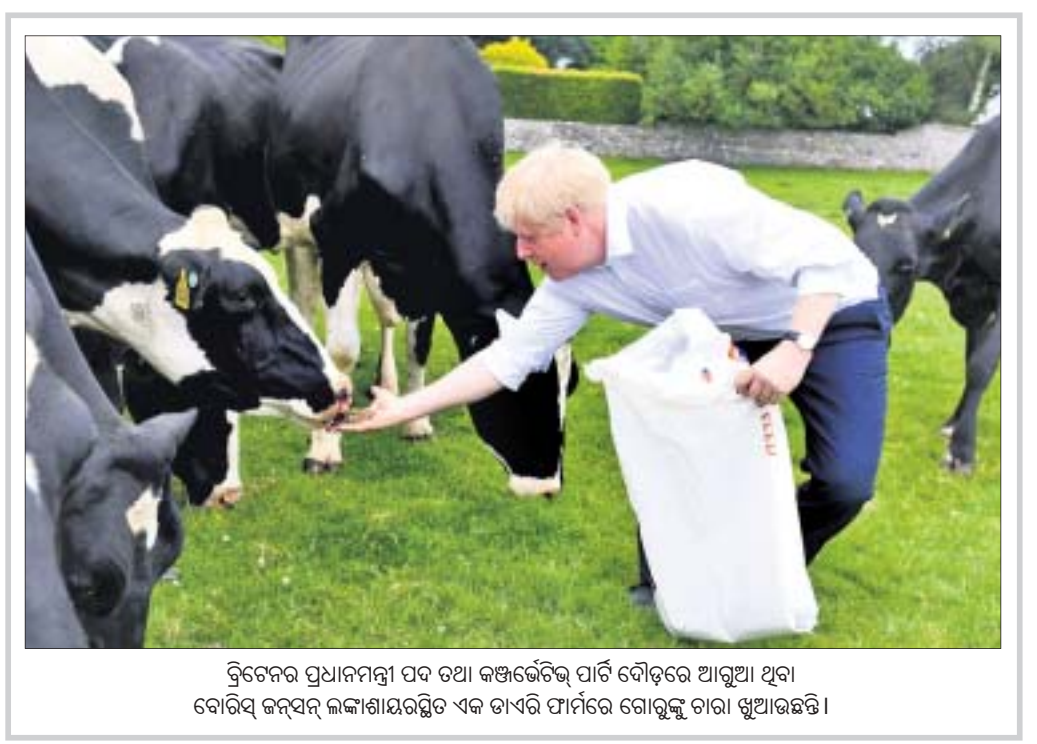
ବ୍ରିଟିଶର ପ୍ରଧାନମନ୍ତ୍ରୀ ପଦ ତଥା କଞ୍ଜର୍ଭେଟିଭ୍ ପାର୍ଟି ଦୌଡ଼ରେ ଆରୁଆ ଥିବା ବୋରିସ୍ ଜନ୍‌ସନ୍ ଲଙ୍କାଶାୟରସ୍ଥିତ ଏକ ଡାଏରି ଫାର୍ମରେ ଗୋରୁଙ୍କୁ ଚାବା ଖୁଆଉଛନ୍ତି ।