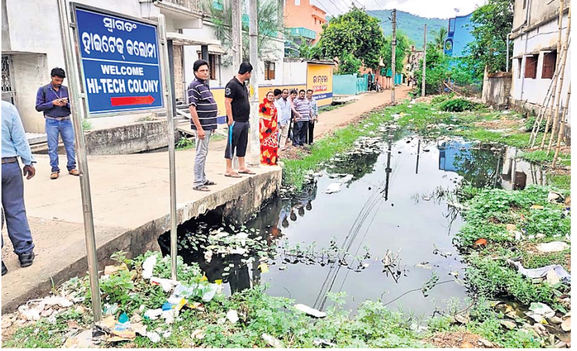
ହାଇଡେଲ କଲୋନୀରେ ଜଳ ନିଷ୍କାସନ ହୋଇ ନ ପାରି ଦୂଷିତ ପରିବେଶ ସୃଷ୍ଟି କରିଛି।