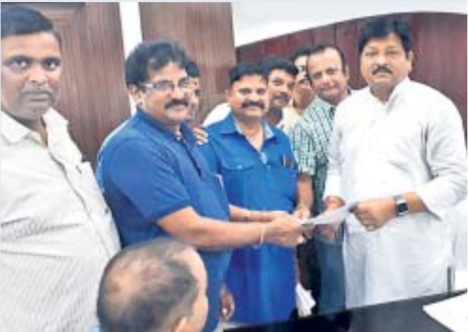
ଜୁଲାଇ ୧ ଯାଏ ବଢ଼ିଲା ଓକିଲଙ୍କ ଆନ୍ଦୋଳନ ଅବଧି

ଆନ୍ଦୋଳନ ବର୍ଜନୀନ ୭ ମାସରେ ପହଞ୍ଚିଛି। ପୂର୍ବ ବୈଠକରେ ୩୦ ଜୁନ ଯାଏ କୋର୍ଟ ବର୍ଜନ କରାଯିବା ପାଇଁ ସ୍ଥିର ହୋଇଥିବା ବେଳେ ତାହାର ଅବଧି ବୃଦ୍ଧି ହୋଇଛି। ଦାବି ଜଣାଇବା ପାଇଁ ମୁଖ୍ୟମନ୍ତ୍ରୀଙ୍କୁ ଭେଟିବା ଲାଗି ସମୟ