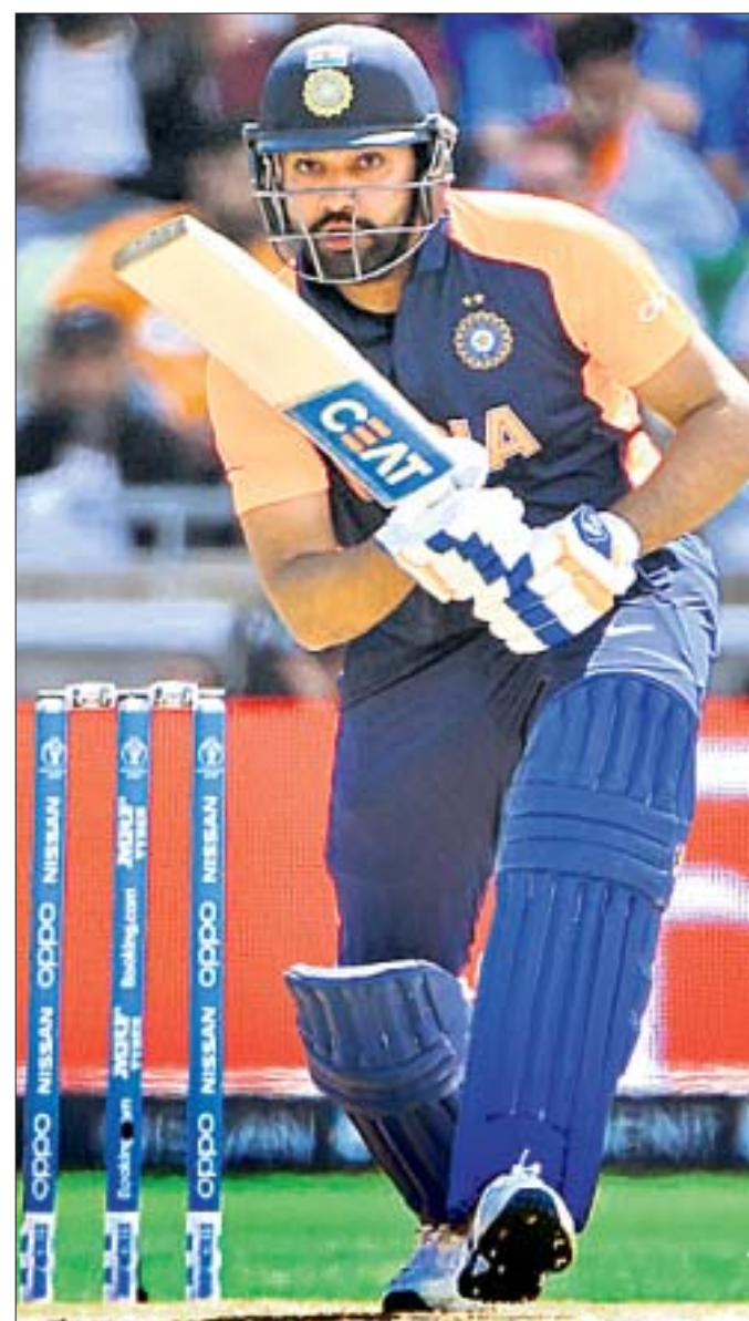
ଶତକୀୟ ଇନିଂସ ଅବସରରେ ରୋହିତ ଶର୍ମା।

ଚହଲଙ୍କ ଅଲୋଡ଼ା ରେକର୍ଡ ହୋଇଥିଲେ। ଯେଉଁଥିରେ ୬ ରୋକା ଓ ୬ ଛକା ସାମିଲ ରହିଛି। ଦିନିକିଆ କ୍ରିକେଟ୍ରେ ଚହଲଙ୍କ ଏହା ସବୁଠାରୁ ଖରାପ ବୋଲି କେହି ମଧ୍ୟ ହୋଇନାହିଁ। ଚହଲ ଏଥିପରେ ବିଶ୍ୱକପ ଇତିହାସରେ ସବୁଠାରୁ ମହଙ୍ଗା ବୋଲି କରିଥିବା ଭାରତୀୟ ବୋଲର ହେବାର ଅଲୋଡ଼ା ରେକର୍ଡକୁ ନିଜ ନାମରେ କରିଛନ୍ତି। ପୂର୍ବରୁ ଜାଭାଗଲ ଶ୍ରୀନାଥ ଏହି ରେକର୍ଡର ଅଧିକାରୀ ହୋଇଥିଲେ। ଶ୍ରୀନାଥ ୨୦୦୩ ବିଶ୍ୱକପ ଫାଇନାଲରେ ଅଷ୍ଟ୍ରେଲିଆ ବିପକ୍ଷରେ ୮୬ ରନ ବ୍ୟୟ କରିଥିଲେ। ବିଶ୍ୱକପ ଇତିହାସରେ ଗୋଟିଏ ଇନିଂସରେ ମହଙ୍ଗା ବୋଲି କରିଥିବା ୫ ଭାରତୀୟ ବୋଲରଙ୍କ ସମ୍ପର୍କରେ ଚେହେରାରେ ପ୍ରଦାନ କରାଗଲା।