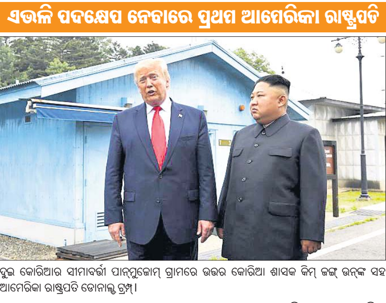
ଉତ୍ତର କୋରିଆର ସୀମାବର୍ତ୍ତୀ ପାନ୍‌ପୁନେଗାମ୍ ଗ୍ରାମରେ ଉତ୍ତର କୋରିଆ ଶାସକ କିମ୍ ଜଙ୍ଗ୍ ଉନ୍‌ଙ୍କ ସହ ଆମେରିକା ରାଷ୍ଟ୍ରପତି ତୋନାଲ୍ଡ ଟ୍ରମ୍ପ।

ସିଂଗ/ପାନ୍‌ପୁନେଗାମ୍, ୩୦।୬ (ପି.ଟି./ ଆଇଏମ୍‌ଏସ୍‌ଏସ୍) ଏକ ଦୁର୍ଭାଗ୍ୟ କୃତନୈତିକ ଘଟଣାକ୍ରମରେ ଆମେରିକା ରାଷ୍ଟ୍ରପତି ତୋନାଲ୍ଡ ଟ୍ରମ୍ପ ରବିବାର ଉତ୍ତର କୋରିଆ ମାଟିରେ ପାଦ ଦେଇଛନ୍ତି। ଉତ୍ତର କୋରିଆ ଓ ଦକ୍ଷିଣ କୋରିଆ ସୀମା ବା ଅଣସୀମା ମଧ୍ୟ (ଡିଏମ୍‌ପିଏ) ଅତିକ୍ରମ କରି ସେ ପୋଲିସ୍‌ମ୍ୟାନ୍ ଶାସକ କିମ୍ ଜଙ୍ଗ୍ ଉନ୍‌କୁ ସାମ୍ରାଜ୍ୟ କରିଛନ୍ତି। ଏହାପରେ ବିଶ୍ୱର ଶେଷ ଶାନ୍ତତାକୁ ସୀମା ଅତିକ୍ରମ କରି ଉତ୍ତର କୋରିଆ ଦିବାରେ ଟ୍ରମ୍ପ ଆମେରିକାର ପ୍ରଥମ ନେତା ଭାବେ ମାନ୍ୟତା ଲାଭ କରିଛନ୍ତି। ତାଙ୍କର ଏହି ପଦକ୍ଷେପକୁ କୃତନୈତିକ ମହଲରେ ପ୍ରଶଂସା କରାଯାଉଛି। ଡିଏମ୍‌ପିଏ ହେଉଛି ଅସ୍ଥିରତା ରୁକ୍ଷ ଗ୍ରାମ ପାନ୍‌ପୁନେଗାମ୍ ବୁଢ଼ାଗାରେ ବିଭକ୍ତ କରୁଥିବା ସୀମା, ଯାହାକୁ ଜଣେ ସିଙ୍ଗାରିଟି ଏରିଆ ମଧ୍ୟ କୁହାଯାଏ। ବୁଢ଼ାଗା ଦକ୍ଷିଣ କୋରିଆ ଗସ୍ତରେ ଟ୍ରମ୍ପ ପ୍ରଥମେ ଏମ୍‌ଡିଏଲ୍ ଆଡ଼କୁ ଅଗ୍ରସର ହୋଇଥିଲେ। ଉତ୍ତର କୋରିଆ ନେତା କିମ୍ ଜଙ୍ଗ୍ ଉନ୍‌ ସେଠାରେ ଟ୍ରମ୍ପଙ୍କୁ ଆପେକ୍ଷା କରିଥିଲେ। ଟ୍ରମ୍ପ ଏହି ସୀମା ଡେଇଁ ଉତ୍ତର କୋରିଆ ମାଟିରେ ପାଦ ଦେବା ପରେ କିମ୍ ତାଙ୍କ ଆଡ଼କୁ ହାତ ବଢ଼ାଇଥିଲେ। ଉଭୟେ ଫଟୋ ପାଇଁ ପୋର୍ଟ ଦେବା ପରେ ଦକ୍ଷିଣ କୋରିଆ ପତକୁ ଚାଲି ଚାଲି ଯାଇଥିଲେ। ପରେ ବୁଢ଼ାଗା ଦକ୍ଷିଣ କୋରିଆ ରାଷ୍ଟ୍ରପତି ମୁନ୍ ଜାଏ-ଇନ୍‌କ୍ ସହ ମିଶି ପ୍ରତି ପଦକ୍ଷେପ ଯାଇଥିଲେ। ଟ୍ରମ୍ପ ଓ କିମ୍ ଗଣମାଧ୍ୟମକୁ ସମାଧିତ କରିବା ପୂର୍ବରୁ ରୁକ୍ଷଦ୍ୱାରା ବୈଠକ କରିଥିଲେ। ଏହି ଅବସରରେ ଗଣମାଧ୍ୟମକୁ ଟ୍ରମ୍ପ କହିଛନ୍ତି, ଡିଏମ୍‌ପିଏ ଅତିକ୍ରମ କରିବା ତାଙ୍କ ପାଇଁ ଏକ ବଡ଼ ସମ୍ପାଦ। କିମ୍ଙ୍କ ସହ ପୁନଃ ଆଲୋଚନା ପାଇଁ ସେ ରାଜି ହୋଇଛନ୍ତି। ଆସନ୍ତା ବୁଢ଼ାଗା ଚିନି ସମୁଦ୍ର ମଧ୍ୟରେ ଉଭୟ ପକ୍ଷର ଚିମ୍ କାର୍ଯ୍ୟ ଆରମ୍ଭ କରିବେ। ଆମେରିକା ପକ୍ଷରୁ ସ୍ୱତନ୍ତ୍ର ପ୍ରତିନିଧି