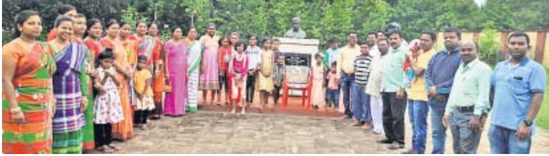
ସାନ୍ତାଳୀ ବିଦ୍ରୋହ ଦିବସରେ ଶହୀଦଙ୍କୁ ଶ୍ରଦ୍ଧାଞ୍ଜଳି ଜାପନ କରାଯାଉଛି।

କରାଯାଇଥିଲା। ଏଥିରେ ହଜାର ହଜାର ସାନ୍ତାଳୀ ଶହୀଦ ହୋଇଥିଲେ। ଶେଷରେ ଇଂରେଜମାନେ ହାର୍ ମାନିଥିଲେ ଭଗନାଡ଼ିହ ଗ୍ରାମରୁ ଆରମ୍ଭ ହୋଇଥିଲା। ଇଂରେଜଙ୍କ ଅତ୍ୟାଚାର, ଜମିଦାରୀ ପ୍ରଥା, ଜବରଦଖଲ, ଅତ୍ୟଧିକ ଖଜଣା ଆଦି ବିରୋଧରେ ଏହି ପ୍ରତିବାଦ