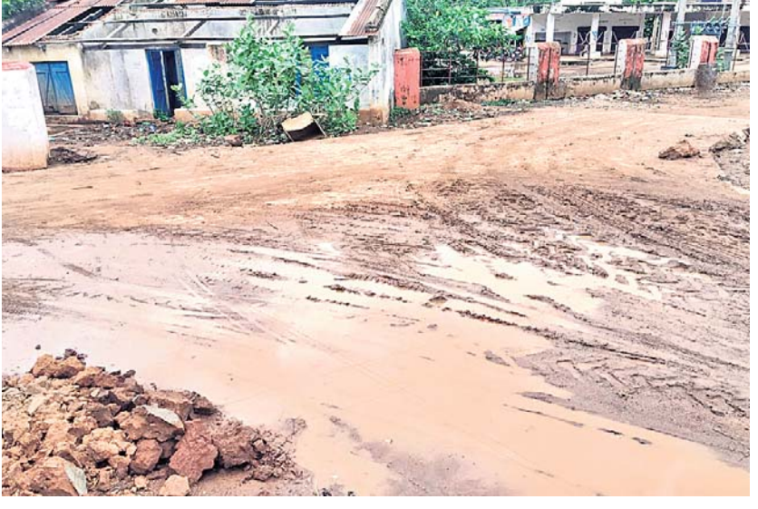
ଅଳ୍ପବର୍ଷରେ କାଦୁଅ ହୋଇପଡିଥିବା ରାସ୍ତା।

ରୋବିନ୍ଦପାଲି, ୩୦୬୭(ଡି.ଏନ.ଏ.) : ନିର୍ମାଣ କରିବାକୁ ମା ଲକ୍ଷ ଟଙ୍କା ମଞ୍ଜୁର ହୋଇଥିଲା। ରାସ୍ତା ନିର୍ମାଣ ହୋଇଛି ସତ। ମାତ୍ର ଲୋକେ ଯାତ୍ରାୟତ କରୁଥିବା ରାସ୍ତାରେ କାମ ନ ହୋଇ ଏହାର ପାର୍ଶ୍ଵରେ ନିର୍ମାଣ ହୋଇଛି ରାସ୍ତା। ଯାହା ଲୋକଙ୍କ ପାଇଁ ଅଲୋଚ୍ୟ ହୋଇ ପଡିଛି। ସାମାନ୍ୟ ବର୍ଷା ହେଲେ ଏହି ନିର୍ମିତ ରାସ୍ତା କାଦୁଅ ହୋଇପଡୁଛି। ଏନେଇ ବାରମ୍ବାର ଅଭିଯୋଗ କଲେ ମଧ୍ୟ ପ୍ରଶାସନ ପ୍ରତିବାଦ କରି ଗାଁ ଲୋକେ ଏକାଠି ହୋଇ ରାସ୍ତାରେ ଧାନ ରୋଇଥିଲେ। ଏହି ଘଟଣା ଗଣମାଧ୍ୟମରେ ପ୍ରକାଶ ପରେ ରୁକ ପ୍ରଶାସନ ଚେତୁଥିଲା। ରାସ୍ତା