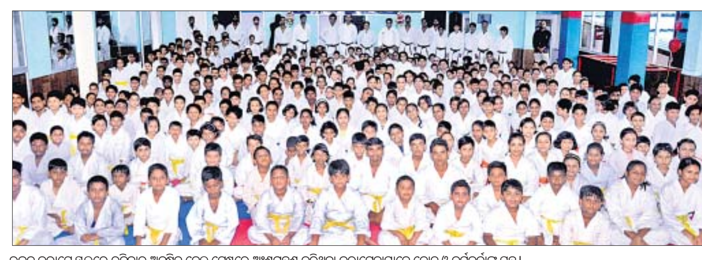
ଉତ୍କଳ କରାଟେ ସ୍କୁଲରେ ରବିବାର ଅନୁଷ୍ଠିତ ଦେଲ୍ ଚେଷ୍ଟରେ ଅଂଶଗ୍ରହଣ କରିଥିବା କରାଟେକାମାନେ କୋର୍ ଓ କର୍ମକର୍ତ୍ତା ସହ ।

ଅଧିକାଂଶ ମ୍ୟାଚ୍ ପାଇଁ ଚାଳ ସ୍ଥାନରେ ରଖିଆକୁ ଦଳରେ ନେବାକୁ ଅନୁମତି ପାଇଁ ଶ୍ରୀଲଙ୍କା କରିଥିବା ଅନୁରୋଧକୁ ଆଇସିସି ପୁରୁଷ ବିଶ୍ୱକପ୍ ୨୦୧୯ ଇଭେଣ୍ଟ ଚେନ୍ନିକାଲ କମିଟି ଅନୁମୋଦନ କରିଛି। ରାଜିଆ ୬ ଚେଷ୍ଟ, ୬ ଅଧିକାଂଶ ଦିନିକିଆ ଏବଂ ୫ ଟି ୨୦ ଖେଳିଛନ୍ତି।