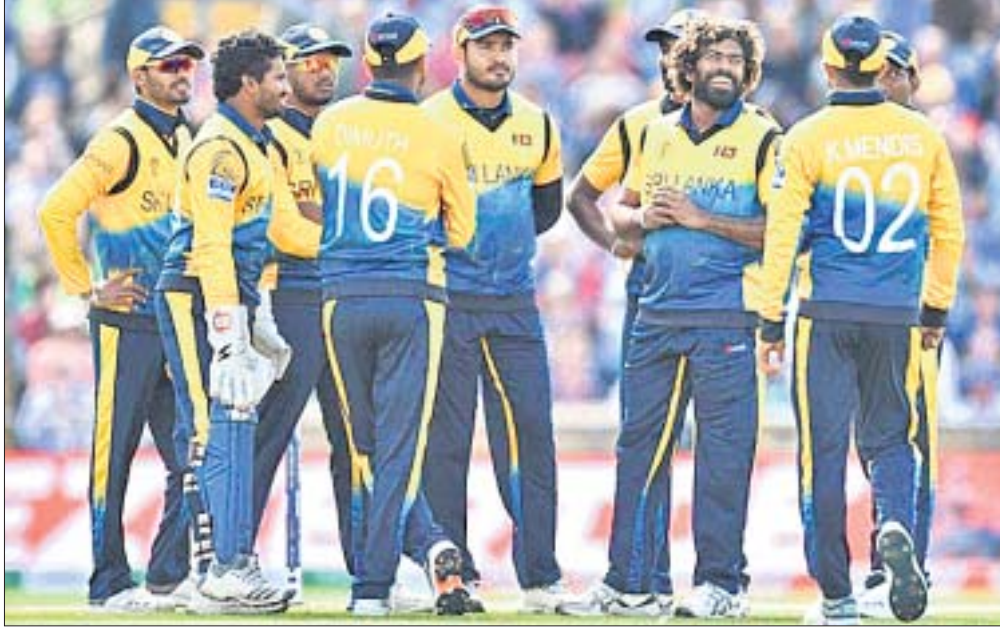
ଶ୍ରୀଲଙ୍କା କ୍ରିକେଟ୍ ଦଳର ଖେଳାଳିମାନେ ।