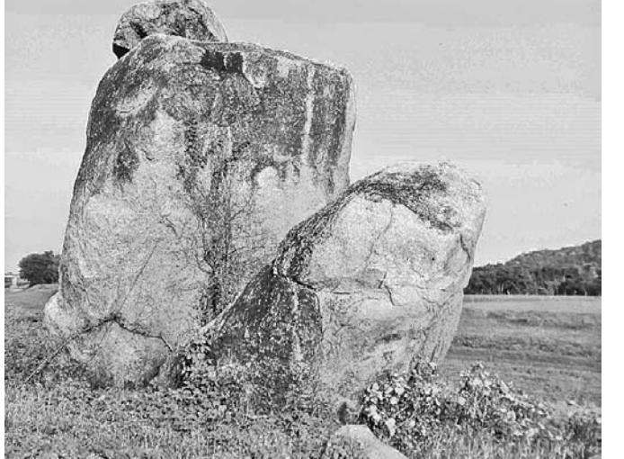
ମାଣ ଗୌଣୀ ପଥର।