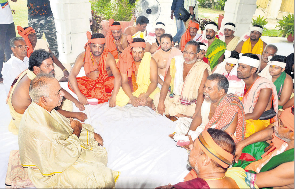
ଦଇତାପତି ସେବକମାନେ ଗଜପତି ମହାରାଜାଙ୍କୁ ବାହୁ ବିଗ୍ରହ ସୁସ୍ଥ ହେବା ଖବର ଜଣାଇଛନ୍ତି।