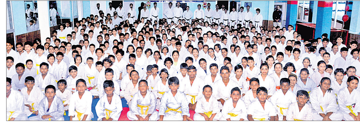
ଉତ୍କଳ କରାଟେ ସ୍କୁଲରେ ରବିବାର ଅନୁଷ୍ଠିତ ବେଲ୍ ଟେଷ୍ଟରେ ଅଂଶଗ୍ରହଣ କରିଥିବା କରାଟେକାମାନେ କୋର୍ ଓ କର୍ମଚରୀଙ୍କ ସହ।

ଲଣ୍ଡନ, ୩୦।୬ (ପି.ଟି.): ହାଡ଼ପୁଟିରେ ଯୋଗୁ ଶ୍ରୀଲଙ୍କା ଯେସ୍ ବୋଲର ନୁଆନ ପ୍ରଦୀପ ଶନିବାର ଆଇସିସି ବିଶ୍ୱକପ୍‌ରୁ ଆଉଟ୍ ହୋଇଯାଇଛନ୍ତି। ତାଙ୍କ ସ୍ଥାନରେ ଦଳରେ ସାମୁନ ରଜିଆ ସ୍ଥାନ ପାଇବେ। ଲୁନ୍ ୪ରେ ଆଫଗାନିସ୍ତାନ ବିପକ୍ଷ ମ୍ୟାଚ୍‌ରେ ପ୍ରଦୀପ ମ୍ୟାଚ୍ ବିଜୟୀ ୪ ଉତ୍ତରାଧିକାରୀ ହାସଲ କରିଥିଲେ। ଚୁର୍ଣ୍ଣମେଣ୍ଟରେ ଶ୍ରୀଲଙ୍କା ଏପର୍ଯ୍ୟନ୍ତ ଖେଳି ସାରିଥିବା ୭ଟି ମ୍ୟାଚ୍ ମଧ୍ୟରୁ ପ୍ରଦୀପ ୩ଟି ମ୍ୟାଚ୍‌ରେ ଖେଳିଥିଲେ। ଲୁନ୍ ୨୧ରେ ଇଂଲଣ୍ଡ ବିପକ୍ଷରେ ସେ ତାଙ୍କ ଅକ୍ତିମ ମ୍ୟାଚ୍ ଖେଳିଥିଲେ। ପ୍ରଦୀପ ଅସୁସ୍ଥ ଥିବାରୁ ଚୁର୍ଣ୍ଣମେଣ୍ଟର ଦଳର ଅବଶିଷ୍ଟ ମ୍ୟାଚ୍ ପାଇଁ ତାଙ୍କ ସ୍ଥାନରେ ରଜିଆଙ୍କୁ ଦଳରେ ନେବାକୁ ଅନୁମତି ପାଇଁ ଶ୍ରୀଲଙ୍କା କରିଥିବା ଅନୁରୋଧକୁ ଆଇସିସି ପୁରୁଷ ବିଶ୍ୱକପ୍ ୨୦୧୯ ଇଭେଣ୍ଟ୍‌ସ୍‌କୋର୍ଡିଂ କମିଟି ଅନୁମୋଦନ କରିଛି। ରଜିଆ ୫ ଟେଷ୍ଟ, ୬ ଅକ୍ତିମାତ୍ତା ଦିନିକିଆ ଏବଂ ୫ ଟି୨୦ ଖେଳିଛନ୍ତି।