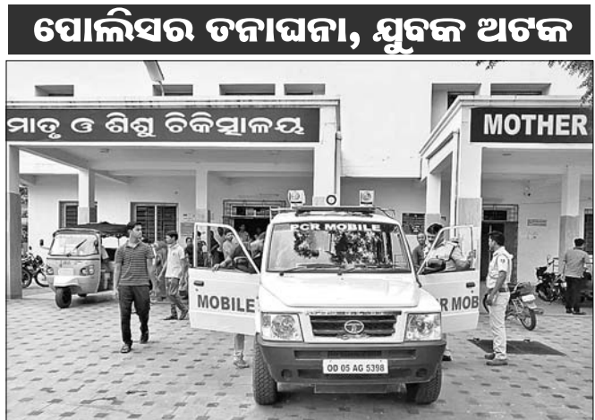
ମାଟୁ ଓ ଶିଶୁ ଚିକିତ୍ସାଳୟରେ ପୋଲିସ ତଦନ୍ତ କରୁଛି।

ନୟାଗଡ଼ ଜିଲ୍ଲା ମୁଖ୍ୟ ଚିକିତ୍ସାଳୟରୁ ବାରମ୍ବାର ମୋବାଇଲ ଚୋରି ଭଳି ଘଟଣା ଦେଖିବାକୁ ମିଳୁଛି। ପୂର୍ବରୁ ଏ ନେଇ କେହି ଅଭିଯୋଗ କରି ନ ଥିଲେ। ହେଲେ ରବିବାର ଜଣେ ମହିଳା ଚାଉନ ଥାନାରେ ଅଭିଯୋଗ କରିଛନ୍ତି। ତାଙ୍କ ଅଭିଯୋଗ ଅନୁସାରେ ସେ ମାଟୁ ଓ ଶିଶୁ ଚିକିତ୍ସାଳୟରେ ଚିକିତ୍ସିତ ହେଉଥିଲେ। ଶନିବାର ରାତିରେ ମୋବାଇଲରେ କଥା ହୋଇସାରି ଶୋଇ ପଡ଼ିଥିଲେ। ରବିବାର ସକାଳୁ ଉଠି ମୋବାଇଲ ନ ଥିବା ଦେଖିଥିଲେ। ଏ ନେଇ ସେ ମେଡ଼ିକାଲ କର୍ତ୍ତୃପକ୍ଷଙ୍କୁ ଜଣାଇଥିଲେ ମଧ୍ୟ କେହି ଶୁଣି ନ ଥିଲେ। ପରେ ସେ ଚାଉନ ଥାନାରେ ଅଭିଯୋଗ କରିଥିଲେ। ପୋଲିସ ଘଟଣାସ୍ଥଳରେ ପହଞ୍ଚି ତନାନ୍ଦନା କରିବା ସହିତ ସନ୍ଦେହରେ ଜଣେ ଯୁବକଙ୍କୁ ଆଣି ଅଟକ ରଖିଛି। ମୁଖ୍ୟ ଚିକିତ୍ସାଳୟରେ ଅନେକ ସ୍ଥାନରେ ସିଲ୍‌କ୍ରିଟି ଗାଡ଼ି ଥିବା ଜଣାପଡ଼ିଛି। ପ୍ରକାଶ ଯେ, ୩ଦିନ ତଳେ ଜିଲ୍ଲା ମାଟୁ ଓ ଶିଶୁ ଚିକିତ୍ସାଳୟରୁ ୨ଟି ମୋବାଇଲ ଚୋରି ହୋଇଥିଲା। ସର୍ବନିମ୍ନ ଖର୍ଚ୍ଚରୁ ମଧ୍ୟ ରୋଗୀ ସମ୍ପର୍କିତ