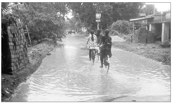
ରାସ୍ତାରେ ପାଣି ଜମି ରହିଛି।

କେନ୍ଦ୍ରାପଡ଼ା-ମାର୍ଗାଢ଼ାଲ ରାସ୍ତାର କ୍ରସିଂ ଠାରୁ ମାର୍ଗାଢ଼ାଲ ପର୍ଯ୍ୟନ୍ତ ଯାଇଥିବା ଦୀର୍ଘ ୩ କି.ମି. ରାସ୍ତା ଉପଯୁକ୍ତ ରକ୍ଷଣାବେକ୍ଷଣ ଆଭାବରୁ ଶୋଚନୀୟ ହୋଇପଡ଼ିଛି। ଏହି ରାସ୍ତାର ଅନେକ ସ୍ଥାନରେ ଖାଲ ଖମା ହୋଇଛି। ଫଳରେ ଅସରାଏ ବର୍ଷା ହେଲେ ପାଣି ଜମି ରହିବା ସହ କାବୁଟି ହେଉଛି। କାବୁଟିରେ ଗୋଟ ଖସିଯିବାକୁ ଅନେକ ସମୟରେ ପଥଚାରୀ ପଡ଼ୁଛନ୍ତି। ବିଶେଷ କରି ଛାତ୍ରଛାତ୍ରୀ ହଜିରାଣ ହେବା ସାଙ୍ଗକୁ ପଡିଯାଇ ଖଣ୍ଡିଆ ଖାବରା ହେଉଛନ୍ତି। ପ୍ରକାଶ ଯେ, ପୂର୍ବ ବିଭାଗ ଅଧୀନରେ ଥିବା ଏହି ରାସ୍ତାର ପ୍ରଶସ୍ତିକରଣ କାର୍ଯ୍ୟ ନିର୍ବାଚନର ଠିକ୍ ପୂର୍ବରୁ ଆରମ୍ଭ କରାଯାଇଛି। ରାସ୍ତାର ଉଭୟ ପାର୍ଶ୍ୱରେ ମାଟି ପଡିଥିବାରୁ ତାହା ବର୍ଷା ହେଲେ ଖାଲ ପୂରି ରାସ୍ତା ଉପରେ ବହଳ ହୋଇ ପଡିରହିଛି। ସେହିପରି ରାସ୍ତା କଡ଼ରେ