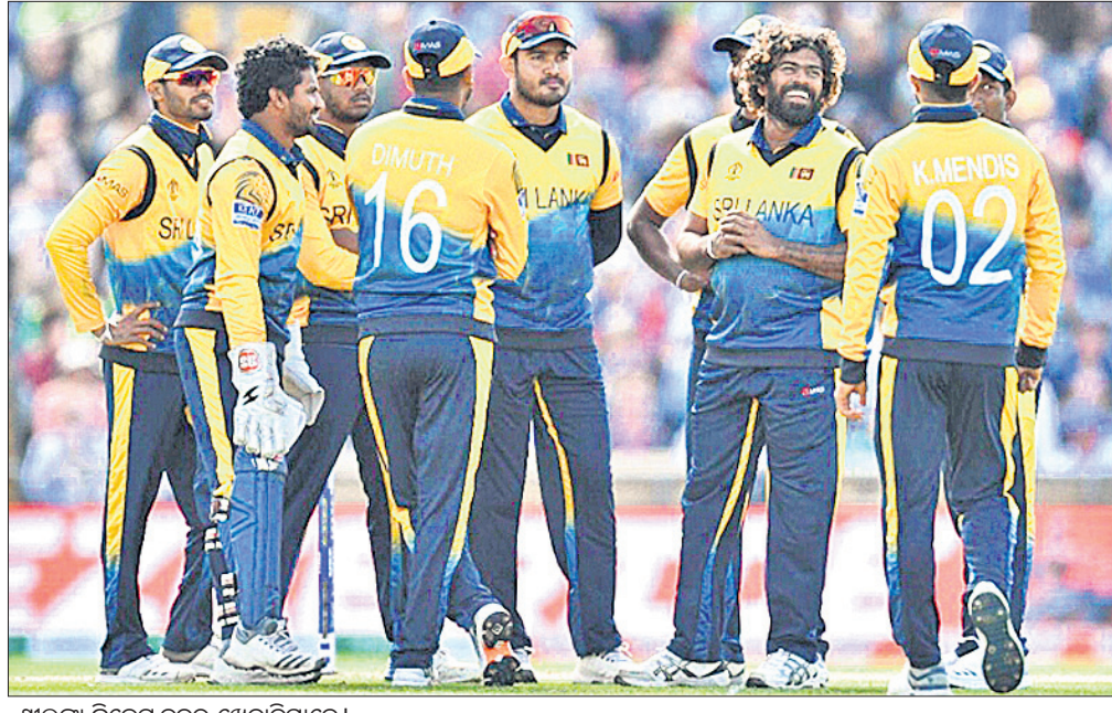
ଶ୍ରୀଲଙ୍କା କ୍ରିକେଟ୍ ଦଳର ଖେଳାଳିମାନେ।

ରେଷ୍ଟର-ଲି-ଷ୍ଟ୍ରି, ୩୦।୬ (ପି.ଟି.): ଚଳିତ ଆଇସିସି ବିଶ୍ୱକପରେ ଗାଣିତିକ ଦୃଷ୍ଟିକୋଣରୁ ଦେଖିବାକୁ ଗଲେ ଶ୍ରୀଲଙ୍କାର ସେମିଫାଇନାଲ ଆଶା ଏବେ ମଧ୍ୟ ଉଜ୍ଜୀବିତ ରହିଛି। ସୋମବାର ଶ୍ରୀଲଙ୍କା ଚୀଂ ପରବର୍ତ୍ତୀ ମ୍ୟାଚ୍‌ରେ ସେମି ଦୌଡ଼କୁ ବାଦ୍ ପଡ଼ିସାରିଥିବା ଫ୍ରେଷ୍ଟଲଡ଼କୁ ଭେଟିବ। ସ୍ଥାନୀୟ ଟିକେଟ୍‌ସାଇଟ୍ ପ୍ରାଉଡ଼ରେ ଚୁର୍ଣ୍ଣମେଣ୍ଟର ୩୯ତମ ମ୍ୟାଚ୍‌ରେ ଏହି ଦୁଇ ଦଳ ମୁହାଁମୁହିଁ ହେବେ। ଫ୍ରେଷ୍ଟଲଡ଼ ସେମି ଦୌଡ଼କୁ ବାଦ୍ ପଡ଼ିସାରିଥିବାକୁ ଶ୍ରୀଲଙ୍କା ପାଇଁ ଅଧିକ ସୁରୁତ୍ୱ ବହନ କରୁଛି। ସେମି ଆଶା ଉଜ୍ଜୀବିତ ରଖିବାକୁ ହେଲେ ଶ୍ରୀଲଙ୍କାକୁ ଏହି ମ୍ୟାଚ୍ ଜିତିବା ଅପରିହାର୍ଯ୍ୟ ହୋଇ ପଡ଼ିଛି। ଫଳରେ ଶ୍ରୀଲଙ୍କା କର ବା ମର ପରିସ୍ଥିତିର ସମ୍ମୁଖୀନ ହୋଇଛି। ଇଂଲଣ୍ଡକୁ ୨୦ ରନରେ ପରାସ୍ତ କରିବା ପରେ ଅସ୍ଥିର ପ୍ରଦର୍ଶନ କରିଆସୁଥିବା ଶ୍ରୀଲଙ୍କାକୁ ବଳ ମିଳିଛି। ତେବେ ଏହାର ପରବର୍ତ୍ତୀ ମ୍ୟାଚ୍‌ରେ କିନ୍ତୁ ଦକ୍ଷିଣ ଆଫ୍ରିକାଠାରୁ ପରାସ୍ତ ହୋଇଥିଲା। ଫଳରେ ଶ୍ରୀଲଙ୍କାର ସେମିଫାଇନାଲ ଆଶାକୁ ଶୁଭ୍ ଧକ୍କା ଲାଗିଥିଲା। ୧୯୯୬ରେ ବିଶ୍ୱକପ୍ ଚାଳଚଳ ହାସଲ କରିଥିବା ଶ୍ରୀଲଙ୍କା ଚୁର୍ଣ୍ଣମେଣ୍ଟରେ ଏପର୍ଯ୍ୟନ୍ତ ୭ଟି ମ୍ୟାଚ୍ ଖେଳି ୨ ବିଜୟ, ୩ ପରାଜୟ ସହ ଓ ୨ଟି ଦିନା ଫଳାଫଳ ସହିତ ୬ ପଏଣ୍ଟ ପାଇ ସପ୍ତମ ସ୍ଥାନରେ ରହିଛି। ତେଣୁ ଶ୍ରୀଲଙ୍କାକୁ ଚୀଂ ବାକିଥିବା ୨ଟି ମ୍ୟାଚ୍‌ରେ ବିଜୟୀ ହେବାକୁ