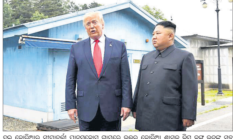
ଉତ୍ତର କୋରିଆର ସୀମାବର୍ତ୍ତୀ ପାର୍ଲମେଣ୍ଟ ଗ୍ରାମରେ ଉତ୍ତର କୋରିଆ ଶାସକ କିମ୍ ଜଙ୍ଗ୍ ଉନ୍‌ଙ୍କ ସହ ଆମେରିକା ରାଷ୍ଟ୍ରପତି ଡୋନାଲ୍ଡ ଟ୍ରମ୍ପ।