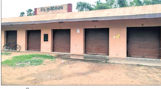
ବନ୍ଦ ହୋଇ ରହିଥିବା ଦୋକାନଗୃହ।

ରାଜ୍ୟ ସରକାରଙ୍କ ପକ୍ଷରୁ ଗ୍ରାମାଞ୍ଚଳ ଏକାଧିକ ମହିଳା, ବ୍ୟବସାୟୀ ତଥା ଭିନ୍ନଭିନ୍ନ ବ୍ୟକ୍ତିଙ୍କୁ ବ୍ୟବସାୟ ମାଧ୍ୟମରେ ଆତ୍ମନିର୍ଭରଶୀଳ କରାଇବାକୁ ବିଭିନ୍ନ ପଞ୍ଚାୟତରେ ବିକ୍ରୁ ଗ୍ରାମାଞ୍ଚଳ ବଜାର ମାନ ନିର୍ମାଣ କରାଯାଇଥିଲା। ବାସ୍ତବରେ ଏହା କେତେ ମାତ୍ରାରେ କାର୍ଯ୍ୟ କରୁଛି ସେ ସମ୍ପର୍କରେ ପ୍ରଶ୍ନାତ୍ମକ ପ୍ରଶ୍ନରେ କୌଣସି ପଦକ୍ଷେପ ନିଆଯାଇ ନ ଥିବା ଅଭିଯୋଗ ହେଉଛି। ଏପରି ବ୍ୟକ୍ତିଙ୍କୁ ଦେଖିବାକୁ ମିଳିଛି ରଘୁନାଥପୁର ବ୍ଲକ ରେଡୁଆ ହାଟଠାରେ ଥିବା ବିକ୍ରୁ ଗ୍ରାମାଞ୍ଚଳ ବଜାର କ୍ଷେତ୍ରରେ। ଯାହାକି ଏବେ ଭୂତକୋଠି ପାଲଟିଛି। ୧୩ ବର୍ଷ ତଳେ ବିକ୍ରୁ ଗ୍ରାମାଞ୍ଚଳ ବଜାରକୁ ପୂର୍ଣ୍ଣମାତ୍ରା ନିର୍ବାନ ପଞ୍ଚନାୟକ ଉଦ୍‌ଘାଟନ କରିଥିଲେ। ତେବେ ଅଦ୍ୟାବଧି ହାଟ ପାର୍ଶ୍ୱରେ ଥିବା ଗ୍ରାମାଞ୍ଚଳ ବଜାର ଲୋକଙ୍କ ସେବାରେ ଲାଗୁନି। ଏବେ ୧୦ ବର୍ଷର ବାରଣ୍ଡା ମଦ୍ୟପକ୍ଷ ଆହ୍ଲାସ୍ତଳ ପାଲଟିଛି। ଏହାଛଡା ଉଚ୍ଚ ପରିସର ମାଛ ଓ ଚିକେନ ବିକାଳିକ କର୍ତ୍ତାରେ ରହିଥିବା ଅଭିଯୋଗ ହେଉଛି।