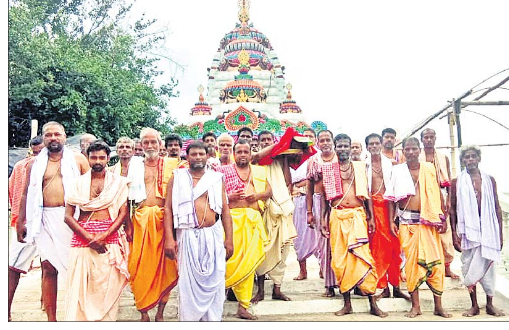
ଶ୍ରୀଜୀଉଙ୍କ ସୁସ୍ଥ ହେବା ଖବର ଦେବାପାଇଁ ସେବାୟତମାନେ ରାଜପ୍ରାସାଦକୁ ଯାଉଛନ୍ତି।

ଜଗତ୍ସିଂହପୁର ଜିଲା ପ୍ରଶାସନ ତରଫରୁ ଭୁଲାଭ, ଅଗଷ୍ଟ ଓ ସେପ୍ଟେମ୍ବର ମାସରେ ଯୁକ୍ତ ଜନ ଅଭିଯୋଗ ଶୁଣାଣି ଶିବିର କରାଯିବ ବୋଲି ଘୋଷଣା କରାଯାଇଛି। ଏହି ଶିବିର ଜିଲାର ବିଭିନ୍ନ ବ୍ଲକ ସମେତ ଜିଲାପାଳଙ୍କ କାର୍ଯ୍ୟାଳୟରେ ଅନୁଷ୍ଠିତ ହେବ। ଜୁଲାଇ ୧ରେ ଏରସନା ବ୍ଲକ କାର୍ଯ୍ୟାଳୟ, ୮ରେ କୁଜଙ୍ଗ, ୧୫ରେ ଜିଲାପାଳଙ୍କ କାର୍ଯ୍ୟାଳୟ, ୨୨ରେ ବିରିଡ଼ି ଓ ୨୯ ତାରିଖରେ ତିର୍ତ୍ତୋଲ ବ୍ଲକ କାର୍ଯ୍ୟାଳୟରେ ଶୁଣାଣି କରାଯିବାରୁ ଘୋଷଣା କରାଯିବ। ସେହିପରି ଅଗଷ୍ଟ ମାସ ୫ରେ ରଘୁନାଥପୁର, ୧୩ରେ ବାଲିକୁଦା, ୧୯ରେ ଜିଲାପାଳଙ୍କ କାର୍ଯ୍ୟାଳୟ ପ୍ରକୋଷ୍ଠ ଓ ୨୬ରେ ନାଉରୀ ବ୍ଲକ କାର୍ଯ୍ୟାଳୟରେ ଶୁଣାଣି କରାଯିବ। ସେପ୍ଟେମ୍ବର ମାସ ୧୦ ତାରିଖରେ ଏରସନା, ୧୬ରେ କୁଜଙ୍ଗ, ୨୩ରେ ଜିଲାପାଳଙ୍କ କାର୍ଯ୍ୟାଳୟ ଓ ୩୦ ତାରିଖରେ ବିରିଡ଼ି ବ୍ଲକ କାର୍ଯ୍ୟାଳୟରେ ଶୁଣାଣି ହେବ। ଏହିସବୁ ଶିବିରକୁଳିକରେ ଜିଲାପାଳଙ୍କ ସମେତ ଏସ୍ପି, ଅତିରିକ୍ତ ଜିଲାପାଳ, ଡିଆରଡିଏ କୁଳକ୍ଷ୍ମ ନିର୍ଦ୍ଦେଶକ, ଉପ ଜିଲାପାଳ, ଜିଲାପ୍ରତ୍ୟାୟ ଓ ବ୍ଲକପ୍ରତ୍ୟାୟ ଅଧିକାରୀ ଉପସ୍ଥିତ ରହିବେ ବୋଲି ଜିଲା ପ୍ରତ୍ୟାୟ ଓ ଲୋକ ସମ୍ପର୍କ ଅଧିକାରୀଙ୍କ କାର୍ଯ୍ୟାଳୟରେ ଶୁଣାଣି କରାଯାଇଛି। ତେବେ ଶୁଣାଣିକୁଳିକରେ ଅଧିକ ସଂଖ୍ୟକ ଜନସାଧାରଣ ଯୋଗଦେବା ପାଇଁ ଜିଲା ପ୍ରଶାସନ ପକ୍ଷରୁ ସୂଚନା ଦିଆଯାଇଛି।