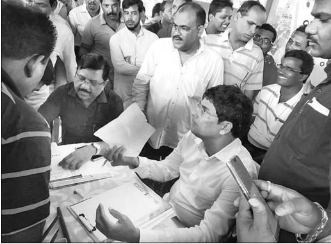
ଜଣେ ବ୍ୟକ୍ତିଙ୍କ ଅଭିଯୋଗ ଶୁଣୁଛନ୍ତି ମନ୍ତ୍ରୀ।