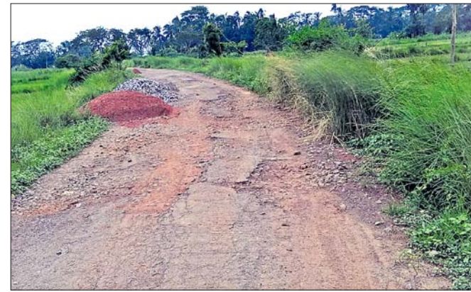
ବିପର୍ଯ୍ୟୟ ରାସ୍ତା ପାର୍ଶ୍ୱରେ ଗଦା ହୋଇଥିବା ମୋରମ ଓ ମେଟାଲ।

ନାଉରୀ ବ୍ଲକର ବିଭିନ୍ନ ଗ୍ରାମକୁ ସଂଯୋଗ କରୁଥିବା ଗ୍ରାମ୍ୟ ଉନ୍ନୟନ ବିଭାଗ ରାସ୍ତା ମରାମତି ଅଭାବକୁ ବିପର୍ଯ୍ୟୟ ହୋଇପଡ଼ିଛି। ଅଗ୍ରାଧିକାରୀଙ୍କ ଯେ, ଗାଡ଼ି ଚଳାଚଳ ତ ଦୂର କଥା ତାଲିକା ଯିବା ମଧ୍ୟ କଷ୍ଟକର। ରାସ୍ତା ମରାମତି ପାଇଁ ଠିକାଦାର ବନ୍ଦନ କରାଯାଇଛି। ଠିକାଦାର ବାଲି, ଗୋଡ଼ି ଆଦି ରାସ୍ତା ପାର୍ଶ୍ୱରେ ଗଦା କରିଛନ୍ତି। କେତେକ ଗ୍ରାମରେ ରାସ୍ତା ପାର୍ଶ୍ୱ ଖୋଳାଯାଇଛି। କିନ୍ତୁ ଆଉ ଠିକାଦାରଙ୍କ ଦେଖା ମିଳୁନାହିଁ କି ରାସ୍ତା ମରାମତି ହେଉନାହିଁ। ଫଳରେ ଜନସାଧାରଣ ବହୁ ଅସୁବିଧାର ସମ୍ମୁଖୀନ ହେଉଛନ୍ତି। ସେପଟେ ବିଭାଗ ପକ୍ଷରୁ ମଧ୍ୟ କୌଣସି ପଦକ୍ଷେପ ଗ୍ରହଣ କରାଯାଉନାହିଁ। ନାଉରୀ-ଡାବର ୮ କି.ମି. ରାସ୍ତା ୨୦୦୨-୦୩ରେ ଗ୍ରାମ୍ୟ ଉନ୍ନୟନ ବିଭାଗ ପକ୍ଷରୁ ପ୍ରଧାନମନ୍ତ୍ରୀ ଗ୍ରାମ୍ୟ ସଡ଼କ ଯୋଜନାରେ ନିର୍ମାଣ ହୋଇଥିଲା। ଏହା ପରେ ଆଉ ଉଚ୍ଚ ରାସ୍ତା ମରାମତି ହୋଇନାହିଁ। ତୁରନ୍ତ ନଳକୂପ ମରାମତି କରିବାକୁ ଥିବା ନଳକୂପ ସମେତ ୪ଟି ନଳକୂପରୁ