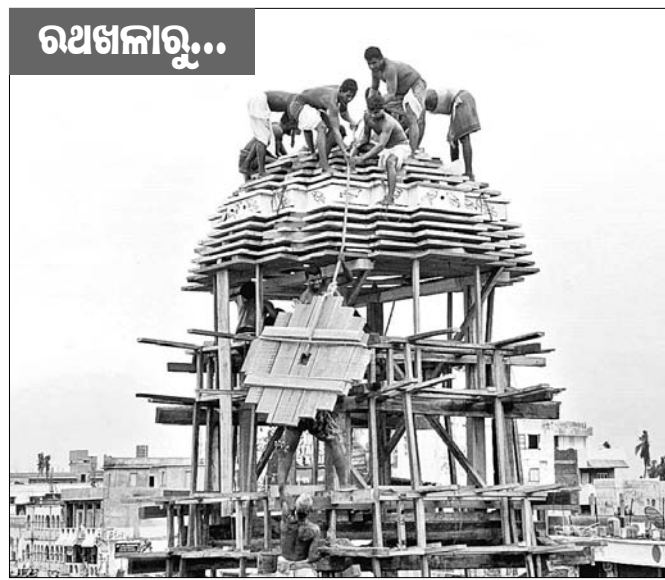
ରଥ ଉପରକୁ ପୋଟଳ ଉଠାଯାଉଛି। ବାଡ଼ିଆ ଆରମ୍ଭ ହୋଇଛି। ତିନିରଥର ସରିଛି। କଳସ ନିର୍ମାଣ ଚାଲିଛି। ୨ଟି ଲେଖାଏଁ ଦୁଆର ବେଢ଼ା ନିର୍ମାଣ ଚାଳୁଥିବ ରଥ ରୂପକାର

ମାଦିନ ପରେ ମହାପ୍ରଭୁଙ୍କ ବିଶ୍ୱପ୍ରସିଦ୍ଧ ଘୋଷପାତ୍ର। ଚତୁର୍ଦ୍ଧାଦିଗ୍ରହଙ୍କ ଏହି ନବଦିନାତ୍ମକ ଯାତ୍ରା ଲାଗି ପ୍ରସ୍ତୁତ ଶେଷ ପର୍ଯ୍ୟାୟରେ ପହଞ୍ଚିଛି। ଶ୍ରୀନାଥର ସମ୍ମୁଖ ରଥଖଳାରେ କୋରସୋରରେ ଚାଲିଛି ରଥଯାତ୍ରା। ତିନି ରଥ ପୁଖ୍ୟ ବିଶ୍ୱକର୍ମାଙ୍କ ତତ୍ତ୍ୱବଧାନରେ ମହାରଣା, ରୂପକାର, ଭୋଜ, କମାର, ଚିତ୍ରକାର ସେବକ ମାନେ ନିଜ ନିଜ କାମରେ ଲାଗି ପଡ଼ିଛନ୍ତି। ରବିବାର ସୁକ୍ଷ୍ମ ତିନିରଥ ଉପରକୁ ୧୩ ପରସ୍ତ ପୋଟଳ, ପାରାଭାଡ଼ି ଓ ଖପୁରି ଉଠିଛି। ତଳୁ ଓ ପରସ୍ତ ଓ ଉପରୁ ଓ ପରସ୍ତ ପୋଟଳ ମଝିରେ ପାରାଭାଡ଼ି ରହିଛି। ଖପୁରିରେ କଳସ ଡାଳିଆ ବସାଯାଇଛି। ତିନିରଥର ଜଗତପୁଷ୍ପ ଶ୍ରେଣୀ ଉଠିଛି। ଅନ୍ୟପଟେ ରଥରେ ତାର ବାଡ଼ିଆ ସରିବା ପରେ ରବିବାରଠାରୁ ପରା