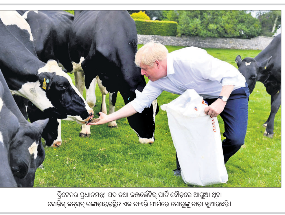
ବ୍ରିଟିଶର ପ୍ରଧାନମନ୍ତ୍ରୀ ପଦ ତଥା ଜଣକର୍ତ୍ତବ୍ୟ ପାଇଁ ଦୌଡ଼ରେ ଆସୁଥିବା ଥିବା ବୋରିସ୍ ଜନ୍‌ସନ୍ ଲକ୍ଷାଣମୟରୁ ଏକ ଡାଏରି ଫାର୍ମରେ ଗୋରୁଙ୍କୁ ଚାବା ଖୁଆଉଛନ୍ତି ।

୧୯୩୮ ଜୁଲାଇ ୧ ତାରିଖରେ ଭାରତର ଖ୍ୟାତନାମା ବଂଶବାଦକ ପଣ୍ଡିତ ହରିପ୍ରସାଦ ଚୌରାସିଆ ଆଲ୍ଲାହାବାଦରେ ଜନ୍ମଗ୍ରହଣ କରିଥିଲେ । ସଙ୍ଗୀତ ସାଧକ ପରିବାରରେ ଜନ୍ମ ହୋଇ ନ ଥିଲେ ମଧ୍ୟ ସେ ନିଜର ଅଧିବସାୟ ବଳରେ ଅନ୍ତର୍ଜାତୀୟ ସ୍ତରରେ ଖ୍ୟାତି ଅର୍ଜନ କରିପାରିଥିଲେ । ୧୫ ବର୍ଷ ବୟସରେ ପଣ୍ଡିତ ରାଜାରାମକଠାଠାରୁ ସ୍ୱର ସଙ୍ଗୀତ ଶିକ୍ଷା ଆରମ୍ଭ କରି ପରେ ବଂଶବାଦକ ତାଲିମ ନେଇଥିଲେ ।