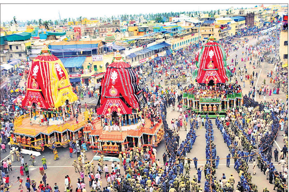
ରଥଖଳାରୁ ଶ୍ରୀମନ୍ଦିର ସିଂହସ୍ୱାର ସମ୍ପୂର୍ଣ୍ଣ ଅଣାଯାଇଥିବା ତିନିରଥ।

ସିଂହସ୍ୱାରରେ ତିନିରଥ। ଭକ୍ତମୟ ହୋଇପଡ଼ିଛି ଶ୍ରୀକ୍ଷେତ୍ର। ରଥ, ପଥ, ଭକ୍ତ ସଭିଏଁ ପ୍ରସ୍ତୁତ। ଅପେକ୍ଷା କେବଳ କେତେବେଳେ ଶ୍ରୀମନ୍ଦିରରୁ ବଡ଼ଦାଣ୍ଡକୁ ଓହ୍ଲାଇ ଆସିବେ ଦାରୁଦିଆଁ ଜାତି, ଧନ, ବର୍ଣ୍ଣ ନିର୍ବିଶେଷରେ ସମସ୍ତେ ପାଇବେ ମହାପ୍ରଭୁଙ୍କ ଦୁର୍ଲଭ ଦର୍ଶନ। ଦାରୁଦିଆଁଙ୍କ ଘର୍ଷଣରେ ରଥ, ପଥ ହେବ ବ୍ରହ୍ମମୟ। ସଭିଏଁ ହେବେ ଏକାକାର। ଆଉ ରଥାପୁତ୍ରେ ହୋଇ ଜନ୍ମଦେଦି ଯିବେ ଚତୁର୍ଦ୍ଧାବିଗ୍ରହ। ରୁରୁବାର ଆଷାଢ଼ ଶୁକ୍ଳ ଦ୍ୱିତୀୟାରେ ରଥାପୁତ୍ରେ ହୋଇ ଦାରୁଦିଆଁ ଯିବେ ଗୁଣ୍ଡିଚା ମନ୍ଦିର। ଅଣସର ପରେ ନବଯୌବନ ଦର୍ଶନ ଦେଇ ନବଦିନାମ୍ବର ଯାତ୍ରାରେ ଯିବା ଲାଗି ପ୍ରସ୍ତୁତ ହେଉଛନ୍ତି ମହାବାହୁ। ଏଥିପାଇଁ ଶେଷ ହୋଇଛି ସମସ୍ତ ପ୍ରସ୍ତୁତି। ରୁଧିର ସକାଳ ୭ଟା ୩୫ରେ ମଙ୍ଗଳ ଆକାଶ ପରେ ଅନ୍ୟାନ୍ୟ ନାତି ହୋଇଥିଲା। ରଥଖଳାରୁ ତିନିରଥକୁ ସିଂହସ୍ୱାର ଆଣିବା ପାଇଁ ପୂର୍ବାହ୍ନ ସାଢ଼େ ୧୧ଟାରେ ମହାପ୍ରଭୁଙ୍କ ଆଜ୍ଞାମାଳ ବିଜେ