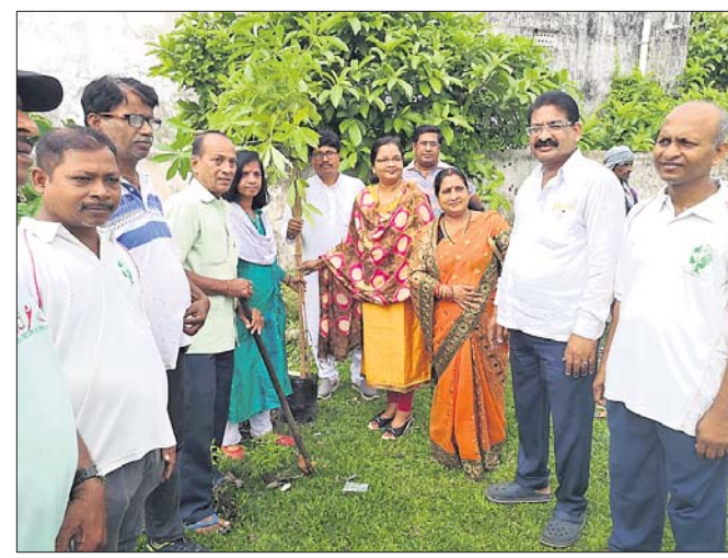
ସିଟି ହାଲ୍‌ସ୍‌କୁ ଖେଳ ପଡ଼ିଆରେ ଚାରାରୋପଣ କରାଯାଇଛି।