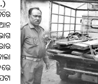
କବଚ କାଠପଟା ସହ ଅଟୋ