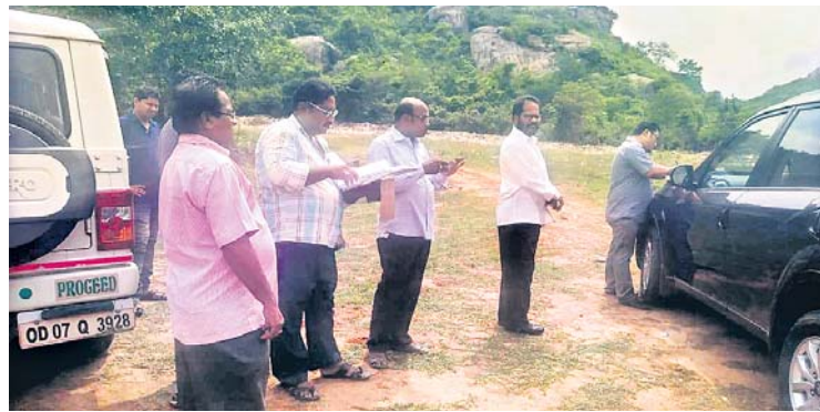
ରାଜସ୍ୱ କମିଶନର କ୍ଷେତ୍ର ପରିଦର୍ଶନ କରୁଛନ୍ତି।

ଆସିକା ବାଲିପଦର ପୁଷ୍ପ ରାସ୍ତାର ବାବନପୁର ସଂକଳ୍ପ ଗତଗତିଆ ପାହାଚ ପାଦ ଦେଶରେ ଆସିକା ଏନ୍‌ଏ ପଥରୁ ବର୍ତ୍ତମାନ ପରିଚାଳନା ପ୍ରକଳ୍ପ ନିର୍ମାଣ ଲାଗି ସ୍ଥାନ ଚିହ୍ନି ହୋଇଛି। କୁଧିବାର ମଧ୍ୟାହ୍ନରେ ଦକ୍ଷିଣାଞ୍ଚଳ ରାଜସ୍ୱ କମିଶନର ଚେନକନ୍ଦ୍ର ଖପଟା ଉଚ୍ଚ କ୍ଷେତ୍ର ପରିଦର୍ଶନ କରିବା ସହ ପ୍ରକଳ୍ପ କାର୍ଯ୍ୟ ସମ୍ପର୍କରେ ଅନୁଧ୍ୟାନ କରି ଯେଉଁଠି ଆସିକା ଏନ୍‌ଏ ପଥରୁ ବର୍ତ୍ତମାନ ୩.୫ ଏକର ଜମିରେ ସହରର ଆବର୍ଜନା ଜମା କରାଯାଉଥିବା ବେଳେ ନୂତନ ପ୍ରକଳ୍ପ ଲାଗି ୫ ଏକର ଜମିର ଆବଶ୍ୟକତା ଥିବା ଏନ୍‌ଏ ପଥରୁ କମିଶନରଙ୍କ ଦୃଷ୍ଟି ଆକର୍ଷଣ କରାଯାଇଥିଲା। କମିଶନର ଖପଟା ଏହି ଜମି ସମ୍ପର୍କରେ ଘଟଣାସ୍ଥଳରେ ଉପସ୍ଥିତ ଆସିକା ତହସିଲଦାରଙ୍କୁ ପଚାରି ବୁଝିବା ସହ ବୁଝିତ ଉଚ୍ଚ ଜମି ଏନ୍‌ଏପିକୁ ହସ୍ତାନ୍ତର ଲାଗି ଆବଶ୍ୟକୀୟ ପଦକ୍ଷେପ ନେବାକୁ ନିର୍ଦ୍ଦେଶ