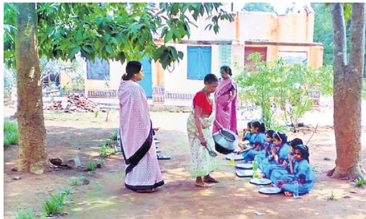
ଗଛତଳେ ଛାତ୍ରାଛାତ୍ରୀଙ୍କୁ ମଧ୍ୟାହ୍ନ ଭୋଜନ ଖାଇବାକୁ ଦିଆଯାଇଛି।

ସମସ୍ତଙ୍କ ପାଖରେ ଶିକ୍ଷା ପହଞ୍ଚାଇବା ପାଇଁ ସରକାର ବହୁ ଯୋଜନା କରୁଛନ୍ତି। ସରକାରୀ ବିଦ୍ୟାଳୟ ପ୍ରତି ଛାତ୍ରାଛାତ୍ରୀଙ୍କୁ ଆକୃଷ୍ଟ କରିବା ପାଇଁ ମାଗଣାରେ ଶିକ୍ଷା ସହ ପାଠ୍ୟ ଉପକରଣ, ସାଇକେଲ ପ୍ରଦାନ, ପୋଷାକ, ମଧ୍ୟାହ୍ନଭୋଜନ ଆଦି ବିଭିନ୍ନ ଯୋଜନା କରି ବହୁ ଅର୍ଥ ମଧ୍ୟ ଏବାବଦରେ ବ୍ୟୟ କରୁଛନ୍ତି। ମାତ୍ର ଶିକ୍ଷୟିତ୍ରୀ ଶିକ୍ଷକଙ୍କ ଖାମୁଖୁଆଁଳି ନାତି ହେଉ କିମ୍ବା ସରକାରୀ ଉଦ୍ୟୋଗରୁ ଏବେବି ବହୁ ବିଦ୍ୟାଳୟରେ ବିଭିନ୍ନ ସମସ୍ୟା ଲାଗି ରହିଛି। କେଉଁଠି ଶ୍ରେଣୀଗୃହ ଅଭାବ ତ ଆଉକେଉଁଠି ଶିକ୍ଷକ ଅଭାବକୁ ଶିକ୍ଷାଦାନ ବାଧାପ୍ରାପ୍ତ ହେଉଛି। ବିଭିନ୍ନ ସ୍ଥାନରେ ଛାତ୍ରାଛାତ୍ରୀଙ୍କ ସୁରକ୍ଷାକୁ