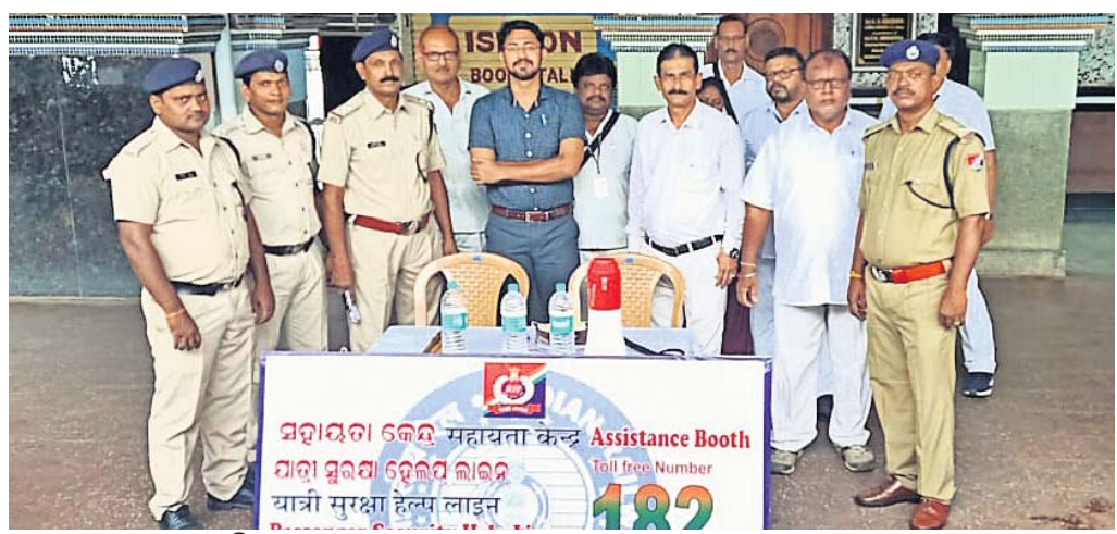
ବ୍ରହ୍ମପୁର ଷ୍ଟେଶନ୍‌ରେ ରେଳ ବିଭାଗର ସହାୟତା କେନ୍ଦ୍ର।

ରଥଯାତ୍ରା ପାଇଁ ରେଳ ବିଭାଗ ପକ୍ଷରୁ ବ୍ୟାପକ ବ୍ୟବସ୍ଥା କରାଯାଇଛି। ପୁରୀକୁ ଯାତ୍ରାରେ କରୁଥିବା ଟ୍ରେନ୍ ସଂଖ୍ୟା ବଢ଼ାଯାଇଛି।