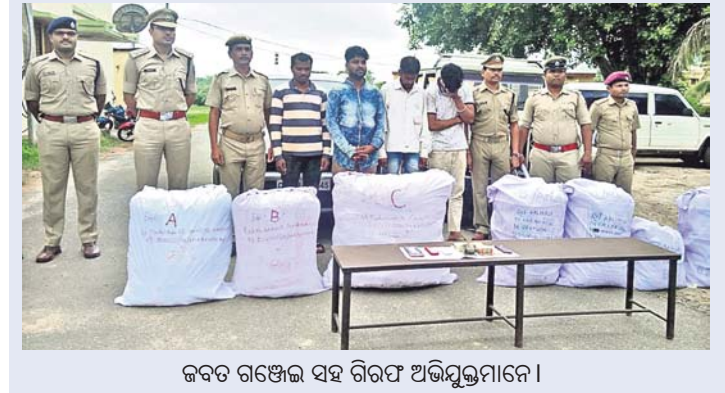
ଜବତ ଗଞ୍ଜେଇ ସହ ଗିରଫ ଅଭିଯୁକ୍ତମାନେ।