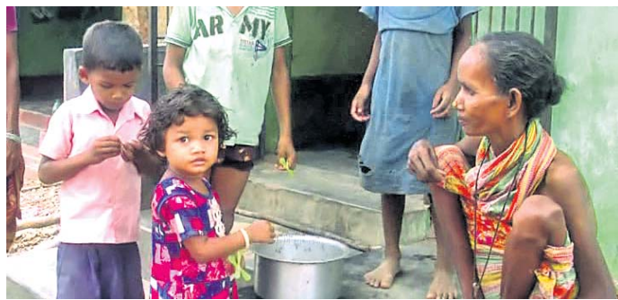
କାଲ ସଂଗ୍ରହ କରି ରଖାଯାଇଛି ।