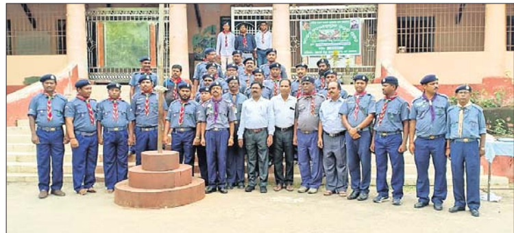
କାର୍ଯ୍ୟକ୍ରମରେ ଉପସ୍ଥିତ ଅତିଥିମାନେ ।

ପାରଳାଖେମୁଣ୍ଡି ସ୍ଥିତ ମହାରାଜାଙ୍କ ବାଳକ ଉଚ୍ଚ ବିଦ୍ୟାଳୟରେ ଜିଲ୍ଲା ଶିକ୍ଷାଧିକାରୀ ପ୍ରଫୁଲ୍ଲ କୁମାର ନାଗଙ୍କ ଚତୁର୍ଥଧାନରେ ଚାଲିଥିବା ଅଣତାଲିମ ପ୍ରାପ୍ତ ଝାଡ଼ଚ ଶିକ୍ଷକଙ୍କ ପ୍ରଶିକ୍ଷଣ ଶିବିରର ଉଦ୍‌ଘାଟିତ ହୋଇଯାଇଛି । କାର୍ଯ୍ୟକ୍ରମରେ ଜିଲ୍ଲା ଶିକ୍ଷାଧିକାରୀ ନାଗ ଉପସ୍ଥିତ ସପ୍ତାହେ ବ୍ୟାପୀ ପ୍ରଶିକ୍ଷଣ ନେଇଥିବା ଜିଲ୍ଲାର ବିଭିନ୍ନ ଉଚ୍ଚ ବିଦ୍ୟାଳୟର ୪୧ଜଣ ଝାଡ଼ଚ ଶିକ୍ଷକଙ୍କୁ ସେବାରେ ନିୟୋଜିତ ପାଇଁ ଶପଥ ପାଠ କରାଇଥିଲେ । ଏହି ଶିବିରରେ ରାଜ୍ୟସ୍ତରରୁ ପ୍ରଶିକ୍ଷକଭାବେ ଶିବ ପ୍ରସାଦ ପାଠୀ ଏବଂ ବିଜୁ ମହାରଣା ଯୋଗଦେଇଥିଲେ । ରାଜ୍ୟସ୍ତରରେ