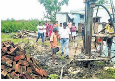
ଅନୁକୂଳିଆ ସାହିରେ ବୋରଫ୍ରେଲ ଖୋଳାଯାଉଛି।

ମାଲକାନଗିରି ଜିଲା ମାଥୁଳି ବ୍ଲକ୍ ସଦର ମହକୁମା ଅନୁକୂଳିଆ ସାହିରେ ଦୀର୍ଘ ୨୦ ବର୍ଷ ପରେ ମଳକବାର ବୋରଫ୍ରେଲ ଖନନ କରାଯାଇଛି।