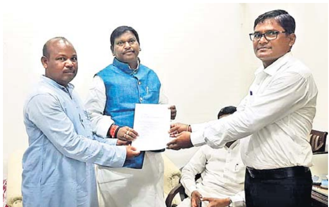
ବିଧାୟକ ମକରନ୍ଦ ପୁରୁଲି କେନ୍ଦ୍ର ଆଦିବାସୀ କଲ୍ୟାଣ ମନ୍ତ୍ରୀ ଅର୍ଜୁନ ମୁଖାଙ୍କୁ ଦାଦିପତ୍ର ଦେଉଛନ୍ତି ।