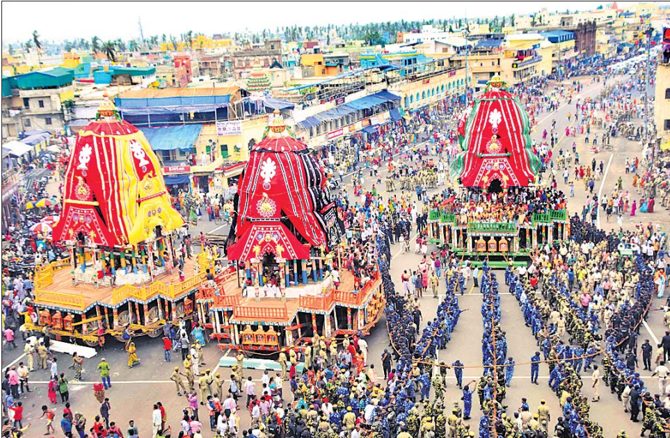
ରଥଖଳାରୁ ଶ୍ରୀମନ୍ଦିର ସିଂହସ୍ୱାର ସମ୍ପୂର୍ଣ୍ଣକୁ ଅଣାଯାଇଥିବା ତିନିରଥ।

ଗୁରୁବାର ଆଷାଢ଼ ଶୁକ୍ଳ ଦ୍ୱିତୀୟାରେ ରଥାଉଁଡ଼ ହୋଇ ଦାରୁଦିଆଁ ଯିବେ ଗୁଣ୍ଡିଚା ମନ୍ଦିର। ଅଣସର ପରେ ନବଯୌବନ ଦର୍ଶନ ଦେଇ ନବଦିନାମ୍ଭୂକ ଯାତ୍ରାରେ ଯିବା ଲାଗି ପ୍ରସ୍ତୁତ ହେଉଛନ୍ତି ମହାବାହୁ। ଏଥିପାଇଁ ଶେଷ ହୋଇଛି ସମସ୍ତ ପ୍ରସ୍ତୁତି। ରୁଧିରୀର ସକାଳ ୭ଟା ୩୫ରେ ମଙ୍ଗଳ ଆକାଶ ପରେ ଅନ୍ୟାନ୍ୟ ନାତି ହୋଇଥିଲା। ରଥଖଳାରୁ ତିନିରଥକୁ ସିଂହସ୍ୱାର ଆଣିବା ପାଇଁ ପୂର୍ବଦ୍ୱାରା ଯାତ୍ରେ ୧୧ଟାରେ ମହାପ୍ରଭୁଙ୍କ ଆଜ୍ଞାମାଳ ବିଜେ