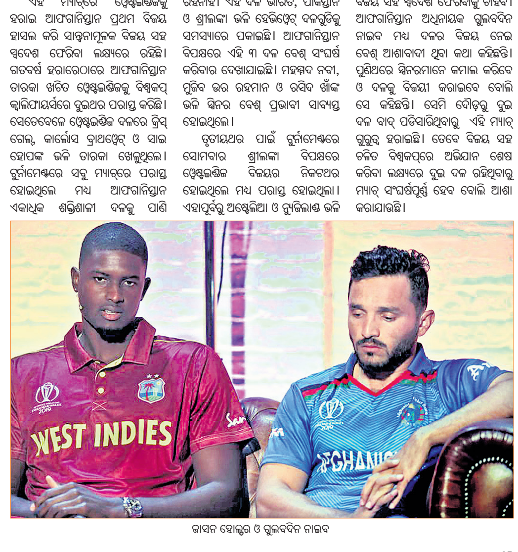
ଜାସନ ହୋଲ୍ସ ଓ ଗୁଲବଦିନ ନାଜଦ

ଦଳ ବିପକ୍ଷରେ ମଧ୍ୟ ଫ୍ରେସ୍‌ଇଣ୍ଡିଜ ଅଳ୍ପକେ ବିଜୟ ହାତରେ କରିଥିଲା। ୟୁଜିଏସ୍ ବିପକ୍ଷରେ କାର୍ଲୋସ ବ୍ରାଥଫ୍ରେଟ୍ ଧୂଆଁଧାର ବ୍ୟାଟିଂ କରି ଶତକ ହାସଲ କରିବା ପାଇଁ ବିଜୟପୂର୍ବକ ଛକା ମାରିବାକୁ ଯାଇ ବାଉଣ୍ଡରିରେ ଧରା ପଡ଼ିଥିଲେ। ବିଜୟର ନିକଟର ହୋଇ କେତେଟି ମ୍ୟାଚ୍‌ରେ ଆମେ ପରାସ୍ତ ହୋଇଛୁ ଓ ଏହା ନୈରାଶ୍ୟକରକ ଥିଲା ବୋଲି ଫ୍ରେସ୍‌ଇଣ୍ଡିଜ ଅଧିନାୟକ ଜାସନ ହୋଲ୍ସ କହିଛନ୍ତି। ୧୯୭୫ ଓ ୧୯୭୯ରେ ବିଶ୍ୱକପ୍ ଗାଇତଳ କରିଥିବା ଫ୍ରେସ୍‌ଇଣ୍ଡିଜ ପାକିସ୍ତାନକୁ ତା'ର ପ୍ରଥମ ମ୍ୟାଚ୍‌ରେ ୭ ଉଇକେଟରେ ପରାସ୍ତ କରି ବିଜୟ ଅଭିଯାନ ଆରମ୍ଭ କରିଥିଲା। ତେବେ ଏହାପରେ ଫ୍ରେସ୍‌ଇଣ୍ଡିଜ ଗୋଟିଏ ହେଲେ ବି ମ୍ୟାଚ୍‌ରେ ବିଜୟୀ ହୋଇ ପାରିନାହିଁ। ତେଣୁ ଅନ୍ତିମ ମ୍ୟାଚ୍‌ରେ ବିଜୟୀ ହୋଇ ଫ୍ରେସ୍‌ଇଣ୍ଡିଜ ସାହୁନାମକ ବିଜୟ ସହ ସ୍ୱପ୍ନ ଫେରିବାକୁ ଚାହୁଁବ। ଆଫଗାନିସ୍ତାନ ଅଧିନାୟକ ଗୁଲବଦିନ ନାଜଦ ମଧ୍ୟ ଦଳର ବିଜୟ ନେଇ ବେଶ୍ ଆଶାବାଦୀ ଥିବା କଥା କହିଛନ୍ତି। ପୁଣିଥରେ ଷ୍ଟିନରମାନେ କମାଳ କରିବେ ଓ ଦଳକୁ ବିଜୟୀ କରାଇବେ ବୋଲି ସେ କହିଛନ୍ତି। ସେମି ଚେଟିଫୁ ବୁଲ୍ ଦଳ ବାଦ୍ ପଡ଼ିଯାଉଥିବାରୁ ଏହି ମ୍ୟାଚ୍ ରୁଚୁର ହୋଇଛି। ତେବେ ବିଜୟ ସହ ଚଳିତ ବିଶ୍ୱକପ୍‌ରେ ଅଭିଯାନ ଶେଷ କରିବା ଲକ୍ଷ୍ୟରେ ବୁଲ୍ ଦଳ ରହିଥିବାରୁ ମ୍ୟାଚ୍ ସଂପର୍କପୂର୍ଣ୍ଣ ହେବ ବୋଲି ଆଶା କରାଯାଉଛି।