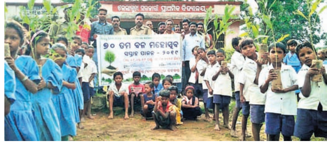
ଛାତ୍ରଛାତ୍ରୀମାନେ ତାରାରୋପଣ କରିବାକୁ ଯାଉଛନ୍ତି।