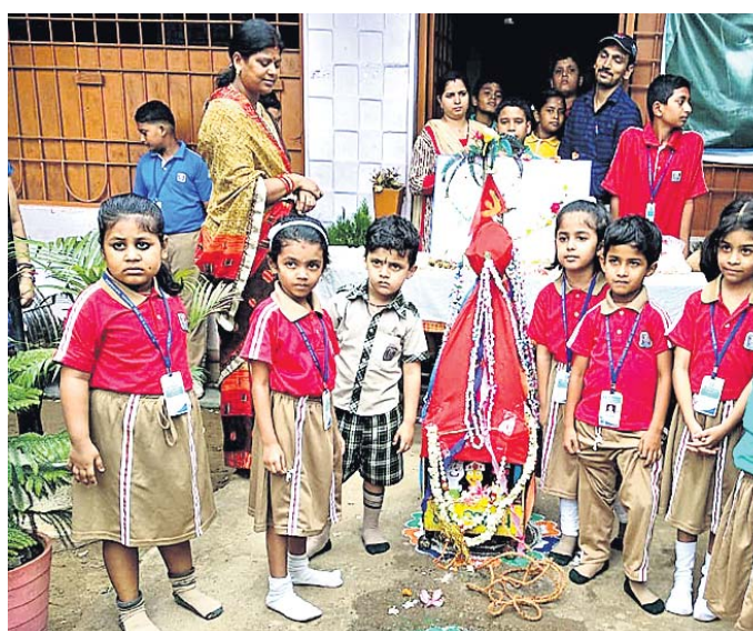
ରଥ ଚାରିବା ପାଇଁ ଛାତ୍ରାଛାତ୍ରୀମାନେ ପ୍ରସ୍ତୁତ ହେଉଛନ୍ତି ।