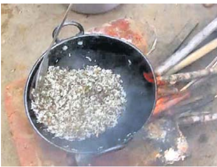
କାଲ ଚଟଣି ପ୍ରସ୍ତୁତ ହେଉଛି ।