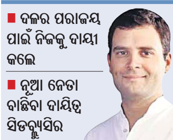
■ ଦଳର ପରାଜୟ ପାଇଁ ନିଜକୁ ଦାୟୀ କଲେ ■ ନୂଆ ନେତା ବାଛିବା ଦାୟିତ୍ୱ ସିଡିସ୍କ୍ୟୁସିର

ନୂଆଦିଲ୍ଲୀ, ୩୭(ପି.ଟି.) ରାହୁଲ ଗାନ୍ଧୀ କଂଗ୍ରେସ ଅଧକ୍ଷ ପଦରୁ ଇସ୍ତଫା ଦେଇଛନ୍ତି। ସେ ଏବେ ଦଳର ଅଧକ୍ଷ ନାହାନ୍ତି ବୋଲି ରୁଧିରୀର କ୍ଷତ୍ରିୟ କରିଦେବା ସହ କଂଗ୍ରେସ କାର୍ଯ୍ୟକାରୀ କମିଟି (ସିଡିସ୍କ୍ୟୁସି) ତୁରନ୍ତ ତାଙ୍କ ଉତ୍ତରାଧିକାରୀ ବାଛିବା ଉଚିତ ବୋଲି କହିଛନ୍ତି। ଏପରିକି ସେ ରୁଜ୍‌ଗର ଆକାଉଣ୍ଟରେ ପରିଚୟ ବଦଳାଇ ନିଜକୁ କଂଗ୍ରେସ କର୍ମୀ ଓ ଏମ୍‌ପି ବୋଲି ଉଲ୍ଲେଖ କରିଛନ୍ତି। ଖବରବାତାମାନଙ୍କୁ ରାହୁଲ କହିଛନ୍ତି, ଲୋକ ସଭା ନିର୍ବାଚନରେ ଦଳର ଖରାପ ପ୍ରଦର୍ଶନ ପାଇଁ ଦଳର ଅଧକ୍ଷ ଭାବେ ନିତିକତା ଦୃଷ୍ଟିରୁ ସେ ନିଜକୁ ଦାୟୀ କରୁଛନ୍ତି। ଏଥିପାଇଁ ସେ କଂଗ୍ରେସ ଅଧକ୍ଷ ପଦରୁ ଇସ୍ତଫା ଦେଇସାରିଛନ୍ତି। ଦଳର ଭବିଷ୍ୟତ ପାଇଁ ଉତ୍ତରଦାୟିତ୍ୱ ବହନ କରିବାର ଆବଶ୍ୟକତା ଥିଲା। ନିଜେ