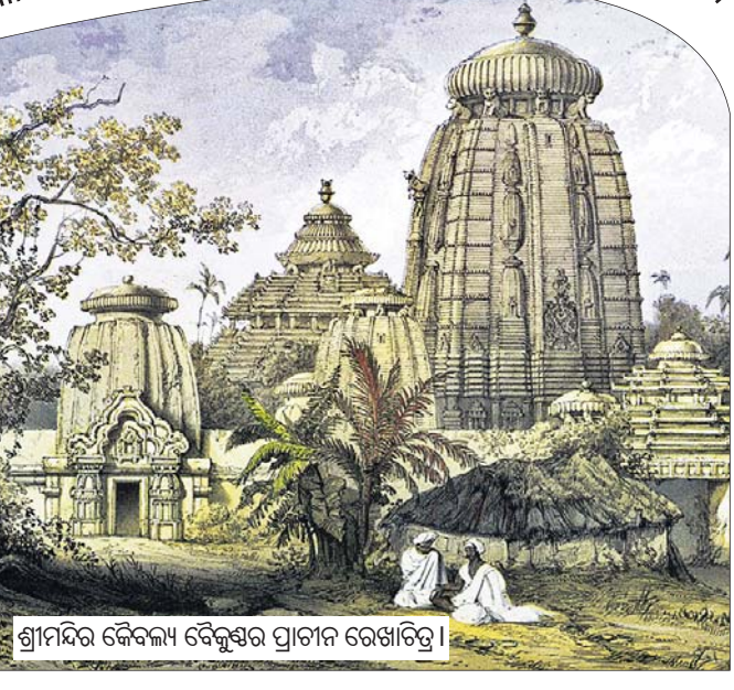
ଶ୍ରୀମନ୍ଦିର କୈବଲ୍ୟ ବୈକୁଣ୍ଠର ପ୍ରାଚୀନ ରେଖାଚିତ୍ର ।

ପରିଦୃଷ୍ଟ ହୋଇଥାଏ । ଏହା ପୂଜିତମଣ୍ଡପ ଭାବେ ପରିଚିତ । ଏହି ପୂଜିତମଣ୍ଡପକୁ ହିଁ ବ୍ରହ୍ମ ବୈକୁଣ୍ଠ କୁହାଯାଏ । ଏହାର ଅନ୍ୟନାମ ବ୍ରହ୍ମାସନ । ଶ୍ରୀମନ୍ଦିର ପ୍ରତିଷ୍ଠା କାଳରେ ମହାରାଜା ଇନ୍ଦ୍ରଭ୍ୟୁମ୍ଭଙ୍କ ଆମନ୍ତ୍ରଣ କ୍ରମେ ପ୍ରଜାପତି ବ୍ରହ୍ମା ମର୍ତ୍ତ୍ୟଲୋକକୁ ଆସି ଏହି ମଣ୍ଡପରେ ଅବସ୍ଥାନ କରିଥିଲେ । ଯେଉଁଠାରେ ପୁଣ୍ୟଲଗାଣା ସମର୍ପିତ ହେଲେ ବ୍ରହ୍ମା ଆଶୀର୍ବାଦ କରିଥାନ୍ତି । ପଶ୍ଚିମ ବୈକୁଣ୍ଠ: ଶ୍ରୀମନ୍ଦିରର ପଶ୍ଚିମରେ ପାର୍ଶ୍ୱ ଦେବତା ଭାବେ ବସିଛନ୍ତି ଶ୍ରୀଦୁର୍ଗା । ତା'ର ତଳ ଅଂଶ ନିଶାତଳ ଭାବେ ପ୍ରସିଦ୍ଧ । ଏହି ନିଶାତଳଠାରୁ ମହାଲକ୍ଷ୍ମୀ ମନ୍ଦିରର ଜଗନ୍ନାଥଙ୍କ ମଣ୍ଡପ ପର୍ଯ୍ୟନ୍ତ ଅଞ୍ଚଳକୁ ପଶ୍ଚିମ ବୈକୁଣ୍ଠ କୁହାଯାଏ । ଏହି ମଣ୍ଡପରେ ଶ୍ରୀଦେବୀ ଓ ମହାପ୍ରଭୁଙ୍କ ଚକ୍ତି ପ୍ରତିମା ଶ୍ରୀମଦନମୋହନଙ୍କ ଗୁପ୍ତଲୀଳା (ଏକାନ୍ତଲୀଳା) ହୋଇଥାଏ । ୮୦୦ ବର୍ଷ ତଳେ ଏହି ମଣ୍ଡପକୁ ଦୃଷ୍ଟିରେ ରଖି ବର୍ତ୍ତମାନର ମା'ମହାଲକ୍ଷ୍ମୀଙ୍କ ମନ୍ଦିର ତିଆରି ହୋଇଥିଲା । ପାତାଳ ବୈକୁଣ୍ଠ: ଶ୍ରୀମନ୍ଦିରର ଭଉରପାର୍ଶ୍ୱ ବେଢ଼ାରେ ଆନନ୍ଦବଜାର ପ୍ରବେଶ ପଥ ଅଞ୍ଚଳକୁ ପାତ ଅଗଣା କୁହାଯାଏ । ଏହି ପାତ ଅଗଣାର ଭଉର ପାର୍ଶ୍ୱରେ ମହାପ୍ରଭୁ ବାମନ ରୂପେ ବଳି ରାଜାଙ୍କୁ ପାତାଳ କରାଇଥିଲେ ବୋଲି ବିଶ୍ୱାସ ରହିଛି । ସେହିଠାରେ ପାତାଳକେଶର ମନ୍ଦିର ରହିଛି । ଏହାକୁ ପାତାଳ ବୈକୁଣ୍ଠ କୁହାଯାଏ । ଅମର ବୈକୁଣ୍ଠ: ଏହି ବୈକୁଣ୍ଠଟି ଶ୍ରୀମନ୍ଦିର ବାହାରେ ଚାଟିଠାଳ ମହୋଦଧି କୁଳରେ ସ୍ୱର୍ଗଦ୍ୱାର ଭାବେ ପରିଚିତ । ଏହା ପୂଜିତ ମାର୍ଗ ପୁଣି ମୋକ୍ଷର ମାର୍ଗ । ବିଶ୍ୱାସ ରହିଛି ମନୁଷ୍ୟକୁ ମୃତ୍ୟୁ ପରେ ଏହି ମହାଶୁଣାମରେ ଦାହ କରାଗଲେ ପୁନର୍ଜନ୍ମରୁ ମୁକ୍ତି ମିଳିଥାଏ ।