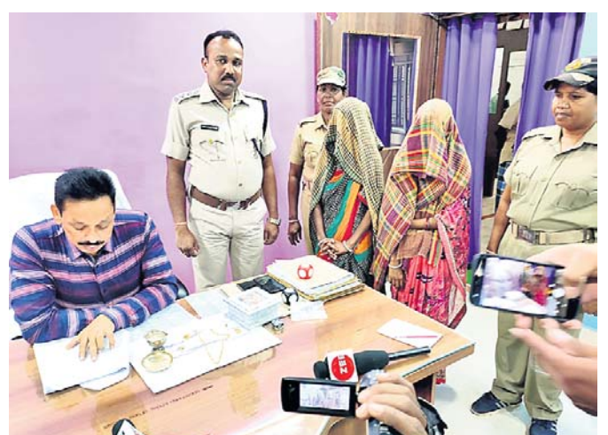
ଗିରଫ ହୁଇ ମହିଳାଙ୍କ ସହ ଜବତ ସୁନା ଏବଂ ରୁପା ଅଳଙ୍କାର ।