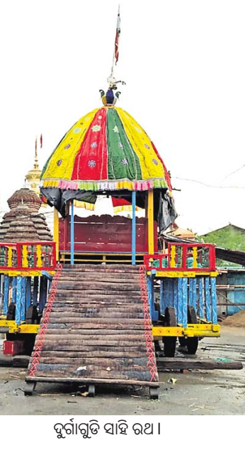
ଦୁର୍ଗାଗୃହିତ ସାହି ରଥ।