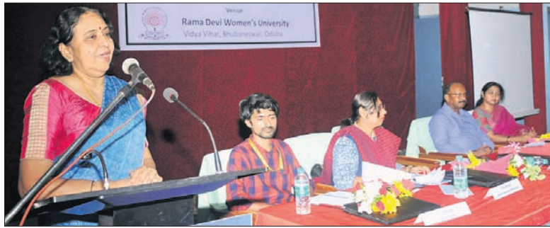
ବୈଠକରେ ଉପସ୍ଥିତ ଅଧିକାରୀ ଓ ଅନ୍ୟମାନେ ।

କେନ୍ଦ୍ର ମାନବ ସମ୍ବଳ ବିକାଶ ମନ୍ତ୍ରାଳୟର ପକ୍ଷରୁ ଶୁକ୍ରବାର ରମାଦେବୀ ମହିଳା ବିଶ୍ୱବିଦ୍ୟାଳୟରେ ନ୍ୟାଶନାଲ ଏକାଡେମିକ ଡିପୋଜିଟୋରୀ (ନାଡ଼) କାର୍ଯ୍ୟକ୍ରମର କାର୍ଯ୍ୟ ସମାପ୍ତ ହେବା ପରେ ଏକ ସମୀକ୍ଷା ବୈଠକ ଅନୁଷ୍ଠିତ ହୋଇଥିଲା।