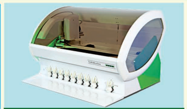
ବିଶ୍ୱପ୍ରସିଦ୍ଧ ଆଧୁନିକ ମେଶିନ୍ (EUROBlotOne) ଦ୍ୱାରା ପରୀକ୍ଷା କରାଯାଇଥାଏ

ଯେବେ ଶରୀରର ବ୍ଲୁଟ୍ ଗ୍ଲୁକୋଜ୍ ପ୍ରୋସେସ୍ କରିବାର କ୍ଷମତା ଦୁର୍ବଳ ହୋଇଯାଏ, ତାହାକୁ ସୁଗାର୍ ରୋଗ ବା ମଧୁମେହ କୁହାଯାଏ । ଅନେକ ଗବେଷଣାରୁ ଏହା ଜଣାପଡ଼ିଛି ଯଦି ଆଜିକାଲି ଖାଦ୍ୟଶାସ୍ତ୍ର ଓ ଦୁଗ୍ଧଜାତୀୟ ଉତ୍ପାଦ ଭଳି ଖାଦ୍ୟ ସୁଗାର୍ ପାଇଁ ଦାୟୀ । ଏହାର ଅର୍ଥ ହେଉଛି ଲକ୍ଷ ଲକ୍ଷ ପ୍ରି-ଡାଇବେଟିକ୍ ଲୋକ ଖାଦ୍ୟପଦାର୍ଥର ଫୁଡ୍ ଇନ୍ଟଲେରାନ୍ସକୁ ଚିହ୍ନଟ କରି ସୁଗାର୍ ରୁ ବର୍ତ୍ତିପାରିବେ । ଫୁଡ୍ ଇନ୍ଟଲେରାନ୍ସ/ଆଲର୍ଜି ପରୀକ୍ଷା (Food Intolerance/ Allergy Test) ରୁ ସେହି ଖାଦ୍ୟପଦାର୍ଥଗୁଡ଼ିକୁ ଚିହ୍ନଟ କରିବା ଅନେକ ମାତ୍ରାରେ ସମ୍ଭବ, ଯେଉଁଗୁଡ଼ିକ ସୁଗାର୍ ଓ ମଧୁମେହର ପ୍ରମୁଖ କାରଣ ହୋଇଥାଏ ।