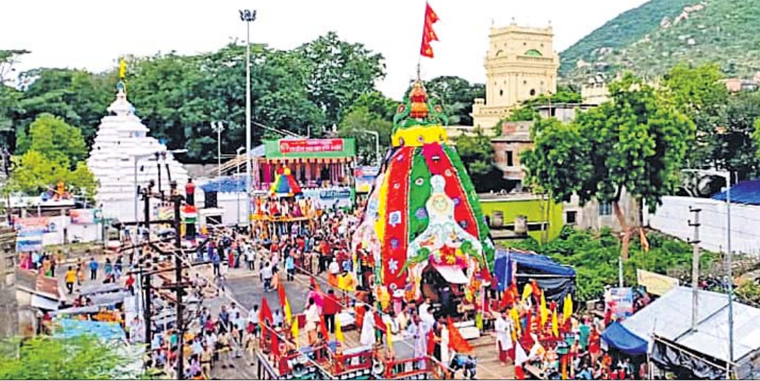
ଆଧାବାଟରେ ଅଟକି ରହିଥିବା ଶ୍ରୀଜୀଉଙ୍କ ରଥ।