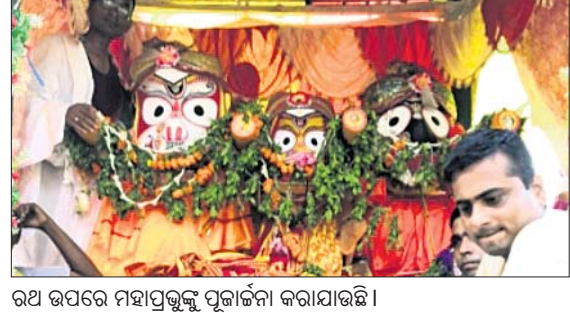
ରଥ ଉପରେ ମହାପ୍ରଭୁଙ୍କୁ ପୂଜାର୍ଚ୍ଚନା କରାଯାଇଛି।