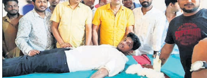
ଶିବିରରେ ଅନ୍ୟାନ୍ୟ ଗହଣରେ ଜଣେ ସୁଦଳ ରକ୍ତଦାନ କରୁଛନ୍ତି।