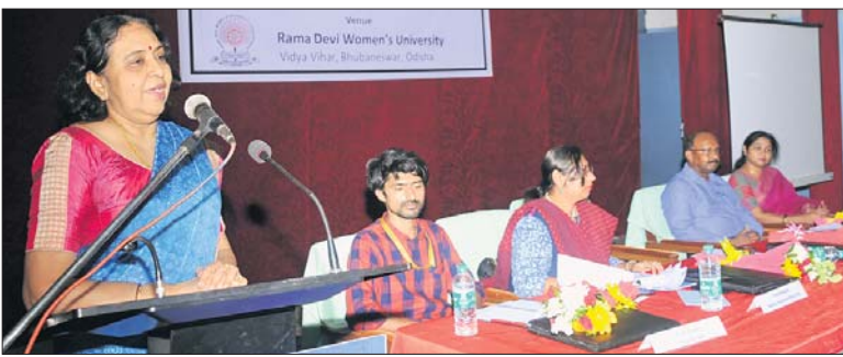
ବୈଠକରେ ଉପସ୍ଥିତ ଅଧିକାରୀ ଓ ଅନ୍ୟମାନେ।

କେନ୍ଦ୍ର ମାନବ ସମ୍ବଳ ବିକାଶ ମନ୍ତ୍ରାଳୟ ପକ୍ଷରୁ ଶୁକ୍ରବାର ରମାଦେବୀ ମହିଳା ବିଶ୍ୱବିଦ୍ୟାଳୟରେ ନ୍ୟାଶନାଲ ଏକାଡେମିକ ଡିପୋଜିଟୋରୀ (ନାଡ) କାର୍ଯ୍ୟକ୍ରମର ଚାର୍ଟର ସମାପନା ବୈଠକ ଅନୁଷ୍ଠିତ ହୋଇଯାଇଛି।