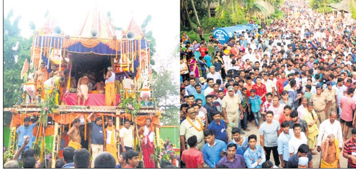
ଶ୍ରୀଜୀଉଙ୍କ ଗହଣରେ ଗୁଡ଼ବଳଦେବଜୀଉ

ବାଲେଶ୍ୱର ଜିଲ୍ଲା ରେମୁଣା ବାଲଗୋପାଳପୁର ଶିଳ୍ପାଙ୍କୁଳା ମନ୍ଦିର ମେଳାପଡ଼ିଆରେ ପ୍ରତିବର୍ଷ ଭଳି ରଥ ଉତ୍ସବର ପ୍ରଥମ ଦିନରେ ଶୁକ୍ରବାର ବିଦ୍ୟବାସୀ ହଜାର ହଜାର ଶ୍ରଦ୍ଧାଳୁଙ୍କ ଭିଡ ସାଙ୍ଗକୁ ବିଭିନ୍ନ ସାମାଜିକ, ସାଂସ୍କୃତିକ କାର୍ଯ୍ୟକ୍ରମ ତଥା ରାସଲୀଳା ଅନୁଷ୍ଠିତ ହୋଇଥିଲା। ଜମିଲା ନଗରରୁ ଗୁଞ୍ଜିତା ମନ୍ଦିରରେ ଶ୍ରୀକ୍ଷେତ୍ର ରାତିନାଟି ମୁଖ୍ୟମନ୍ତ୍ରୀ ମହାପ୍ରଭୁଙ୍କର ସମସ୍ତ ପୂଜାର୍ଚ୍ଚନା ଶେଷ ହୋଇଥିଲା। ଅପରାହ୍ନ ୩ଟାରୁ ୫ଟା ପର୍ଯ୍ୟନ୍ତ ବାଲଗୋପାଳପୁରସ୍ଥିତ ମେରିଲାନ୍ ଆବାସିକ ସେବା ସଦନର ଅନାଥ ଛାତ୍ରୀ, ମିତ୍ରପୁରସ୍ଥିତ ବାପୁଜୀ ଆବାସିକ ସେବାସଦନର ଛାତ୍ରୀଛାତ୍ରୀ ଓ ଜମିଲା ଆନୁକୂଲ୍ୟରେ ସତ୍ୟବାଇ ସେବା ସଙ୍ଗଠନ ଦ୍ୱାରା ପରିଚାଳିତ ରେମୁଣା ଅଞ୍ଚଳ ଗାଁଗୋଟି ବାଳବିକାଶ କେନ୍ଦ୍ରର ଅଧ୍ୟକ୍ଷରତ ଛାତ୍ରୀଛାତ୍ରଣୁ ଅଣାଯାଇ ମନ୍ଦିର ପ୍ରଣାସନ ପକ୍ଷରୁ ପ୍ରସାଦ ସେବା କରାଯାଇଥିଲା। ସେହିପରି ଅପରାହ୍ନ ୫ଟାରୁ ୬ଟା ପର୍ଯ୍ୟନ୍ତ ଜମିଲା କଲୋନାଲ୍ ଲେଡିଜ୍ କ୍ଲବ ପକ୍ଷରୁ ତିରାକର୍ଷକ ସାଂସ୍କୃତିକ କାର୍ଯ୍ୟକ୍ରମ, ଅପରାହ୍ନ ୬ଟା ପର୍ଯ୍ୟନ୍ତ ଜନକର୍ତ୍ତା କାର୍ତ୍ତନ ସଙ୍ଗଠନ, ହଳପାଟଣା ଓ ଜଗନ୍ନାଥ କାର୍ତ୍ତନମଣ୍ଡଳୀ, ବାଲଗୋପାଳପୁର ମଧ୍ୟରେ ହରିନାମ ସଂକାର୍ତ୍ତନ ପ୍ରତିଯୋଗିତା ଅନୁଷ୍ଠିତ ହୋଇଥିଲା। ସେହିପରି ସନ୍ଧ୍ୟା ୭ଟା ୩୦ମିନିଟ୍ ପର୍ଯ୍ୟନ୍ତ ବୃନ୍ଦାବନସ୍ଥିତ ବିଶିଷ୍ଟ କଳାକାରଙ୍କ ଦ୍ୱାରା ଶ୍ରୀକୃଷ୍ଣ ଚରିତ୍ର ଆଧାରିତ ତିରାକର୍ଷକ ରାସଲୀଳା ଶ୍ରଦ୍ଧାଳୁମାନଙ୍କ ମଧ୍ୟରେ ମୁଖ୍ୟ ଆକର୍ଷଣ ପାଲଟିଥିଲା।