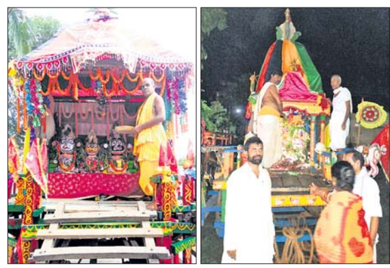
ଗଣିବେତ ଓ ବିନ୍ଦ୍ୟାଧରପୁର ଶାସନଠାରେ ରଥ ଉପରେ ଶ୍ରୀଜୀଉ