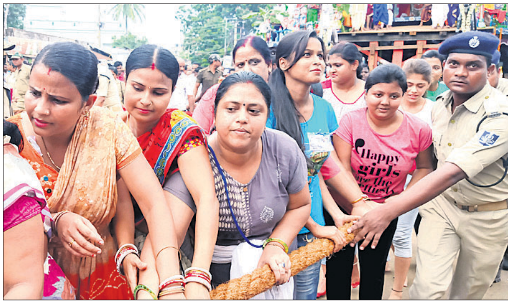
ମହିଳାମାନେ ସୁଭଦ୍ରାଙ୍କ ରଥ ଚାଣୁଛନ୍ତି।

ବିଶ୍ୱପ୍ରସିଦ୍ଧ ପୁରୀ ରଥଯାତ୍ରାର ଦିନକ ପରେ ବାରିପଦା ରଥ ଚଣାଯିବା ଏକ ନିଆରା ପରମ୍ପରା ଭାବେ ପାଳିତ ହୋଇଆସୁଛି।