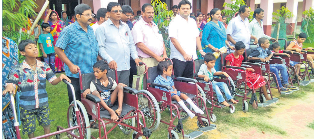
ଦିବ୍ୟାଳୟ ପିଲାଙ୍କୁ ଗ୍ରାହ୍ୟାୟକେଳ ପ୍ରଦାନ କରାଯାଇଛି।

ଜିଲ୍ଲାସ୍ତରୀୟ ବନ ମହୋତ୍ସବ, ସ୍ଥାନ: କେନ୍ଦ୍ରୀୟ ବିଦ୍ୟାଳୟ, ସମୟ: ସକାଳ ୯ଟା। ରାଜ୍ୟ ଆଦାୟ ଓ ମକଦ୍ଦମା ଫଇସଲାର ସମାଧାନ, ସ୍ଥାନ: ଭଣ୍ଡାରିପୋଖରୀ ଚହୁସିଲ ଅଫିସ ପରିସର, ସମୟ: ଅପରାହ୍ଣ ୨ଟା ୩୦।