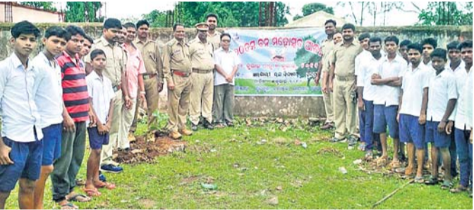
କାର୍ଯ୍ୟକ୍ରମରେ ଯୋଗ ଦେଇଥିବା ଅତିଥି, ବନ କର୍ମଚାରୀ ଓ ଛାତ୍ରମାନେ ।

ରାୟଗଡ଼ା ଜିଲ୍ଲା ଚନ୍ଦ୍ରପୁର ବ୍ଲକ୍ ର ସଦର ମହକୁମାରେ ଥିବା ସରକାରୀ ଉଚ୍ଚ ବିଦ୍ୟାଳୟ ପରିସରରେ ଚନ୍ଦ୍ରପୁର ବନ ବିଭାଗ ତରଫରୁ ଶୁକ୍ରବାର ୭୦ ତମ ବନ ମହୋତ୍ସବ ପାଳିତ ହୋଇଯାଇଛି ।