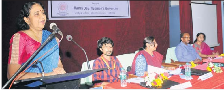
ବୈଠକରେ ଉପସ୍ଥିତ ଅଧିକାରୀ ଓ ଅଧ୍ୟକ୍ଷାମାନେ ।