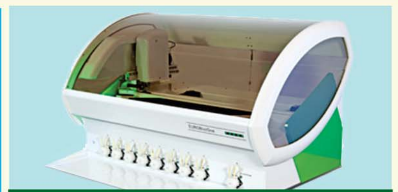
ବିଶ୍ୱପ୍ରସିଦ୍ଧ ଆଧୁନିକ ମେଶିନ୍ (EUROBlotOne) ଦ୍ୱାରା ପରୀକ୍ଷା କରାଯାଇଥାଏ

ଯେବେ ଶରୀରର ରୁଗ୍ ଗୁକୋଜ୍ ସ୍ତର ସ୍ୱାଭାବିକ ସ୍ତରରୁ ଊର୍ଦ୍ଧ୍ୱକୁ ଉଠିଯାଏ, ତାହାକୁ ସୁଗାର୍ ରୋଗ ବା ମଧୁମେହ କୁହାଯାଏ । ଅନେକ ଗବେଷଣାରୁ ଏହା ଜଣାପଡ଼ିଛି ଯଦି ଆଜିକାଲି ଖାଦ୍ୟଶସ୍ୟ ଓ ଦୁଗୁଜାତାୟ ଉତ୍ପାଦ ଭଳି ଖାଦ୍ୟ ସୁଗାର୍ ପାଇଁ ଦାୟୀ । ଏହାର ଅର୍ଥ ହେଉଛି ଲକ୍ଷ ଲକ୍ଷ ପ୍ରି-ଡାଇବେଟିକ୍ ଲୋକ ଖାଦ୍ୟପଦାର୍ଥର ଫୁଡ୍ ଇନ୍ଟଲେରାନ୍ସକୁ ଚିହ୍ନଟ କରି ସୁଗାର୍ ରୁ ବର୍ତ୍ତପାରିବେ । ଫୁଡ୍ ଇନ୍ଟଲେରାନ୍ସ/ଆଲର୍ଜି ପରୀକ୍ଷା (Food Intolerance/ Allergy Test)ରୁ ସେହି ଖାଦ୍ୟପଦାର୍ଥଗୁଡ଼ିକୁ ଚିହ୍ନଟ କରିବା ଅନେକ ମାତ୍ରାରେ ସମ୍ଭବ, ଯେଉଁଗୁଡ଼ିକୁ ସୁଗାର୍ ଓ ମଧୁମେହର ପ୍ରମୁଖ କାରଣ ହୋଇଥାଏ ।