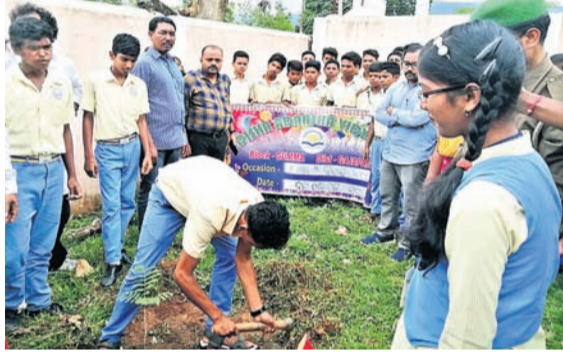
ଛାତ୍ରଛାତ୍ରୀମାନେ ଚାରାଚୋପଣ କରୁଛନ୍ତି । ଗୁମ୍ଫା, ୫୭