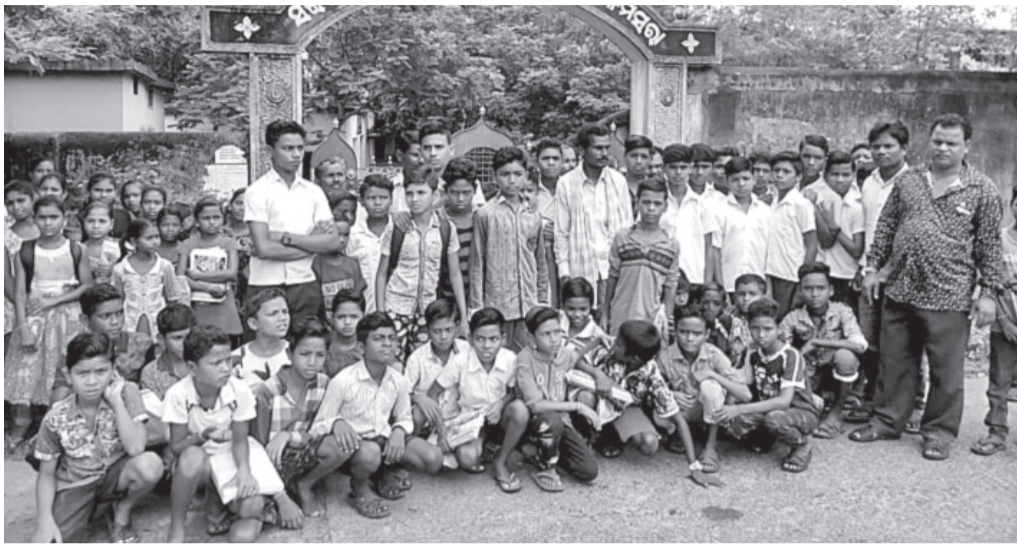
ସ୍କୁଲରେ ସମ୍ମୁଖରେ ବିକ୍ଷୋଭର ପରିଚାଳନା କରିବା ପାଇଁ ସମସ୍ତ ଛାତ୍ରଛାତ୍ରୀ ।

ସୁବର୍ଣ୍ଣପୁର ଜିଲ୍ଲା ଚରଭା ବ୍ଲକ୍ କମିସନାରୀ ନୋଡାଲ ଉଚ୍ଚ ପ୍ରାଥମିକ ବିଦ୍ୟାଳୟରେ ଛାତ୍ରଛାତ୍ରୀଙ୍କୁ ଦୀର୍ଘଦିନ ହେଲା ଯୋଷାକ ବନ୍ଧନ ହୋଇନାହିଁ ।