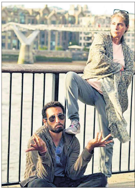
ଅନ୍ତର୍ଦ୍ଧାନ ମିତିର ଆରମ୍ଭ ହୋଇଛି...