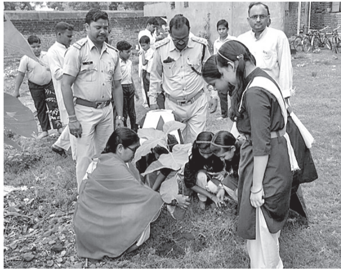
ଉଲୁଆ ସଦର ସରକାରୀ ଶିଶୁ ମନ୍ଦିରରେ ବନମହୋତ୍ସବ ଅବସରରେ ବୃକ୍ଷରୋପଣ କରାଯାଇଛି ।

ବିଷୟରେ ଉପସ୍ଥିତ ଛାତ୍ରଛାତ୍ରୀଙ୍କୁ ବୁଝାଇଥିଲେ । ସମାଜୀୟ ଅର୍ଥ ଲାଭେ ବନମହୋତ୍ସବ ପାଳିତ ହୋଇଥିଲା ।