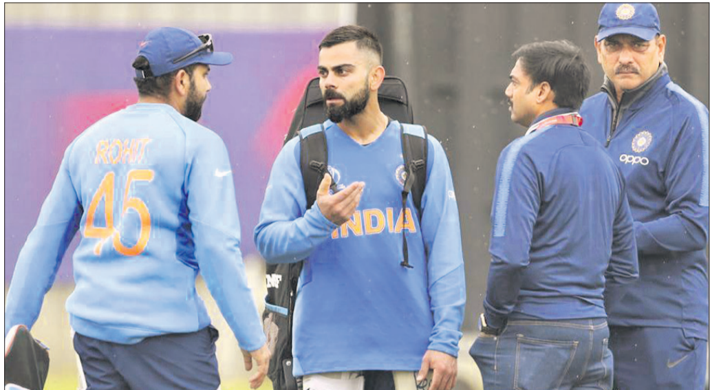
କ୍ରିକେଟ୍ ଦେବତା ଭାବେ ଅଧିକାରୀ, ଉପ ଅଧିନାୟକ, କୋଚ୍ ଓ ଚନ୍ଦ୍ରନ କମିଟି ମୁଖ୍ୟ ମଧ୍ୟରେ ମହାଶୟା ।

ଦଳିତ ଆଇସିସି ବିଶ୍ୱକପରେ ଭାରତ ବିଜୟଧାରୀ ବକାୟ ରଖିବାରେ ସମର୍ଥ ହୋଇଛି। ତେବେ ଏହା ସତ୍ତ୍ୱେ ଦଳର ମିତଳ ଅର୍ଡର ସମସ୍ୟା ତଥା ଦୁର୍ବଳତା ପଦାରେ ପଡ଼ିଛି। ସେମିଫାଇନାଲ ପ୍ରବେଶ କରିଥିବା ଭାରତ ଗ୍ଲାନାୟ ହେଟିଙ୍ଗ ଗ୍ରାହକରେ ଶନିବାର ତା'ର ଅଭିମାନ ଲିଡ଼ ମ୍ୟାଚ୍ରେ ଶ୍ରୀଲଙ୍କାକୁ ଭେଟିବ। ତେଣୁ ହାଇଲେଭେଲ୍ ସେମିଫାଇନାଲ ଖେଳିବା ପୂର୍ବରୁ ଭାରତ ଏହି ସମସ୍ୟାର ସମାଧାନ କରିବାକୁ ପ୍ରୟାସ କରିବ। ଅଭିଜ୍ଞ ମହେନ୍ଦ୍ର ସିଂ ଧୋନୀ ଏହି ମ୍ୟାଚ୍ରେ ବିଜୟ ପ୍ରଭୁତ୍ୱା ଫର୍ମ ଫେରିପାଇବାକୁ ଚେଷ୍ଟା କରିବେ। ଶ୍ରୀଲଙ୍କାକୁ ଭାରତ ହରାଇଲେ ଓ ଅନ୍ୟପଟେ ଶନିବାର ଖେଳାଯିବାକୁ ଥିବା ବ୍ରିଟେନ୍ ମ୍ୟାଚ୍ରେ ଅଷ୍ଟ୍ରେଲିଆ ଦକ୍ଷିଣ ଆଫ୍ରିକାଠାରୁ ପରାସ୍ତ ହେଲେ ଭାରତ ପଏଣ୍ଟ ଟେବୁଲର ଶୀର୍ଷକୁ ଉଠିବ। ଏହା ହେଲେ ଭାରତ ସେମିଫାଇନାଲରେ ପଏଣ୍ଟ ଟାଲିକାର ଚକ୍ଚୁର୍ଯ୍ୟ ସ୍ଥାନରେ ଥିବା ନ୍ୟୁଜିଲ୍ୟାଣ୍ଡକୁ ଭେଟିବ। ଇଂଲଣ୍ଡକୁ ସେମିଫାଇନାଲରେ ଭେଟିବା ଅପେକ୍ଷା ଭାରତ ସେମିରେ ନ୍ୟୁଜିଲ୍ୟାଣ୍ଡକୁ ଭେଟିଲେ ଅପେକ୍ଷାକୃତ ସୁଧାରିବାକୁ ସ୍ଥିତିରେ ରହିବ। ଭାରତ ଏପର୍ଯ୍ୟନ୍ତ ଗତି ମ୍ୟାଚ୍ ଖେଳି ୬ଟି ବିଜୟ, ଗୋଟିଏ ପରାଜୟ ଓ ଗୋଟିଏ ଦିନା ଫଳାଫଳ ସହ ୧୩ ପଏଣ୍ଟ ପାଇଁ ଟେବୁଲର ବ୍ରିଟେନ୍ ସ୍ଥାନରେ ରହିଛି। ସେହିପରି ସେମିଫାଇନାଲ ଚୋଡ଼ିତ୍ୱ ବାଦ୍ ପଡ଼ିଯାଉଥିବା ଶ୍ରୀଲଙ୍କା ଗତି ମ୍ୟାଚ୍ ଖେଳି