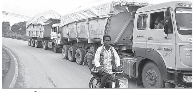
ଗ୍ରାମବାସୀ ପାଇଁଣ ବୋଝେଇ ଟ୍ରକକୁ ଅବକ ରଖୁଛନ୍ତି।

କୋଲାବିରା ଗ୍ରାମ ପୁଖ୍ୟ ରାସ୍ତାରେ ପ୍ରତିଦିନ ବହୁ ସଂଖ୍ୟକ ପାଇଁଣ ବୋଝେଇ ଭାରିଯାନ ଯାତାୟାତ କରୁଛି। ଅନ୍ୟପକ୍ଷେ ଗାଡିଗୁଡିକ ବିପଦସଙ୍କୁଳ ଅବସ୍ଥାରେ ଯାତାୟାତ କରୁଥିବା ନେଇ ଜନସାଧାରଣ ଅସୁବିଧାର ସମ୍ମୁଖୀନ ହେଉଛନ୍ତି। ଏନେଇ ଗ୍ରାମବାସୀ ପାଇଁଣ ବୋଝେଇ ଭାରିଯାନ ଯାତାୟାତକୁ ଶୁକ୍ରବାର ବିରୋଧ କରିଥିଲେ। ଗ୍ରାମବାସୀଙ୍କ ଅଭିଯୋଗ ପ୍ରତ୍ୟାବର୍ତ୍ତା, ବର୍ଷା ପୂର୍ବରୁ ଗାଡିଗୁଡିକ ଯାତାୟାତ କରୁଥିବା ବେଳେ ରାସ୍ତାରେ ପାଇଁଣ ପଡି ବାଧ୍ୟ ପ୍ରଦୃଶ୍ୟ ହୋଇଥିଲା। ବର୍ତ୍ତମାନ ବର୍ଷା ଦିନେ ଗାଡିକୁ ପାଇଁଣ ପଡି ରାସ୍ତା କାପୁଅ ହେବା ସହ ଲୋକଙ୍କ ଦେହରେ ପଡୁଛି। ଏପରି କି ଗାଡିଗୁଡିକ ଓଭରଲୋଡ କରି ପାଇଁଣ