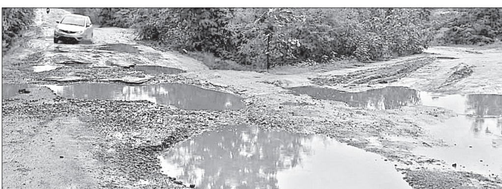
ଝାଡ଼ ନନ୍ଦର ଏରେ ପାଣି ଜମି ରହିଛି ।

ପରିମଳ ଏବଂ ସ୍ୱଚ୍ଛତା ସମାଜର ସରକାରଙ୍କ ତରଫରୁ ଗ୍ରାମପଞ୍ଚାୟତକୁ ପ୍ରତିବର୍ଷ ବିଭିନ୍ନ ଯୋଜନାରେ ଲକ୍ଷ୍ୟକ୍ରମ ପ୍ରଦାନ କରାଯାଇଛି । ହେଲେ ପାଣିର ସମବିନିଯୋଗ ହେଉ ନ ଥିବାରୁ ସଦସ୍ୟା ସଦସ୍ୟଙ୍କୁ କଳାମ ହୋଇ ରହିଯାଇଛି । ନୂଆପତ୍ରା ଜିଲ୍ଲା କୋମନା ବୁକ ତରବୋତ ବସ୍ତି ହେଉଛି ଏହାର ଏକ ନମ୍ନ ନମ୍ନା । ଏଠାରେ ପରିମଳ ବ୍ୟବସ୍ଥା ଭୁଲ୍ଲୁଟି ପଡିଛି । ଏଠାରେ ଅସରାଏ ବର୍ଷା ହେଲେ ଘରକୁ ପାଣି ପଶିଯାଉଛି । ଡ୍ରେନ ବ୍ୟବସ୍ଥାରେ କୌଣସି ସୁଧାର କରାଯାଇପାରି ନ ଥିବା ନେଇ ଗ୍ରାମବାସୀ ଅସନ୍ତୋଷ ପ୍ରକାଶ କରିଛନ୍ତି ।