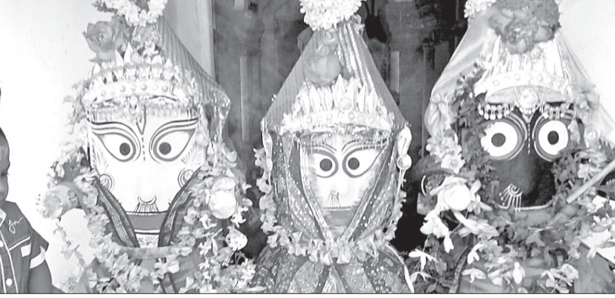
ଶ୍ରୀଜୀଉ ମହ୍ୟ ଅବତାରରେ ଶ୍ରୀକଳଙ୍କୁ ଦର୍ଶନ ଦେଖିଛନ୍ତି।

ଶୁକ୍ରବାର କୋଲାବିରାସ୍ଥିତ ଶ୍ରୀଗୁଣ୍ଡିଚା ମନ୍ଦିର ପରିସରରେ ଶ୍ରୀଜୀଉଙ୍କ ମହ୍ୟ ଅବତାର ଅନୁଷ୍ଠିତ ହୋଇଯାଇଛି। ଏନେଇ ମହାପ୍ରଭୁଙ୍କୁ ଦର୍ଶନ ପାଇଁ ଭକ୍ତଙ୍କ ଭିଡ ଲାଗି ରହିଥିଲା। ଏପରି କି ସନ୍ଧ୍ୟା ଆଳତିରେ ଘଣ୍ଟ, ଶଙ୍ଖ ମୁଦକ ବାଦ୍ୟରେ ପରିବେଷ ଭକ୍ତିମୟ ହୋଇଉଠିଥିଲା। ସକାଳୁ ଶ୍ରୀଜୀଉଙ୍କ ନିକଟରେ ପ୍ରାର୍ଥ ପଢାଯାଇ ପରେ ବାକଭୋଗ ଲଗାଯାଇଥିଲା। ପରେ ମଧ୍ୟାହ୍ନରେ ଶ୍ରୀଜୀଉଙ୍କ ନୂତନ ବସ୍ତ୍ର ପରିଧାନ କରାଯାଇ ସମସ୍ତ ରୀତିନୀତି ଅନୁଯାୟୀ ପୂଜାର୍ଚ୍ଚନା କରାଯିବା ସହ ଭୋଗ ଲାଗି ହୋଇଥିଲା। ଅପରାହ୍ଣ ଧର୍ମରେ ଶ୍ରୀଜୀଉଙ୍କ ମହ୍ୟ ଅବତାରରେ ଶ୍ରୀକଳଙ୍କୁ ଦର୍ଶନ ଦେଖିଥିଲେ।