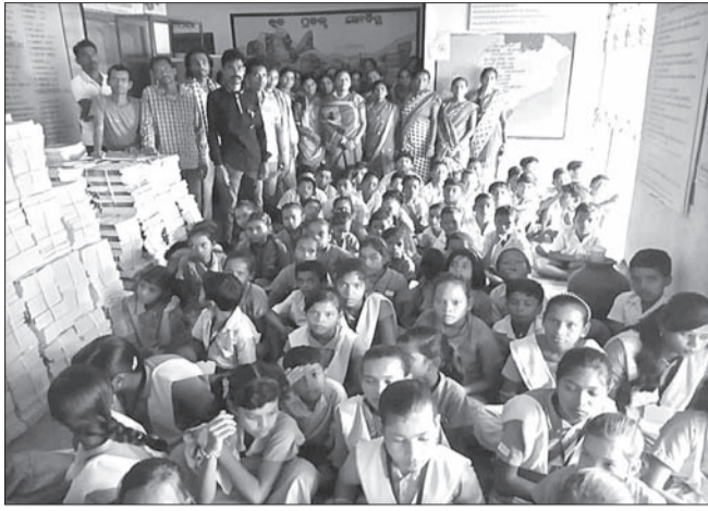
ଶୁକ୍ରବାର ବିଦ୍ୟାଳୟର ଛାତ୍ରାଛାତ୍ର ଏବଂ ଅଭିଭାବକଙ୍କ ପକ୍ଷରୁ ବ୍ଲକ ଗୋଷ୍ଠୀ ଶିକ୍ଷା କେନ୍ଦ୍ର(ବିଇଓ)ରେ ଧାରଣା ଦିଆଯାଇଥିଲା ।

ବଲାଙ୍ଗୀର ଜିଲ୍ଲା ଆଗଲପୁର ବ୍ଲକ ଶିଶୁଆ ସରକାରୀ ଉଚ୍ଚ ପ୍ରାଥମିକ ବିଦ୍ୟାଳୟର ଶ୍ରେଣୀ ଗୃହ, ରୋଷେଇ ଘର, ଶୈତାଳ୍ୟ ଏବଂ ଶିକ୍ଷକ ନିଯୁକ୍ତି ଦାବିରେ ଗତ ବୁଧବାରଠାରୁ ତାଲା ବନ୍ଦ ଆନ୍ଦୋଳନ କରାଯାଇଥିଲା । ଶୁକ୍ରବାର ବିଦ୍ୟାଳୟର ଛାତ୍ରାଛାତ୍ର ଏବଂ ଅଭିଭାବକଙ୍କ ପକ୍ଷରୁ ବ୍ଲକ ଗୋଷ୍ଠୀ ଶିକ୍ଷା କେନ୍ଦ୍ର(ବିଇଓ)ରେ ଧାରଣା ଦିଆଯାଇଥିଲା । ବିଇଓ ପୁଲଟା ଭୋଇ, ବିଡ଼ିଓ ସୁନ୍ଦର୍ଶନ ସେ ପ୍ରମୁଖଧାରଣାଗ୍ରାହକ ଆର୍ଯ୍ୟ ଏକ ମାସ ମଧ୍ୟରେ ସମସ୍ୟା ସମାଧାନର ପ୍ରତିଶ୍ରୁତି ଦେବା ପରେ ଧାରଣା ପ୍ରତ୍ୟାହତ ହୋଇଥିଲା । ଶ୍ରୀନିବାରଠାରୁ ସ୍କୁଲ ସ୍ୱାଭାବିକ ଖୋଲିବାକୁ ଅଭିଭାବକଙ୍କୁ କୁହାଯାଇଥିଲା । ସୂଚନାମତେ,