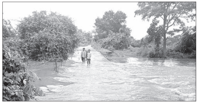
ତୋଳାମାଳ-ବାବୁପାଲି ରାସ୍ତାରେ ରସ୍ତା ପୋଲରେ ପାଣି ପ୍ରବାହିତ ହେଉଛି । ଆସୁଥିବା ଲୋକେ କୁହୁଛନ୍ତି ଦେଇ ଆସୁଛନ୍ତି । ଏହି ରସ୍ତା ପୋଲକୁ ଉଚ୍ଚ କରିବାକୁ ସାଧାରଣରେ ଦାବି ହେଉଛି ।

ସୁବର୍ଣ୍ଣପୁର ଜିଲ୍ଲା ବିନିକାରେ ଗୁରୁବାର ବିଳମ୍ବିତ ରାତିରେ ପ୍ରବଳ ବର୍ଷା ହେବା ଫଳରେ ତୋଳାମାଳ-ବାବୁପାଲି ରାସ୍ତାରେ ରସ୍ତା ପୋଲ ଉପରେ ପ୍ରାୟ ୪ଫୁଟର ପାଣି ପ୍ରବାହିତ ହେଉଛି । ଏଥିଯୋଗୁଁ ଏହି ରାସ୍ତାରେ ଯୋଗାଯୋଗ ବିଚ୍ଛିନ୍ନ ହୋଇଛି । ଲକ୍ଷ୍ମପୁର ପଠୁ ବିନିକା ଆସୁଥିବା ଲୋକେ ଅସୁବିଧାରେ ପଡ଼ିଛନ୍ତି । ସମରତପା-ଭୀମବିକ୍ରମା ରାସ୍ତା ଦେଇ ସେମାନେ ବିନିକା ଆସୁଛନ୍ତି । ମହାବଳୁ