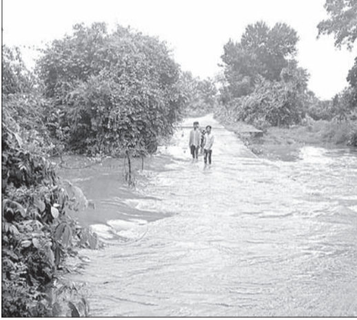
ବିନିକା-ବାଲୁପାଳି ରାସ୍ତାର ରଘୁଟା ପୋଲରେ ପାଣି ପ୍ରବାହ ହେଉଛି ।

ବିନିକାରେ ଗୁରୁବାର ବିକଳ ରାତିରେ ପ୍ରବଳ ବର୍ଷା ହେବା ଫଳରେ ବିନିକା-ବାଲୁପାଳି ରାସ୍ତାର ରଘୁଟା ପୋଲ ଉପରେ ପ୍ରାୟ ୪୫ ଫୁଟ ପାଣି ପ୍ରବାହିତ ହେଉଛି ।