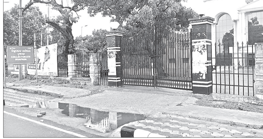
ଜିଲାପାଳଙ୍କ କାର୍ଯ୍ୟାଳୟର ମୁଖ୍ୟ ଗେଟ ସମ୍ମୁଖରେ ତାଲା ପଡିଛି ।

। ସେପଟେ ନିଜ ବାସ ଭବନରେ ରହି କାର୍ଯ୍ୟ କରୁଥିବା କାର୍ଯ୍ୟାଳୟକୁ ଆସୁନାହାନ୍ତି । ସେପଟେ ଜିଲାପାଳ ଅଧିକାରୀ ଅନାନ୍ୟ କର୍ମଚାରୀ ପଛପଟ ରାସ୍ତା ଦେଇ କାର୍ଯ୍ୟାଳୟକୁ ଯାଆନ୍ତି କରୁଥିବା ଦେଖାଯାଉଛି । ଚାଷୀ ଭୟରେ ଜିଲାପାଳଙ୍କ ଅଧିକାରୀ ତାଲା ପଡିଛି ବୋଲି ଆଲୋଚନା ହେଉଛି ।