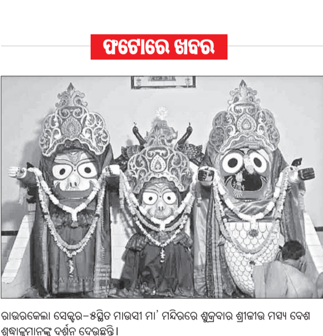
ରାଉରକେଲା ସେକ୍ଟର-୫ରେ ମାରସୀ ମା' ମନ୍ଦିରରେ ଶୁକ୍ରବାର ଶ୍ରୀକାର ମହ୍ୟ ବେଶ ଶ୍ରୀକାଳୀମାନଙ୍କୁ ବର୍ଣ୍ଣନା ଦେଉଛନ୍ତି।

ଖାଇଲା ବେଳକୁ ସାତପୁଅ ମା ହୁଲହୁଲି ବେଲା ବେଳକୁ ଜଳରେ ଘାଆ। ଖାଇବାକୁ ଆନୁସାରେ ଅଧିକ କାମ କରିବାକୁ ଦିଅନ୍ତୁ। ଅଧିକ ଅର୍ଥରେ ନିଜ କାର୍ଯ୍ୟ ସାଧନ ପାଇଁ ଯେତେ ବ୍ୟୟକୁ ପ୍ରକାଶ ପାଏ, ଅଧିକ ସୁବିଧା ସୁଯୋଗ ପାଇଁ ସେତେ ବ୍ୟୟକୁ ପରିଚାଳିତ ହେଉ ନ ଥିବାର ଅର୍ଥରେ ଏଭଳି ବ୍ୟୟକୁ ପ୍ରକାଶ କରାଯାଇଛି।