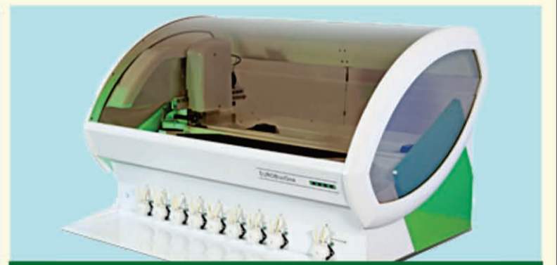
ବିଶ୍ୱପ୍ରସିଦ୍ଧ ଆଧୁନିକ ମେଶିନ୍ (EUROBlotOne) ଦ୍ୱାରା ପରୀକ୍ଷା କରାଯାଇଥାଏ

ଯେତେ ଶରୀରର ବ୍ଲୁ ଗ୍ଲୁକୋଜ୍ ପ୍ରୋସେସ୍ କରିବାର କ୍ଷମତା ହ୍ରାସ ହୋଇଯାଏ, ତାହାକୁ ସୁଗାର୍ ରୋଗ ବା ମଧୁମେହ କୁହାଯାଏ । ଅନେକ ଗବେଷଣାକୁ ଏହା ଜଣାପଡ଼ିଛି ଯଦି ଆଜିକାଲି ଖାଦ୍ୟଶସ୍ୟ ଓ ଦୁଗୁଣାତାୟ ଉତ୍ପାଦ ଭଳି ଖାଦ୍ୟ ସୁଗାର୍ ପାଇଁ ଦାୟୀ । ଏହାର ଅର୍ଥ ହେଉଛି ଲକ୍ଷ ଲକ୍ଷ ପ୍ରି-ଡାଇବେଟିକ୍ ଲୋକ ଖାଦ୍ୟପଦାର୍ଥର ଫୁଡ୍ ଇଣ୍ଟଲେରାନ୍ସକୁ ଚିହ୍ନଟ କରି ସୁଗାର୍ରୁ ବର୍ତ୍ତିପାରିବେ । ଫୁଡ୍ ଇଣ୍ଟଲେରାନ୍ସ/ଆଲର୍ଜି ପରୀକ୍ଷା (Food Intolerance/ Allergy Test)ରୁ ସେହି ଖାଦ୍ୟପଦାର୍ଥଗୁଡ଼ିକୁ ଚିହ୍ନଟ କରିବା ଅନେକ ମାତ୍ରାରେ ସମ୍ଭବ, ଯେଉଁଗୁଡ଼ିକ ସୁଗାର୍ ଓ ମଧୁମେହର ପ୍ରମୁଖ କାରଣ ହୋଇଥିବ ।