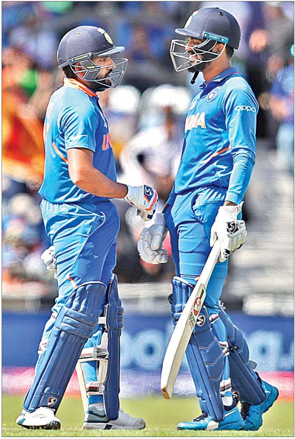
ଶତକୀୟ ଭାଗାଦାରି ଅବସରରେ ରୋହିତ ଶର୍ମା-ଲୋକେଶ ରାହୁଲ ।

ଦୁଇ ଓପନର ରୋହିତ ଶର୍ମା ଓ ଲୋକେଶ ରାହୁଲଙ୍କ ଶତକ ସହାୟତାରେ ଚଳିତ ବିଶ୍ୱକପ୍‌ରେ ଭାରତ ତା'ର ଅତିମ ଲିଡ଼୍ ମ୍ୟାଚ୍‌ରେ ଶ୍ରୀଲଙ୍କାକୁ ୩୯ଟି ବଲ୍ ବାକି ରଖି ୬ ରଜକେଟ୍‌ରେ ପରାସ୍ତ କରିଛି । ଏଥିସହ ସେମିଫାଇନାଲ ପୂର୍ବରୁ ଭାରତ ତା'ର ପ୍ରସ୍ତୁତି ଜୋରଦାର କରିଛି । ଏହି ବିଜୟ ସହ ଭାରତ ଲିଡ଼୍ ପର୍ଯ୍ୟାୟରେ ୯ଟି ମ୍ୟାଚ୍ ଖେଳି ୬ ବିଜୟ, ଗୋଟିଏ ପରାଜୟ ଓ ଗୋଟିଏ ଟାଇମ୍‌ଆଉଟ୍ ସହ ୧୫ ପଏଣ୍ଟ ପାଇଁ ଗତଥରର ଚାମ୍ପିୟନ ଅଷ୍ଟ୍ରେଲିଆକୁ ପଛରେ ପକାଇ ଟେଷ୍ଟଲର ଶୀର୍ଷକୁ ଉଠିଛି । ଟପ୍ ଛିଟି ଶ୍ରୀଲଙ୍କା ପ୍ରଥମେ ବ୍ୟାଟିଂ କରି ମିଡ଼ଲଅର୍ଡର ବ୍ୟାଟ୍‌ସମ୍ୟାନ ଆଞ୍ଜେଲୋ ମାଥ୍ୟୁସଙ୍କ ଶତକ ସହ ନିର୍ଦ୍ଧାରିତ ୫୦ ଓଭରରେ ୬ ରଜକେଟ୍ ହରାଇ ୨୬୪ ରନ ସଂଗ୍ରହ କରିଥିଲା । ଜବାବରେ