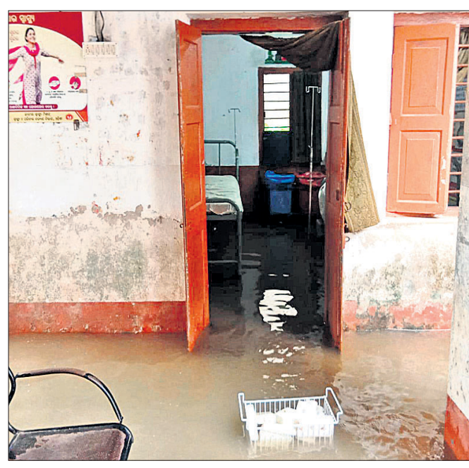
ବରପଦା ଗୋଷ୍ଠୀ ସ୍ଵାସ୍ଥ୍ୟକେନ୍ଦ୍ରରେ ବର୍ଷାପାଣି ଜମି ରହିଛି।

ଭଦ୍ରକ ଉପକଣ୍ଠ ବରପଦା ଗୋଷ୍ଠୀ ସ୍ଵାସ୍ଥ୍ୟକେନ୍ଦ୍ରରେ ବର୍ଷାପାଣି ପଶିଛି। ଏବେ ଆଶୁପ ଲୋକାଏ ପାଣି ଜମି ରହିଛି। ଏହି କାରଣରୁ ସ୍ଵାସ୍ଥ୍ୟସେବା ପାଇଁ ଆସୁଥିବା ରୋଗୀ ନାନା ଅସୁବିଧା ଭୋଗୁଛନ୍ତି। ଏଠାରୁ ଜଳ ନିଷ୍କାସନ ସକାଶେ କିଛି ସ୍ଵାସ୍ଥ୍ୟ ବିଭାଗ ପକ୍ଷରୁ କୌଣସି ପଦକ୍ଷେପ ନିଆଯାଇ ନ ଥିବା ଅଭିଯୋଗ ହେଉଛି।