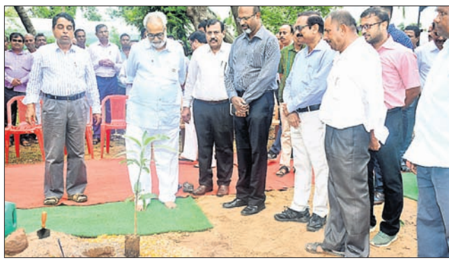
ରାଜଭବନ ପରିସରରେ ଚାରା ରୋପଣ ଅବସରରେ ରାଜ୍ୟପାଳ ପ୍ରଫେସର ଗଣେଶୀ ଲାଲ।