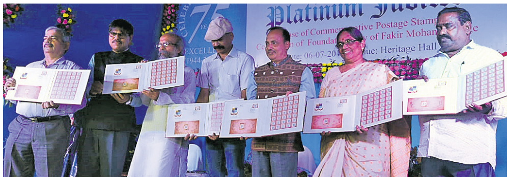
ଅତିଥିମାନେ ଡାକଟିକେଟ ଉନ୍ମୋଚନ କରୁଛନ୍ତି।