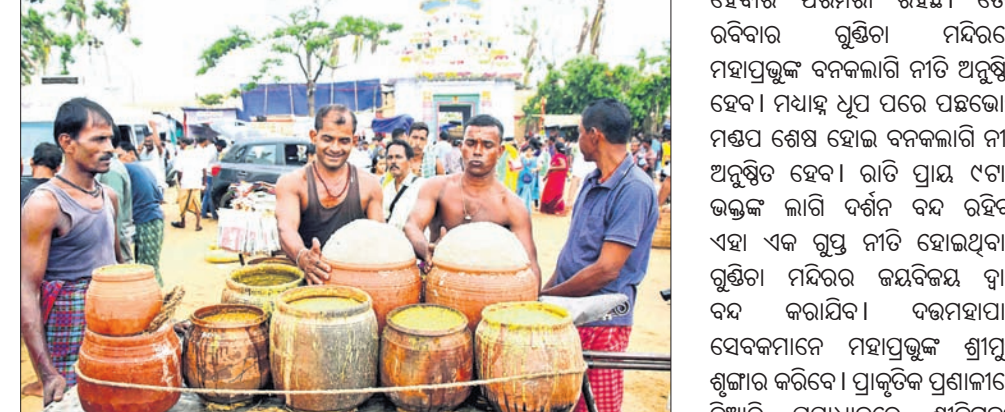
ଶ୍ରୀପୁଞ୍ଜ ମନ୍ଦିରରୁ ବାହାରିଥିବା ଆଡ଼ପ ଅବତା।

ନୀତି ବଢ଼ିଥିଲା। ପ୍ରାୟ ଯାହା ୨୮ରେ ବାହାରିଥିଲା ଆଡ଼ପ ଅବତା। ପ୍ରଥମ ଦିନରେ ହଜାର ହଜାର ଭକ୍ତ ଆଡ଼ପ ଦର୍ଶନ କରି ଆଡ଼ପ ଅବତା ପାଇଥିଲେ। ଅନ୍ୟପକ୍ଷରେ ରବିବାର ବାଲୁଗୁଡ଼ିଆରେ ବନକଲାଗି କରାଯିବ। ମଧ୍ୟାହ୍ନ ଧୂପ ପରେ ଦର୍ଶନମହାପାତ୍ର ପହଞ୍ଚିବେ। ମହାପ୍ରଭୁଙ୍କ ଶ୍ରୀପୁଞ୍ଜ ଶୁଙ୍ଘାର କରିବେ। ଭକ୍ତମାନଙ୍କୁ ମନୋହାରୀ ଭାବରେ ଚିତ୍ତାନ୍ତର କରିବେ। ଭକ୍ତମାନଙ୍କୁ ମନୋହାରୀ ଭାବରେ ଚିତ୍ତାନ୍ତର କରିବେ। ଭକ୍ତମାନଙ୍କୁ ମନୋହାରୀ ଭାବରେ ଚିତ୍ତାନ୍ତର କରିବେ। ଭକ୍ତମାନଙ୍କୁ ମନୋହାରୀ ଭାବରେ ଚିତ୍ତାନ୍ତର କରିବେ।