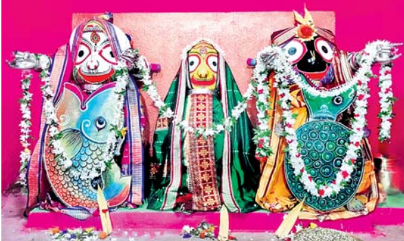
ରୁଣପୁର ସାନ ଗୁଣ୍ଡିଚା ମନ୍ଦିରରେ ଜଗନ୍ନାଥଙ୍କ କଚ୍ଛପ ଅବତାର ଦେଖ ।