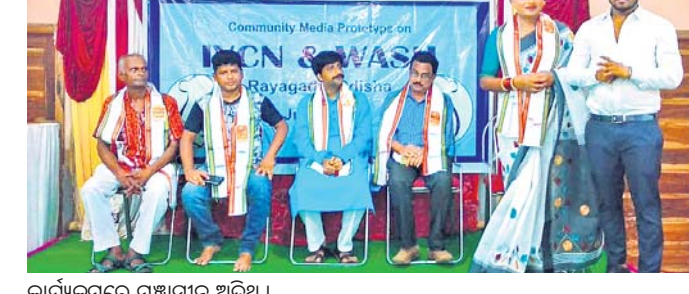
କାର୍ଯ୍ୟକ୍ରମରେ ମଞ୍ଚାସୀନ ଅତିଥି।