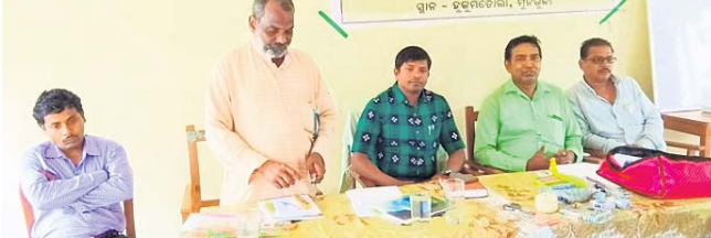
କର୍ମଶାଳାରେ ଉପସ୍ଥିତ ଅତିଥି।

ମୁନିଗୁଡ଼ା, ୬୬ (ଡି.ଏନ୍.ଏ.): ମୁନିଗୁଡ଼ା ନିକଟବର୍ତ୍ତୀ ବୁକ୍ସମାଳା ନିଯାତ୍ରୀ ପଦ୍ମିନୀ ସ୍ତୁଲେ ଶନିବାର ମୁନିସେପ୍ଟର ସହାୟତା ଏବଂ ଶିକ୍ଷା ସହାୟକ ପରିଚାଳନା କ୍ରମେ ପଠନ ଦକ୍ଷତା ବୃଦ୍ଧି କାର୍ଯ୍ୟକ୍ରମର ସମୀକ୍ଷା କର୍ମଶାଳା ଅନୁଷ୍ଠିତ ହୋଇଛି।