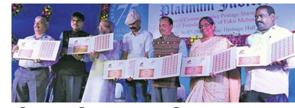
ଅତିଥିମାନେ ଡାକଟିକେଟ ଉନ୍ମୋଚନ କରୁଛନ୍ତି ।

ବାଲେଶ୍ଵର ଅପ୍ରିଲ, ୬୭ ବାଲେଶ୍ଵର ଫକୀରମୋହନ ସ୍ଵୟଂଶାସିତ କଲେଜର ପ୍ଲାଟିନମ୍ ଜୁବିଲି (୭୫ତମ ପ୍ରତିଷ୍ଠା ଦିବସ) ଶନିବାର ପାଳିତ ହୋଇଛି । ଏହି ଅବସରରେ କେନ୍ଦ୍ରସରକାରଙ୍କ ଦ୍ଵାରା ଅନୁମୋଦିତ ଓଡ଼ିଶାର ଅନ୍ୟତମ ବରପୁତ୍ର, ଓଡ଼ିଆ କଥା ସାହିତ୍ୟର ଜନକ ଫକୀରମୋହନ ସେନାପତିଙ୍କ ଫଟୋ ଥିବା ଏକ ଡାକଟିକେଟ ବିଭାଗୀୟ ଅଧିକାରୀଙ୍କ ଉପସ୍ଥିତିରେ ଉନ୍ମୋଚିତ ହୋଇଛି । କେନ୍ଦ୍ରମନ୍ତ୍ରୀ ପ୍ରତାପ ଚନ୍ଦ୍ର ସତ୍ତ୍ଵଜୀ ମୁଖ୍ୟଅତିଥି ଭାବେ ଯୋଗଦେଇ ଏହି ଉତ୍ସବକୁ ଉଦ୍ଘାଟନ କରିଥିଲେ । ସେ ତାଙ୍କ ବକ୍ତବ୍ୟରେ ଫକୀରମୋହନଙ୍କ ଗାରିମାକୁ ବକାୟ ରଖି ସହ ଦେଶ ଓ ରାଷ୍ଟ୍ର ଗଠନରେ ଛାତ୍ରାଛାତ୍ରୀମାନେ ପ୍ରମୁଖ ଭୂମିକା ଗ୍ରହଣ କରିବାର ସମୟ ଆସିଛି ବୋଲି କହିଥିଲେ । କେବଳ ଶିକ୍ଷାଧ୍ୟତନରେ ଅଧ୍ୟୟନ କଲେ ଜୀବନ ପୂର୍ଣ୍ଣାଙ୍ଗ ହୁଏ ନାହିଁ । ପ୍ରତ୍ୟେକ କ୍ଷେତ୍ରରେ ଶିକ୍ଷା ଗ୍ରହଣ କରିବାର ଆବଶ୍ୟକତା ରହିଛି । ଶିକ୍ଷାକୁ ଜୀବନର ବ୍ରତ ତଥା ଜୀବତ ଶ୍ଵାଶବର୍ତ୍ତୀ ରୂପେ ଗ୍ରହଣ କରିବା ପାଇଁ ସେ ଛାତ୍ରାଛାତ୍ରୀଙ୍କୁ ଆହ୍ଵାନ ଦେଇଥିଲେ ।