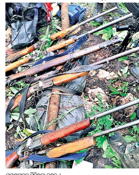
ଘଟଣାସ୍ଥଳରୁ ମିଳିଥିବା ବନ୍ଧୁକ ।

ମାଲକାନଗିରି, ୬୭ (ଡି.ଏନ୍.ଏ.)— ମାଲକାନଗିରି ଜିଲ୍ଲା ସୀମାନ୍ତ ଛତଶଗଡ଼ରେ ପୋଲିସ-ଲାଲବାହିନୀ ମୁହାଁମୁହିଁ ହୋଇଛନ୍ତି । ଧନତରି ଜିଲ୍ଲା ଗମେତକା ଥାନା ଅଞ୍ଚଳରେ ଉଭୟପକ୍ଷଙ୍କ ମଧ୍ୟରେ ଶନିବାର ସକାଳୁ ଗୁଳି ବିନିମୟ ହୋଇଛି । ଫଳରେ ୪ଜଣ ମାଓବାଦୀ ନିହତ ହୋଇଛନ୍ତି । ଖବରରୁ ଜଣାପଡ଼ିଛି ଏସ୍‌ଟିଏଫ୍ ଓ ଡିଏଫ୍ ସରକାରମାନେ ସବୁଦିନ ପରି ଶନିବାର ସକାଳୁ କୋସିଂ ଅପରେଶନରେ ବାହାରିଥିଲେ । ଏହି ସମୟରେ ମାଓବାଦୀମାନେ ଖଲାସି ଏବଂ ମେତକା ଗ୍ରାମ ମଧ୍ୟରେ ଥିବା ଜଙ୍ଗଲରେ ଏକ ବୈଠକ କରୁଥିବା ସମୟରେ ଲାଶିପାରି ସମ୍ପୂର୍ଣ୍ଣ ଅଞ୍ଚଳକୁ ଘେରାବନ୍ଦୀ କରି ଦେଇଥିଲେ । ମାଓବାଦୀମାନେ ଏହା ଜାଣିପାରି ଯବାନଙ୍କ ଉପରକୁ ଗୁଳି ଚାଳନା କରିଥିଲେ । ଯବାନମାନେ ମଧ୍ୟ ଏହାର ପ୍ରତି ଜବାବ ଦେଇ ଗୁଳିଚାଳନା କରିଥିଲେ । ଦୀର୍ଘ ସମୟ ଧରି ଉଭୟପକ୍ଷଙ୍କ ମଧ୍ୟରେ ଗୁଳି ବିନିମୟ ହୋଇଥିଲା । ଏଥିରେ ୪ଜଣ ମାଓବାଦୀଙ୍କ ମୃତ୍ୟୁ ହୋଇଥିଲା । ସେମାନଙ୍କ ପରିଚୟ ମିଳିନାହିଁ । ପରେ ସମ୍ପୂର୍ଣ୍ଣ ଅଞ୍ଚଳ ତଲାସୀ କରି ପୋଲିସ ୭ଟି ବନ୍ଧୁକ ଜବତ କରିଛି । ଏହି ଗୁଳି ବିନିମୟରେ ଆହୁରି ଅନେକ ମାଓବାଦୀ ମୃତ କିମ୍ବା ଆହତ ହୋଇଥିବା ସନ୍ଦେହ କରାଯାଉଛି । କୋସିଂ ଅପରେଶନକୁ ଜୋରଦାର କରାଯାଉଛି ।