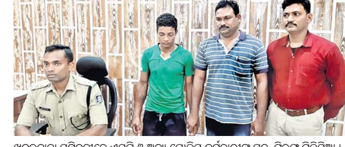
ଖବରଦାତା ସମ୍ମିଳନୀରେ ଏସପି ଓ ଅନ୍ୟ ପୋଲିସ କର୍ମଚାରୀଙ୍କ ସହ ଗିରଫ ମିଳିସିଆ ।