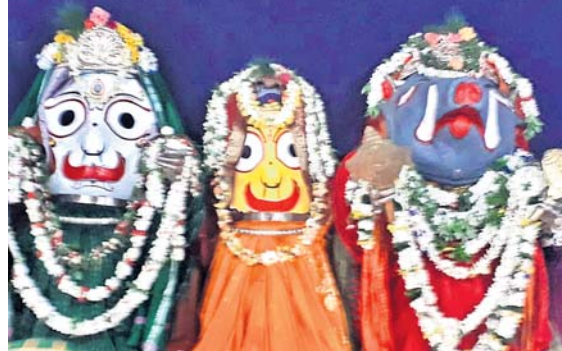
ବିଷମକଟକରେ ମହାପ୍ରଭୁଙ୍କ ବରାହ ଦେଖ ।