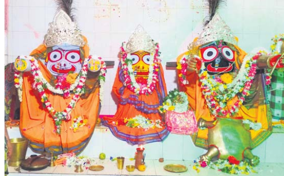
ମୁନିଗୁଡ଼ାରେ ଜଗନ୍ନାଥଙ୍କ କଚ୍ଛପ ଦେଖ ।