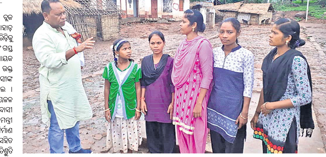
ବିଧାୟକ ଯୁବତୀମାନଙ୍କ ସହ ଆଲୋଚନା କରୁଛନ୍ତି।