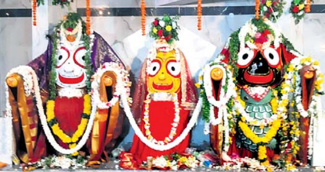
ରାୟଗଡ଼ାରେ ମହାପ୍ରଭୁଙ୍କ କୁର୍ମ ଅବତାର ।