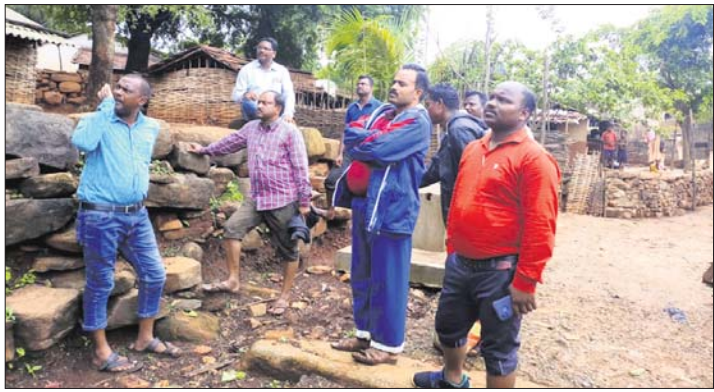
ସ୍ଵାଭିମାନ ଅଞ୍ଚଳରେ ପହଞ୍ଚିଥିବା ପ୍ରଶାସନିକ ଅଧିକାରୀମାନେ ।

ସ୍ଵାସ୍ଥ୍ୟସେବା ଓ ଶିକ୍ଷା ଏଠାରେ ମୁଖ୍ୟ ସମସ୍ୟା ବୋଲି ଗ୍ରାମବାସୀ ଜଣାଇଥିଲେ । ଗ୍ରାମବାସୀଙ୍କ ସମସ୍ୟା ଦେଖିବା ପରେ ପ୍ରଶାସନ ଛୁଟିକୁ ବୁଦ୍ଧିଜୀବୀ କରିଥିଲେ । ଚାଲି ଚାଲି ଗ୍ରାମ ପରିଦର୍ଶନ କରିବା ସହ ଲୋକଙ୍କ ଅଭାବ ଅସୁବିଧା ସମ୍ପର୍କରେ ପଚାରି ବୁଝିଥିଲେ । ଗ୍ରାମବାସୀଙ୍କ ସମସ୍ୟା ସମାଧାନ କରାଯିବ ବୋଲି ବିତ୍ତ ଓ ଦାସରଥୀ ପ୍ରତିଶ୍ରୁତି ଦେଇଛନ୍ତି । ୫୦ କିମି ଦୂର ନାକାମାମୁଡ଼ି ପିଡ଼ିଏସ ଚାଉଳ ବନ୍ଧନ ପାଇଁ ଦୂତନ ଗୋଦାମ ଗୃହ ନିର୍ମାଣ ହେବ । ମୁହୂର୍ତ୍ତପତା ଓ ବାୟାପାଲିକୁ ନୂତନ ପଞ୍ଚାୟତ ରୂପେ ଗଠନ କରିବାକୁ ସରକାରଙ୍କ ନିକଟକୁ ପ୍ରସ୍ତାବ ପଠାଯିବ । ଏଥିପାଇଁ ଆଗାମୀ ଦିନରେ ଗ୍ରାମସଭା କରାଯିବ ବୋଲି ବିତ୍ତ ଓ ଦାସରଥୀ କହିଛନ୍ତି । ସୂଚନାଯୋଗ୍ୟ ଯେ, ଏବେ ଏହି ଅଞ୍ଚଳବାସୀ ରାଶନ ଚାଉଳ ଓ ଭଜା ପାଉଁଟି ପ୍ରତିଶ୍ରୁତି ଦେଇଛନ୍ତି । ୫୦ କିମି ଦୂର ନାକାମାମୁଡ଼ି ପିଡ଼ିଏସ ଚାଉଳ ବନ୍ଧନ ପାଇଁ ପଞ୍ଚାୟତକୁ ଯାଉଛନ୍ତି ।