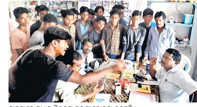
ଛାତ୍ରମାନେ ପ୍ରଧାନ ଶିକ୍ଷକଙ୍କ ସହ ଆଲୋଚନା କରୁଛନ୍ତି।

ରାୟଗଡ଼ା ଜିଲା ବୋଲନରା ବ୍ଲକ୍ ପିଆପଦର ଉନ୍ନତ ଉଚ୍ଚ ବିଦ୍ୟାଳୟରେ ୧୨ଜଣ ଛାତ୍ରାଛାତ୍ରୀ ମାଟ୍ରିକ ସମ୍ମିଳନୀରେ ପରୀକ୍ଷା ଦେବାକୁ ବଞ୍ଚିତ ହୋଇଛନ୍ତି। ପ୍ରଧାନ ଶିକ୍ଷକଙ୍କ ଅବହେଳାରୁ ସେମାନେ ବଞ୍ଚିତ ହୋଇଥିବା ଅଭିଯୋଗ କରିଛନ୍ତି।