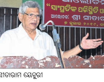
ଦେଶର ସମ୍ପ୍ରଦାୟିକ ଏବଂ ଗଣତନ୍ତ୍ର ପ୍ରତି ବିପଦ ରହିଛି । ଏହାକୁ ପ୍ରତିରୋଧ କରିବା ପାଇଁ ଏକ ବୃହତ୍ ମିଳିତ ଅଭିଯାନର ଆବଶ୍ୟକତା ରହିଛି । କେନ୍ଦ୍ରରେ କ୍ଷମତାଧୀନ ଭାଜପା ନେତୃତ୍ୱରେ ଶାସନ କରୁଥିବା ବୈଦିକ ସାମ୍ପ୍ରଦାୟିକତା ଏବଂ କାଟିଆଣ ଆକ୍ରମଣ ଚଳାଇଛି ବୋଲି ରବିବାର ସିପିଏମ୍ ନେତା ସୀତାରାମ ଯେରୁରା କହିଛନ୍ତି ।