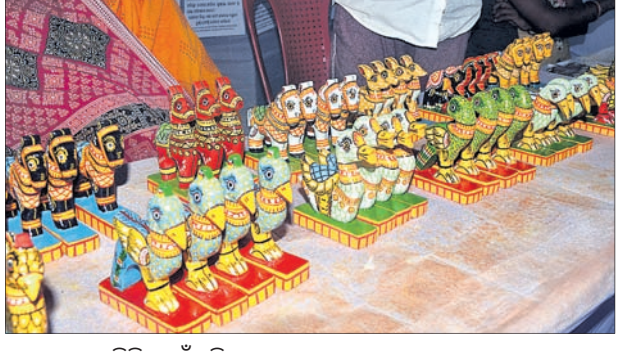
ଏକ ଷ୍ଟଲରେ ବିକ୍ରି ପାଇଁ ରହିଥିବା ନୟାଗଡ଼ର କାଠ କଣ୍ଠେଇ ।

ପଲ୍ଲିଶ୍ରୀ ମେଳାରେ ବିଭିନ୍ନ ପ୍ରକାର ଷ୍ଟଲ ପଡ଼ିଛି । ତେବେ ଅଧିକ ସଂଖ୍ୟକ ଷ୍ଟଲରେ ଘରକରଣା ଓ ଘରସଜା ସାମଗ୍ରୀ ବିକ୍ରି ହେଉଛି । ଧାନ ନଡ଼ାରେ ବିଭିନ୍ନ ପ୍ରକାର କଳାକୃତି ତିଆରି ଷ୍ଟଲ ପଡ଼ିଛି । ଏହି କଳାକୃତି ମଧ୍ୟରେ ମହାପ୍ରଭୁ ଶ୍ରୀଜଗନ୍ନାଥଙ୍କ କଳାକୃତି ରହିଛି, ଯାହା ଦେଖଣାହାରୀଙ୍କ ପାଇଁ ବେଶ୍ ଆକର୍ଷଣୀୟ ସାଜିଛି । ଏହାକୁ ଆଣି ଆସିଥିବା ବ୍ୟବସାୟୀ କୁହନ୍ତି, ଧାନ ନଡ଼ାକୁ ଆଣି ଏହାକୁ ଖୋଲି ଦିଆଯାଏ । ପରେ ଏଥିରେ ଆଇରନ ଦିଆଯାଏ । କପଡ଼ା ଉପରେ ଅଠା ସାହାଯ୍ୟରେ ଯୋଡ଼େଇ କରି ବିଭିନ୍ନ ପ୍ରକାର କଳାକୃତି ତିଆରି କରାଯାଏ । ଏହି କଳାକୃତି ମଧ୍ୟରେ ଗ୍ରାଜବାଲ ଆର୍ତ୍ତ, ମତର୍ନ ଆର୍ତ୍ତ, ପଶୁପକ୍ଷୀ, ବିଭିନ୍ନ ଦେବଦେବୀଙ୍କ କଳାକୃତି ରହିଛି ।