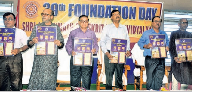
ଉତ୍ସବରେ ଅତିଥିମାନେ କୁଳସଙ୍ଗୀତ ଉନ୍ମୋଚନ କରୁଛନ୍ତି ।

ପୁରୀ ଅଫିସ, ୭/୭ ଭାରତୀୟ ମୂଲ୍ୟବୋଧର ପରିଚୟ ହେଉଛି ସଂସ୍କୃତ । ଏହା ବିଶ୍ୱର ଆତ୍ମ୍ୟ ଭାଷା । ବିଦେଶରେ ଏହି ଭାଷା ପ୍ରାଧାନ୍ୟ ବିସ୍ତାର କରିବାରେ ଲାଗିଛି । ସଂସ୍କୃତ କେବଳ ସମାଜରେ ଅଧିକ ଆଦୃତ ହୋଇପାରିବ ଏଥିଲାଗି ଛାତ୍ରାଛାତ୍ରୀଙ୍କର ଗୁରୁତ୍ୱପୂର୍ଣ୍ଣ ଭୂମିକା ରହିଛି । ବିଦ୍ୟାର୍ଥୀମାନେ ଚାକିରି ପଛରେ ନ ଧାଇଁ ନିଜ ଜ୍ଞାନର ପରିସୀମା ବିକଶିତ କରିବା ଉଚିତ ବୋଲି ରବିବାର ପୁରୀ ଶ୍ରୀବିହାରୀୟ ଶ୍ରୀଜଗନ୍ନାଥ ସଂସ୍କୃତ ବିଶ୍ୱବିଦ୍ୟାଳୟର ୩୯ତମ ପ୍ରତିଷ୍ଠା ଉତ୍ସବରେ ପ୍ରଘୋଷିତ ହୋଇଛି । ଏହି ଉତ୍ସବରେ ପ୍ରଘୋଷିତ ହୋଇଛି ଶ୍ରୀଜଗନ୍ନାଥ ସଂସ୍କୃତ ବିଶ୍ୱବିଦ୍ୟାଳୟର ୩୯ତମ ପ୍ରତିଷ୍ଠା ଉତ୍ସବରେ ପ୍ରଘୋଷିତ ହୋଇଛି ।