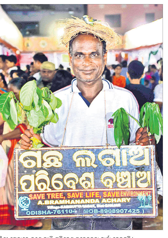
ପଲ୍ଲିଶ୍ରୀ ମେଳାରେ ଜଣେ ବ୍ୟକ୍ତି ପରିବେଶ ସଚେତନତା ବାର୍ତ୍ତା ଦେଉଛନ୍ତି ।