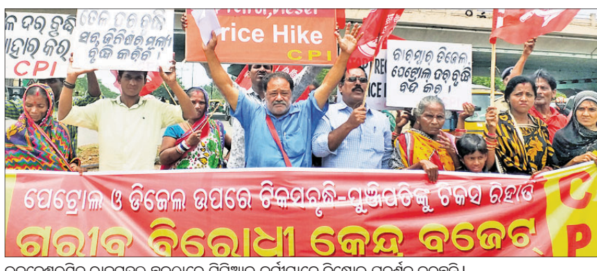
କେନ୍ଦ୍ରବଜେଟ ବିରୋଧରେ ପ୍ରତିବାଦ କରିବା ପାଇଁ ଅନୁମତି ଦେଇଛନ୍ତି । ଫଳରେ ଦେଶର ୧୦ କୋଟିରୁ ଊର୍ଦ୍ଧ୍ୱ ଖୁରୁ ବ୍ୟବସାୟୀ ଓ ଉଠା ଦୋକାନୀ କ୍ଷତିଗ୍ରସ୍ତ ହେବେ । ଏହାବ୍ୟତୀତ ରାଷ୍ଟ୍ରାୟତ୍ତ ଓ ସରକାରୀ ଉଦ୍ୟୋଗଗୁଡ଼ିକ ପ୍ରଭାବିତ ହେବେ ।

ବଜେଟରେ କେନ୍ଦ୍ର ସରକାର ବିଦେଶୀ କମ୍ପାନୀକୁ ଭାରତର ଖୁରୁରା ବଜାରରେ ପ୍ରବେଶ ପାଇଁ ଅନୁମତି ଦେଇଛନ୍ତି । ଫଳରେ ଦେଶର ୧୦ କୋଟିରୁ ଊର୍ଦ୍ଧ୍ୱ ଖୁରୁ ବ୍ୟବସାୟୀ ଓ ଉଠା ଦୋକାନୀ କ୍ଷତିଗ୍ରସ୍ତ ହେବେ । ଏହାବ୍ୟତୀତ ରାଷ୍ଟ୍ରାୟତ୍ତ ଓ ସରକାରୀ ଉଦ୍ୟୋଗଗୁଡ଼ିକ ପ୍ରଭାବିତ ହେବେ ।