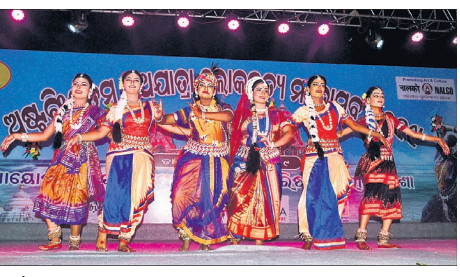
ଭୁବନେଶ୍ୱରରେ ଅଷ୍ଟବିଂଶତମ ରଥଯାତ୍ରା ଲୋକନୃତ୍ୟ ମହୋତ୍ସବରେ କଳାକାରମାନେ ସାଂସ୍କୃତିକ କାର୍ଯ୍ୟକ୍ରମ ଏବଂ ଓଡ଼ିଶା ନୃତ୍ୟ ପରିବେଷଣ କରୁଛନ୍ତି ।