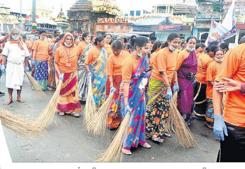
ରଥଯାତ୍ରା ଅବସରରେ ସମର୍ପଣ ଚାରିଦେଇ ଗ୍ରନ୍ଥ ସମ୍ପର୍କ ବଡ଼ଦାଣ୍ଡ ସଫେଇ କରାଯାଇଛି ।