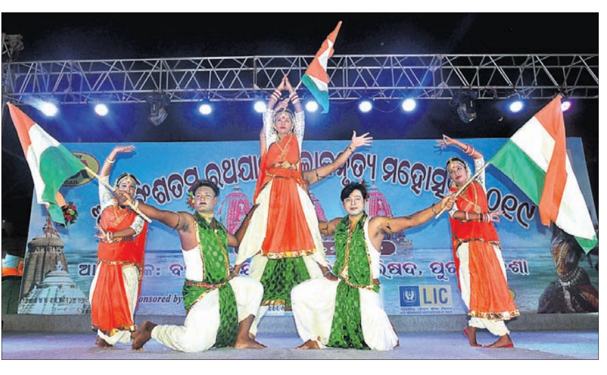
ବଡ଼ଶଙ୍ଖଠାରେ ରବିବାର ଆୟୋଜିତ ଅଷ୍ଟବିଂଶତମ ରଥଯାତ୍ରା ଲୋକନୃତ୍ୟ ମହୋତ୍ସବରେ କଳାକାରମାନେ ସାଂସ୍କୃତିକ କାର୍ଯ୍ୟକ୍ରମ ଏବଂ ଓଡ଼ିଶା ନୃତ୍ୟ ପରିବେଷଣ କରୁଛନ୍ତି ।