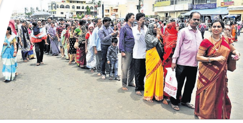
ଆଡ଼ପ ଦର୍ଶନ ପାଇଁ ରବିବାର ସକାଳେ ଗୁଣ୍ଡିଚା ମନ୍ଦିର ସମ୍ମୁଖରେ ଶ୍ରଦ୍ଧାଳୁଙ୍କ ଲମ୍ବା ଧାଡ଼ି ।

ତେଣୁ ସେ ସାମାନ୍ୟ କ୍ରୋଧାନ୍ୱିତ ହୋଇ ବିମାନରେ ବସି ନାକଟଣା ଦ୍ୱାର ଦେଇ ନନ୍ଦିଘୋଷ ରଥ ନିକଟକୁ ଆସନ୍ତି । ସେଠାରେ ମା'ଙ୍କ ଚରଫକୁ ଜଣେ ସେବକ ନନ୍ଦିଘୋଷ ରଥରୁ ଖଣ୍ଡିତ କାଠ ଭାଙ୍ଗି ଦିଅନ୍ତି । ପରେ ବିମାନକୁ ହେରାଗୋହିରୀ ସାହିଦେଇ ଶ୍ରୀମନ୍ଦିରକୁ ଅଣାଯାଏ । ମହାପ୍ରଭୁ ଏହିଦିନ ଆଜ୍ଞାନୀକ ପ୍ରଦାନ କରି ଯଥାଶୀଘ୍ର ଫେରିଯିବାକୁ ସନ୍ଦେଶ ଦେଇଥାନ୍ତି । ବାହୁଡ଼ା ଯାତ୍ରା ଦିନ ଶ୍ରୀଗୁଣ୍ଡିଚା ମନ୍ଦିରରୁ ରଥଟଣା ଆରମ୍ଭ ହୁଏ । ଶ୍ରୀବଳଭଦ୍ର ଓ ଦେବୀ ସୁଭଦ୍ରାଙ୍କ ରଥ ବିହାରୀଙ୍କର ଲାଗେ । କିନ୍ତୁ ଶ୍ରୀଜଗନ୍ନାଥ ବାଟରେ ମାଉସା ମା' ବା ଅର୍ଦ୍ଧାସିନୀ ଦେବୀଙ୍କଠାରୁ ପୋଡ଼ିପିଠା ଖାଇ ପୁଣି ପହଞ୍ଚି ଶ୍ରୀମନ୍ଦିର ନିକଟରେ । ଶ୍ରୀମନ୍ଦିର ନିକଟରେ ନନ୍ଦିଘୋଷ ରଥ ରୁହେ । ଏହି ସମୟରେ ସ୍ୱାମୀଙ୍କ ଖବର ପାଇ ମହାଲକ୍ଷ୍ମୀ ଠାକୁରାଣୀ ପାଟ ପିନ୍ଧି ମାଳପୁଲରେ ବେଶ ହୋଇ ସାତପଡ଼ା ଦ୍ୱାରରେ ଥିବା ପାଲିଙ୍କିକୁ ବିଜେ କରନ୍ତି । ବିମାନବଦ୍ଧ ସେବକମାନେ ପାଲିଙ୍କି ନେଇ ଚାହାଣି ମଞ୍ଚପ ନିକଟରେ ଉପସ୍ଥିତ ହୁଅନ୍ତି । ସେଠାରେ ମା' ଲକ୍ଷ୍ମୀ ଶ୍ରୀଜଗନ୍ନାଥ ମହାପ୍ରଭୁଙ୍କୁ ରଥରେ ଦର୍ଶନ କରନ୍ତି । ଏହାପରେ ବିମାନବଦ୍ଧମାନେ ପାଲିଙ୍କିକୁ ନନ୍ଦିଘୋଷ ରଥ ନିକଟକୁ ନିଅନ୍ତି । ଏହି ସମୟରେ ଶ୍ରୀବଳଭଦ୍ରଙ୍କ ରଥରେ ଘେର (କାରଣ ମହାଲକ୍ଷ୍ମୀଙ୍କ ଦେବଶୁର ହେଉଛନ୍ତି ବଡ଼ଠାକୁର ବଳଭଦ୍ର) ପଡ଼ିଥାଏ । ପରେ ଗଜପତି ମହାରାଜା ଶ୍ରୀମନ୍ଦିରକୁ ବିଜେକରି ନିଜ ହାତରେ ମହାଲକ୍ଷ୍ମୀଙ୍କୁ ଟେକିଧରି ଲକ୍ଷ୍ମୀ ନାରାୟଣ ଭେଟ କରାନ୍ତି । ପରେ ପାଲିଙ୍କିରେ ବସି ମହାଲକ୍ଷ୍ମୀ ରଥ ଚାପରେ ପ୍ରଦକ୍ଷିଣ କରିଥାନ୍ତି । ଏହି ସମୟରେ ଆଜ୍ଞାନୀକ ପାଇ ମହାଲକ୍ଷ୍ମୀ ଶ୍ରୀମନ୍ଦିରକୁ ପ୍ରତ୍ୟାବର୍ତ୍ତନ କରନ୍ତି । ଏହି ଆଜ୍ଞାନୀକ ମାଧ୍ୟମରେ ମହାପ୍ରଭୁ ଅତିଶୀଘ୍ର ପ୍ରତ୍ୟାବର୍ତ୍ତନ କରିବାର ସନ୍ଦେଶ ଦେଇ ମହାଲକ୍ଷ୍ମୀଙ୍କୁ ଶାନ୍ତ କରିଥାନ୍ତି । ପରିଶେଷରେ ନୀଳାଦ୍ରିବିଜେ ଦିନ ରସଗୋଲା ଭୋଗ ଖାଇବା ପରେ ଲକ୍ଷ୍ମୀ ଠାକୁରାଣୀ ସମ୍ପୂର୍ଣ୍ଣ ଶାନ୍ତ ହୋଇଥାନ୍ତି ବୋଲି ଡ. ଦାଶ ପ୍ରକାଶ କରିଛନ୍ତି ।