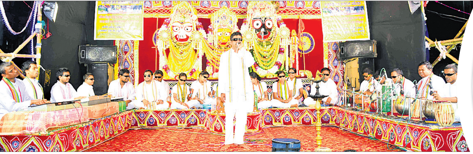
ବଡ଼ଦାଣ୍ଡରେ ଦିବ୍ୟାଙ୍ଗମାନଙ୍କ ଦ୍ୱାରା ଆୟୋଜିତ ଭଜନ ସମାରୋହ ।