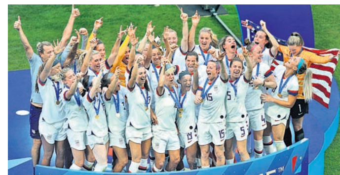
ଚାମ୍ପିୟନ ଆମେରିକା ଦଳ ବୁକ୍ଟି ସହ ।