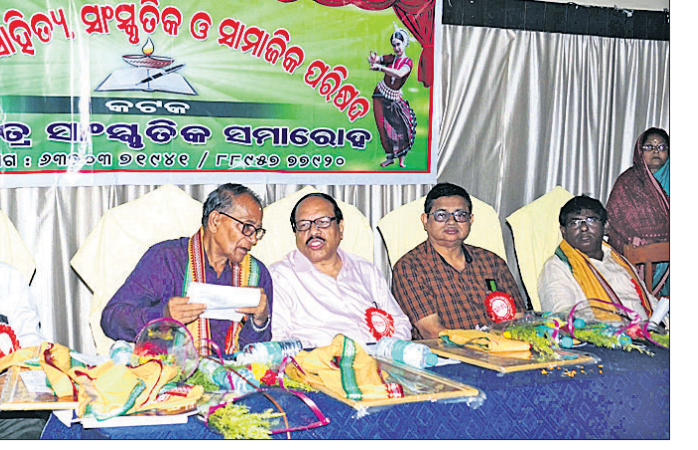
କଳ୍ପନା ସାହିତ୍ୟ, ସାଂସ୍କୃତିକ ଓ ସାମାଜିକ ପରିଷଦ ପକ୍ଷରୁ ଅନୁଷ୍ଠିତ ସମାରୋହରେ ମଞ୍ଚାସୀନ ଅତିଥିବୃନ୍ଦ।

ସମାଜର ଦୁର୍ବଳ ଶ୍ରେଣୀର ଲୋକମାନଙ୍କ ପାଇଁ ଲୋକବେଖାଣିଆ ବୋଲି ଏସ୍.ୟୁ.ସି.ଆଇ(ସି) ପକ୍ଷରୁ କୁହାଯାଇଛି। ବଜେଟ ସମ୍ପୂର୍ଣ୍ଣ ଭାବରେ ପୁଞ୍ଜିପତି ଶ୍ରେଣୀ ତଥା କର୍ଯୋରେଟ ହାଉସ ସମକ୍ଷରେ ପ୍ରସ୍ତୁତ କରାଯାଇଛି।