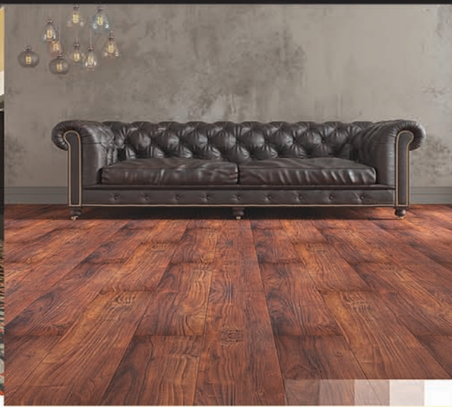
CLICK & LOCK TILES