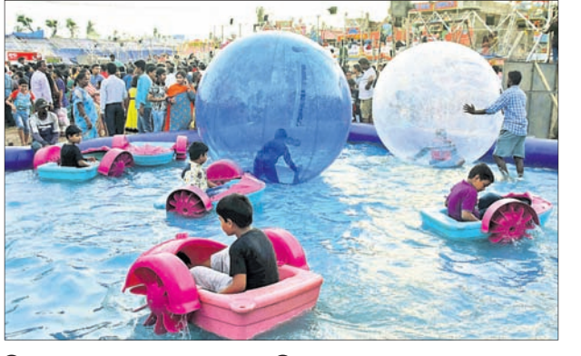
ପିଲାମାନେ ଜଳକ୍ରୀଡ଼ାର ମଜା ନେଉଛନ୍ତି ।