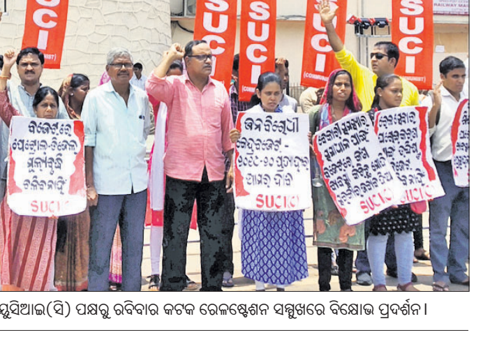
ଜନବିରୋଧୀ କେନ୍ଦ୍ର ବଜେଟ ପ୍ରତିବାଦରେ ଏସ୍.ୟୁ.ସି.ଆଇ(ସି) ପକ୍ଷରୁ ରବିବାର କଟକ ରେକର୍ଡେଣ୍ଡ ଶ୍ରମିକ ସମ୍ମୁଖରେ ବିରୋଧ ପ୍ରଦର୍ଶନ।

କଟକ ଅଫିସ, ୭/୭: ଅଖିଳ ଭାରତୀୟ ବିଦ୍ୟାର୍ଥୀ ପରିଷଦ(ଏଭିପିପି)ର ମେଧାବୀ ଅଭିନୟନ କାର୍ଯ୍ୟକ୍ରମ ସିଡିଏ ସେକ୍ଟର-୧ ସ୍ଥିତ ସରସ୍ୱତୀ ଶିଶୁ ବିଦ୍ୟାଳୟରେ ଅନୁଷ୍ଠିତ ହୋଇଯାଇଛି।