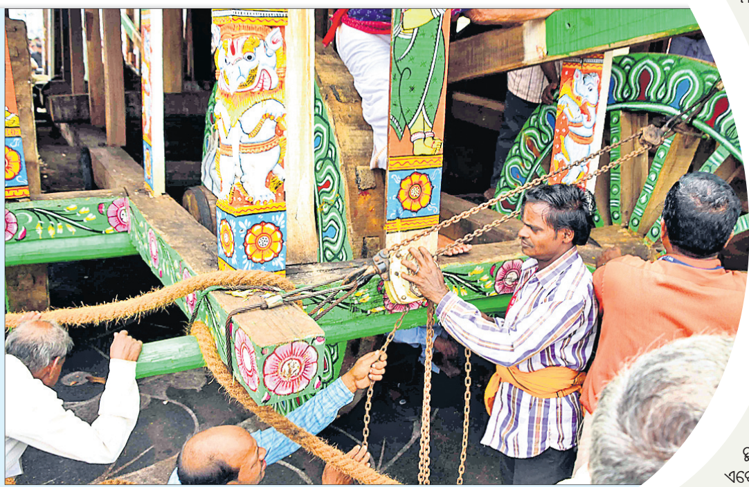
ତାଳଧ୍ୱଜ ରଥର ଏକ ଚକ ମରାମତି କରାଯାଇଛି ।