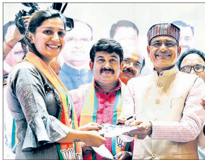
ଭାଜପା ଉପସଭାପତି ଶିବରାଜସିଂ ଚୌହାନ ସମ୍ପା ଚୌଧୁରୀଙ୍କୁ ସଦସ୍ୟତା ରସିଦ୍ ପ୍ରଦାନ କରୁଛନ୍ତି। ପାଖରେ ଉପସ୍ଥିତ ଦିଲ୍ଲୀ ଭାଜପା ମୁଖ୍ୟ ମନୋଜ ତିଘ୍ୱାରୀ।

ଲୋକପ୍ରିୟ ହରିୟାଣା ଗାଡ଼ିକାର ତଥା ନୃତ୍ୟାଙ୍ଗନା ସମ୍ପା ଚୌଧୁରୀ ରବିବାର ଭାଜପାରେ ଯୋଗଦେଇଛନ୍ତି। ଦିଲ୍ଲୀର ଜବାହରଲାଲ୍ ନେହେରୁ ଷ୍ଟାଡ଼ିୟମ୍‌ରେ ଦଳର ସଦସ୍ୟ ସଂଗ୍ରହ ଅଭିଯାନ ବେଳେ ଦଳର ବରିଷ୍ଠ ନେତା ତଥା ଦିଲ୍ଲୀ ଭାଜପା ମୁଖ୍ୟ ମନୋଜ ତିଘ୍ୱାରୀ, ମଧ୍ୟପ୍ରଦେଶର ପୂର୍ବତନ ମୁଖ୍ୟମନ୍ତ୍ରୀ ତଥା ଭାଜପା ଉପସଭାପତି ଶିବରାଜ ସିଂ ଚୌହାନଙ୍କ ଉପସ୍ଥିତିରେ ସେ ଦଳରେ ସାମିଲ ହୋଇଛନ୍ତି। ସାଧାରଣ ନିର୍ବାଚନ ବେଳେ ସେ ଭାଜପାରେ ସାମିଲ ହେବାର ସମ୍ଭାବନା ଥିଲା। ସେତେବେଳେ ଉତ୍ତର-ପୂର୍ବ ଦିଲ୍ଲୀ ସଂସଦୀୟ କ୍ଷେତ୍ରରୁ ତିଘ୍ୱାରୀଙ୍କ ଲାଗି ସେ ନିର୍ବାଚନ ପ୍ରଚାର ମଧ୍ୟ କରିଥିଲେ।