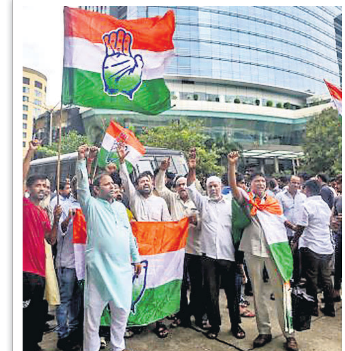
ମୁସଲମାନ ଏକ ହୋଟେଲରେ ରହୁଥିବା କର୍ମଚକର ଅସବୁଷ୍ଟ ବିଧାୟକମାନଙ୍କୁ ଭାଜପା ନେତାମାନେ ଭେଟିଛନ୍ତି। ଏହାକୁ ନେଇ କଂଗ୍ରେସ ସମର୍ଥକମାନେ ହୋଟେଲ ବାହାରେ ବିସ୍ଫୋଜ ପ୍ରଦର୍ଶନ କରୁଛନ୍ତି।