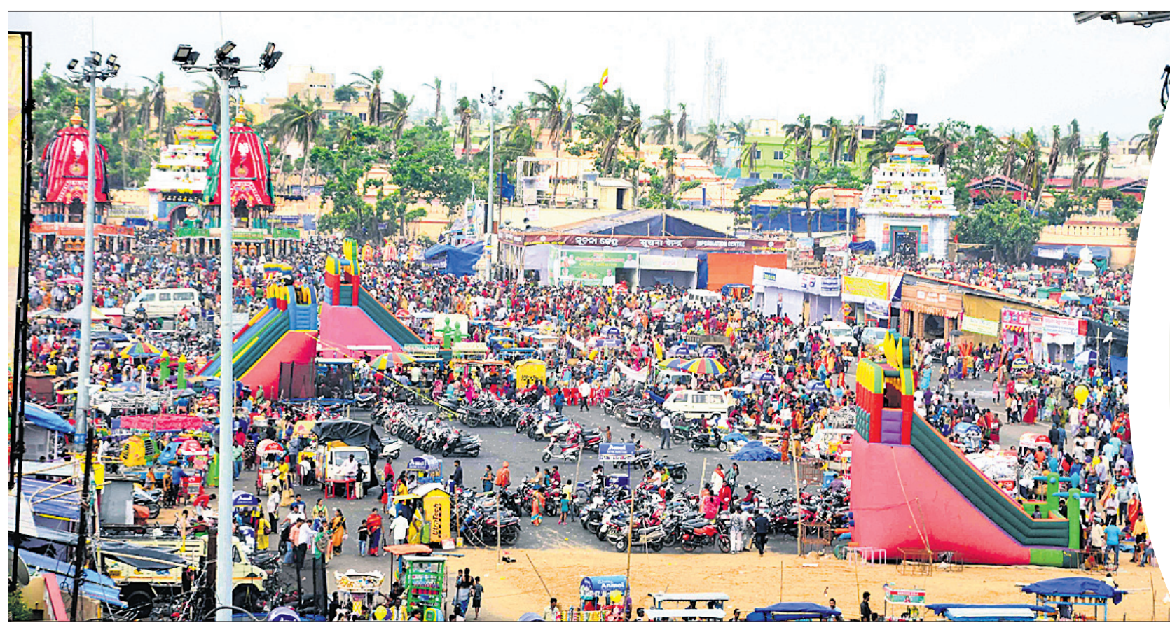
ଗୁଣ୍ଡିଚା ମନ୍ଦିର ସମ୍ମୁଖରେ ରବିବାର ଭକ୍ତଙ୍କ ଗହଳି ।