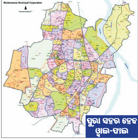
ପୁରୀ ସହର ହେବ ଖାଇ-ପାଇ