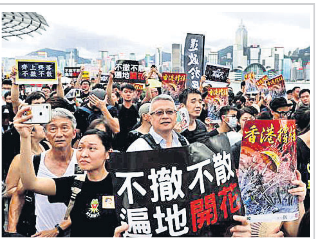
ହଂକଂରେ ପ୍ରସ୍ତାବିତ ପ୍ରତ୍ୟର୍ପଣ ଆଇନକୁ ବିରୋଧ କରି ରହିଛି। ଚାଲିବା ସମର୍ଥକ ନେତାଙ୍କ ଉପରେ ଚାପ ପକାଇବା ପାଇଁ ରବିବାର ହଜାର ହଜାର ପ୍ରଦର୍ଶନକାରୀ ଫ୍ଲେଷ୍ଟ କୋଲୁନ୍ ଷ୍ଟେସନରେ ବିକ୍ଷାଭ କରି ସ୍ତୋତ୍ରାନ ଦେଇଛନ୍ତି।