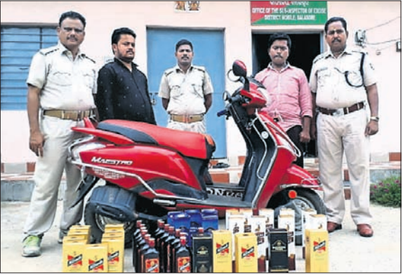
ଜବତ ମଦ ଓ ସୁଟି ସହ ଗିରଫ ଅଭିଯୁକ୍ତ ।