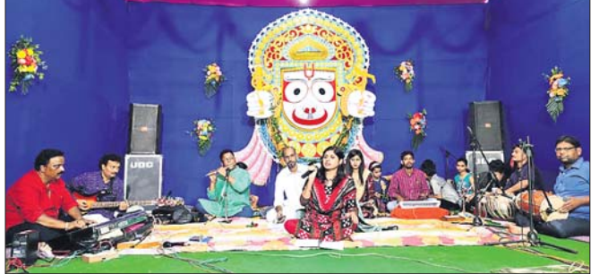
ଜଣେ କଣ୍ଠଶିଳ୍ପୀ ସଙ୍ଗୀତ ପରିବେଷଣ କରୁଛନ୍ତି ।