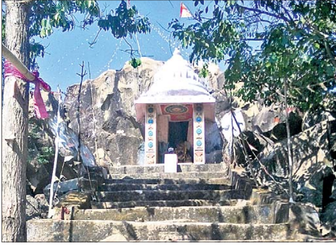
ଅବହେଳିତ ହେମଘର ଶୈବପୀଠ।

ସଦର ବ୍ଲକ୍ ଅନ୍ତର୍ଗତ ନୂଆଗାଁ ପଞ୍ଚାୟତର କାଦଗଡ଼ ଗ୍ରାମ ନିକଟରେ ପ୍ରାକୃତିକ ସୌନ୍ଦର୍ଯ୍ୟମୟ ପରିବେଶ ମଧ୍ୟରେ ହେମଘର ପାହାଡ଼ । ଜଙ୍ଗଲ ଓ ପାହାଡ଼ ପରିବେଶରେ ଥିବା ଏହି ପାହାଡ଼ ଗ୍ରାମୀୟ ଅଞ୍ଚଳବାସୀ ଦେବସ୍ଥଳୀ ଭାବେ ପୂଜା କରିଆସୁଛନ୍ତି । ଏବେ ଏହି ସ୍ଥାନରେ ଏକ ଧାର୍ମିକ ଓ ପର୍ଯ୍ୟଟନ କେନ୍ଦ୍ର ଭାବେ ପରିଗଣିତ ହୋଇଆସୁଛି । ଅଧିକ ବିକାଶ ହେଲେ ଏହାଏକ ଉତ୍ତମ ପର୍ଯ୍ୟଟନସ୍ଥଳୀ ହୋଇପାରନ୍ତା ବୋଲି ସ୍ଥାନୀୟ ଲୋକେ ପ୍ରକାଶ କରିଛନ୍ତି । ଏହି ପୀଠରେ ଆଗରୁ ରଷି ମାନେ ରହି ତପସ୍ୟା କରୁଥିଲେ ବୋଲି ବହୁ ପୁରୁଣାକାଳରୁ ବିଶ୍ୱାସ ରହିଛି । ଏଠାରେ ହେମଘର ରଷି ନାମକ ଜଣେ ରଷି ରହୁଥିଲେ । ଏଣୁ ତାଙ୍କ ନାମ ଅନୁସାରେ ଏହି ପାହାଡ଼ର ନାମ ହେମଘର ବୋଲି କୁହାଯାଏ । ଏଠାରେ ଶିବରାତ୍ରି, ମକର, କାର୍ତ୍ତିକ ପୂର୍ଣ୍ଣିମା ପାଳନ ହୋଇଥାଏ । ଶ୍ରୀବତ୍ସ ମାସରେ ଏଠାରେ ଜଳାଭିଷେକ କାର୍ଯ୍ୟକ୍ରମ ଅନୁଷ୍ଠିତ ହୋଇଥାଏ ।