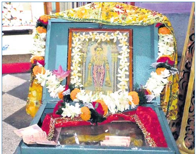
ସର୍ବସାଧାରଣଙ୍କ ଦର୍ଶନ ନିମନ୍ତେ ଶ୍ରୀଚୈତନ୍ୟଙ୍କ କଲ୍ଲୀବସ୍ତ୍ର ରଖାଯାଇଛି।

ଭଦ୍ରକ ପୌରାଞ୍ଚଳ ଅଧୀନ ସହିଆସ୍ଥିତ ଶ୍ରୀରାଧା ମଦନମୋହନ ମନ୍ଦିରରେ ଶ୍ରୀଚୈତନ୍ୟ ମହାପ୍ରଭୁଙ୍କ ଦିବ୍ୟ କଲ୍ଲୀ(ବସ୍ତ୍ର) ପ୍ରଦର୍ଶନ ରବିବାର ଅନୁଷ୍ଠିତ ହୋଇଯାଇଛି।