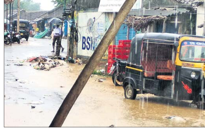
ବଜାର ଅଞ୍ଚଳରେ ୨ ଫୁଟର ପାଣି କମିଛି ।