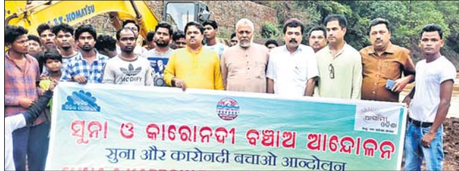
ଜଳମାନବ ଡ.ରାଜେନ୍ଦ୍ର ସିଂହଙ୍କ ସୁନା ନଦୀ ସୁରକ୍ଷା ପାଇଁ ଯୋଡ଼ା ଗସ୍ତ ।