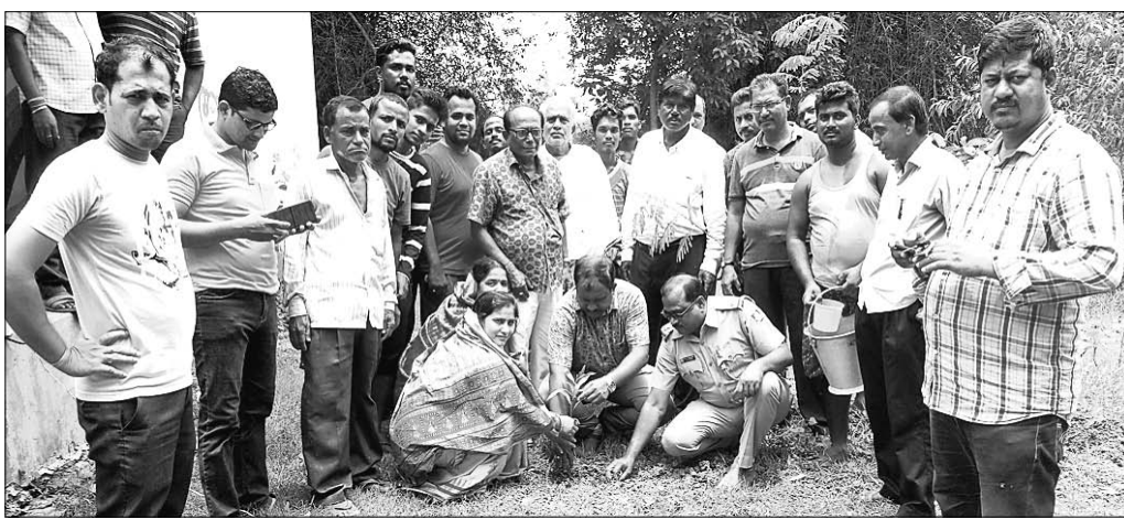
ଯୁବକସଂଘର ସଦସ୍ୟମାନଙ୍କ ଗହଣରେ ଚାନ୍ଦବାଲିରେ କରୁଛନ୍ତି।