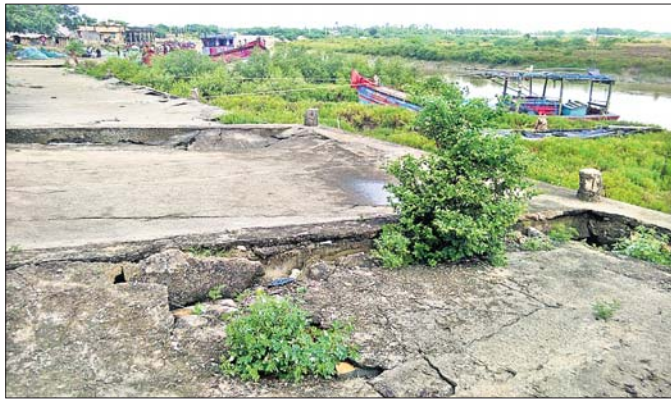
ବୃତ୍ତାମଣି ମାଛଧରା ଜେଟି।

ଭଦ୍ରକ ଜିଲାର ବାସୁଦେବପୁର ବ୍ଲକ୍ ସମୂହ ତରଫରା ଉପକୂଳବର୍ତ୍ତୀ ଅଞ୍ଚଳ। ଉକ୍ତ ବ୍ଲକର ୧୪୪୭ ଉର୍ଦ୍ଧ୍ୱ ପଞ୍ଚାୟତ ସହ ବାସୁଦେବପୁର ପୌରପାଳିକା ୨ଟି ଖାତ ଉପକୂଳ ଅଞ୍ଚଳରେ ରହିଛି।