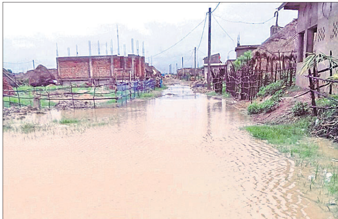
ରାଜନଗର ବଗପାଟିଆରେ ବର୍ଷା ପାଣି ଜମି ରହିଛି।

ଗତ ଏକ ସପ୍ତାହ ଧରି ବର୍ଷା ଲାଗି ରହିଛି। ତେବେ ବର୍ଷା ଯୋଗୁ ରାଜନଗର ବ୍ଲକ ରୁପ୍ରି ପଞ୍ଚାୟତର ବଗପାଟିଆ ଠାରେ ବସବାସ କରୁଥିବା ସାତଭାଇବାସୀଙ୍କ ଦୁର୍ଦ୍ଦଶା ଦିନକୁ ଦିନ ବଢିବାରେ ଲାଗିଛି।