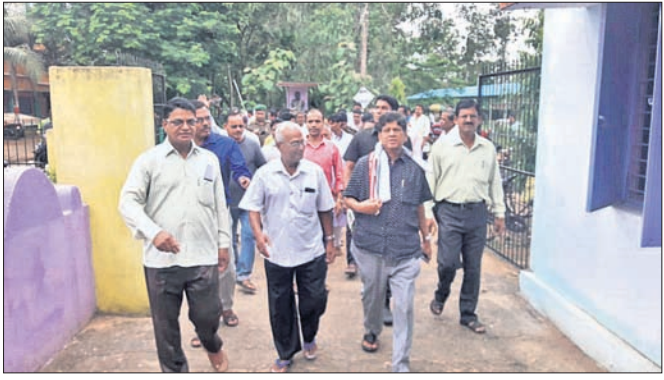
ବିଧାନସଭା ମହାବିଦ୍ୟାଳୟ ପରିସର ବୁଲି ଦେଖୁଛନ୍ତି ।

ଖଣ୍ଡପଡ଼ା ବ୍ଲକ୍ ଅନ୍ତର୍ଗତ କଣ୍ଠିଲୋ ନାକପାଧବ ମହାବିଦ୍ୟାଳୟ ପରିସରରେ ଶନିବାର ବ୍ଲକ୍ ପ୍ରଧାନଙ୍କ ବନ ମହୋତ୍ସବ ପାଳନ ହୋଇଯାଇଛି । ଉଚ୍ଚ ବିଭାଗରେ ମୁଖ୍ୟଅତିଥି ଭାବେ ଖଣ୍ଡପଡ଼ା ବିଧାନସଭା ସାଧାରଣ ପଞ୍ଚମାୟକ ଯୋଗଦେଇଥିଲେ । ଏହି ଅବସରରେ କଲେଜର ବିଭିନ୍ନ ସମସ୍ୟା ପ୍ରତି କର୍ତ୍ତୃପକ୍ଷ ବିଧାନସଭାଙ୍କ ଦୃଷ୍ଟି ଆକର୍ଷଣ କରିଥିଲେ । ସୁତନାଯୋଗ୍ୟ, କଲେଜଟି ଦୀର୍ଘ ୨୪ ହେଲା ପ୍ରତିଷ୍ଠା ହୋଇଥିବାବେଳେ ବର୍ଷ ବର୍ଷ ଧରି ଅନେକ ଆବଶ୍ୟକତା ପୂରଣ ହୋଇପାରି ନ ଥିବା ଓ ସମସ୍ୟା ଘେରରେ ରହିଥିବା ଅଭିଯୋଗ ହୋଇଆସୁଛି । ତେବେ ବିଧାନସଭା ଏହାର ସମାଧାନ ନିମନ୍ତେ ତୁରନ୍ତ ପଦକ୍ଷେପ ଗ୍ରହଣ କରିବା ସହ ଆସନ୍ତା ସେପ୍ଟେମ୍ବର