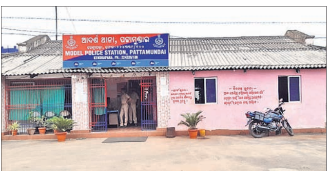
ପଟ୍ଟାମୁଣ୍ଡାଇ ଆଦର୍ଶ ଥାନା ଆଇବେକ୍ସର ଘରେ ଚାଲିଛି।

କେନ୍ଦ୍ରାପଡ଼ା ଜିଲାର ପଟ୍ଟାମୁଣ୍ଡାଇ ଆଦର୍ଶ ଥାନାରେ ଦିନକୁ ଦିନ ବିଭିନ୍ନ ପ୍ରକାର ମାମଲା ବଢି ଚାଲିଛି। ତେବେ ଆବଶ୍ୟକ ସଂଖ୍ୟକ କର୍ମଚାରୀ ଅଭାବରୁ ଆଇନଶୁଖାଳା ପରିସ୍ଥିତି ବିଗିଡିବାରେ ଲାଗିଛି। ବିଶେଷ କରି ଏହି ଥାନା ଅଞ୍ଚଳରେ ଆପରାଧିକ କାର୍ଯ୍ୟକଳାପ ରୋକିବା ପୋଲିସ୍ ପାଇଁ ଟ୍ୟାଲେଣ୍ଟ ହୋଇଛି।