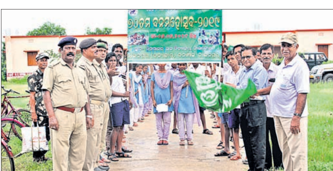
ବନ ମହୋତ୍ସବରେ ଯୋଗଦେଇଥିବା ଛାତ୍ରଛାତ୍ରୀ ଓ ଅନ୍ୟମାନେ।

ରାଜନଗର ବ୍ଲକ୍ ଗ୍ରାହଣସାହି ପଞ୍ଚାୟତ ନାଉକୋଣା ନିଗମାନନ୍ଦ ଭକ୍ତ ବିଦ୍ୟାପୀଠରେ ୭୦ତମ ବନ ମହୋତ୍ସବ ପାଳିତ ହୋଇଯାଇଛି। ରାଜନଗର ବନବିଭାଗ ପକ୍ଷରୁ ଆୟୋଜିତ ଏହି କାର୍ଯ୍ୟକ୍ରମରେ ବିଦ୍ୟାଳୟର ଛାତ୍ରଛାତ୍ରୀ ଅଂଶଗ୍ରହଣ କରିଥିଲେ।