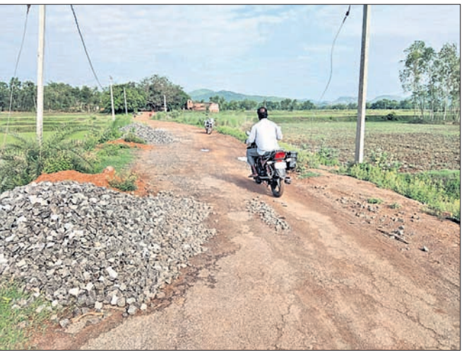
ରାସ୍ତା ନିର୍ମାଣ ପାଇଁ ପଡ଼ିରହିଥିବା ମେଟାଲ୍ ।

ବୋଲଗଡ଼ ବ୍ଲକ୍ ଅନ୍ତର୍ଗତ ହାଟବସ୍ତ୍ରଠାରୁ ଖଲିକୋଟ ମଧ୍ୟ ଦେଇ ପାଟବସ୍ତ୍ର ପର୍ଯ୍ୟନ୍ତ ଯାଇଥିବା ପୂର୍ବ ଦିଗର ରାସ୍ତାଟି ବର୍ତ୍ତମାନ ନିର୍ମାଣ ନ ହୋଇ ଅଧାପତ୍ତରିଆ ଅବସ୍ଥାରେ ପଡ଼ିରହିଛି । ୧ ବର୍ଷ ପୂର୍ବରୁ ତେଣୁ ନିର୍ମାଣ ହୋଇଥିବାବେଳେ ଏହା ଯାତାୟତ ନିର୍ମାଣ ଆରମ୍ଭ କରାଯାଇଥିଲେ ମଧ୍ୟ କାମ ବନ୍ଦ ରହିଛି । ଏଥିପାଇଁ ରାସ୍ତାର ଅବସ୍ଥା ଶୋଚନୀୟ ହୋଇପଡ଼ିଛି । ତେଣୁ ଉଚ୍ଚ ରାସ୍ତାବେଳ ଯାଇଥିବା ଲୋକେ ବହୁ ଅସୁବିଧାର ସମ୍ମୁଖୀନ ହେଉଛନ୍ତି । କାମ ଆରମ୍ଭ ସମୟରୁ କେବଳ ରାସ୍ତାର ଅଳ୍ପ କେତେକ ସ୍ଥାନରେ ମେଟାଲ୍ ଓ ମୋରଟ୍ ପକାଯିବା ପରେ ନିର୍ମାଣ ବନ୍ଦରହିଛି । ରାସ୍ତା ପାର୍ଶ୍ୱରେ ବର୍ତ୍ତମାନ କେବଳ ମେଟାଲ୍ ଗଦା ହୋଇରହିଛି । ମାତ୍ର ନିର୍ମାଣ କାର୍ଯ୍ୟ ହେଉନାହିଁ । ତେଣୁ ଉଚ୍ଚ ରାସ୍ତା କାର୍ଯ୍ୟ ତୁରନ୍ତ ଆରମ୍ଭ କରାଯିବା ସହ ଶୀଘ୍ର ସାରିବାକୁ ମଧ୍ୟ ସ୍ଥାନୀୟ ଲୋକେ ଦାବି କରିଛନ୍ତି । ସୁତନାକୁ