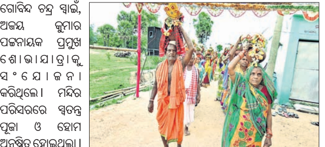
କଳସ ଶୋଭାଯାତ୍ରାରେ ମହିଳାପୁଞ୍ଜ ।