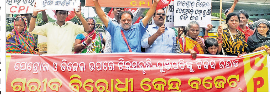
କେନ୍ଦ୍ର ବଜେଟର ବିରୋଧରେ ପ୍ରତିବାଦୀମାନଙ୍କୁ ଚଳିଥିବା ପ୍ରଦର୍ଶନ