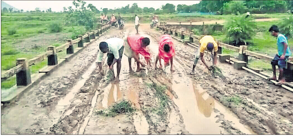
ଅଭିନବ ପ୍ରତିବାଦ: ପୋଲ ଉପରେ କମି ରହିଥିବା କାନ୍ଥୁଅରେ ଗ୍ରାମବାସୀ ଧାନ ରୋଇଛନ୍ତି।

କେନ୍ଦ୍ର ଓ ରାଜ୍ୟ ସରକାର ପ୍ରତି ଗ୍ରାମକୁ ପଙ୍କା ରାସ୍ତା ଏବଂ ଗ୍ରାମ ଭିତରେ ସିମେଣ୍ଟ କଳ୍ଚିତ୍ ରାସ୍ତା ନିର୍ମାଣ ପାଇଁ ଅର୍ଥ ବ୍ୟୟ କରୁଛନ୍ତି। ମାତ୍ର ମାଲକାନଗିରି ଜିଲାର ଆଭ୍ୟନ୍ତରୀଣ ଅଞ୍ଚଳରେ ଏହାର ସୁଫଳ ଲୋକଙ୍କୁ ମିଳୁନାହିଁ। ଜିଲାର ୭ଟି ଗ୍ରାମର ଗ୍ରାମବାସୀ ଦୀର୍ଘ ବର୍ଷ ହେଲା ରାସ୍ତା ପାଇଁ ଦୁର୍ଦ୍ଦଶା ଭୋଗୁଛନ୍ତି। ମାଲକାନଗିରି ଜିଲା ପୌର ପରିଷଦ ଠାରୁ ମାତ୍ର ୫ କିଲୋମିଟର