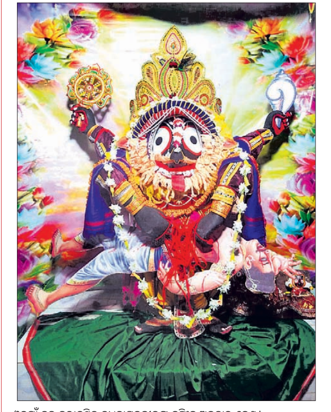
ଓଡ଼ିଶା ବ୍ଲକ୍ ଜୁରାକର୍ମିତ ଦୟାବାମନଜୀଉଙ୍କ ନୃସିଂହ ଅବତାର ବେଶ ।

ପାଟେରି ନିର୍ମାଣ ହୋଇପାରିନି । ପାଟେରି ନ ଥାଇ ୩ ପାର୍ଶ୍ୱରେ ଧାନ ଜମି ଥିବାରୁ ଅଣକ୍ଷାତ୍ରମାନେ କଲେଜ ପରିସରକୁ ପ୍ରବେଶ କରିବାର ଆଶଙ୍କା ରହିଛି । ଅପରପକ୍ଷେ ମହାନଦୀ କୂଳରେ ମହାବିଦ୍ୟାଳୟଟି ରହିଥିବାବେଳେ ଏଠାରେ ପାନୀୟ ଜଳର ଘୋର ସମସ୍ୟା ଦେଖାଦେଇଛି । ଯଦିଓ ଗ୍ରାମ୍ୟ ଜଳ ଯୋଗାଣ ଓ ପରିମଳ ବିଭାଗ ପକ୍ଷରୁ କଣ୍ଠିଲୋ ଅଞ୍ଚଳକୁ ପାନୀୟ ଜଳ ବ୍ୟବସ୍ଥା କରାଯାଇଛି ତେବେ କଲେଜ ପରିସରକୁ ଏହି ସୁବିଧା ଉପଲବ୍ଧ ହୋଇପାରିନି । ଏ ନେଇ ପ୍ରଶ୍ନାତ୍ମକ ଭାବରେ ଅଭିଯୋଗ ହେଉଥିଲେ ମଧ୍ୟ କୌଣସି ପଦକ୍ଷେପ ହେଉ ନ ଥିବାରୁ ଅସନ୍ତୋଷ ପ୍ରକାଶ ପାଇଥିଲା । ତେବେ ବିଧାନସଭା ପଞ୍ଚମାୟକଙ୍କ ଦୃଢ଼ ପ୍ରତିଶ୍ରୁତି ପରେ କଲେଜରେ ଖୁସି ପ୍ରକାଶ ପାଇଛି ।