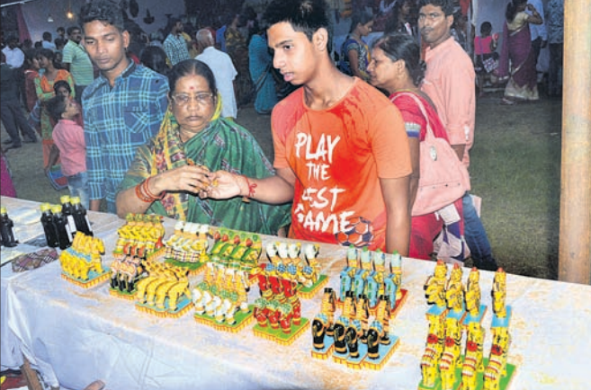
ପଲ୍ଲିଶ୍ରୀ ମେଳାରେ ସ୍ଥାନ ପାଇଥିବା ନୟାଗଡ଼ର କାଠ କର୍ମେତ ।

ଚତୁର୍ଦ୍ଧାଦିଗ୍ରହ ଏବେ ଚୁକ୍ତିତା ମନ୍ଦିରରେ ଭକ୍ତଙ୍କୁ ଦର୍ଶନ ଦେଉଛନ୍ତି । ଆଡ଼ପକ୍ଷପରେ ବାହୁଡ଼ିପ୍ରସାଦ ଦର୍ଶନ କରିବା ଲାଗି ଶରାଧାକାଳରେ ଜମିଲ ଶ୍ରଦ୍ଧାଳୁଙ୍କ ଭିଡ଼ । ଠାକୁରଙ୍କ ଦର୍ଶନ ଏବଂ ଆଡ଼ପ ଅବତା ପାଇବା ପରେ ପଲ୍ଲିଶ୍ରୀ ମେଳାକୁ ଛୁଟୁଛନ୍ତି ଭକ୍ତ । ଭୋଳାନାଥ ବିଦ୍ୟାପୀଠ ପରିସରରେ ଚାଲିଥିବା ଏହି ଜାତୀୟସ୍ତରୀୟ ମେଳା ରବିବାର ଷଷ୍ଠ ଦିନରେ ପହଞ୍ଚିଛି । ରବିବାର ଛୁଟିଦିନ ଯୋଗୁ ମେଳା ପଡ଼ିଆ ଲୋକାରଣ୍ୟ ହୋଇପଡ଼ିଥିଲା । ରାତି ପ୍ରାୟ ୧୦ଟା ପର୍ଯ୍ୟନ୍ତ ପ୍ରବଳ ଗହଳ ଲାଗିରହିଥିଲା । ଘରକରଣା ସାମଗ୍ରୀଠାରୁ ଆରମ୍ଭ କରି ଖାଦ୍ୟ ପଦାର୍ଥ, ଖେଳଣା ବୋଲାନ ସଂପର୍କିତ ସମସ୍ତକିଛି ମନୋରଞ୍ଜନ ପାଇଁ ବିଭିନ୍ନ ପ୍ରକାର ବୋଲି ଲାଗିଛି । ଫଳରେ ଦେଖଣୀହାରୀଙ୍କ ଭିଡ଼ ହେଉଛି ।