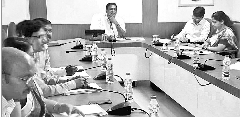
ସମାକ୍ଷା ବୈଠକରେ ଅଧିକାରୀମାନଙ୍କ ସହ ଆଲୋଚନା କରୁଛନ୍ତି ସ୍ୱାସ୍ଥ୍ୟ ମନ୍ତ୍ରୀ ନବକିଶୋର ଦାସ ।

ସରକାରୀ ଡାକ୍ତରଖାନାକୁ ବିଶ୍ୱସ୍ତରୀୟ ଯନ୍ତ୍ରପାତି ଦିଆଯିବ ବୋଲି ବିଶେଷଜ୍ଞ କର୍ମଚାରୀ ପରାମର୍ଶକ୍ରମେ ଏହା କିଛି ଦିନ ପୂର୍ବରୁ ସରକାରୀ ଡାକ୍ତରଖାନାକୁ ବିଶ୍ୱସ୍ତରୀୟ ଯନ୍ତ୍ରପାତି ଦିଆଯିବ ବୋଲି କହିଛନ୍ତି । ସରକାରୀ ଡାକ୍ତରଖାନାକୁ ବିଶ୍ୱସ୍ତରୀୟ ଯନ୍ତ୍ରପାତି ଦିଆଯିବ ବୋଲି କହିଛନ୍ତି । ସରକାରୀ ଡାକ୍ତରଖାନାକୁ ବିଶ୍ୱସ୍ତରୀୟ ଯନ୍ତ୍ରପାତି ଦିଆଯିବ ବୋଲି କହିଛନ୍ତି ।