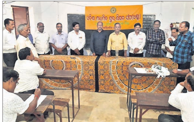
ସମ୍ମିଳନୀରେ ଯୋଗଦେଇଥିବା ଓଷ୍ଟାର କର୍ମକର୍ତ୍ତା ।