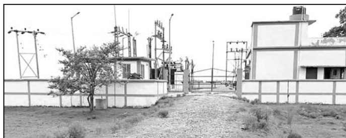
ଗତ ଫେବୃୟାରୀ ୧୯ରେ ହୋଇଥିଲା ଉଦ୍‌ଘାଟନ