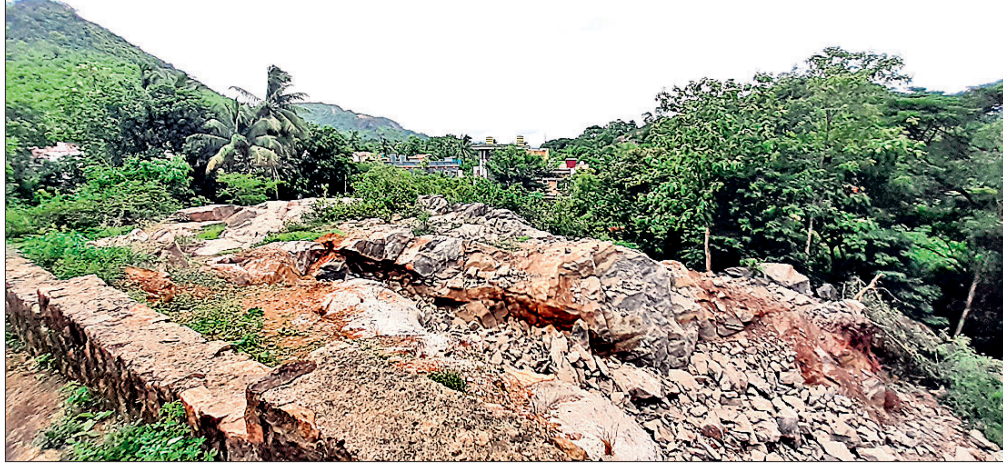
ସହର ମଝିରେ ଥିବା ପଥର ଖଣି ।

ନୟାଗଡ଼ ସହର ମଝିରେ ରହିଛି ପଥର ଖଣି । ଜଣେ ବ୍ୟକ୍ତିଙ୍କର ଏହା ଘରୋଇ ଖଣି ହୋଇଥିବା ବେଳେ ଉକ୍ତ ଖଣିରୁ ସୋମବାର ଦିନ ଦ୍ୱିପ୍ରହରରେ ବେଆଇନ ଭାବେ ରାଷ୍ଟ୍ର ସହର ଖଣିରୁ ଖରାଦ ହେବା ଘଟଣା ଘଟିଥିଲା । ଏହାର ଶର ଶବ୍ଦ ଶୁଣି ଥିଲା ଯେ କିଛି ସମୟ ପାଇଁ ଅଞ୍ଚଳବାସୀ ଭୟଭୀତ ହୋଇଯାଇଥିଲେ । ବିଭିନ୍ନ ସମୟରେ ଖଣିରେ ରାଷ୍ଟ୍ର ସହର ଖଣିରେ ନେଇ ଅଭିଯୋଗ ହେଉଥିବା ବେଳେ ପ୍ରଶାସନ ସବୁ ଜାଣି ନାହାନ୍ତୁଥିଲା ପାଇଁ ।