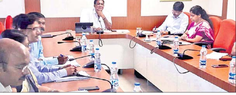
ସମୀକ୍ଷା ବୈଠକରେ ଅଧିକାରୀମାନଙ୍କ ସହ ଆଲୋଚନା କରୁଛନ୍ତି ସ୍ୱାସ୍ଥ୍ୟ ମନ୍ତ୍ରୀ ନବକିଶୋର ଦାସ ।

ଭୁବନେଶ୍ୱର, ୮।୭ (ବ୍ୟୁରୋ): ସରକାରୀ ଡାକ୍ତରଖାନାଗୁଡ଼ିକ ଲାଗି ରାଜ୍ୟ ସରକାର ବିଶ୍ୱସ୍ତରୀୟ ଯନ୍ତ୍ରପାତିକିଣିବେ ବିଶେଷଜ୍ଞ କମିଟିର ପରାମର୍ଶକ୍ରମେ ଏହା କିଣିବା ପାଇଁ ସ୍ୱାସ୍ଥ୍ୟ ଓ ପରିବାର କଲ୍ୟାଣ ମନ୍ତ୍ରୀ ନବକିଶୋର ଦାସ ନିର୍ଦ୍ଦେଶ ଦେଇଛନ୍ତି। ସୋମବାର ଓଡ଼ିଶା ମେଡିକାଲ କର୍ପୋରେଶନର କାର୍ଯ୍ୟ ସମୀକ୍ଷା ଅବସରରେ ମନ୍ତ୍ରୀ କହିଛନ୍ତି ଯେ, ଡାକ୍ତରୀ ସାଧକସରଜୀମ କିଣିବା କ୍ଷେତ୍ରରେ ପୂର୍ବ ଧାରାରେ ପରିବର୍ତ୍ତନ କରାଯିବ। କୌଣସି ସାମଗ୍ରୀ କିଣିବା ସମୟରେ ତାହାର 'କ୍ୱେଣ୍ଟିଫିକେଶନ୍' ଅପେକ୍ଷା ଏହା କେତେ ଆଧୁନିକ ସେନେଇ ଅଧିକ ଦେବ। ସେହିଭଳି ଏହି ଯନ୍ତ୍ରପାତି ଯୋଗାଇବାକୁ ଚେଷ୍ଟାରେ କୃତକାର୍ଯ୍ୟ ହେଉଥିବା ସଂସ୍ଥା ଯେଉଁଲି ଧାର୍ଯ୍ୟ ସମୟରେ ତାହା ପ୍ରଦାନ କରିବେ, ସେଥିଲାଗି ଗୁରୁତ୍ୱ ଦେବାକୁ ମନ୍ତ୍ରୀ କହିଛନ୍ତି। ଯଦି କୌଣସି ସଂସ୍ଥା ନିର୍ଦ୍ଧାରିତ ସମୟ ଅବଧି ମଧ୍ୟରେ