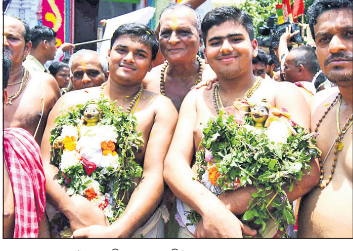
ରଥ ଉପରକୁ ରାମ ଓ କୃଷ୍ଣଙ୍କୁ ବିଜେ କରାଯାଉଛି ।