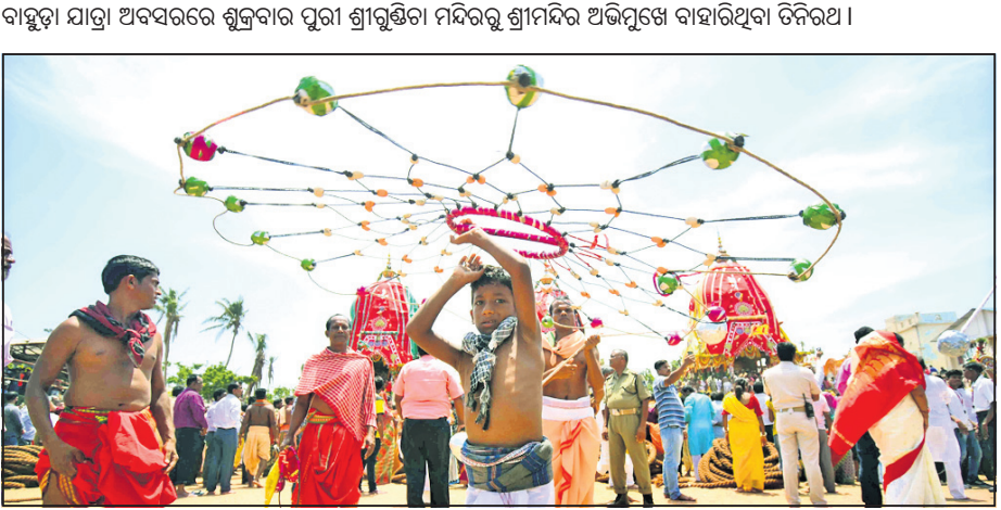
ରଥ ସମ୍ମୁଖରେ ବନାଟି ପ୍ରଦର୍ଶନ ।