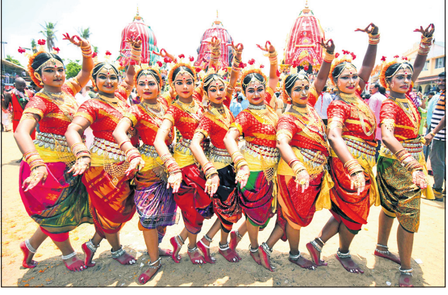
ରଥ ସମ୍ମୁଖରେ କଳାକାରଙ୍କ ମାହାରୀ ନୃତ୍ୟ ।