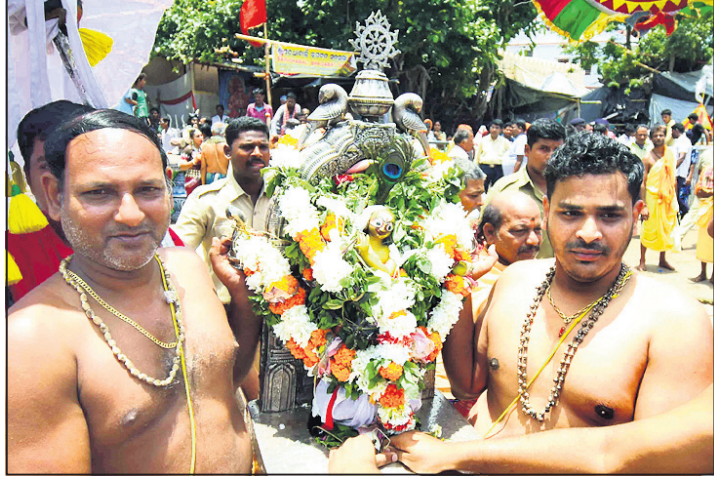
ଶ୍ରୀମଦନମୋହନଙ୍କୁ ସେବାଭଙ୍ଗମାନେ ରଥକୁ ନେଉଛନ୍ତି ।