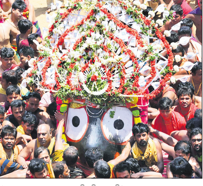
ଶ୍ରୀଜଗନ୍ନାଥଙ୍କୁ ସେବାଭଙ୍ଗମାନେ ପହଞ୍ଚି କରି ନେଉଛନ୍ତି ।