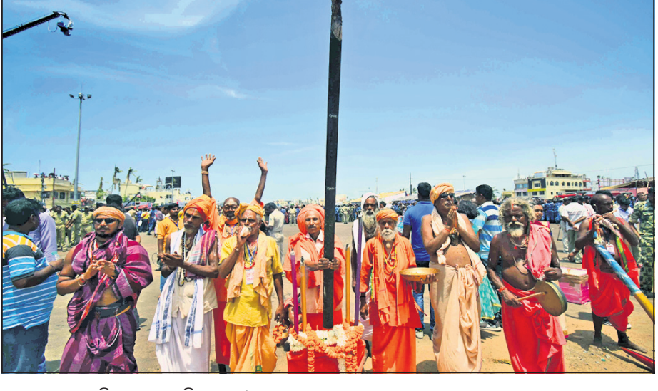
ସାଧୁସଭଙ୍କ ଦ୍ଵାରା ବିଶାଳ ଅଗରବତି ପ୍ରସ୍ତୁତନ ।