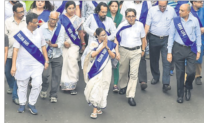
କୋଲକାତାରେ ଜଳ ସଂରକ୍ଷଣ ସଚେତନତା ରାଲିରେ ମୁଖ୍ୟମନ୍ତ୍ରୀ ବାନାର୍ଜୀ ଓ ଅନ୍ୟମାନେ ଯୋଗ ଦେଇଛନ୍ତି।