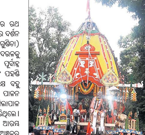
ରଥାରୁ ତିନି ଠାକୁର।

ଶେଷ ହୋଇଛି ଘୋଷ ଯାତ୍ରା। ଶୁକ୍ରବାର ରଥ ଉପରେ ୩ ଠାକୁର ଶ୍ରୀକାଳୁକ୍ଷୁ ସୁନାବେଶରେ ଦର୍ଶନ ଦେଇଛନ୍ତି। ମାଦିକୁଦାସ୍ଥିତ ଦଣ୍ଡବାନ (ଗୁଣ୍ଡିଚା) ମନ୍ଦିରରେ ଅବସ୍ଥାନ ପରେ ୩ ଠାକୁର ବଡ଼ବେଳକୁ ବନ୍ଧୁ ଭକ୍ତଙ୍କ ଗହଣରେ ବାହାରିଥିଲେ। ପୂର୍ବାହ୍ନି ପ୍ରାୟ ୧୦ଟାରୁ ରଥ ଉପରକୁ ଠାକୁରଙ୍କ ପହଣ୍ଡି ବିଜେ ହୋଇଥିଲା। ଏକାଦଶୀ ଉପଲକ୍ଷେ ବନ୍ଧୁ ଶ୍ରୀକାଳୁକ୍ଷୁ ତିନିଠାକୁରଙ୍କ ଦର୍ଶନ କରି ବ୍ରତ ପାଳନ କରିଥିଲେ। ସାଢ଼େ ୧୨ଟାରେ ଅତିରିକ୍ତ ଜିଲ୍ଲାପାଳ ବସନ୍ତ କୁମାର ସାହୁ ଛେରାପହରା କରିଥିଲେ। ପ୍ରାୟ ସାଢ଼େ ୧୩ ବେଳେ ରଥଟଣା ଆରମ୍ଭ ହୋଇଥିଲା। ଫୁଲବାଣୀ ତଥା ଆଖପାଖ ଅଞ୍ଚଳର ହଜାର ହଜାର ଶ୍ରଦ୍ଧାଳୁ ରଥ ଚାଣିଥିଲେ। ସନ୍ଧ୍ୟା ପ୍ରାୟ ୭ଟା ପୂଜା ରଥ ଜଗନ୍ନାଥ ମନ୍ଦିରରେ ପହଞ୍ଚିଥିଲା। ପୁଣ୍ୟ ବିଶ୍ୱକର୍ମା ସୁନାକ ମହାରଣା ରଥ ଚାଳନା କାର୍ଯ୍ୟ ସମ୍ପାଦନ କରିଥିଲେ। କନ୍ଧମାଳ