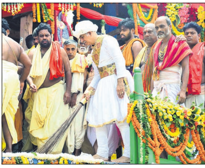
ବଳଭଦ୍ରଙ୍କ ରଥରେ ଗଜପତି ମହାରାଜା ଦିବ୍ୟସିଂହ ଦେବ ଛେରା ପହଞ୍ଚା କରୁଛନ୍ତି ।