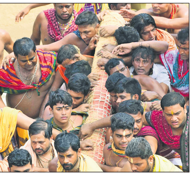
ଶ୍ରୀସୁଦର୍ଶନଙ୍କୁ ପହଞ୍ଚି କରି ରଥକୁ ନିଆଯାଉଛି ।