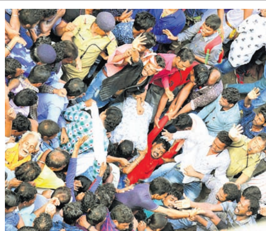
ବୋକମଣ୍ଡପ ସାହି ପ୍ରବେଶପଥରେ ହୋଇଥିବା ଦଳାଚକଟା

ବଡ଼ଠାକୁରଙ୍କ ଚାଳଧିକ ରଥ ଟଣାଯାଇଥିଲା। ଏହାପରେ ଅପରାହ୍ଣ ୧୨ଟା ୫୦ରେ ଦର୍ପଦଳନ ଏବଂ ଶେଷରେ ଅପରାହ୍ଣ ୨ଟା ୫୦ରେ ନନ୍ଦିଘୋଷ ରଥକୁ ଭକ୍ତ ଟାଣିଥିଲେ। ମାଉସୀ ମା' ମନ୍ଦିର ସମ୍ମୁଖରେ ପ୍ରତି ରଥ ପହଞ୍ଚିବା ପରେ ଠାକୁରଙ୍କୁ ପୋଡ଼ିପିଠା ସମର୍ପଣ କରାଯାଇଥିଲା। ଅପରାହ୍ଣ ୩ଟା ୫୦ରେ ଚାଳଧିକ ଏବଂ ୪ଟାରେ ଦର୍ପଦଳନ ରଥ ସିଂହଦ୍ୱାର ନିକଟରେ ପହଞ୍ଚିଥିଲା। ନନ୍ଦିଘୋଷ ରଥ ଶ୍ରୀମନ୍ଦିରଠାରେ ପହଞ୍ଚିବା ପରେ ସେଠାରେ ଲକ୍ଷ୍ମୀ ନାରାୟଣ ଭେଟ ନାଚି ସମ୍ପନ୍ନ ହୋଇଥିଲା। ଅପରାହ୍ଣ ୫ଟା ୧୦ରେ ଶ୍ରୀକଗନାଥଙ୍କ ରଥଟଣା ଯାଇ ସିଂହଦ୍ୱାରକୁ ନିଆଯାଇଥିଲା। ସାଢ଼େ ୫ଟାରେ ନନ୍ଦିଘୋଷ ସିଂହଦ୍ୱାରରେ ଲାଗିଥିଲା। ପ୍ରଣାସନ ପକ୍ଷରୁ ଭୁରଞ୍ଜ ରଥ ଚତୁର୍ଦ୍ଧାବିଗ୍ରହେ ବ୍ୟାରିକେଡ଼ କରାଯାଇଥିଲା। ଭକ୍ତମାନେ ରଥାରୁତ୍ ଦାରୁଦିଅଁଙ୍କୁ ଦର୍ଶନ କରିଥିଲେ। ବାହୁଡ଼ା ଯାତ୍ରାରେ ପ୍ରାୟ ୫ ଲକ୍ଷ ଭକ୍ତଙ୍କ ସମାଗନ ହୋଇଥିବା ପ୍ରଣାସନ ପକ୍ଷରୁ ଆକଳନ କରାଯାଇଛି। ଗତବର୍ଷ ତିନିରଥ ଅପରାହ୍ଣ ୫ଟା ୩୫ରେ ସିଂହଦ୍ୱାରରେ ଲାଗିଥିଲା। ଏଥର ଆହୁରି ୫ ମିନିଟ୍ ପୂର୍ବରୁ ତିନିରଥ ପହଞ୍ଚିଯାଇଛି। ଚେଷ୍ଟା ବିରତ କରିବର୍ତ୍ତୀ ଦେଖିଲେ ପହଞ୍ଚି, ରଥଟଣା ଏବଂ ସିଂହଦ୍ୱାରରେ ରଥ ଲାଗିବା ଏକ ରେକର୍ଡ ବୋଲି ଶ୍ରୀମନ୍ଦିର ପ୍ରଣାସନ ପକ୍ଷରୁ କୁହାଯାଇଛି।