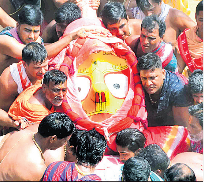
ଦେବୀ ସୁଭଦ୍ରାଙ୍କୁ ପହଞ୍ଚିରେ ରଥ ଉପରକୁ ନିଆଯାଉଛି ।