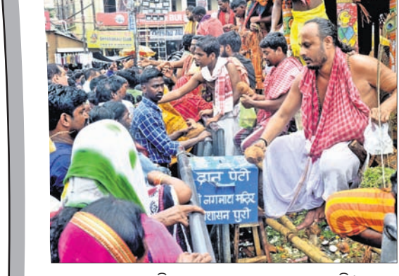
ରଥାରୁ ଠାକୁରଙ୍କ ନିକଟରେ ଶ୍ରଦ୍ଧାଳୁ ଭୋଗ ଲଗାଉଛନ୍ତି ।

ରଥ ପଛରେ ତୁଳସୀ, ଫୁଲ ବିକ୍ରି ମହାପ୍ରଭୁଙ୍କ ଲାଗିହୋଇଥିବା ତୁଳସୀ ଓ ଫୁଲ ପାଇବା ପାଇଁ ଭକ୍ତଙ୍କ ବ୍ୟାକୁଳତାକୁ ଦେଖି ତିନିରଥ ପଛରେ କେତେଜଣ ବ୍ୟକ୍ତି ତୁଳସୀ ବିକ୍ରି କରୁଥିଲେ । କର୍ତ୍ତନ ଭିତରେ ଥାଇ ସେମାନେ ଆଗ ଟଙ୍କା ମାଗୁଥିଲେ । ଟଙ୍କା ପାଇବା ପରେ ତୁଳସୀ ଓ ଫୁଲ ଦେଉଥିଲେ । ଜଣେ ଭକ୍ତ ଧାଡ଼ିରେ ଯାଉଥିବାବେଳେ ୧୦ଟଙ୍କା ଖଣ୍ଡିଏ ବଡ଼ାଇ ଦେବାକୁ ତାଙ୍କୁ ଗୋଟିଏ ତୁଳସୀ ପତ୍ର ଓ ଦୁଇଟି ଫୁଲ ମିଳିଥିଲା । ହେଲେ ଏଥିରେ ଭକ୍ତ ଜଣଙ୍କ କୌଣସି ଅସନ୍ତୋଷ ପ୍ରକାଶ କରି ନ ଥିଲେ । ବରଂ ଯାହାହେଉ ମହାପ୍ରଭୁଙ୍କ ତୁଳସୀ ଓ ଫୁଲ ଭାଗ୍ୟରେ ଥିଲା ବୋଲି କହି ସେ ଧାଡ଼ିରେ ଆଗକୁ ମାଡ଼ିଚାଲିଥିଲେ । ସେହିପରି ଠାକୁରଙ୍କ ଶିରି କପଡ଼ା କହି ଖଣ୍ଡକୁ ୧୫ରୁ ୨୦ ଟଙ୍କା ବିକ୍ରି କରାଯାଉଥିବା ମଧ୍ୟ ଦେଖିବାକୁ ମିଳିଥିଲା ।