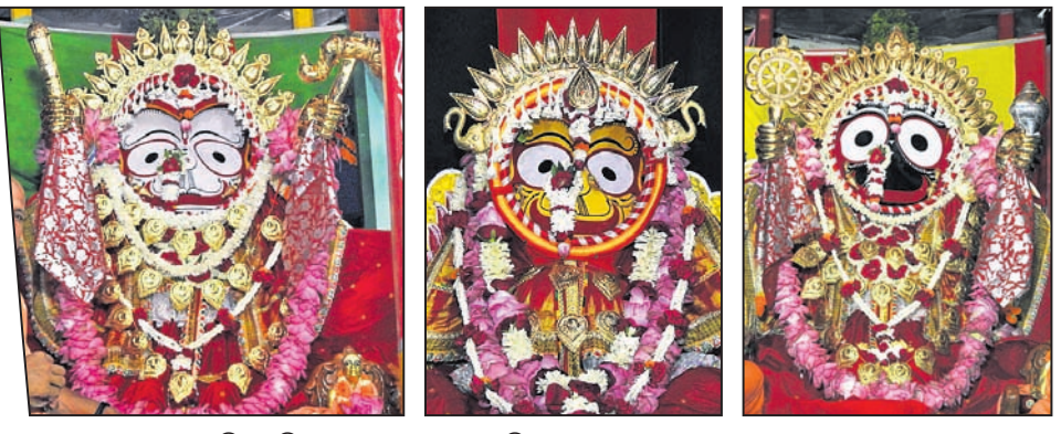
ଭୁବନେଶ୍ୱର ଇନ୍ଦ୍ର ମନ୍ଦିର ପରିସରରେ ସୁନାବେଶରେ ସଜିତ ଶ୍ରୀବଳଭଦ୍ର, ଦେବୀ ସୁଭଦ୍ରା ଏବଂ ମହାପ୍ରଭୁ ଶ୍ରୀଜଗନ୍ନାଥ ।