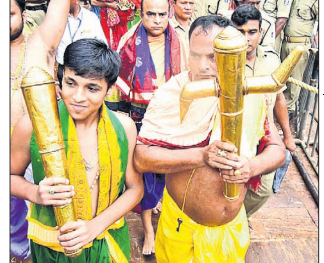
ଶ୍ରୀବଳଭଦ୍ରଙ୍କ ସୁବର୍ଣ୍ଣ ହଳ ଓ ଲଙ୍କାକ ରଥ ଉପରକୁ ନିଆଯାଉଛି ।