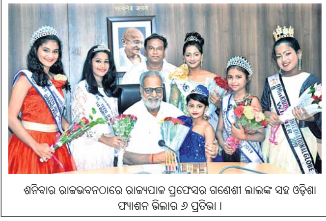
ଶନିବାର ରାଜଭବନଠାରେ ରାଜ୍ୟପାଳ ପ୍ରଫେସର ଗଣେଶ ଲାଲଙ୍କ ସହ ଓଡ଼ିଶା ଫ୍ୟାଶନ ଭିଲାର ୬ ପ୍ରତିଭା।

ଭୁବନେଶ୍ୱର ଭଞ୍ଜ କଳାମଣ୍ଡପଠାରେ ଶନିବାର ଅନୁଷ୍ଠିତ 'ଅଞ୍ଚଳ ସିକ୍ସଟିନ୍'ରେ ଯୁବ ଶିଳ୍ପୀଙ୍କ ଓଡ଼ିଶା ନୃତ୍ୟ ପରିବେଷଣ।