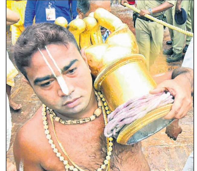
ରଥ ଉପରକୁ ସୁନାବେଶ ଲାଗି ଶ୍ରୀକୁଳ ନେଉଛନ୍ତି ଜଣେ ସେବାୟତ ।