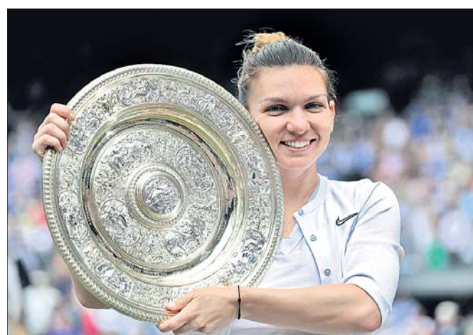
ଓ୍ରେମେଲଡନ ମହିଳା ସିଙ୍ଗଲ୍ସ ଚାମ୍ପିୟନ୍ ସିମୋନା ହାଲେପ୍।

ଲଣ୍ଡନ, ୧୩୩୭: ରୋମାନିଆର ସିମୋନା ହାଲେପ୍ ପ୍ରଥମଥର ଓ୍ରେମେଲଡନ ଟାଇଟଲ ହାସଲ କରିଛନ୍ତି। ଶନିବାର ସେଣ୍ଟର କୋର୍ଟଠାରେ ଅନୁଷ୍ଠିତ ମହିଳା ସିଙ୍ଗଲ୍ସ ଫାଇନାଲରେ ସେ ଆମେରିକାର ବିଶ୍ୱ ଖେଳାଳି ସେରେନା ୱିଲିୟମ୍ସଙ୍କୁ ୬-୨, ୬-୨ ସିଟାସକ୍ଷେପ ସେଟ୍‌ରେ ହରାଇ ଦେଇଛନ୍ତି। ମ୍ୟାଚଟି ମାତ୍ର ୫୬ ମିନିଟ୍‌ରେ ଶେଷ ହୋଇଯାଇଥିଲା। ଏହି ବିଜୟ ଦ୍ୱାରା ୨୪ ଗ୍ରାଣ୍ଡସ୍ଲାମ ଟାଇଟଲ ରେକର୍ଡର ସମକକ୍ଷ ହେବା ଲାଗି ସେରେନା ଯେଉଁ ସ୍ୱପ୍ନ ଦେଖୁଥିଲେ ତାହା ଅଧିକାରିତ ହୋଇଛି। ବର୍ଷକ ମଧ୍ୟରେ ୩୭ ବର୍ଷୀୟ ଆମେରିକୀୟ ଖେଳାଳିଙ୍କୁ ତୃତୀୟ ପ୍ରମୁଖ ଫାଇନାଲ ପରାଜୟ। ଅନ୍ୟପକ୍ଷରେ ପୂର୍ବତନ ବିଶ୍ୱର ନମ୍ବର ଓ୍ରେନ ୨୭ ବର୍ଷୀୟା