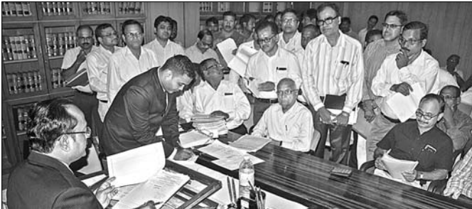
ଓଡ଼ିଶା ହାଇକୋର୍ଟ ପରିସରରେ ଶନିବାର ଅନୁଷ୍ଠିତ ଜାତୀୟ ଲୋକ ଅବାଲତ।