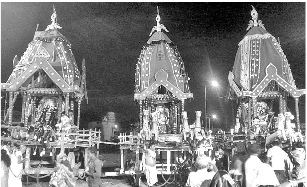
କୋଣାର୍କ ରାଜାରାମ ମଠ ଗ୍ରନ୍ଥ ବୋର୍ଡ ପକ୍ଷରୁ ଶ୍ରୀଜୀଉମାନଙ୍କୁ ସୁନାବେଶ କରାଯାଇଛି।