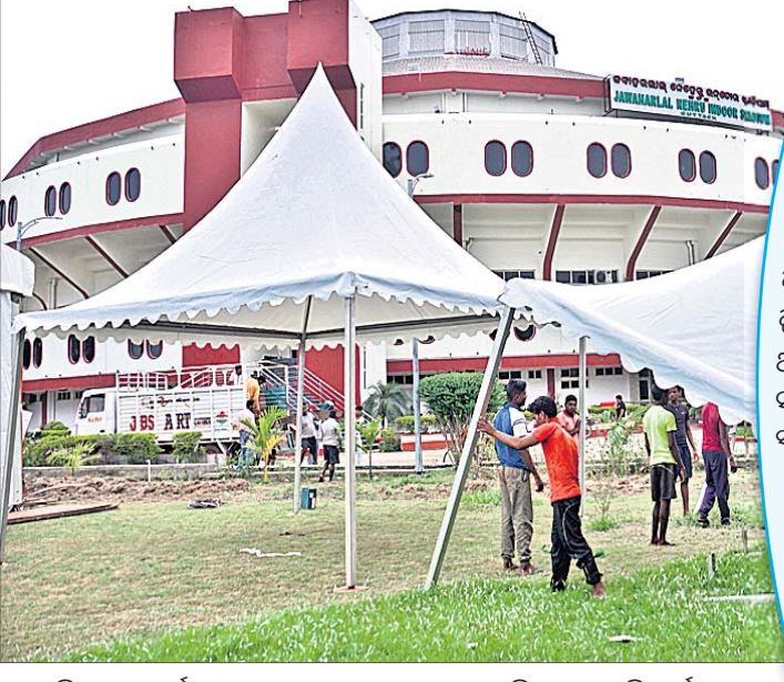
କଣେ ଚିତ୍ରଶିଳ୍ପୀ କଟକ ସହରର ଏକ ପ୍ରାଙ୍ଗଣରେ ଚିତ୍ର ଆଙ୍କୁଛନ୍ତି। ଶେଷ ପର୍ଯ୍ୟାୟରେ ଜବାହରଲାଲ ଇନ୍‌ଡୋର ଷ୍ଟାଡ଼ିୟମର ପ୍ରସ୍ତୁତି କାର୍ଯ୍ୟ।