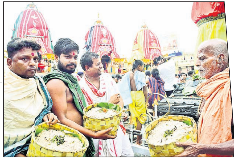
ରଥ ସମ୍ମୁଖରେ ଠାକୁରଙ୍କ ଉଦ୍ଦେଶ୍ୟରେ ରୁଡ଼ାଘଷା ଭୋଗ ଲାଗି କରାଯାଉଛି ।