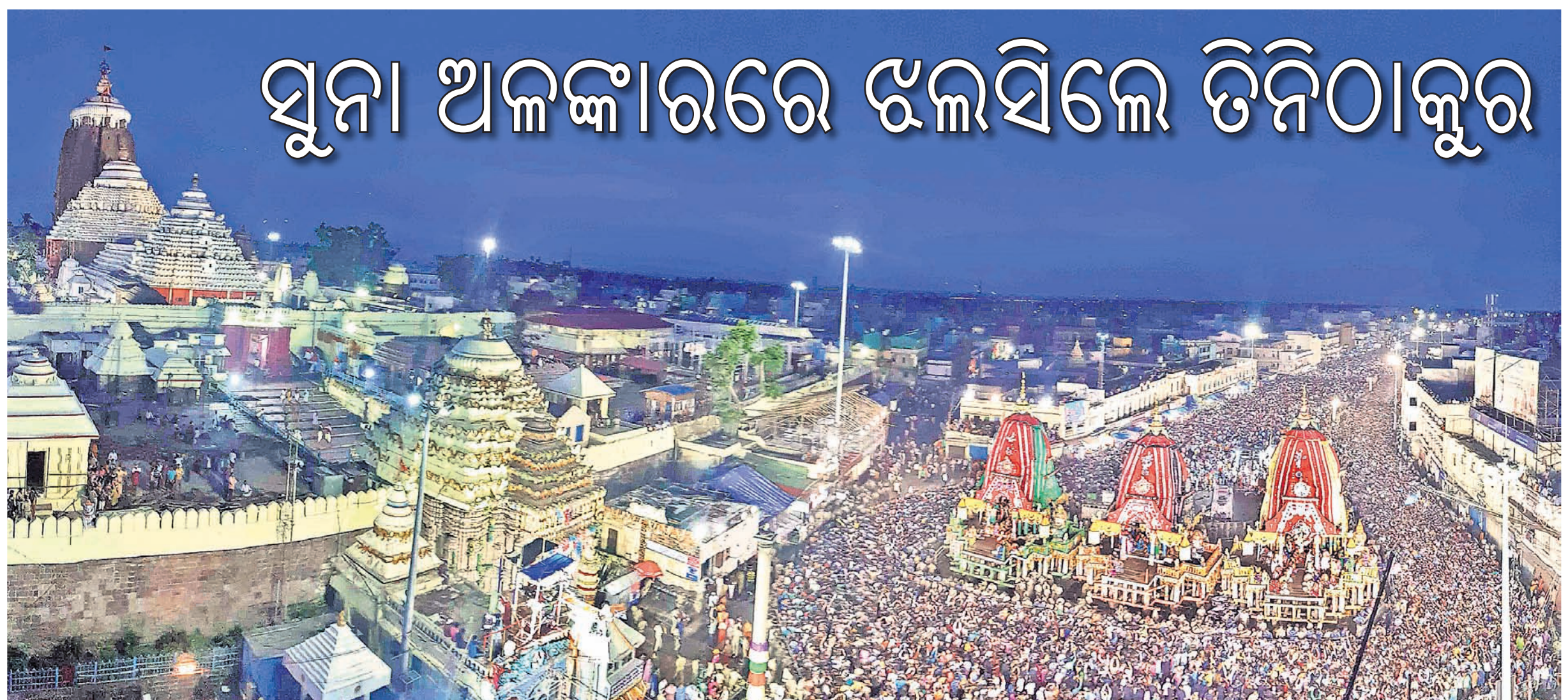
ପୁରୀ ବଡ଼ଦାଣ୍ଡରେ ଜନସମୁଦ୍ର ମଧ୍ୟରେ ତିନି ରଥ ।