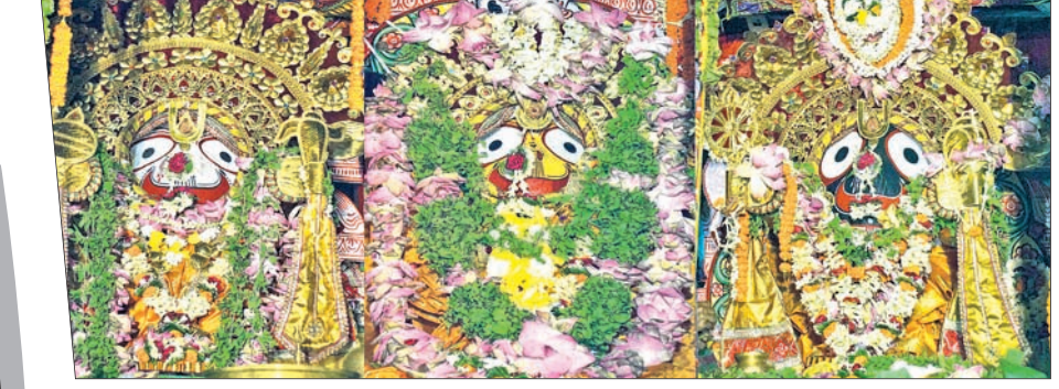
କଟକ ରାଜିନୀଗୋବିନ୍ଦଚନ୍ଦ୍ର ଜଗନ୍ନାଥ ମନ୍ଦିର ସମ୍ମୁଖରେ ତିନିଠାକୁରଙ୍କ ସୁନାବେଶ ।