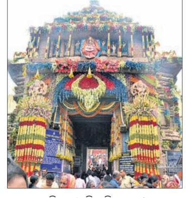
ଫୁଲରେ ସଜିତ ଶ୍ରୀମନ୍ଦିର ସିଂହଦ୍ୱାର ।