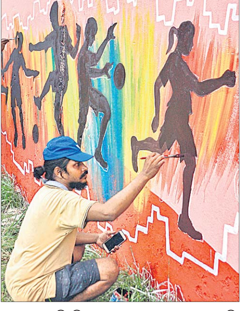
କଣେ ଚିତ୍ରଶିଳ୍ପୀ କଟକ ସହରର ଏକ ପ୍ରାଙ୍ଗଣରେ ଚିତ୍ର ଆଙ୍କୁଛନ୍ତି। ଶେଷ ପର୍ଯ୍ୟାୟରେ ଜବାହରଲାଲ ଇନ୍‌ଡୋର ଷ୍ଟାଡ଼ିୟମର ପ୍ରସ୍ତୁତି କାର୍ଯ୍ୟ।