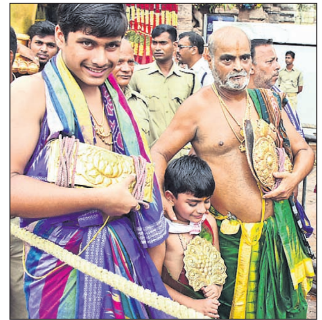
ମହାପ୍ରଭୁଙ୍କ ସୁବର୍ଣ୍ଣ ପଦକ ଧରି ଯାଉଛନ୍ତି ସେବାୟତ ।