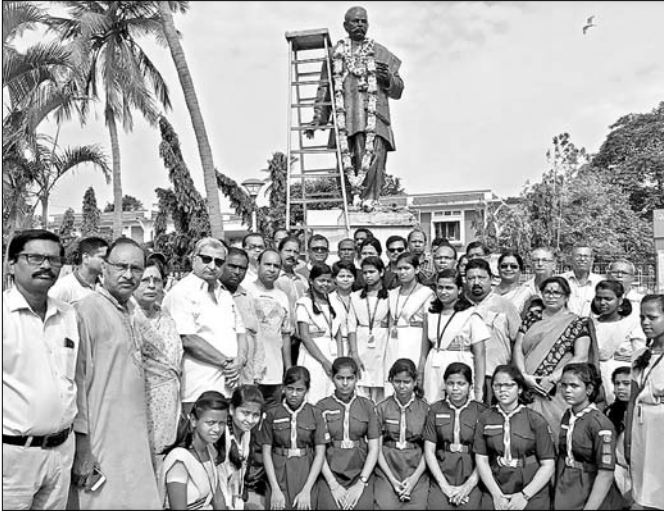
କର୍ମଚାରୀ ଗୌରୀଶଙ୍କର ରାୟଙ୍କ ଉପସ୍ଥାପନାରେ ଶନିବାର କଟକ ଗୌରୀଶଙ୍କର ପାର୍କ ପରିସରରେ ଥିବା ଚାକ ପ୍ରତିମୂର୍ତ୍ତିରେ ମାଲ୍ୟାପର୍ଣ୍ଣ ପରେ ଉପସ୍ଥିତ ବ୍ୟକ୍ତିଗଣ ଓ ଅନ୍ୟମାନେ।

କରୁନା। ଭିଡିଓ କମ୍ପ୍ୟୁଟରରେ ହାଜର କରିବାକୁ ହେଲେ ଥାନା ଅଧିକାରୀଙ୍କୁ ଏହା ପୂର୍ବରୁ କୋର୍ଟକୁ ଅନୁମତି ନେବାକୁ ପଡିବ। ହେଲେ ଥାନାବାବୁ ଏଥିପାଇଁ କୋର୍ଟ ଯିବାକୁ ଚାହୁଁନାହାନ୍ତି। ଫଳରେ ଅଭିଯୁକ୍ତମାନଙ୍କୁ ନେବା ଆଣିବାବେଳେ ପୋଲିସ ହେପାଜତରୁ ସେମାନେ ଫେରାର ହୋଇଯାଇଛନ୍ତି। ଏ ନେଇ କ୍ରାନ୍ତନ୍ତ୍ରୀୟ ଅଭିଯୁକ୍ତ ଡିଏମ୍ ସଂଘରୁ ଉପାଧ୍ୟାୟ କୁହନ୍ତି, ଆଇନ ଅନୁଯାୟୀ ଅଭିଯୁକ୍ତଙ୍କୁ ପ୍ରଥମଥର କୋର୍ଟକୁ ନେବା ପାଇଁ ନିୟମ ଅଛି। ହେଲେ ଦ୍ୱିତୀୟଥର ଭିଡିଓ କମ୍ପ୍ୟୁଟରରେ ହାଜର କରାଯାଉଛି। ଯେଉଁ ଅଧିକାରୀମାନେ କ୍ରାନ୍ତନ୍ତ୍ରୀୟ ନିର୍ଦ୍ଦେଶନାମା ପାଳନ କରୁନାହାନ୍ତି ଥିବା ଅଭିଯୁକ୍ତ ଖସିଯିବାରେ ଯେଉଁ ପୋଲିସ କର୍ମଚାରୀ ଏବଂ ଅଧିକାରୀଙ୍କୁ ଭୁଲ ରହୁଛି, ସେମାନଙ୍କ ଉପରେ କାର୍ଯ୍ୟାନୁଷ୍ଠାନ ଗ୍ରହଣ କରିବାକୁ ସମ୍ପୂର୍ଣ୍ଣ ସର୍ବସ୍ୱ ଉପରେ ନିର୍ଦ୍ଦେଶ ଦିଆଯାଇଛି।