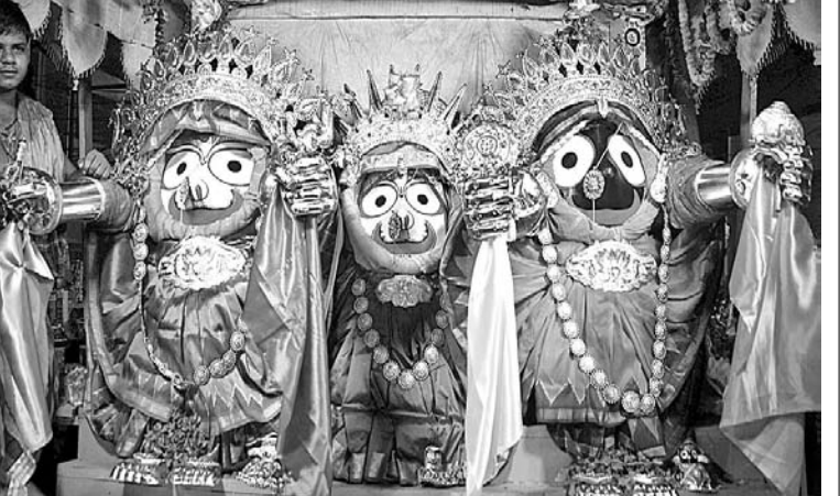
କଟକ ବୋକପୁଣ୍ଡାଳ ଓ ରାଣାହାଟ ଜଗନ୍ନାଥ ମନ୍ଦିର ସମ୍ପୂର୍ଣ୍ଣ ରଥରେ ଶ୍ରୀଜୀଉଙ୍କ ସୁନାବେଶ।