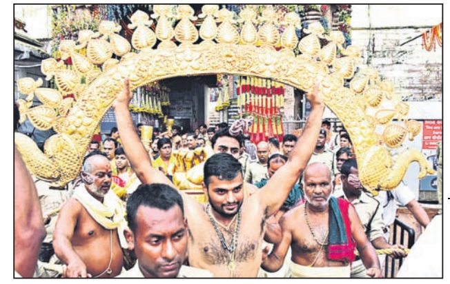
ଶ୍ରୀକ୍ଷେତ୍ରରେ ସୁନାବେଶ ପାଇଁ ରତ୍ନଭଣ୍ଡାରରୁ ଶ୍ରୀଜଗନ୍ନାଥଙ୍କ କିରୀଟ ଅଣାଯାଉଛି ।