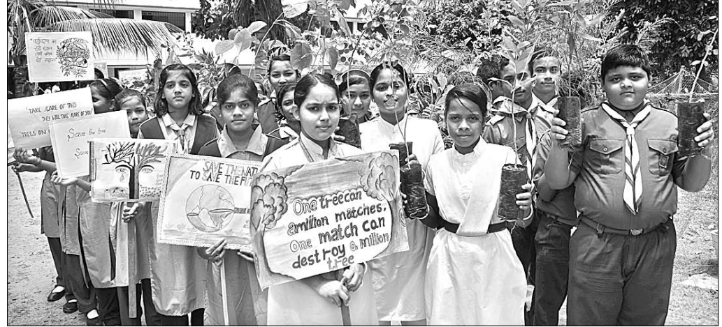
ଗାରା ରୋପଣ ଓ ପରିବେଶ ସୁରକ୍ଷା ନେଇ ଶନିବାର କଟକ ରୁକ୍ମସାଧୁର ସରସ୍ୱତୀ ଶିଶୁମନ୍ଦିରର ଛାତ୍ରଛାତ୍ରୀଙ୍କ ଦ୍ୱାରା ବାହାରିଥିବା ଶୋଭାଯାତ୍ରା।