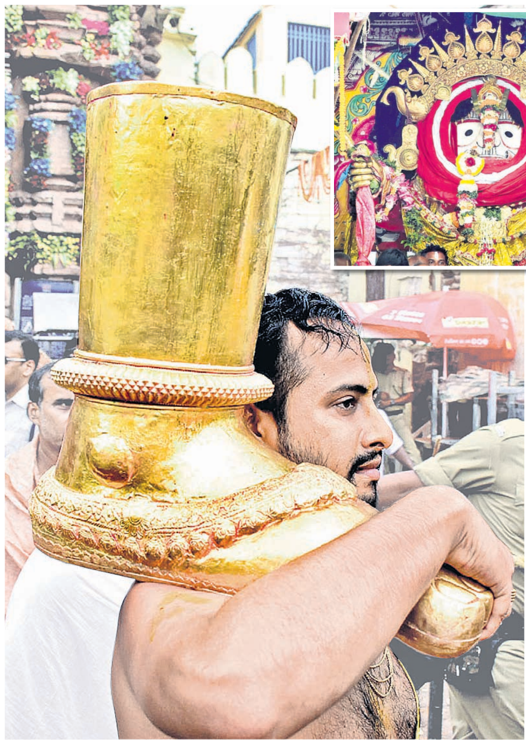
ମହାପ୍ରଭୁ ଶ୍ରୀକରନାଥଙ୍କ ସୁନା ପାତ୍ରରେ ରଥକୁ ନିଆଯାଉଛି

ହିଟିକ ରୋଶନଙ୍କ ଅଭିନୀତ 'ସୁପର ୩୦' ରିଲିଜ୍ ଦିନସରେ ୧୧କୋଟି ଆୟ କରିଥିବା ସୂଚନା ମିଳିଛି।