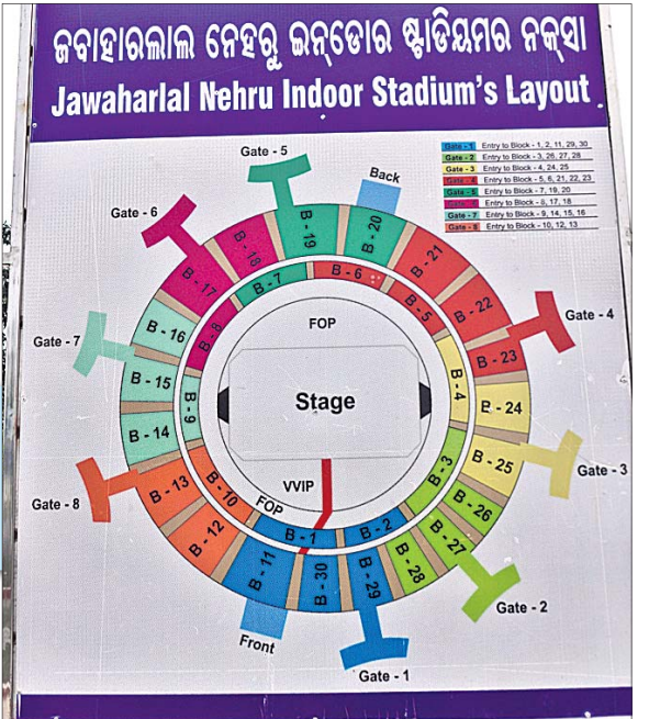
ଚେରୁ ସମ୍ମୁଖରେ ଲାଗିଥିବା ଜବାହରଲାଲ ଇନ୍‌ଡୋର ଷ୍ଟାଡ଼ିୟମର ନକ୍ସା।

ହକୀମ ବର୍ଷର ପୁରୁଣା ସହର ଭାବେ ପରିଚିତ କଟକରେ ଆସନ୍ତା ରୁଧିରାଠାରୁ ଆରମ୍ଭ ହେବ ରାଜ୍ୟଗୋଷ୍ଠୀ ଚେରୁଲ ଚେନିଏ କ୍ରୀଡ଼ାର ୨୧ତମ ସଂଘରଣ। ଚେରୁଲ ଚେନିଏ (ଚିଏ)ର ଏହି ମହାକୁସ୍ତ ଆଉ ମାତ୍ର ୩ ଦିନ ବାକି। ଏ ନେଇ ପ୍ରସ୍ତୁତି ସମସ୍ତ ବର୍ଗରୁ ଜୋରଦାର ଚାଲିଛି। ଭୁବନେଶ୍ୱରରେ ଖେଳାଳିଙ୍କ ସ୍ୱାଗତ ସମ୍ପର୍କନାଠାରୁ ଆରମ୍ଭ