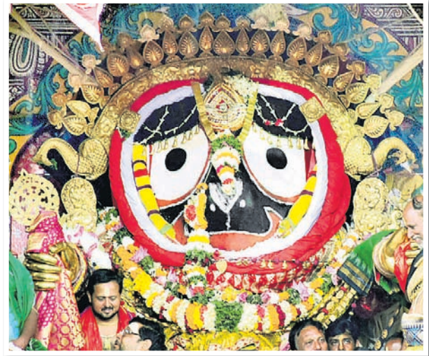
ଶନିବାର ରଥ ଉପରେ ସୁନାବେଶରେ ତିନିଠାକୁର