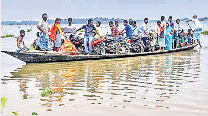
ଆସାମ ବନ୍ୟାଞ୍ଚଳକୁ ଲୋକମାନଙ୍କୁ ଉଦ୍ଧାର କରାଯାଇଛି।

ବାଟସବୁକୁ ଅନୁରୋଧ କରିଥିଲେ। ମୁଖ୍ୟମନ୍ତ୍ରୀଙ୍କ ପ୍ରତିଶ୍ରୁତି ପୂରଣ କରିବା ଲାଗି ସୋମବାର ସକାଳେ ଅନୁଷ୍ଠିତ ବିଜ୍ଞାନ ଆଡ଼ଭାଜନର କର୍ମଚର ଶେଷରେ ଭାଜପା ପରାମର୍ଶ ଦେବ ବୋଲି ଯେତୁରସ୍ୱା କହିଛନ୍ତି। ସୂଚନାଯୋଗ୍ୟ, ରୁଧିରୀର ଆସ୍ଥାଭୋଟ ପାଇଁ ଶୁକ୍ରବାର ବୈଠକରେ କୁମାରସ୍ୱାମୀ ପ୍ରସ୍ତାବ ଦେଇଥିଲେ। ତେବେ ଉକ୍ତ ବୈଠକରେ ମୁଖ୍ୟ ବିରୋଧୀ ଦଳ ଭାଜପା ଯୋଗଦେଇ ନ ଥିବାରୁ ଏହା ଉପରେ କୌଣସି ନିଷ୍ପତ୍ତି ହୋଇପାରି ନ ଥିଲା।