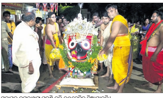
ମହାପ୍ରଭୁ ଜଗନ୍ନାଥଙ୍କୁ ପହଞ୍ଚି କରି ରତ୍ନବେଦିକୁ ନିଆଯାଉଛି।