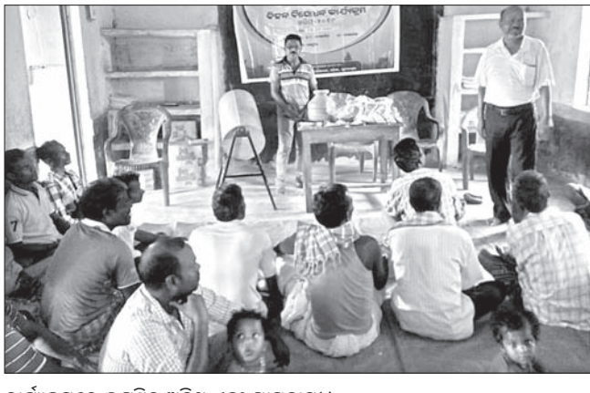
କାର୍ଯ୍ୟକ୍ରମରେ ଉପସ୍ଥିତ ଅତିଥି ଏବଂ ଗ୍ରାମବାସୀ।