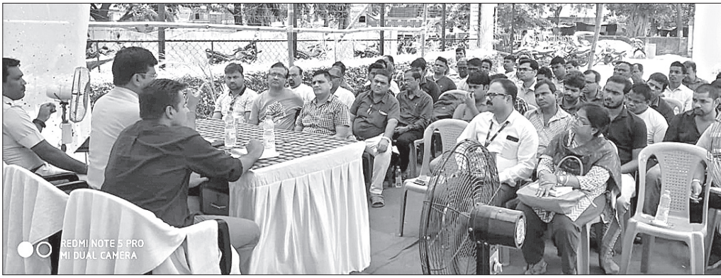
ଥାନା ପରିସରରେ ଆୟୋଜିତ ବୈଠକରେ ପୋଲିସ ଅଧିକାରୀଙ୍କ ସମେତ ବିଭିନ୍ନ ପ୍ରତିଷ୍ଠାନର କର୍ତ୍ତୃପକ୍ଷ, ବ୍ୟାଙ୍କ ଅଧିକାରୀ ଓ ଅନ୍ୟମାନେ।