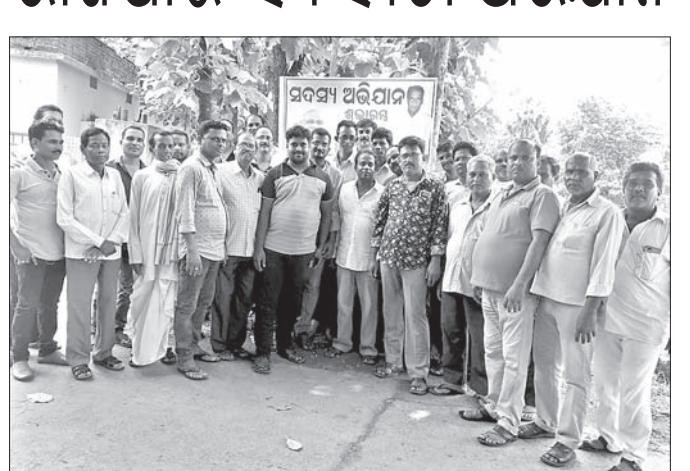
କାର୍ଯ୍ୟକ୍ରମରେ ଭାଜପା କର୍ମକର୍ତ୍ତାମାନେ।