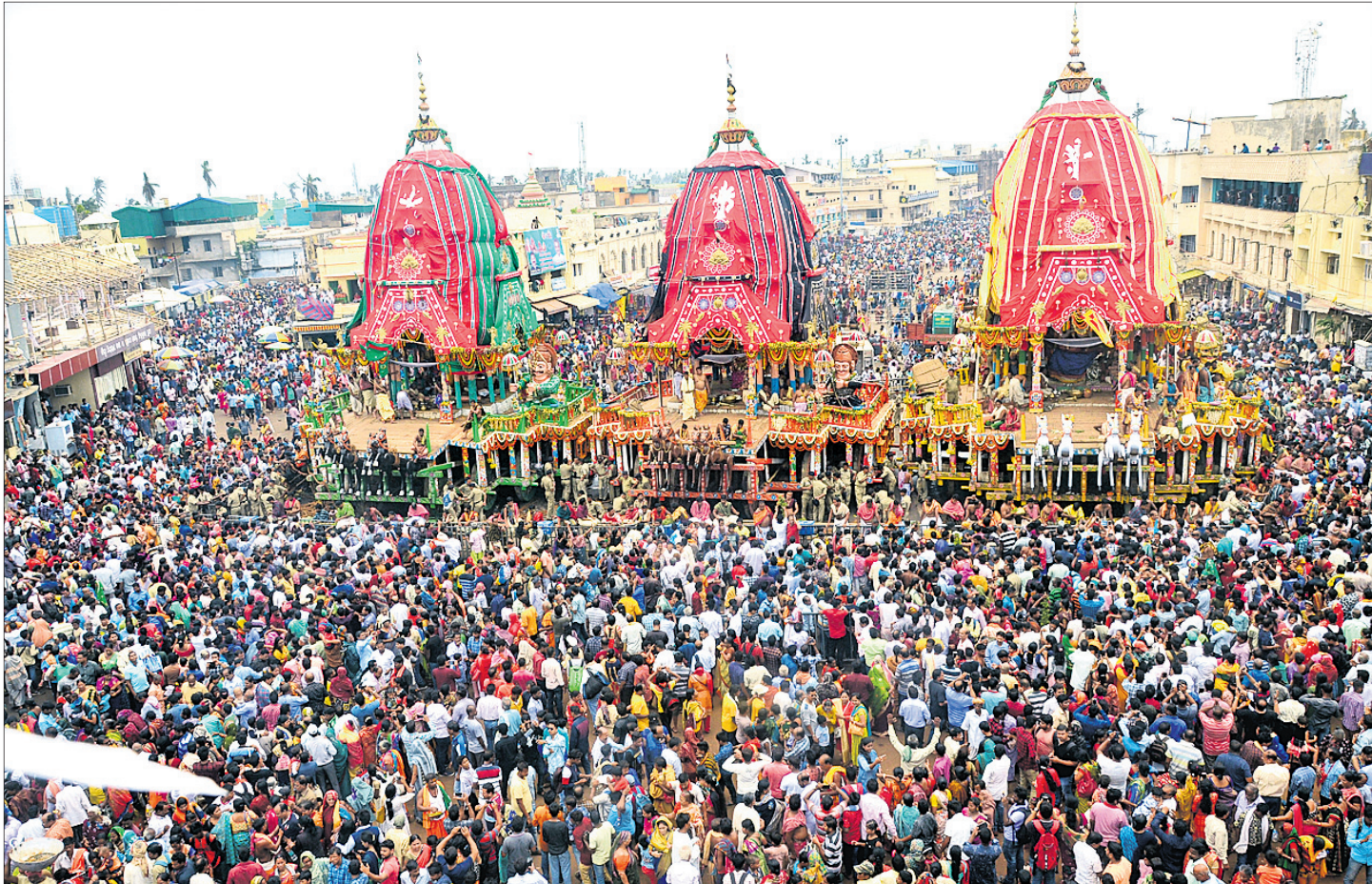
ମହାପ୍ରଭୁଙ୍କ ସୁନାବେଶ ଦର୍ଶନ ପାଇଁ ବଡ଼ଦାଣ୍ଡରେ ଶ୍ରଦ୍ଧାଳୁଙ୍କ ସମାଗମ ।

ବ୍ରହ୍ମପୁର ଅଫିସ, ୧୩୭: ଗଣ୍ଡାମ ଜିଲାର ଜଣେ ୭ ବର୍ଷ ଶିଶୁଙ୍କର ଏଡସରେ ମୃତ୍ୟୁ ଘଟିଛି। ଶିଶୁଙ୍କର ସନ୍ଧ୍ୟାରେ ଶାରେ ରଥଯାତ୍ରା ଦେଖିବାବେଳେ ହଠାତ ତାଙ୍କର ମୁଣ୍ଡ ବୁଲାଇବାକୁ ସେ ଚଳେ ପଡିଯାଇଥିଲେ। ପରେ ଜେଜେବାପା ତାଙ୍କୁ ଏମ୍ବୁଲେନ୍ସରେ ମେଡିକାଲରେ ଭର୍ତ୍ତି କରିଥିଲେ। ଚିକିତ୍ସାଧୀନ ଅବସ୍ଥାରେ ଶରୀର ମଧ୍ୟାହ୍ନରେ ତାଙ୍କର ମୃତ୍ୟୁ ଘଟିଛି। ମେଡିକାଲ ଫାଷ୍ଟି ପୋଲିସ ଶିଶୁଙ୍କ ମୃତଦେହ ଜବତ କରି ୯.୩୭୮/୧୯ରେ ଏକ ଅପମୃତ୍ୟୁ ମାମଲା ରୁଜୁ କରିଛି। ତାଙ୍କ ବାପାଙ୍କର ପୂର୍ବରୁ ଏଡସରେ ମୃତ୍ୟୁ ଘଟିଥିଲା ବୋଲି ପୋଲିସ ସୂଚନା ଦେଇଛି। ପୁଅକୁ ପୂର୍ବରୁ ହରାଇଥିବା ବେଳେ ଏବେ ଏକମାତ୍ର ନାତିକୁ ହରାଇ ଜେଜେବାପା ଦୁଃଖରେ ମ୍ରିୟମାଣ ହୋଇପଡିଛନ୍ତି।