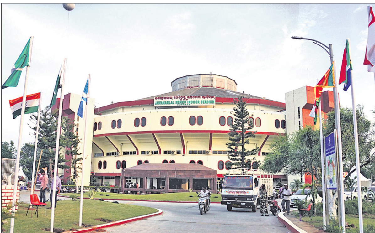
ନୂଆ ରୂପରେ ଜବାହରଲାଲ ନେହେରୁ ଇନଡୋର ସ୍ମୃତିୟମ।

କଟକ ଅଫିସ୍, ୧୫:୨ ରୂପବାରଠାରୁ ଜବାହରଲାଲ ନେହେରୁ ଇନଡୋର ସ୍ମୃତିୟମରେ ଆରମ୍ଭ ହେବାକୁ ଥିବା ରାଜ୍ୟଗୋଷ୍ଠୀ ଟେବୁଲ ଟେନିସ କ୍ରୀଡ଼ାର ୨୧ତମ ସଫରାଜୀ ଏବେ ସୁଦ୍ଧା ୫ ଦଳ ବାଦ ପଡ଼ି ଯାଇଛି।