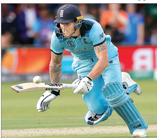
ଭାରତୀୟ ଦଳର ଅଧିନାୟକ ଯୋଗାଯୋଗ କରିବା ପାଇଁ ଘୋଷଣା କରାଯାଇଛି।