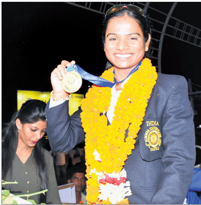
ଜଗଲୀର ନାପୋଲିଠାରେ ଅନୁଷ୍ଠିତ ଖେଳାଳିଙ୍କୁ ଉତ୍ସାହିତ କରିବା ପାଇଁ ଘୋଷଣା କରାଯାଇଛି।

ବିବେଚିତ ହୋଇଥିଲା। ଅଷ୍ଟ୍ରେଲିଆର ପୂର୍ବତନ ଯୋଗାଯୋଗ କରିବା ପାଇଁ ଘୋଷଣା କରାଯାଇଛି।