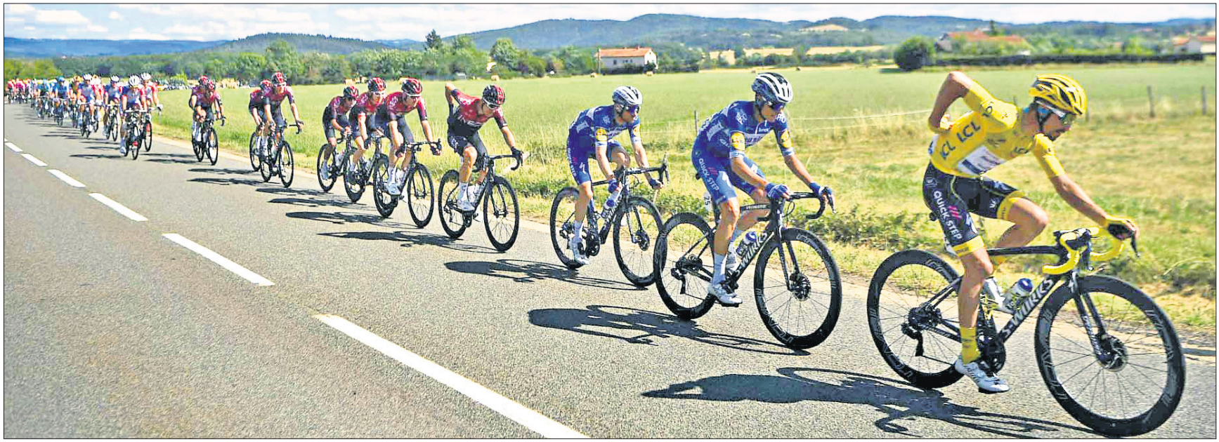
ରୁର ଡି ଫ୍ରାନ୍ସ୍ ସାଇକେଲ ରେସର ସୋମବାର ଅନୁଷ୍ଠିତ ୧୦ମ ଷ୍ଟେଜ୍ ଅବସରରେ ପ୍ରତିଯୋଗୀମାନେ।