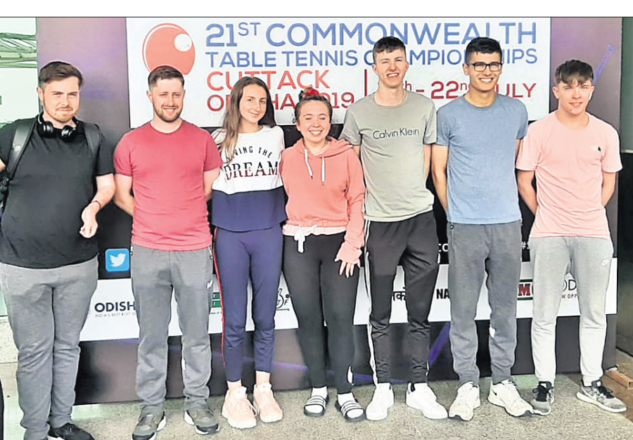
କଟକର କବାଟର ଲାଲ୍ ନେହେରୁ ଲୁକ୍ମିୟାଦେବୀ ସେଣ୍ଟରରେ ହେବାକୁ ଥିବା ରାଜ୍ୟଗୋଷ୍ଠୀ ଚେକ୍ସୁଲ୍ ସେନିଆ ପ୍ରତିଯୋଗିତାରେ ଭାଗ ନେବା ପାଇଁ ଯୋଗାଯୋଗ କରାଯାଇଛି।

ନ୍ୟୁଦିଲ୍ହା, ୧୫୭ (ପି.ଟି.): କର୍ମୀମାନେ ପ୍ରତିଯୋଗିତାରେ ଭାଗ ନେଇ ଖେଳିବା ପାଇଁ ଘୋଷଣା କରାଯାଇଛି।