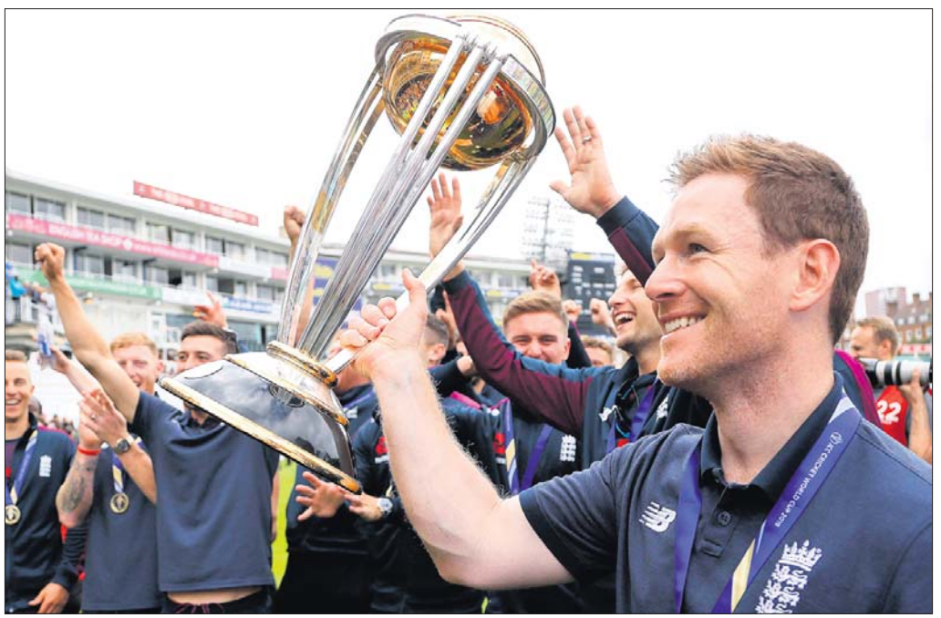
ସୋମବାର ଓଭାଲଠାରେ ଆଇସିସି ବିଶ୍ୱକପ ଟ୍ରଫି ସହ ଇଂଲଣ୍ଡ ଅଧିନାୟକ ଇଅନ ମୋର୍ଗାନ ଓ ସାଥୀ ଖେଳାଳିମାନେ ଖୁସି ମନାଉଛନ୍ତି।

ସମାନ ସଂଖ୍ୟକ ରନ୍ କରିବାକୁ ମଧ୍ୟାହ୍ନ ଟାଇମ୍ରେ ସମାପ୍ତ ହୋଇଥିଲା। ଫଳରେ ମଧ୍ୟାହ୍ନରେ ଅଧିକ ବାଉଣ୍ଡା ମାରିଥିବାରୁ ଇଂଲଣ୍ଡକୁ ଚାମ୍ପିୟନ ହୋଇଥିଲା।