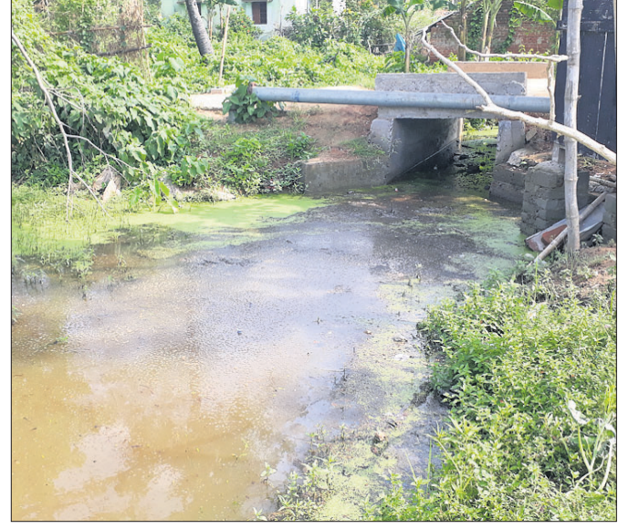
ଜଳ ନିଷ୍କାସନ ପଥ ବନ୍ଦ ହେବାରୁ ଚାଷୀମାନଙ୍କୁ ଉଦ୍ଧାର କରିବା ପାଇଁ ଜିଲ୍ଲାପାଳଙ୍କ ଅଭିଯୋଗ ଶୁଣାଣିରେ ଭିଡ଼ ହୋଇଥିଲା।