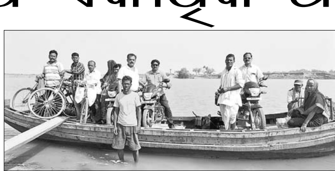
ସଡ଼କପଥ ସୁବିଧା ନ ଥିବାରୁ ଲୋକମାନେ ତଳାରେ ନଦୀ ପାର ହେଉଛନ୍ତି ।

ଆଳି ବ୍ଲକର ଚତୁଃପାର୍ଶ୍ୱରେ ଖରସ୍ରୋତା, ବ୍ରାହ୍ମଣୀ ଓ ଶାଖା କାଶୀ ନଦୀ ଯୋଡି ରହିଛି । କେତେକସ୍ଥାନକୁ ସେତୁ ସଂଯୋଗ କରାଯାଇନାହିଁ ବୋଲି ବେଳେ ବେଳେ ଏବେ ବି ବ୍ଲକ ଅଧୀନରେ ଆଉ କେତେକ ଅଞ୍ଚଳ ରହିଛି, ଯେଉଁଠାରେ ଯାତାୟତ କରିବାକୁ ଉପାଦାନ ନାହିଁ ।