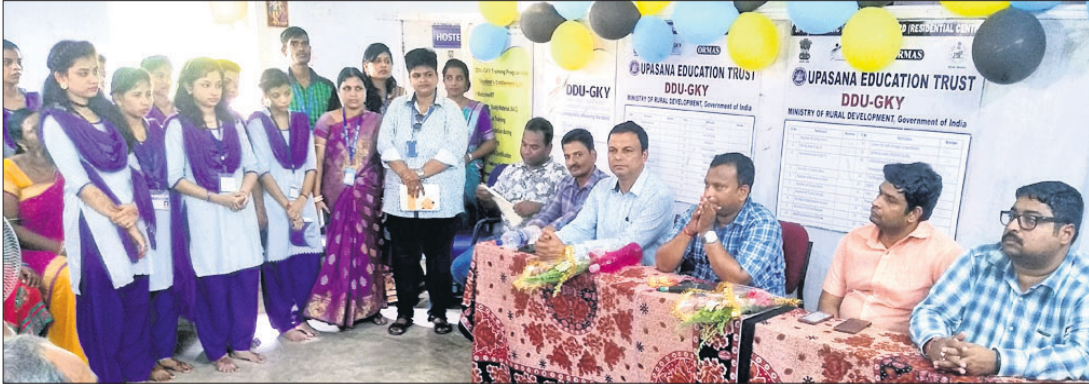
ବୈଠକରେ ଉପସ୍ଥିତ ଅଧିକାରୀ ଓ ତାଲିମପ୍ରାପ୍ତ ଛାତ୍ରୀ।