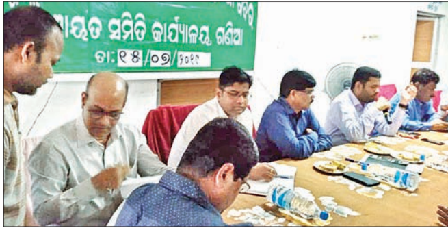
ଅଭିଯୋଗ ଶୁଣାଣି ଶିବିରରେ ଜିଲାପାଳ ଓ ଅନ୍ୟମାନେ।

ଗଣିଆ, ୧୫୭୭(ଡି.ଏନ.ଏ.) ଗଣିଆ ପଞ୍ଚାୟତ ସମିତି କାର୍ଯ୍ୟାଳୟ ପରିସରରେ ସୋମବାର ନୟାଗଡ଼ ଜିଲାପାଳଙ୍କ ମୂଳ ଅଭିଯୋଗ ଶୁଣାଣି ଶିବିର ଅନୁଷ୍ଠିତ ହୋଇଯାଇଛି।