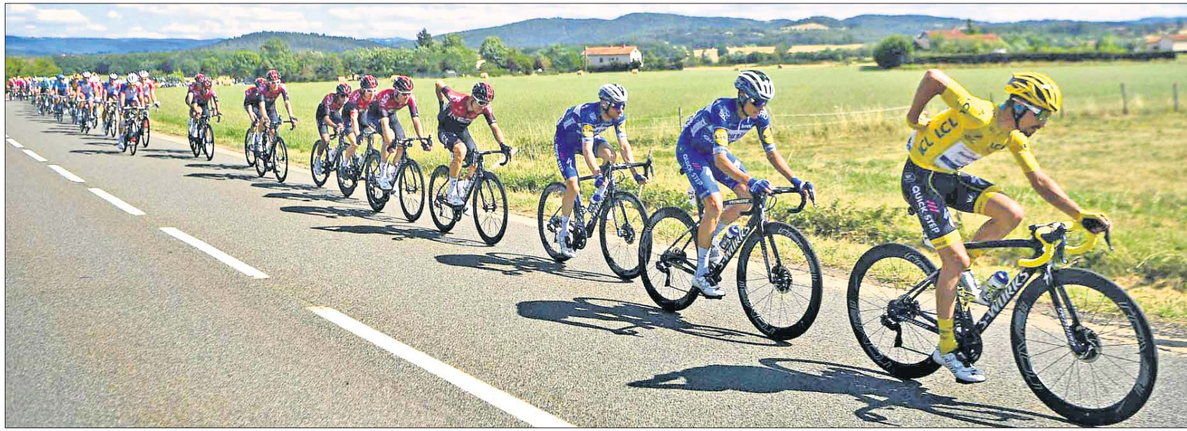
ରୁର ଡି ପ୍ରାନ୍ତ ସାଇକେଲ ରେସର ସୋମବାର ଅନୁଷ୍ଠିତ ୧୦ମ ଷ୍ଟେଜ ଅବସରରେ ପ୍ରତିଯୋଗୀମାନେ।

ନୂଆଦିଲ୍ଲୀ, ୧୫।୬: କ୍ରିକେଟ୍ ବିଶ୍ୱକପର ଫାଇନାଲ୍ ପର୍ଯ୍ୟନ୍ତ ପ୍ରତିଦିନ ଲାଭ ହେଉଥିବା ଟଙ୍କା ଗଣନା କରାଯାଇଛି। ଫାଇନାଲରେ ଭାରତୀୟ ଦଳ ୭ କୋଟି ୩୯ ଲକ୍ଷ ଟଙ୍କା ପାଇବାର ସମ୍ଭାବନା ରହିଛି।