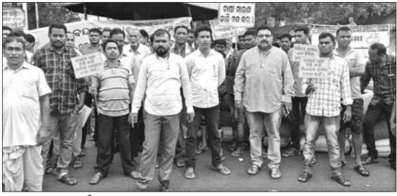
ଚାଷୀମାନେ ଧାନଗଡ଼ଠାରେ ରାସ୍ତା ଅବରୋଧ କରିଛନ୍ତି ।

ଧର୍ମଗଡ଼, ୧୫୭୭ (ଡି.ଏନ.ଏ.) କଳାହାଣ୍ଡି ଜିଲ୍ଲାରେ ଚଳିତ ଋତୁ ରଘୁରେ ମଞ୍ଚି ଖୋଲିବା ଦିନଠାରୁ ଅଧିକାଂଶ ଲାଗି ରହିଛି । ଏ ପର୍ଯ୍ୟନ୍ତ ସମସ୍ୟା ଚାଷୀଙ୍କ ପଛା ହାତୁଡ଼ି । ଧାନ ନ ଉଠିବା ପ୍ରତିବାଦରେ ଚାଷୀମାନେ ଯୋମବାର ସକାଳ ୬ଟାକୁ ମଧ୍ୟାହ୍ନ ୧୨ଟା ପର୍ଯ୍ୟନ୍ତ ଦୀର୍ଘ ୬ ଘଣ୍ଟା ରାସ୍ତା ଉପରେ ଧାନ ବସ୍ତା ରଖି ଅବରୋଧ କରିଥିଲେ ।