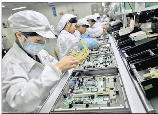
ବୈଠକରୁ ବାଦ୍ ପଡ଼ିଲେ ଚାଇନା କମ୍ପାନୀ

ଦେଶକୁ ଇଲେକ୍ଟ୍ରୋନିକ୍ସ ମାନୁଫାକ୍ଚରର୍ ହବ୍ ଭାବେ ତିଆରି କରିବା ଲାଗି କେନ୍ଦ୍ର ସରକାର ପ୍ରୟାସ ଆରମ୍ଭ କରିଛନ୍ତି। ଏଥିଲାଗି ପ୍ରଧାନମନ୍ତ୍ରୀଙ୍କ କାର୍ଯ୍ୟକ୍ରମ(ପିଏମ୍ପି) ପକ୍ଷରୁ ଏକ ଉଚ୍ଚସ୍ତରୀୟ କମିଟି ଗଠନ କରାଯାଇଛି।