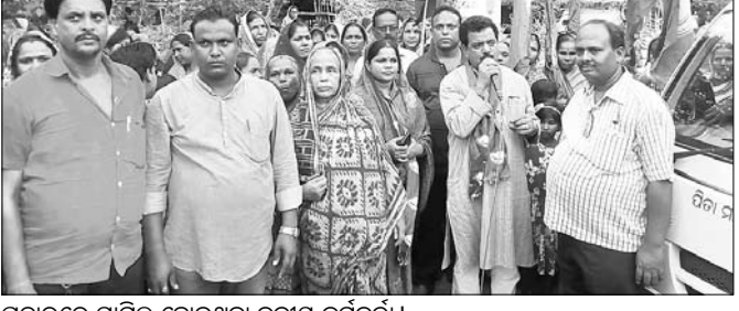
ପ୍ରଚାରରେ ସାମିଲ ହୋଇଥିବା ଦଳୀୟ କର୍ମକର୍ତ୍ତା ।