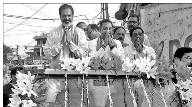
ପ୍ରଚାରରେ ଭାଜପା ପୁଣ୍ୟପାତ୍ର ସମିତ ପାତ୍ର ଓ ଅନ୍ୟମାନେ ।

ପାଟକୁରା ନିର୍ବାଚନମଣ୍ଡଳ ଅଧୀନ ଡେରାବିଶ ବ୍ଲକର ବିଭିନ୍ନ ପଞ୍ଚାୟତରେ ଭାଜପା ପ୍ରାର୍ଥୀ ବିଜୟ ମନ୍ତ୍ର ପ୍ରଦାନ କରାଯାଇଛି ।