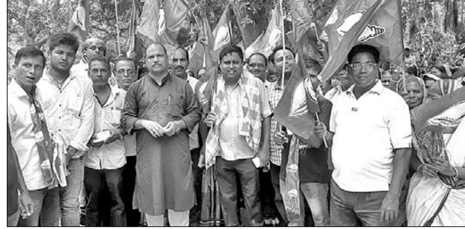
ପଦଯାତ୍ରାରେ ବିଜେଡି କର୍ମକର୍ତ୍ତା ।