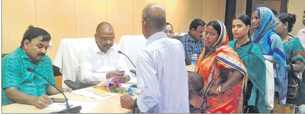
ଜିଲ୍ଲାପାଳଙ୍କ ଜନସାଧାରଣ ଅଭିଯୋଗ ଶୁଣାଣିରେ ଭିଡ଼ ହୋଇଥିଲା।