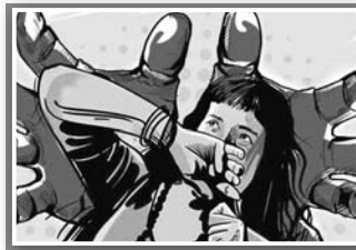
ହାଜତରେ ଦିଅରଙ୍କ ମୃତ୍ୟୁ ହେବା ପରେ ବି ମହିଳାଙ୍କୁ ଛାଡ଼ି ନ ଥିଲା ଯୋଲିସ

ରାଜସ୍ଥାନର ରୁରୁସ୍ଥିତ ଏକ ଥାନା ହାଜତରେ ଲକ୍ଷ୍ମୀ ଯୋଲିସଙ୍କ ବିରୋଧରେ ଅଭିଯୋଗ ଦିଆଯାଇଛି।