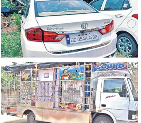
କଟକ ହୋଇଥିବା ଗାଡ଼ି।

କଟକ, ୧୬୩୭(ଡି.ଏନ.ଏ.) ଏଟିଏମ୍‌ରେ ପ୍ରକୃତ ପରିମାଣଠାରୁ କମ୍ ଟଙ୍କା ଭର୍ତ୍ତି କରି ପାଖାପାଖି ୧ କୋଟି ୩୯ ଲକ୍ଷ