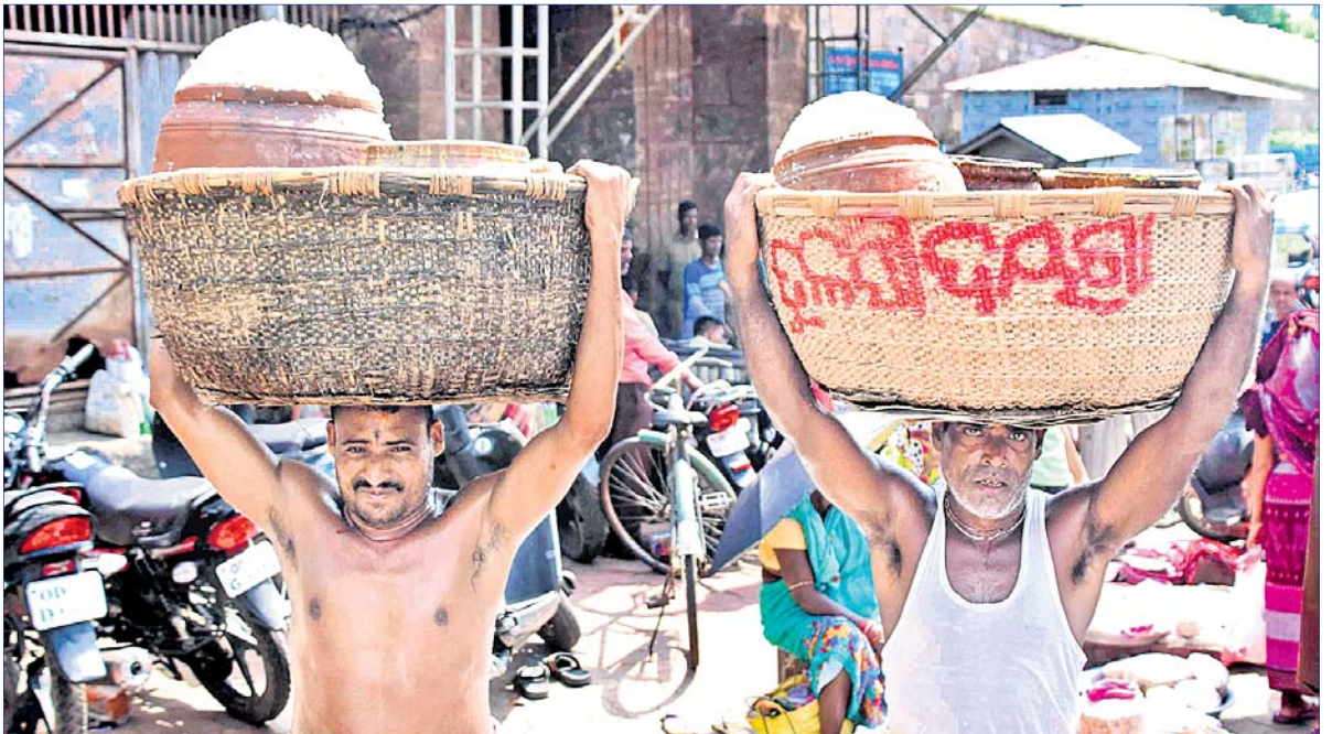
ରଥଯାତ୍ରା ପରେ ମଙ୍ଗଳବାର ଶ୍ରଦ୍ଧାଳୁଙ୍କ ପାଇଁ ବାହାରିଥିବା ପ୍ରଥମ ଅବଡ଼ା।