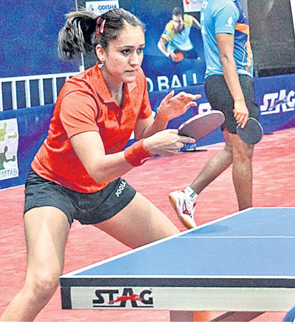
ଭାରତର ଚାକରଳ ମହିଳା ଖେଳାଳି ମନିକା ବାଗ୍ରାଙ୍କ ଅଭ୍ୟାସ।