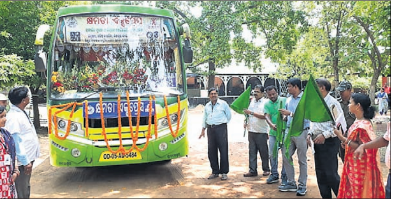
କ୍ଷମତା ଏକ୍ସପ୍ରେସ୍ ପତାକା ଦେଖାଇ ଜିଲ୍ଲାପାଳ ଶୁଭାରମ୍ଭ କରୁଛନ୍ତି

ଦାୟିତ୍ୱ ଗ୍ରହଣ କରିବା ପରେ ବିଭିନ୍ନ ବିଭାଗର ଅଧିକାରୀ ଓ କର୍ମଚାରୀ ତାଙ୍କୁ ସୌଜନ୍ୟମୂଳକ ସାକ୍ଷାତ୍ କରିବା ସହ ଫୁଲରୋଡ଼ା ଦେଇ ସ୍ୱାଗତ ସମ୍ପର୍କନା ଦେଇଥିଲେ।