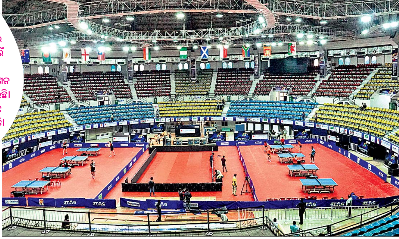
ପ୍ରତିଯୋଗିତା ପାଇଁ ପ୍ରସ୍ତୁତ କରାଯାଇଥିବା ନେହେରୁ ଜନ୍ମତୋର ଷ୍ଟାଡ଼ିୟମ।

ରାଜ୍ୟଗୋଷ୍ଠୀ ଟେବୁଲ ଟେନିସ୍ କ୍ରୀଡ଼ାର ୨୧ତମ ସଂସ୍କରଣ ପାଇଁ କ୍ଷେତ୍ର ପ୍ରସ୍ତୁତ ବୁଧବାରଠାରୁ କଟକର ଜବାହରଲାଲ ନେହେରୁ ଜନ୍ମତୋର ଷ୍ଟାଡ଼ିୟମରେ ଆରମ୍ଭ ହେବ ଟେବୁଲ ଟେନିସ୍ ଏହି ମହାମେଳା। ଏଥିପାଇଁ ଜନ୍ମତୋର ଷ୍ଟାଡ଼ିୟମକୁ ନୂଆ ରୂପ ଦିଆଯାଇଥିବାବେଳେ ପ୍ରତିଯୋଗିତାର ସଫଳ ଆୟୋଜନ ପାଇଁ ରାଜ୍ୟ ଆସୋସିଏଶନ ଓ ସରକାରଙ୍କ ପକ୍ଷରୁ ଆବଶ୍ୟକ ପଦକ୍ଷେପ ଗ୍ରହଣ କରାଯାଇଛି। ପ୍ରତିଯୋଗିତାରେ ଅଂଶଗ୍ରହଣ ପାଇଁ ଭାରତ ସମେତ ବିଭିନ୍ନ ଦେଶର ପ୍ରତିଯୋଗୀମାନେ ପହଞ୍ଚି ଅଭ୍ୟାସ ଆରମ୍ଭ କରିଛନ୍ତି। ଏବେ କେବଳ ଚୁର୍ଣ୍ଣମେଷ୍ଟ ଆରମ୍ଭକୁ ଅପେକ୍ଷା।