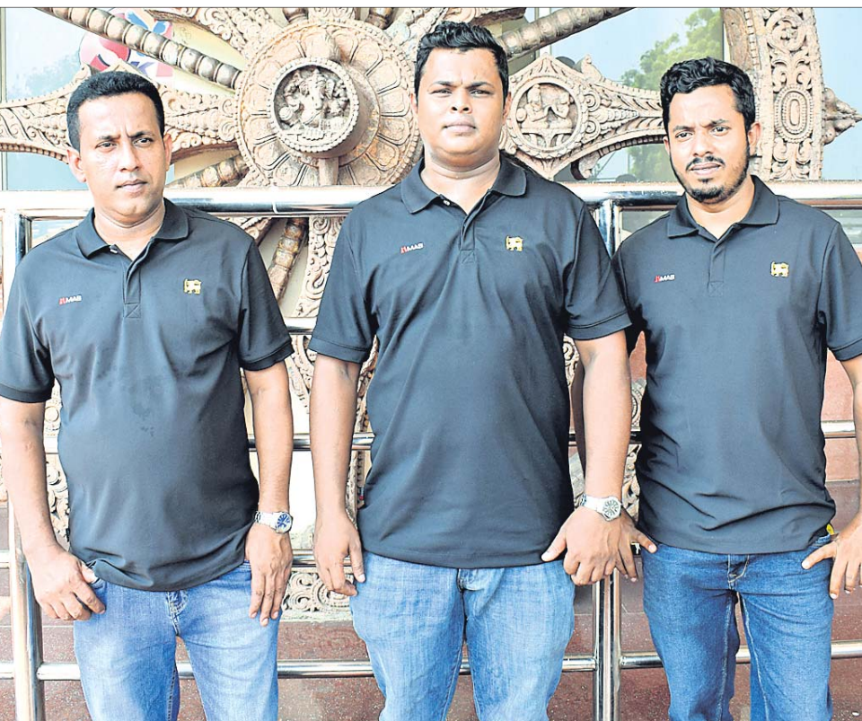
ଭୁବନେଶ୍ୱରରେ ପହଞ୍ଚିଥିବା ଶ୍ରୀଲଙ୍କାର ଖେଳାଳିମାନେ ।