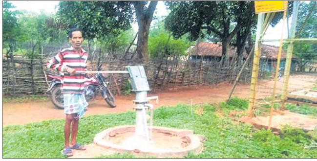
ଏକ ନଳକୂପ ପାଣି ଆସୁନାହିଁ

କେନ୍ଦୁଝର ଜିଲ୍ଲା ଝୁଞ୍ଚୁରା ବ୍ଲକ୍ ଅନ୍ତର୍ଗତ ଖଣି ଯନ୍ତ୍ରପ୍ରଣାଳୀ ଅଞ୍ଚଳ ଭାବେ ପ୍ରଥମ ଭାବରେ ଚିହ୍ନଟ ହୋଇଥିବା ୫ଟି ପଞ୍ଚାୟତ (ବସନ୍ତପୁର, ମଲଦା, ନୟାଗଡ, କୁରୁଗାଁ, ନିଶ୍ଚିତପୁର) ବାସିନ୍ଦାଙ୍କୁ ପାନୀୟ ଜଳ ଯୋଗାଇ ଦେବା ପାଇଁ ଗଭୀର ନଳକୂପ ଖୋଳାଯାଇ ସୋଲାର ସିଷ୍ଟମ୍ ଜରିଆରେ ଓଭରହେଡ ଟାଙ୍କିକୁ ପାଣି ଉଠାଯାଇ ପାନୀୟ ଜଳ ଯୋଗାଇ ଦେବାର ଯୋଜନା ୨୨ର୍ଥ ପୂର୍ବରୁ କରାଯାଇଥିଲା। ଖଣି ଯନ୍ତ୍ରପ୍ରଣାଳୀ ଉଚ୍ଚ ପଞ୍ଚାୟତଗୁଡ଼ିକର ପ୍ରତ୍ୟେକ ସୋଲାର ସିଷ୍ଟମ୍ ପାଇଁ ୧୦ଲକ୍ଷ ଟଙ୍କା ଜିଲ୍ଲା ଖଣିଜ ପାଣ୍ଡିଠୁ ବ୍ୟୟ ବରାଦ କରାଯାଇଛି। ଭୁବନେଶ୍ଵରସ୍ଥିତ ଓରେଡୋ କମ୍ପାନୀକୁ ଟେଣ୍ଡର ମଧ୍ୟ ଦିଆଗଲା। ସମ୍ପୂର୍ଣ୍ଣ ଅଞ୍ଚଳରେ ୨୦୦ରୁ ଊର୍ଦ୍ଧ୍ଵ ସୋଲାର ନଳକୂପ ପାଇଁ ଯୋଜନା