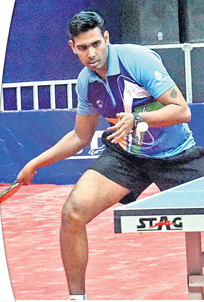
ପ୍ରାକ୍ତିକ ଅବସରରେ ଭାରତର ଅତ୍ୟନ୍ତ ଶରଥ କମଲ।