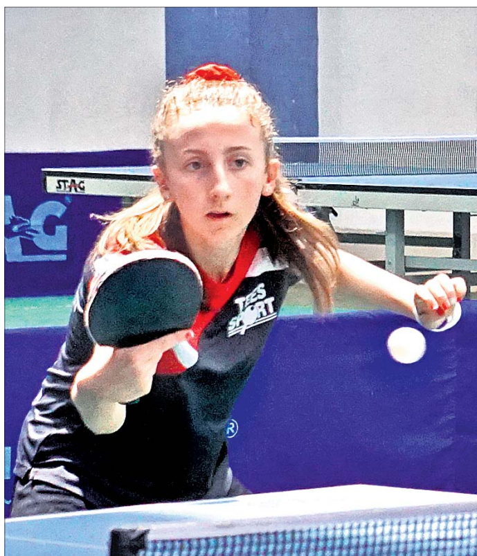
ଫ୍ରେଙ୍କ୍ ଦକ୍ଷର ପୁର ମହିଳା ଖେଳାଳିଙ୍କ ଅଭ୍ୟାସ।