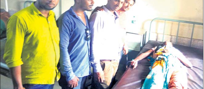
ତିକିଆପାନ ମହିଳାଙ୍କ ନିକଟରେ ତାଙ୍କୁ ଆଣିଥିବା ଯୁବ ଗୋଷ୍ଠୀ ।

ଦଲେଇ ପ୍ରମୁଖ କେତେକ ଯୁବକଙ୍କୁ ସେ ପଠାଯାଇଥିଲା । ଯୁବ ଟିମ୍ ଗୋଷ୍ଠୀ ପରେ ଏହି ଯୁବଗୋଷ୍ଠୀର ଉଦ୍ୟମରେ ମହିଳାଙ୍କୁ ଏକ ଅଟୋ ରିକ୍ସାରେ ଖଇରା ଗୋଷ୍ଠୀ ସ୍ୱାସ୍ଥ୍ୟକେନ୍ଦ୍ରକୁ ଅଣାଯାଇଥିଲା । ପ୍ରାଥମିକ ଚିକିତ୍ସା ପରେ ଅବସ୍ଥାରେ ସୁଧାର ନ ଆସିବାରୁ ଡାକ୍ତରଙ୍କ ପରାମର୍ଶ