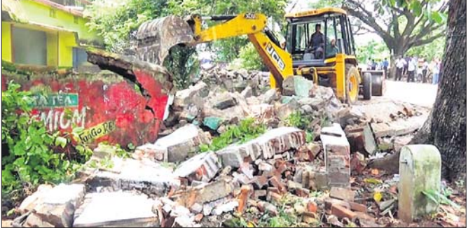
ବର୍ତ୍ତନା ବଜାରରେ ଦୋକାନ ଉଚ୍ଛେଦ କରାଯାଇଛି ।

ଖଇରା, ୧୭୭୭(ଡି.ଏନ.ଏ.) ବାଲେଶ୍ୱର ଜିଲ୍ଲା ଖଇରା ଓ ବଡ଼ ବୁଲ୍ଡିଂ ସଂଯୋଗ କରୁଥିବା ବର୍ତ୍ତନା-ଆଗରପଡା ରାସ୍ତା ପ୍ରଶାସନିକ କାର୍ଯ୍ୟକ୍ରମ ଲାଗି ରୁଧିରୀ ଏକ ଟ୍ରକ୍ ହେଲପର ଚଳାଚଳ କରାଯାଇଥିଲା। ଟ୍ରକ୍ ହେଲପରକୁ ଚାଲିଯିବା ପରେ ଟ୍ରକ୍ ଚଳାଚଳ କରିଥିଲା। ଟ୍ରକ୍ ହେଲପରକୁ ଚାଲିଯିବା ପରେ ଟ୍ରକ୍ ଚଳାଚଳ କରିଥିଲା।