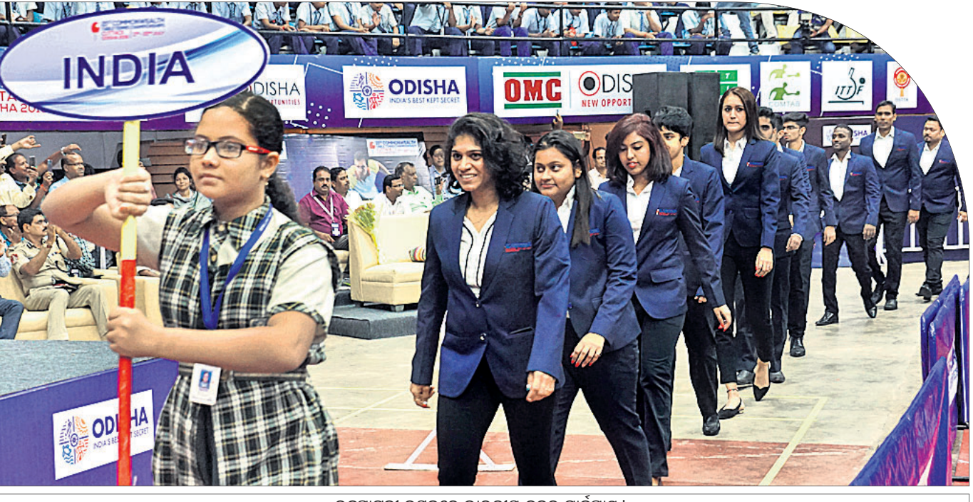
ଉଦ୍‌ଘାଟନୀ ଉତ୍ସବରେ ଭାରତୀୟ ଦଳର ମାର୍ଚ୍ଚପାଣ୍ଡୁ।