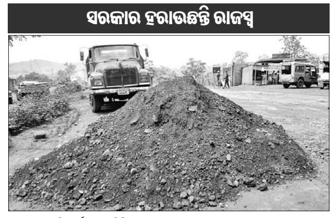
ସରକାର ହରାଇଛନ୍ତି ରାଜସ୍ୱ

କେନ୍ଦୁଝର ଜିଲ୍ଲା ଯୋଡ଼ା ଖଣିମଣ୍ଡଳରେ ରାସ୍ତାରେ ଥିବା ଖାଲିପଥକୁ ପୋତିବା ପାଇଁ ଖଣିକ ପଦାର୍ଥ ବ୍ୟବହାର କରାଯାଉଛି। ଯୋଡ଼ା ଖଣିମଣ୍ଡଳର ଲୁହାପଥର-ବାମେବାରା ରାଜ୍ୟ ରାଜପଥ ନଂ ୨ରେ ବିପୁଳ ପରିମାଣର ଲୁହାପଥରଗୁଣ୍ଡ ଏକ ନିର୍ଦ୍ଦିଷ୍ଟ ଖଣିରୁ ଆଣି ରାସ୍ତା ମରାମତି କାର୍ଯ୍ୟରେ ବ୍ୟବହାର କରାଯାଉଛି। ତେଣୁ ଖଣିରୁ ଗୋଟିଏ ଟ୍ରାକ୍ ମାଟି ପରିବହନ କରିବାକୁ ହେଲେ ଖଣିଦିଆରୀଠାରୁ ଅନୁମୋଦନ ନିଆଯାଇ ମାଟିର ମାନ ପରୀକ୍ଷା କରାଯାଏ। ଲୋହାଂଶର ପରିମାଣ ଅନୁଯାୟୀ ରାଜସ୍ୱ ଜମା କରିବା ପରେ ହିଁ ପରିବହନ ଅନୁମୋଦନ ମିଳିଥାଏ। ହେଲେ ଏହି ରାଜରାସ୍ତା ମରାମତିରେ ବିପୁଳ ପରିମାଣର ଲୁହାପଥରଗୁଣ୍ଡ ପକାଇ ମରାମତି କରାଯାଉଛି। ତେବେ ରାସ୍ତା ମରାମତି ହେଉଥିବାରୁ ଲାଭ ଲାଭ ଟଙ୍କା ରାଜସ୍ୱ ହାନି ହେଉଛି।