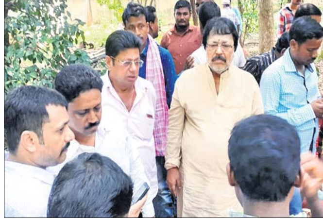
ସଦସ୍ୟ ସଂଗ୍ରହ ଅଭିଯାନରେ ଯାଇଥିବା ଭାଜପା କର୍ମୀମାନେ ।

ବାଲେଶ୍ୱର ଜିଲ୍ଲା କଲେଶ୍ୱର ନିର୍ବାଚନମଣ୍ଡଳର ଭାଜପା ତରଫରୁ ରୁଧିରୀ ଏକ ଟ୍ରକ୍ ହେଲପର ଚଳାଚଳ କରାଯାଇଥିଲା। ଟ୍ରକ୍ ହେଲପରକୁ ଚାଲିଯିବା ପରେ ଟ୍ରକ୍ ଚଳାଚଳ କରିଥିଲା। ଟ୍ରକ୍ ହେଲପରକୁ ଚାଲିଯିବା ପରେ ଟ୍ରକ୍ ଚଳାଚଳ କରିଥିଲା।