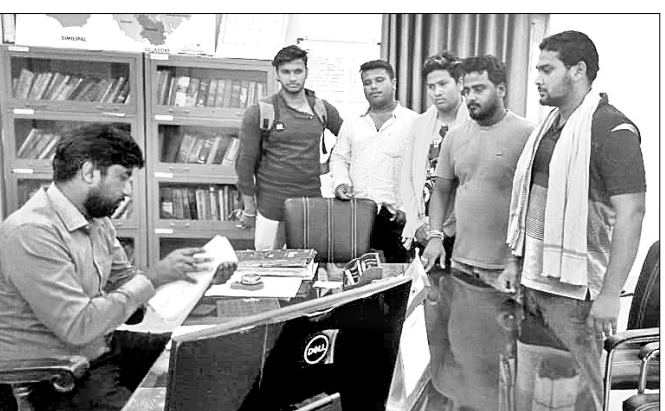
ଉଠିବେନା ପକ୍ଷରୁ ଦାବିପତ୍ର ପ୍ରଦାନ କରାଯାଇଛି।

ମୟୂରଭଞ୍ଜ ଜିଲ୍ଲା ବାରିପଦା ସହରର ପାଳକଣୀ ଛକକୁ ଚଳିଥିବା ମଧ୍ୟରେ ଜରାଳୀ ନଦୀର ଦକ୍ଷିଣ ପାର୍ଶ୍ୱରେ କଂକ୍ରିଟ୍ ଖାଲ ନିର୍ମାଣ କରାଯାଇଛି। ଏହା ଦ୍ୱାରା ନଦୀର ଆୟତନ ହୋଇ ପୋଲିସାଉଛି। ନଦୀର ଉଭୟ ପାର୍ଶ୍ୱରେ ଜବରଦସ୍ତୀକାରୀମାନେ ବେଆଇନଭାବେ ନିର୍ମାଣକାର୍ଯ୍ୟ କରୁଛନ୍ତି। ଜିଲ୍ଲା ପ୍ରଶାସନ ଏହାକୁ ଉଚ୍ଛେଦ କରିବାକୁ ଅଣ୍ଟାଜୋଡ଼ିବେ ସଂଗଠନ ଉଠିବେନା ଦାବି କରିଛି। ଜବରଦସ୍ତୀକାରୀ ଗରିବ ଗରିବ