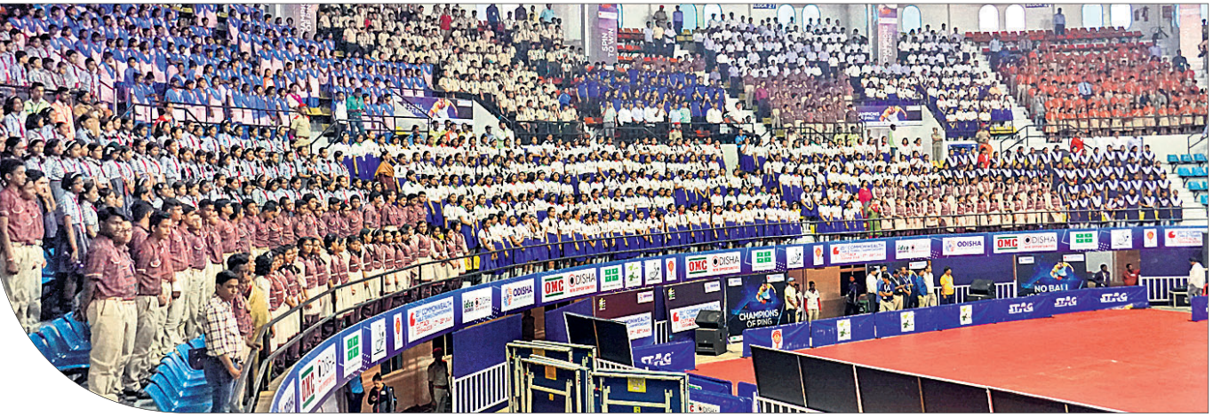
ଜବାହରଲାଲ ନେହେରୁ ଇନ୍‌ଡୋର ସ୍ଥାଡିୟମର ବିଭିନ୍ନ କୁକ୍‌ରେ ଛାତ୍ରାଛାତ୍ରୀମାନେ ଖେଳ ଉପଭୋଗ କରୁଛନ୍ତି।