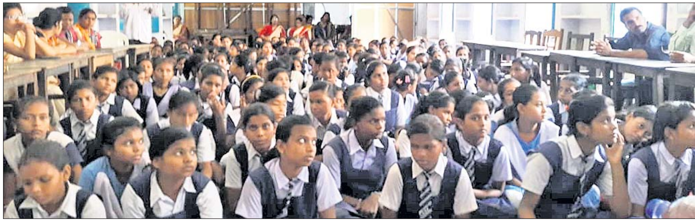
ନିଶା ନିବାରଣ ସଚେତନତା କାର୍ଯ୍ୟକ୍ରମରେ ଛାତ୍ରାଗଣ ।

ବାଲେଶ୍ୱର ଜିଲ୍ଲା ରେମୁଣା ବାଳିକା ବିଦ୍ୟାଳୟ ପରିସରରେ ରୁଧିରୀ ଏକ ଟ୍ରକ୍ ହେଲପର ଚଳୁଥିବା ସମୟରେ ମୁଖ୍ୟମନ୍ତ୍ରୀଙ୍କ ପରିଚ୍ଛା ଓ ଟ୍ରକ୍ ଚଳାଚଳ କରାଯାଇଥିଲା। ଟ୍ରକ୍ ହେଲପରକୁ ଚାଲିଯିବା ପରେ ଟ୍ରକ୍ ଚଳାଚଳ କରିଥିଲା। ଟ୍ରକ୍ ହେଲପରକୁ ଚାଲିଯିବା ପରେ ଟ୍ରକ୍ ଚଳାଚଳ କରିଥିଲା।