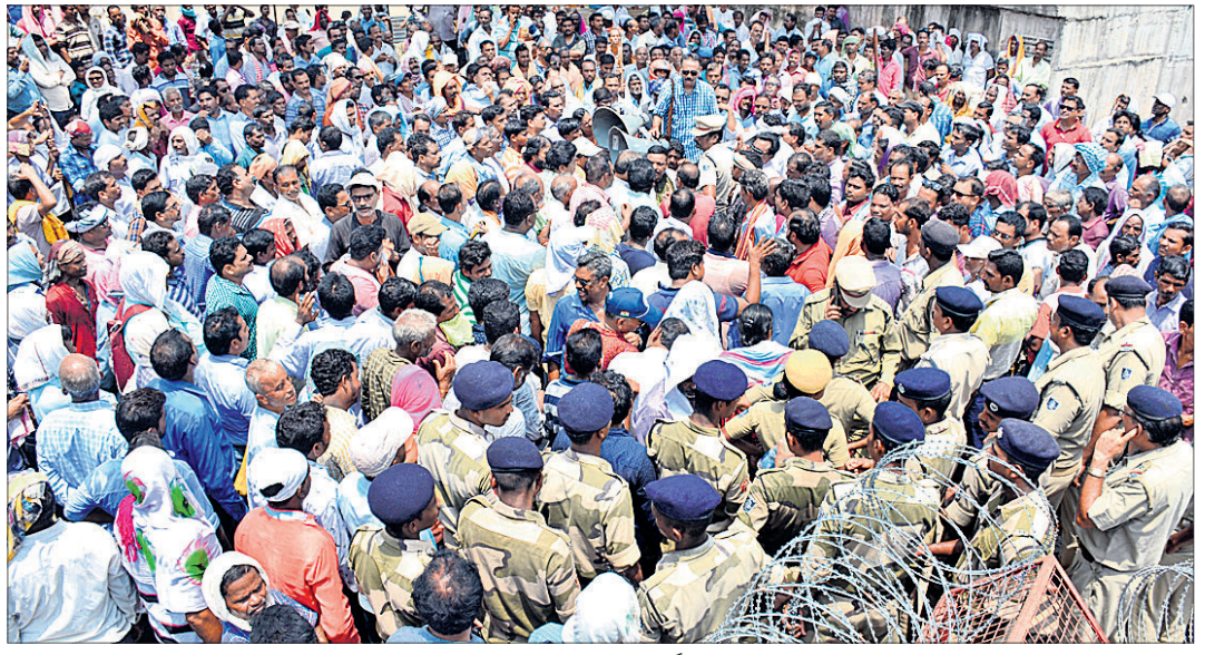
ରୁଧିରୀ ସମ୍ବଲପୁର ଜିଲ୍ଲାପାଳ ଅଫିସ୍ ସମ୍ମୁଖରେ ଶତାଧିକ ଚାଷୀ ବିକ୍ଷୋଭ ପ୍ରଦର୍ଶନ କରୁଛନ୍ତି।

ସମ୍ବଲପୁର, ୧୭/୭ (ବ୍ୟୁରୋ) ବାମା କମ୍ପାନୀ, ରାଜସ୍ୱ ବିଭାଗ, ପରିସଂଖ୍ୟାନ ବିଭାଗ ପକ୍ଷରୁ ୨୦୧୮ ଖରିଫ ରତ୍ନ ପଦକ୍ଷେପ ଆକଳନ କରାଯାଇଛି। ହେଲେ ଆଜି ପର୍ଯ୍ୟନ୍ତ ବାମା ଟଙ୍କା ଦିଆଯାଇ ନାହିଁ। ଅନ୍ୟପଟେ ଇନ୍ଦ୍ରପୁଟ୍ ସର୍ବସିଡି ବାଦରେ ଟଙ୍କା ଆସିଛି। ହେଲେ ଚାଷୀଙ୍କୁ ଏହା ମିଳିପାରି ନାହିଁ। ୨୦୧୯ ରବି ରତ୍ନରେ ଜିଲ୍ଲାରେ ଚାଷୀ ପ୍ରାୟ ୧୦ ହଜାର କୁଳଖିଲ ଧାନ ବିକ୍ରି କରି ପାରିନାହାନ୍ତି। ସେହିପରି ଧରଣର ୬୬୫ କୁଳଖିଲ ଧାନ ବିକ୍ରିର ପ୍ରାପ୍ୟ ଟଙ୍କା ଚାଷୀଙ୍କୁ ମିଳିନାହିଁ। ରାଜ୍ୟ ସରକାର ପି- ପାଏ ବନ୍ଦ କରି ଦେଇଥିବାରୁ ଏହି ସମସ୍ୟା ହୋଇଛି। ଖୁବ ଶୀଘ୍ର ଏହାର ସମାଧାନ କରାଯାଉ । ନ ହେଲେ ଆଗାମୀ ଦିନରେ ରାଜ୍ୟ ସରକାର ଓ ଜିଲ୍ଲା ପ୍ରଶାସନ ପରିଶାମ ଭୋଗିବ। ବ୍ୟବସାୟ ଚାଷୀମାନେ ସମ୍ବଲପୁର ଜିଲ୍ଲାପାଳଙ୍କ ଅଫିସ୍ ସମ୍ମୁଖରେ ବିକ୍ଷୋଭ ପ୍ରଦର୍ଶନବେଳେ ଏଭଳି ଚେତାବନା ଦେଇଛନ୍ତି।