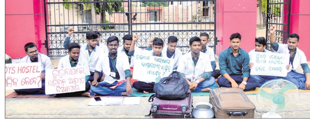
ଛାତ୍ରୀମାନେ କଲେଜ ପାଟକ ସମ୍ମୁଖରେ ଧାରଣା ଦେଇଛନ୍ତି ।

ମହାରାଜା କୃଷ୍ଣଚନ୍ଦ୍ର ଗଜପତି ଭେଷଜ ମହାବିଦ୍ୟାଳୟ ଓ ଚିକିତ୍ସାଳୟ ପରିସରରେ ଥିବା ସରକାରୀ ସେବା (ନର୍ସିଂ) ମହାବିଦ୍ୟାଳୟର ଛାତ୍ରୀଙ୍କୁ ରହିବାକୁ ଅନୁମତି ପ୍ରଦାନ କରାଯାଉ ନାହିଁ ।