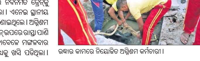
ଉଦ୍ଧାର କାମରେ ନିଯୋଜିତ ଅଗ୍ନିଶମ କର୍ମୀମାନେ ।

ଦିଗପହଣ୍ଡି, ୧୭/୭(ଡି.ଏନ.ଏ.): ଦିଗପହଣ୍ଡି ଏନଏ ସି ୧୨ ନଂ. ୱାର୍ଡ ନଂ.୫ର ପ୍ରଥମ ଲେନରେ ନବନିର୍ମିତ ଡ୍ରେନ୍‌କୁ ବୁଧବାର ସକାଳେ ଏକ କଣ୍ଟ୍ରିମେଣ୍ଟ ପଡ଼ିଥିଲା । ଏନେଇ ଘାତୀୟ ଲୋକେ ଅଗ୍ନିଶମ ବାହିନୀକୁ ଫୋନ କରି ଜଣାଇଥିଲେ । ଅଗ୍ନିଶମ ବାହିନୀ ପହଞ୍ଚିବାପରେ କଣ୍ଟ୍ରିମେଣ୍ଟ ଉଦ୍ଧାର କରିଛି । ଡ୍ରେନ୍ ଉପରେ ରାସ୍ତା ପାଖି ଯିବାପାଇଁ ଗୋଟିଏ ସ୍ୱାଦ ଛତା ଯାଇଥିବାବେଳେ ମଙ୍ଗଳବାର ଦିନରେ ଭାରତୀୟ ସଶସ୍ତ୍ର ଉଚ୍ଚ ଗର୍ଭ ମଧ୍ୟକୁ ଖସି ପଡ଼ିଥିଲା ।