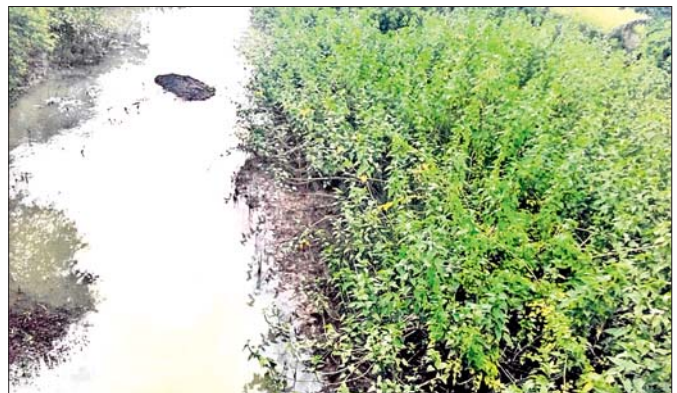
କପାଳୀ ନଦୀ ଗର୍ଭ କଳମ ଗଛରେ ଭରି ହୋଇଛି।

ବନ୍ଧ, ୧୭୭୭(ସ.ପ୍ର.) ଭଦ୍ରକ ଜିଲ୍ଲା ବନ୍ଧ ବ୍ଲକ୍ ଦେଇ ସାଳନ୍ଦା, କପାଳୀ ଓ ସରୁସାଗର ନଦୀ ପ୍ରବାହିତ । ସାଳନ୍ଦାକୁ ବାଦ୍ ଦେଲେ ସରୁସାଗର ଓ କପାଳୀକୁ ସରକାରୀ ଖାତା ଓ ମାନଚିତ୍ରରେ ଏ ଯାଏ ନଦୀର ମାନ୍ୟତା ମିଳିନାହିଁ । ଏହି ଦୁଇ ନଦୀର ଶଯ୍ୟା ଅନେକ ସ୍ଥାନରେ ବଳଭରଣ ହୋଇ ପୋତି ପଡ଼ିଥିବାବୁ ମୁଖ୍ୟ ପ୍ରତିବର୍ଷ ଲଗାଣବର୍ଷରେ ନଦୀକୂଳିଆ ଅଞ୍ଚଳବାସୀ ବନ୍ୟା ପରିସ୍ଥିତିକୁ ସାମ୍ନା କରୁଛନ୍ତି। କପାଳୀ ନଦୀର ବନ୍ୟାଜଳ ଚାଷ ଜମିରେ ମାତି ଅଧିକ କ୍ଷୟକ୍ଷତି ଘଟାଇଛି। ସରକାରୀ ଭାବେ ଏହାକୁ ନଦୀର ମାନ୍ୟତା ମିଳି ନ ଥିବାରୁ କ୍ଷତିଗ୍ରସ୍ତ ଚାଷୀମାନେ ସରକାରୀ ସହାୟତା ପାଇବାକୁ ବଞ୍ଚିତ ହେଉଛନ୍ତି। ଲମ୍ବୁଚାପଜନିତ ବର୍ଷା ପ୍ରଭାବରେ ମଧ୍ୟ ନଦୀରେ ବନ୍ୟାଜଳ ଆସି ଚାଷଜମିର ଫସଲ ଉଚ୍ଚାଡ଼ି ଦେଉଛି। ଅନୁରୂପ ସରୁସାଗର ନଦୀ ଏହାର ତଟବର୍ତ୍ତୀ ଲୋକଙ୍କ ଲାଗି ଦୁଃଖ ପାଳୁଛି। ୨୦୧୮ରେ ଲୁଗାପା ବର୍ଷା