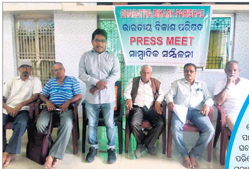
ଖବରଦାତା ସମ୍ମିଳନୀରେ ପରିଷଦର କର୍ମକର୍ତ୍ତା ।

ବ୍ରହ୍ମପୁର ଖଲିକୋଟ କ୍ଲଷ୍ଟର ବିଶ୍ୱବିଦ୍ୟାଳୟକୁ ବ୍ରହ୍ମପୁର ଉପକଣ୍ଠ ଉପାଳୟ ନିକଟରେ ବସାଇ ଦେବା ପାଇଁ କଲ୍ୟାଣମଣ୍ଡପ ପ୍ରତିଷ୍ଠାପକମାନେ ପ୍ରତ୍ୟେକ ପଦକ୍ଷେପ ଗ୍ରହଣ କରିବାକୁ ପ୍ରସ୍ତୁତ ଅଟନ୍ତି । ଏହି ପଦକ୍ଷେପ ଗ୍ରହଣ କରିବା ପାଇଁ କଲ୍ୟାଣମଣ୍ଡପ ପ୍ରତିଷ୍ଠାପକମାନେ ପ୍ରତ୍ୟେକ ପଦକ୍ଷେପ ଗ୍ରହଣ କରିବାକୁ ପ୍ରସ୍ତୁତ ଅଟନ୍ତି । ଏହି ପଦକ୍ଷେପ ଗ୍ରହଣ କରିବା ପାଇଁ କଲ୍ୟାଣମଣ୍ଡପ ପ୍ରତିଷ୍ଠାପକମାନେ ପ୍ରତ୍ୟେକ ପଦକ୍ଷେପ ଗ୍ରହଣ କରିବାକୁ ପ୍ରସ୍ତୁତ ଅଟନ୍ତି ।