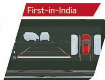
360° View Camera with Blind View Monitor (BVM)