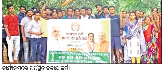
କାର୍ଯ୍ୟକ୍ରମରେ ଉପସ୍ଥିତ ଦକାଉ କର୍ମୀ ।

କରିଥିଲେ । ଭାଜପା ସଙ୍ଗଠନ କିପରି ସୁଚଳୁ ହୋଇଛି ଏବଂ ଦେଶରେ ଦଳର ସଦସ୍ୟତା କିପରି ବୃଦ୍ଧି ପାଇଛି ସେ ସମ୍ପର୍କରେ କହିଥିଲେ । କାର୍ଯ୍ୟକ୍ରମରେ ୭୦ଜଣ ସଦସ୍ୟତା ଗ୍ରହଣ କରିଥିଲେ । ଭାଜପା ମହିଳା ମୋର୍ଚ୍ଚା ସାଧାରଣ ସମାଜରୁ ଅଧିକ ପ୍ରାଧିକାରୀ, ମହିଳା ମୋର୍ଚ୍ଚା ଅନୁଷ୍ଠିତ କାର୍ଯ୍ୟକ୍ରମରେ ଦକାଉ କର୍ମୀମାନେ ଯୋଗ ଦେଇ ନୂତନ ଭାବେ ସଦସ୍ୟତା ଗ୍ରହଣ କରିଥିବା ଲୋକଙ୍କୁ ଉଦ୍‌ଘାଟନ କରିଥିଲେ । ଭାଜପା ସଙ୍ଗଠନ କିପରି ସୁଚଳୁ ହୋଇଛି ଏବଂ ଦେଶରେ ଦଳର ସଦସ୍ୟତା କିପରି ବୃଦ୍ଧି ପାଇଛି ସେ ସମ୍ପର୍କରେ କହିଥିଲେ । କାର୍ଯ୍ୟକ୍ରମରେ ୭୦ଜଣ ସଦସ୍ୟତା ଗ୍ରହଣ କରିଥିଲେ । ଭାଜପା ମହିଳା ମୋର୍ଚ୍ଚା ସାଧାରଣ ସମାଜରୁ ଅଧିକ ପ୍ରାଧିକାରୀ, ମହିଳା ମୋର୍ଚ୍ଚା ଅନୁଷ୍ଠିତ କାର୍ଯ୍ୟକ୍ରମରେ ଦକାଉ କର୍ମୀମାନେ ଯୋଗ ଦେଇ ନୂତନ ଭାବେ ସଦସ୍ୟତା ଗ୍ରହଣ କରିଥିବା ଲୋକଙ୍କୁ ଉଦ୍‌ଘାଟନ କରିଥିଲେ ।