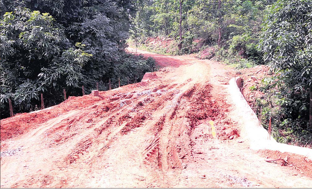
ମକକୁଟି ପୋଲ ଉପର କର୍ମମାତ୍ର ରାସ୍ତା ।

ବାରିଜବାଡ଼ି ବ୍ଲକରେ ମୋଟ ୨୫ ପଞ୍ଚାୟତ ରହିଥିବା ବେଳେ ଜନସଂଖ୍ୟା ୧ଲକ୍ଷ ୨୧ ହଜାରରୁ ଊର୍ଦ୍ଧ୍ୱ । ଏକାଧିକ ଗ୍ରାମ ସହ ବ୍ଲକ ମହକୁମାଠାରୁ ଦୂର ଉପଖଣ୍ଡ ସହ ଯୋଡ଼ିହେବା ଏବଂ ଲୋକଲୋଚନ ନାହିଁ ଯୋଗୁ ଉପାଦାନ ପ୍ରାପ୍ୟ ସହଜ ନୁହେଁ । ଧାନ ଚାଷ ନିର୍ମାଣ କାର୍ଯ୍ୟ ଯୋଗୁ ଅଞ୍ଚଳରେ ଅନେକ ସୁବିଧା ମିଳିଛି । ବିଭାଗୀୟ ଅଧିକାରୀ ତଦାରଖ କଲେ ନ ଥିବାରୁ ବହୁ କାର୍ଯ୍ୟ ନିମ୍ନମାନର ହେଉଛି । କାମ ସରିବାପରେ ବର୍ଷେ ନିମ୍ନରୁ ରାସ୍ତା ଦବି ଯାଉଛି ଓ ଆଉ କେଉଁଠି କଂକ୍ରିଟ୍ ରାସ୍ତାରେ ଫାଟ ହେଉଛି । ଏଭଳି ଅଭିଯୋଗ ହୋଇଛି କିମ୍ପୂଟି ପଞ୍ଚାୟତର କୁମ୍ଭାରମୁଣ୍ଡା ଠାରୁ ପର୍ଯ୍ୟନ୍ତ ପଞ୍ଚାୟତର ସୁଜାମାକୁ ରାସ୍ତା ନିର୍ମାଣ କାମରେ । ସୁଜାମାକୁ ଠାରୁ କାଡ଼ିପାଳା ମଧ୍ୟରେ ଦୁଇଟି ପୋଲ ଉପରେ ସଂଯୋଗକାରଣ ରାସ୍ତା ଅତି ନିମ୍ନମାନର ହୋଇଛି । କାଡ଼ିପାଳା ପୋଲଠାରେ ସଂଯୋଗକାରଣ ରାସ୍ତାରେ କଂକ୍ରିଟ୍ ଭଲକରି କରାଯାଇ ପାରିବାରୁ କରାଯାଇଛି । କିନ୍ତୁ ଗାଡ଼ିଖାଲ ନିର୍ମାଣ କରାଯାଇନାହିଁ । ନିମ୍ନମାନର କାମ ଯୋଗୁ ମାଟି ଅଧିକିତା ସହ କଂକ୍ରିଟ୍ ରାସ୍ତା ମଝିରେ ଫାଟ ସୃଷ୍ଟି ହୋଇଛି । ଗାଁଲୋକେ ଏନେଇ