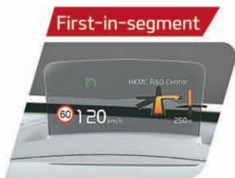
Smart 8.0 Head-up Display