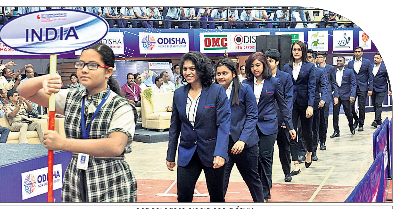
ଉଦଘାଟନା ଉତ୍ସବରେ ଭାରତୀୟ ଦଳର ମାର୍ଚ୍ଚପାଣ୍ଡୁ।