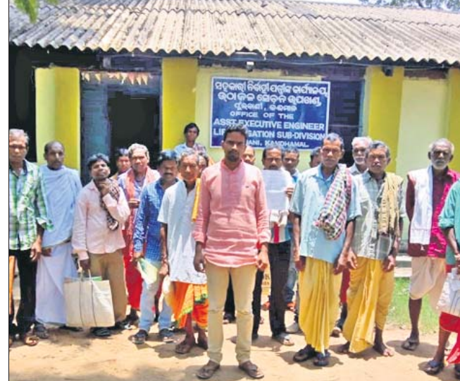
ତାଳୁକ୍ରୁ ଗ୍ରାମର ଚାଷୀମାନେ ।

ଫୁଲବାଣୀ ଉଠାକଳସେଚନ ଉପଖଣ୍ଡରେ କାମ ହେଉଥିବା ଉଠାକଳସେଚନ ପ୍ରକଳ୍ପ କାର୍ଯ୍ୟ ନିମ୍ନମାନର ହେଉଛି । ନିକଟରେ ଫୁଲବାଣୀ ବ୍ଲକ ତାଳୁକ୍ରୁଠାରେ ହୋଇଥିବା ନୂତନ ପ୍ରକଳ୍ପ କାର୍ଯ୍ୟ ସରିଥିଲେ ମଧ୍ୟ ନିମ୍ନମାନର ପାଇପ ଲାଗିଥିବାରୁ ତାହା ଫାଟି ଯାଇଛି । ଠିକାଦାର ଚାଷୀଙ୍କୁ ପ୍ରକଳ୍ପ ଘର ଅବା ମୋଟର ଲାଗିଥିବା ଘର ଚାପି ଦେଇ ନ ଥିବା ବେଳେ ଆଉ ସେଠାରୁ ଯାଉନାହିଁ । ବିଲ୍ କରି ଅର୍ଥ ଚଳୁ କରି ଦିଆଯାଇଛି । ପ୍ରକଳ୍ପ କାର୍ଯ୍ୟ ସାରି ଭୁବନେଶ୍ୱର ଚାପି ହସ୍ତାନ୍ତର କରିବା ଦାବିରେ ଗ୍ରାମବାସୀ ବୁଧବାର ବିଭାଗୀୟ ସହକାରୀ ନିର୍ବାହୀ ଯନ୍ତ୍ରୀଙ୍କୁ ଚାକ କାର୍ଯ୍ୟକ୍ରମରେ ଘେରିଛନ୍ତି । ପ୍ରତିଶ୍ରୁତି କାର୍ଯ୍ୟକାରୀ ନ ହେଲେ ଜିଲ୍ଲାପାଳଙ୍କ କାର୍ଯ୍ୟକ୍ରମ ସମ୍ମୁଖରେ ଧାରଣା ଦିଆଯିବ ବୋଲି ଗ୍ରାମବାସୀ ତେଜାବତୀ କେହିଛନ୍ତି ।