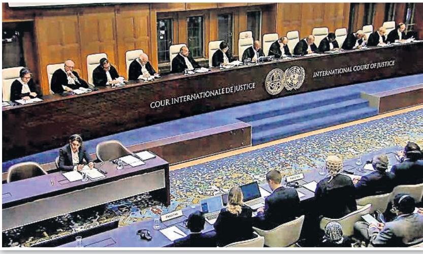
ହେଉଥିବା ଅନ୍ତର୍ଜାତୀୟ ଅଦାଲତରେ କୁଳଭୃତ୍ୟ ମାମଲାର ରାୟ ପ୍ରକାଶ ପାଇବାବେଳେ ବିଚାରପତି ଦ୍ୱୟ।