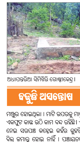
ଅଧ୍ୟାପକର ଅଧିକାରୀ ସିପିଆ ଗୋଷ୍ଠୀକେନ୍ଦ୍ର ।

ପିରିଙ୍ଗିଆ, ୧୭/୭ କକ୍ଷମାଳ ଜିଲ୍ଲା ପିରିଙ୍ଗିଆ ବ୍ଲକ ଡିଭିଜନ ଗାଁ ପଞ୍ଚାୟତ ସିପିଆରେ ଗାଁରେ ଆମ ଗାଁ ଆମ ବିକାଶ ଯୋଜନାରେ ନିର୍ମାଣ ହେଉଥିବା ପ୍ରକଳ୍ପ ଅଧ୍ୟାପକର ଅଧିକାରୀ ଭାବେ ପଡ଼ିବୁଛି । ଚଳିତ ସାଧାରଣ ନିର୍ବାଚନରେ ପ୍ରମୁଖମନ୍ତ୍ରୀ କକ୍ଷମାଳ ଜିଲ୍ଲା ଗପ୍ତରେ ଆସି ଏସବୁ କାର୍ଯ୍ୟ ଶୀଘ୍ର ସାରିବାକୁ ନିର୍ଦ୍ଦେଶ ଦେଇଥିଲେ । ନିର୍ଦ୍ଦେଶ ପରେ ମଧ୍ୟ କାମ ଶେଷ ହୋଇନାହିଁ । ଅନେକ କାର୍ଯ୍ୟ ଆଜି ବି ଅଧ୍ୟାପକ ପଡ଼ିବୁଛି । ପିରିଙ୍ଗିଆ ବ୍ଲକ ସଦର ମହକୁମା ଠାରୁ ୧୩ କିମି ଦୂର ଥିବା ପଞ୍ଚାୟତ ସଦର ମହକୁମାରୁ ୧୦ କିମି ଦୂରରେ ରହିଛି ସିପିଆ ଗାଁ । ଏହି ଗ୍ରାମରେ ଗୋଟିଏ କେନ୍ଦ୍ର ପାଇଁ ୨ ଲକ୍ଷ ଟଙ୍କା