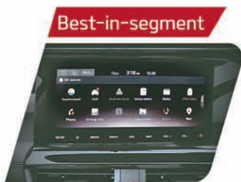
10.25 HD Touchscreen Navigation