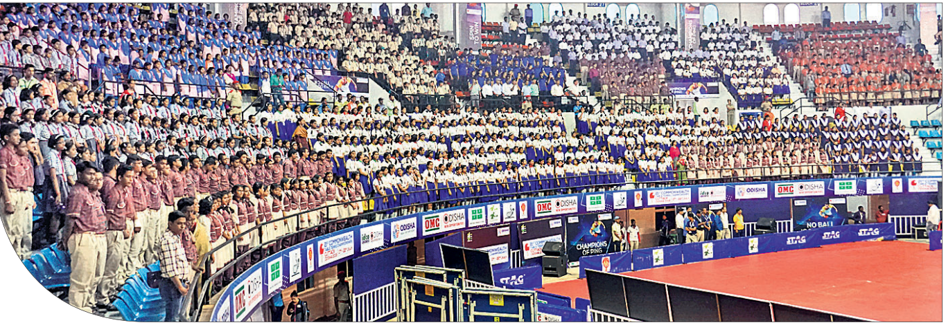
ଜବାହରଲାଲ ନେହେରୁ ଇନ୍ଡୋର ଷ୍ଟାଡିୟମର ବିଭିନ୍ନ କୁଳରେ ହାତୁଡ଼ାହାତୁଡ଼ାମାନେ ଖେଳ ଉପଭୋଗ କରୁଛନ୍ତି।