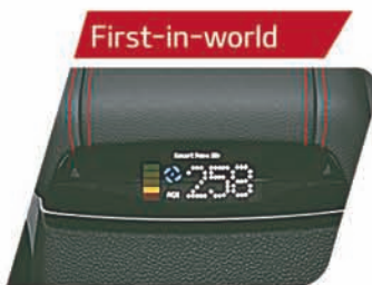
Smart Pure Air Purifier with UVO Controls