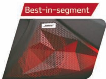
BOSE Premium 8-speaker Music System with LED Sound Mood Lights