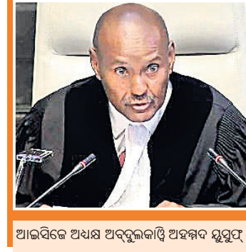
ଆଇସିଜେ ଅଧ୍ୟକ୍ଷ ଅବଦୁଲକାଦି ଅହମଦ ମୁସ୍ତଫ