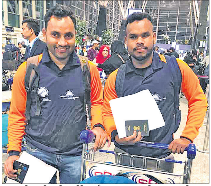
ଜାମାଜକା ବିପକ୍ଷ ଦୁଇଜଣ କ୍ରିକେଟ ସିନ ବୋଲି ଭାରତୀୟ ଦଳରେ ସାମିଲ ହୋଇଥିବା ଓଡ଼ିଶାର ବୁଲ୍ କ୍ରିକେଟର ଜାମାଜକା ଓ ପଙ୍କଜ କୁଏ।