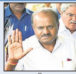
ପୁଷ୍ପାମନୁ ଏସ୍ପି. କୁମାରସାମୀ

ଘଡ଼ିକେ ଘୋଡ଼ା ଛୁଇଁଲା। କର୍ମାଚକ ରାଜନୀତିର ପାଣି କେତେବେଳେ କେଉଁ ଆଡ଼କୁ ବହିବ କିଛି କହି ହେଉନାହିଁ। ୧୬ ବିଦ୍ରୋହୀ ବିଧାୟକଙ୍କ ଲଘୁପୀ ପୁଷ୍ପାମନୁ ଏସ୍ପି. କୁମାରସାମୀଙ୍କ ନେତୃତ୍ୱାଧୀନ ସରକାରଙ୍କୁ ସଂଖ୍ୟାଳଘୁରେ ପରିଣତ କରି ରାଜ୍ୟରେ ରାଜନୈତିକ ସଙ୍କଟ ସୃଷ୍ଟି କରିଛି। ଏଥିପାଇଁ ବିଧାନସଭାରେ ଗୁରୁବାର ଆସ୍ଥାଭୋଟ ହେବାକୁ ଥିବାବେଳେ ଦେଖିବାକୁ ମିଳିଥିଲା ସ୍ତରାଣୀ। ଏଥିରେ ସାମିଲ ହୋଇଥିଲେ ଉଭୟ ଶାସକ ଧର୍ମନିରପେକ୍ଷ ଜନତା ଦଳ (ଜେଡିଏସ୍)-କଂଗ୍ରେସ ମେଣ୍ଟ ଏବଂ ବିରୋଧୀ ଭାଜପା ବିଧାୟକମାନେ। ଫଳରେ ଗୁରୁବାରୀୟ ବାଧାପ୍ରାପ୍ତ ହୋଇଥିଲା। ସେପଟେ ଭାଜପା ନେତାମାନେ ରାଜ୍ୟପାଳ ଭଜପାଙ୍କୁ ଭାଜପାକୁ ଭେଦି ହସ୍ତକ୍ଷେପ କୋଡ଼ିଥିଲେ। ଗୁରୁବାର ହିଁ ଶକ୍ତିପ୍ରଦାୟୀ କରାଯାଇ ଲାଗି ବାଚସ୍ପତି କେ.ଆର୍. ରମେଶ କୁମାରଙ୍କୁ ରାଜ୍ୟପାଳ ନିର୍ଦ୍ଦେଶ ଦେଇଥିଲେ। ହେଲେ ବିଧାନସଭାରେ ହତବୋଧ ଓ ଅତର୍କିତ ଭାଜପା ଆକଳନ ବାଚସ୍ପତି ଗୁରୁବାର ଦିନକ ପାଇଁ ପୂଲତବୀ ଘୋଷଣା କଲେ। ଏହାର ପ୍ରତିବାଦରେ ବିରୋଧୀ ଦଳ ନେତା ବି.ଏସ୍. ଯେତୁରସ୍ୱାଳ ସମେତ ଭାଜପା ବିଧାୟକମାନେ