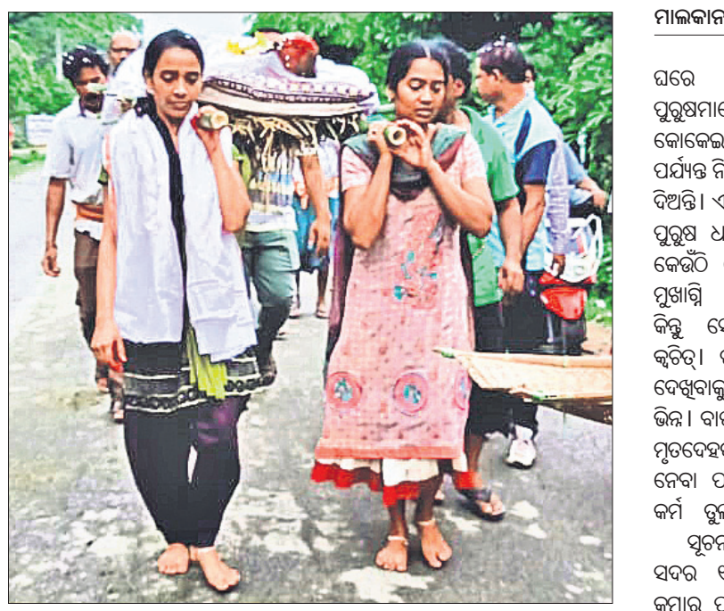
ବାପାଙ୍କ ମୃତଦେହକୁ ଝିଅମାନେ କାନ୍ଦେଇ ନେଉଛନ୍ତି।