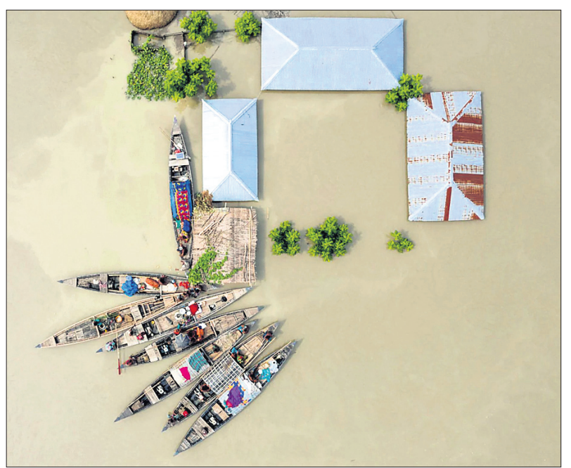
ବାଲୁଆଦେଶର କୁରିଗ୍ରାମ ଜିଲ୍ଲାରେ ବନ୍ୟାରେ ଜଳମଗ୍ନ ଘର ଓ ଗାଈକମିର ଆକାଶମାର୍ଗରୁ ଦୃଶ୍ୟ।

ନୂଆଦିଲ୍ଲୀ, ୧୮୭(ପି.ବି.): କୁଳଭୃଗୁ ଯାଦବଙ୍କ ମୃତ୍ୟୁବନ୍ଧୁଦେଶର ସମାଧି କରିବା ଲାଗି ଅନ୍ତର୍ଜାତୀୟ ନ୍ୟାୟିକ ଅଦାଲତ (ଆଇସିଜେ) ପାକିସ୍ତାନକୁ ନିର୍ଦ୍ଦେଶ ଦେବାର ଦିନକ ପରେ ଇସ୍ଲାମାବାଦ ଚାଲୁ ଚଳୁଥିବା ମୁକ୍ତକରୁ ବୋଲି ଗୁରୁବାର ଭାରତ ପକ୍ଷରୁ ଘାଟି କରାଯାଇଛି। ଏହି ପୂର୍ବତନ ନୌସେନା ଅଧିକାରୀଙ୍କୁ ଫେରାର ଆଣିବା ଲାଗି ଭାରତ ଚାଲି ଉପମାନ ଲାଗି ରଖିବ ବୋଲି ପାକିସ୍ତାନରେ ଉଭୟ ଗୃହରେ ବହିଷ୍କାର ପାଣି ଏସ୍. ଜୟଶଙ୍କର କହିଛନ୍ତି।