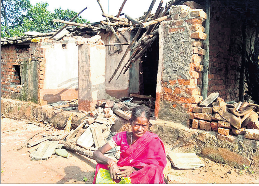
ହାତୀ ଉପଦ୍ରବରେ ଭାଙ୍ଗିଥିବା ଘର ଆଗରେ ଜଣେ ମହିଳା ବସିଛନ୍ତି।