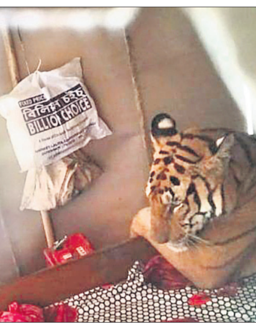
ଆସାମର କାଜିରାଜା ଜାତୀୟ ଉଦ୍ୟାନ ବନ୍ୟାଜଳରେ ବୁଡ଼ିଯାଇଥିବାବେଳେ ପ୍ରାଣ ବିକଳରେ ଏକ ଘରେ ଆଶ୍ରୟ ନେଇଛି ବାପ।