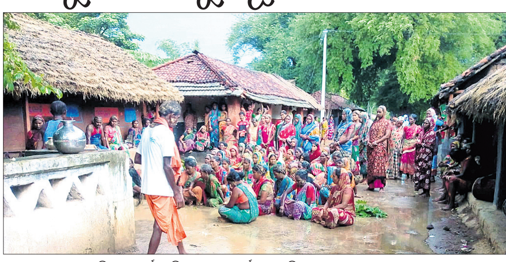
ମହାବୀରା ଠାକୁରାଣୀଙ୍କ ନିକଟରେ ବର୍ଷା ଲାଗି ଗ୍ରାମବାସୀ ପୂଜାର୍ଚ୍ଚନା କରୁଛନ୍ତି।