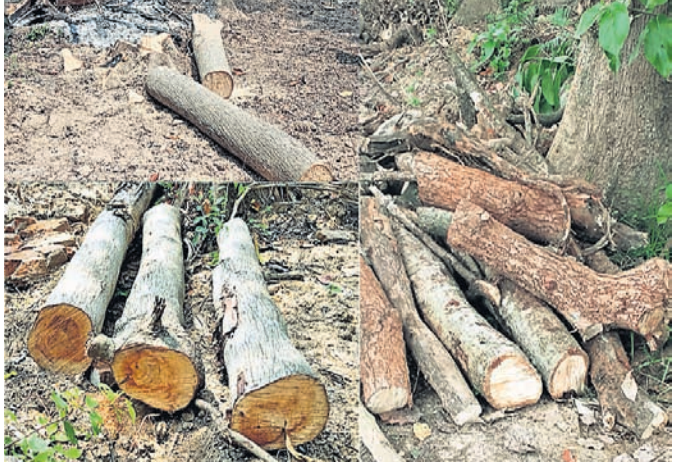
ବାଲେଶ୍ଵର ଜଳସେଚନ ବିଭାଗ ମୁଖ୍ୟକାର୍ଯ୍ୟାଳୟ ପରିସରରେ କଟା ହୋଇ ପଡ଼ିଥିବା ଗଛର ଗଣ୍ଠି।

ସହିତ ତାଳ ଓ ପତ୍ରକୁ ନିଆଁ ଲଗାଇ ପୋଡ଼ି ପ୍ରମାଣ ନଷ୍ଟ କରିବାକୁ ଚେଷ୍ଟା କରାଯାଉଥିବା ବିଭିନ୍ନ ମହଲରୁ ଅଭିଯୋଗ ହୋଇଥିଲା। ଏନେଇ ସମ୍ପୃକ୍ତ ବିଭାଗର ନିର୍ବାହୀମନ୍ତ୍ରୀ ଦାୟିତ୍ଵରେ ଥିବା ଅର୍ଥସ୍ତ୍ରାଣ ସାହୁଙ୍କୁ ପଚରାଯିବାରୁ ସେ କହିଛନ୍ତି ଯେ, ଉକ୍ତ ପୋଖରୀ ଗରୀପାଞ୍ଚ ବଣଜଙ୍ଗଲରେ ପରିପୁର୍ଣ୍ଣ ହୋଇଥିବାରୁ ସଫା କରିବା ପାଇଁ ଅର୍ଥସ୍ କର୍ମଚାରୀମାନଙ୍କୁ କୁହାଯାଇଥିଲା। ସେଥିପାଇଁ କୌଣସି ପ୍ରକଳ୍ପ କିମ୍ବା କାର୍ଯ୍ୟାଦେଶ କିମ୍ବା ବୁଦ୍ଧିମାତା ହୋଇ ନ ଥିଲା କି ଥିବା ଗଛଗୁଡ଼ିକ କଟାଯିବାର ନିଷ୍ପତ୍ତି ନିଆଯାଇ ନ ଥିଲା। ଗଛ କଟା ଯାଇଥିବା ବିଷୟରେ ତାଙ୍କୁ ଜଣା ନ ଥିବା ବେଳେ ବହୁଶୀଳ ପଦ୍ଧତି କରି ବିଭାଗୀୟ କାର୍ଯ୍ୟାନୁଷ୍ଠାନ ଗ୍ରହଣ କରାଯିବ। ଏ ସମ୍ପର୍କରେ ବନ ଅଧିକାରୀ