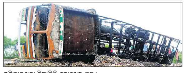
ଜଳିଯାଇଥିବା ଦିଆସିଲି ବୋଝେଇ ଟ୍ରକ୍। ଭଞ୍ଜାରିପୋଖରୀ, ୧୮୧୭ (ଡି.ଏନ.ଏ.)

ଭଦ୍ରକ ଜିଲ୍ଲା ଭଞ୍ଜାରିପୋଖରୀ ବ୍ଲକ୍ ୧୭ ନମ୍ବର ଛାତ୍ରୀୟ ରାଜପଥର ଛତାବର ଛକ ନିକଟରେ ଗୁରୁବାର ବିଳମ୍ବିତ ରାତିରେ ଏକ ଦିଆସିଲି ବୋଝେଇ ଟ୍ରକ୍ ଜଳିଯାଇଛି। ଗାଡ଼ି ଚାଳକ ଅଜ୍ଞତେ ରକ୍ଷା ପାଇଯାଇଛନ୍ତି। ଟ୍ରକ୍ (ନଂ.ଟିଏଏ ୫୨ ଡି ୪୭୭୭) ଦିଆସିଲି ବୋଝେଇ କରି ପାଣିକୋଇଲି ପରୁ ଭଦ୍ରକ ଆଡ଼କୁ ଆସୁଥିବା ବେଳେ ଅଗ୍ନିକାଣ୍ଡ ଘଟିଥିଲା। ସ୍ଥାନୀୟ ଲୋକେ, ପୋଲିସ୍ ଓ ଅଗ୍ନିଶମ କର୍ମଚାରୀ