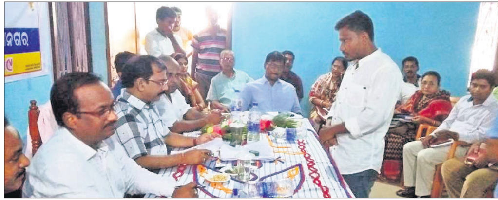
ଶିବିରରେ ଲୋକଙ୍କଠାରୁ ଅଭିଯୋଗପତ୍ର ଗ୍ରହଣ କରାଯାଉଛି।