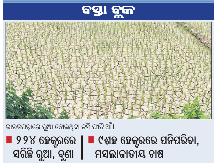
ରାଉତପଡ଼ାରେ ରୁଆ ହୋଇଥିବା ଜମି ଫାଟି ଥିଲା। ୨୨୪ ହେକ୍ଟରରେ ୯୩୯ ହେକ୍ଟରରେ ପରିପରିବା, ସରିଛି ରୁଆ, ବୁଣା ମସଲାଜାତୀୟ ଚାଷ