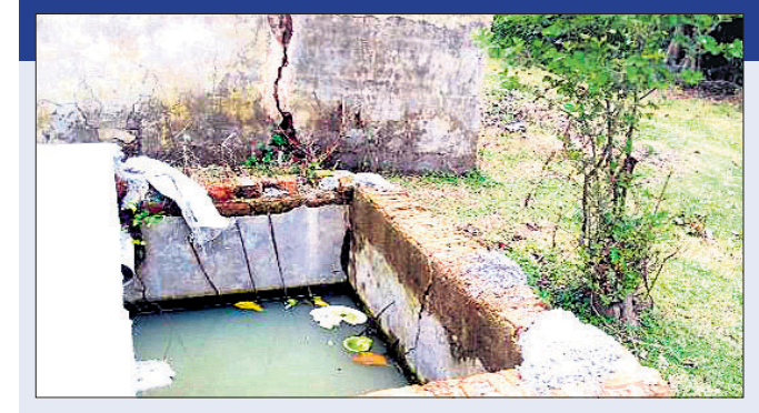
ଏକ ବିଦ୍ୟାଳୟରେ ଶୈତାଳୟ ଗଠନ ହୋଇଯାଇଛି।

କେନ୍ଦ୍ର ସରକାରଙ୍କ ସ୍ୱଚ୍ଛ ବିଦ୍ୟାଳୟ ଅଭିଯାନ ଯୋଜନା କାର୍ଯ୍ୟକାରୀ କରିଛନ୍ତି। ଏହି ଯୋଜନା ମାଧ୍ୟମରେ ବିଭିନ୍ନ ବିଦ୍ୟାଳୟରେ ଶୈତାଳୟ ନିର୍ମାଣର ବ୍ୟବସ୍ଥା କରାଯାଇଛି। ପୂର୍ବରୁ ରାଜ୍ୟ ସରକାରଙ୍କ ସର୍ବଶିକ୍ଷା ଅଭିଯାନ ମାଧ୍ୟମରେ ବିଭିନ୍ନ ବିଦ୍ୟାଳୟରେ ଶୈତାଳୟ ନିର୍ମାଣ କରାଯାଇଥିଲା। ବର୍ତ୍ତମାନ ପଞ୍ଚାୟତରାଜ ବିଭାଗ ଦ୍ୱାରା ସମସ୍ତ ପଞ୍ଚାୟତକୁ ନିର୍ମାଣ ଦାୟିତ୍ୱ ଦିଆଯାଇଛି। ହେଲେ ଭଦ୍ରକ ଜିଲ୍ଲା ବନ୍ତ ବ୍ଲକରେ ଅନେକ ବିଦ୍ୟାଳୟରେ ଶୈତାଳୟ ବ୍ୟବସ୍ଥା ନ ଥିବା ଦେଖିବାକୁ ମିଳିଛି। ପ୍ରକାଶ ଯେ, ଏହି ବ୍ଲକରେ ମୋଟ ୨୪୬ଟି ବିଦ୍ୟାଳୟ ରହିଛି। ସେଥିମଧ୍ୟରୁ ୨୨୪ ବିଦ୍ୟାଳୟରେ ଶୈତାଳୟ ବ୍ୟବସ୍ଥା ରହିଥିବା ବେଳେ ୨୨