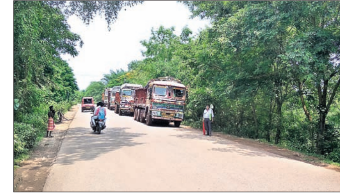
କାତାୟ ରାଜପଥରେ ଗାଡ଼ି ଗୁଡ଼ିକ ଯାତ୍ରା କରାଯାଉଛି।