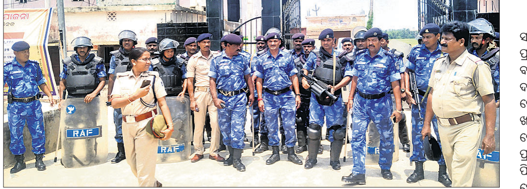
ରୁକ ପରିସରରେ ପୁଲ୍ ମାର୍ଚ୍ଚ କରି ଫେରୁଥିବା ରାପିଡ୍ ଆକ୍ସନ ଫୋର୍ସ।

ରୁକୁବାର ରତ୍ନାଥପୁର ରୁକ ଛକଠାରୁ ପଞ୍ଚାୟତ ସମିତି କାର୍ଯ୍ୟାଳୟ ପର୍ଯ୍ୟନ୍ତ ଆର୍ଏଏଫ୍ (ରାପିଡ୍ ଆକ୍ସନ ଫୋର୍ସ) ପକ୍ଷରୁ ଶାନ୍ତିଶୃଙ୍ଖଳା ରକ୍ଷା ପାଇଁ ପୁଲ୍ ମାର୍ଚ୍ଚ କରାଯାଇଛି।