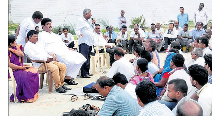
ଧାରଣାରେ ଉପସ୍ଥିତ ସମ୍ପ୍ରଦାୟ ନେତା ଓ ଜମିହରା ପରିବାର।

ଏବେକ ଅତିରିକ୍ତ ଜିଲାପାଳଙ୍କ କାର୍ଯ୍ୟାଳୟରେ ଡ଼ିଜିଟାଲ ଆଲୋଚନା ହୋଇଥିଲା। ଏଥିରେ ଜମି ହରାଇଥିବା ୧୭୫୨ ପରିବାରଙ୍କୁ ଶୁକ୍ରବାରଠାରୁ ବିଶୋଧନାଗାର କର୍ତ୍ତୃପକ୍ଷ ନିୟୁତ୍ତି କ୍ଷେତ୍ରରେ ସର୍ବାଧିକ ପ୍ରାଧାନ୍ୟ ଦେବେ ବୋଲି ନଷ୍ଟ ହୋଇଛି।