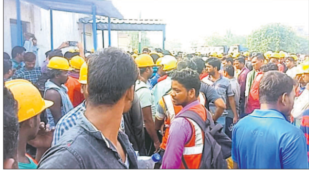
ଦୁର୍ଘଟଣା ପରେ ଶ୍ରମିକମାନେ ବିକ୍ଷୋଭ ପ୍ରଦର୍ଶନ କରୁଛନ୍ତି।