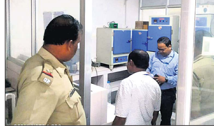
ଚିକିତ୍ସା ତହସିଲଦାର ପ୍ରଶାସନ ପକ୍ଷରୁ ପାଣି ପାଉଁର କରାଯାଇଛି।