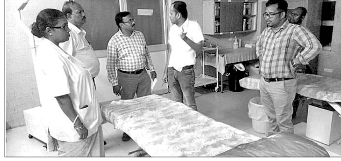
ରାଜ୍ୟ ଚିମ୍ ପରିଦର୍ଶନ କରୁଛନ୍ତି। ଏବଂ ଅନ୍ୟାନ୍ୟ ସୁଧା ସମ୍ପର୍କରେ ତଥ୍ୟ ସଂଗ୍ରହ କରିଥିଲେ।