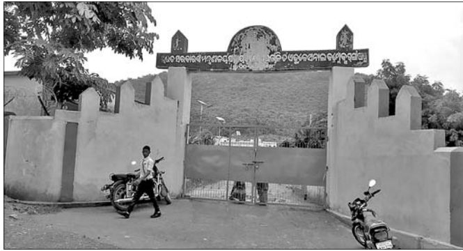
ଏକ୍ସଟେନ୍ସନ୍ କମ୍ପ୍ଲେକ୍ସ ମୁଖ୍ୟ ପାଟକରେ ଭିତରପଟୁ ଚାଲାଣ ପଡ଼ିଛି।

ରୁମୁଡ଼ିକଣ୍ଠ, ୧୯୩୭ (ଡି.ଏନ.ଏ.): କନ୍ଧମାଳ ଜିଲ୍ଲା ରୁମୁଡ଼ିକଣ୍ଠ ବ୍ଲକ୍ ବେଲପାଦର ରାଜାପାଲୁ ଏକ୍ସଟେନ୍ସନ୍ କମ୍ପ୍ଲେକ୍ସରେ ଜଣେ ଅସୁସ୍ଥ ଶ୍ରେଣୀ ଛାତ୍ରୀ ଗର୍ଭବତୀ ହେବା ଘଟଣାରେ ଅଭିଯୁକ୍ତ କୋର୍ଟ ଚାଲାଣ କରାଯାଇଛି।